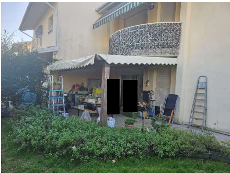
Lato nord - est