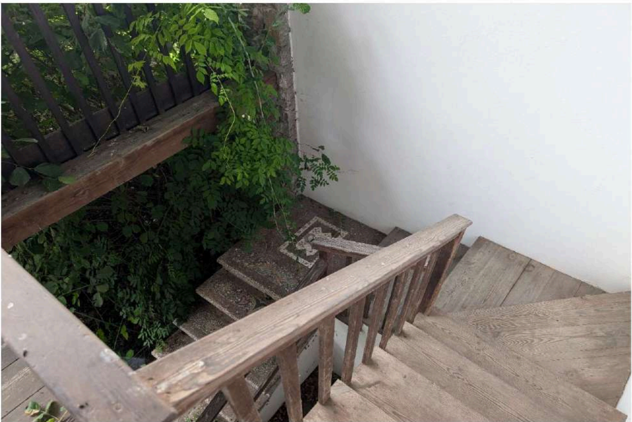
Foto n. 24 – Scala esterna in legno. In evidenza motivi in mosaico nella componente in muratura di pianerottolo e gradini.