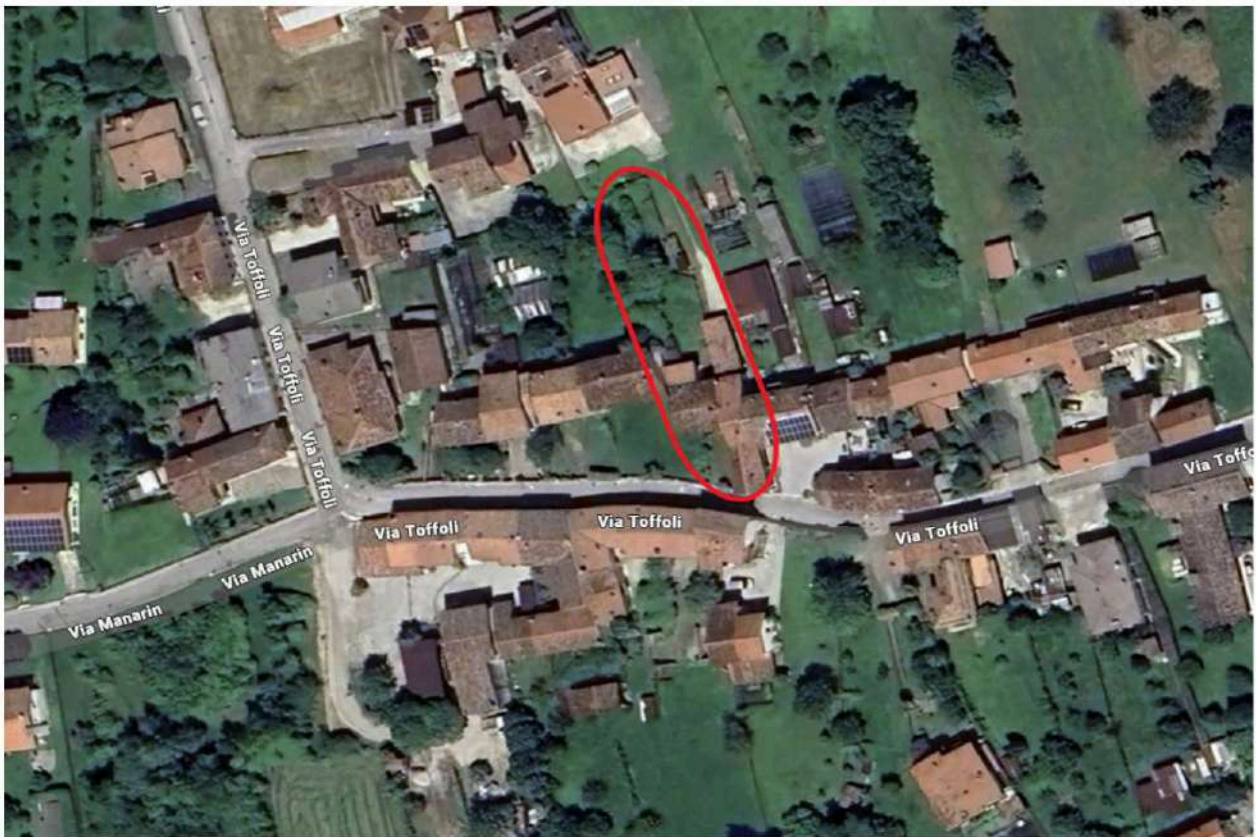
Foto n. II – Ambito nel quale sono inseriti i beni esegutati – cerchiato in rosso.