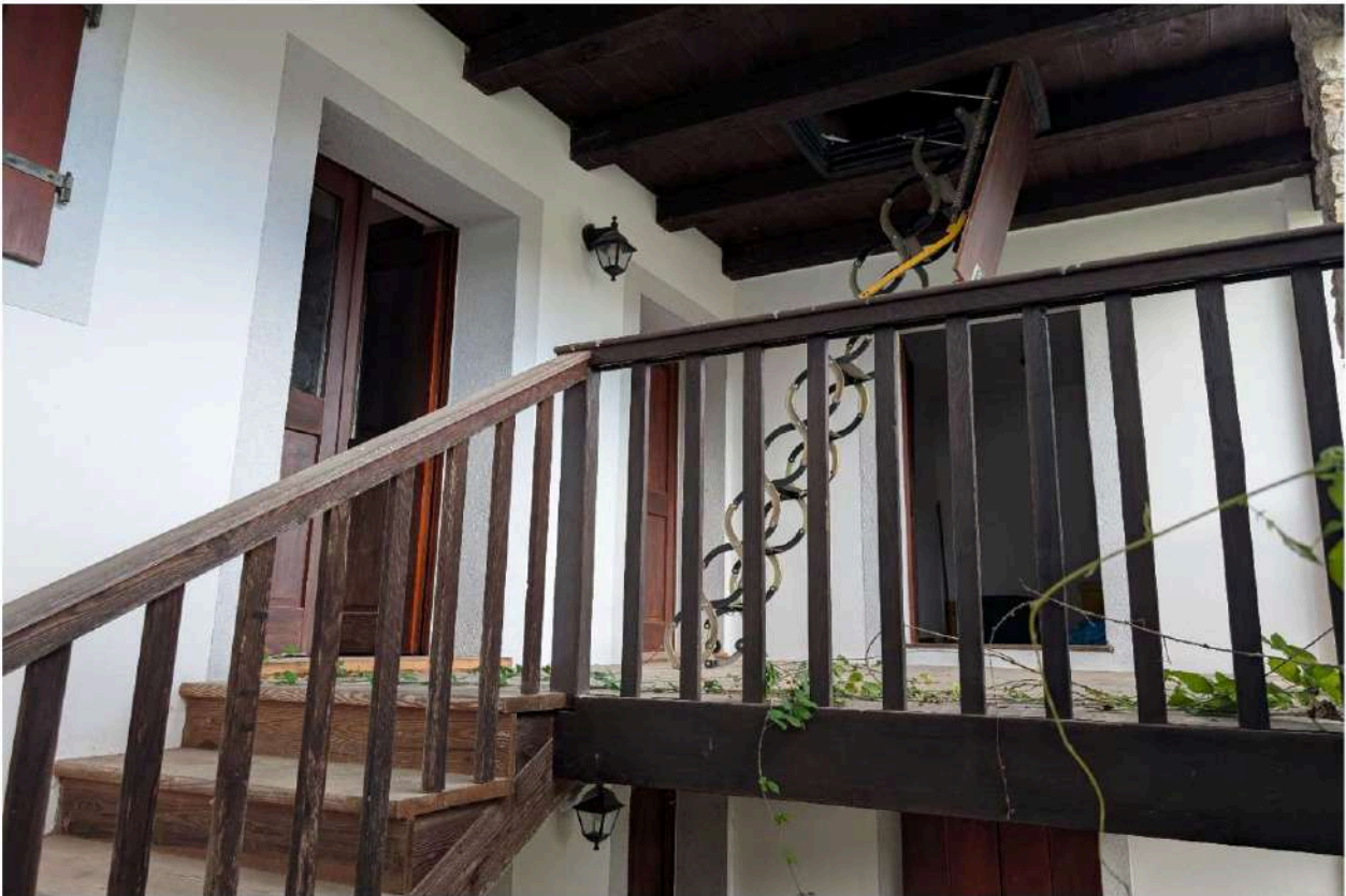
Foto n. 25 – Ballatoio al piano primo: in evidenza l'accesso principale al corridoio interno ed i due accessi alle stanze. In evidenza la scala a scomparsa per salire al ballatoio del sottotetto non abitabile.

DOC. FOTOGRAFICA – Beni in FANNA (PN) – via Toffoli n. 100.