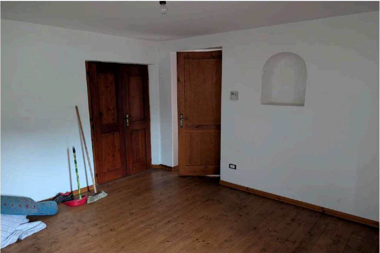
Foto n. 28 – Camera principale, con accesso dal ballatoio e dal corridoio interno.