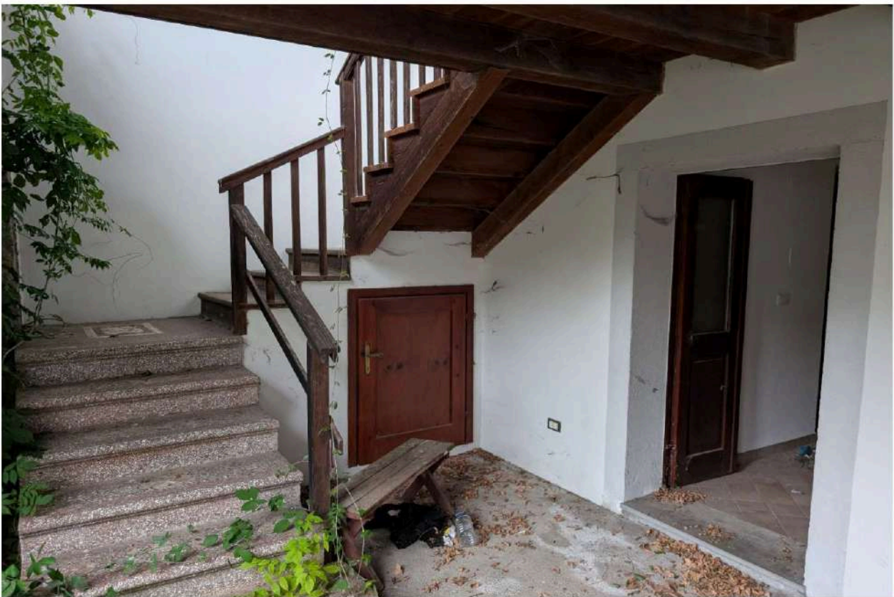
Foto n. 10 – Dettaglio ingresso principale al piano terra e rampa scale sul porticato. In evidenza piccolo ripostiglio sottoscala.