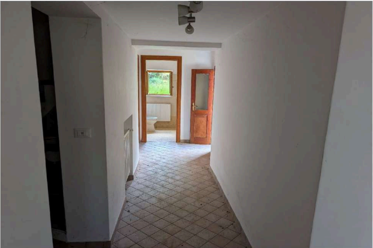
Foto n. 12 – Corridoio interno: in fondo il bagno e la lavanderia, con installata la caldaia. Sulla destra portoncino di accesso all'immobile dal retro.