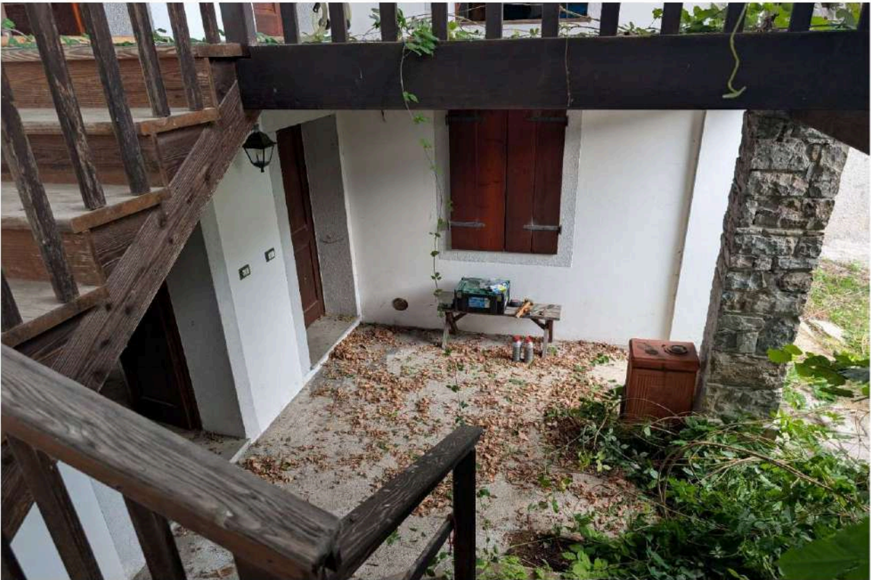
Foto n. 11 – Porticato: in evidenza i due accessi lato strada dal porticato piano terra.

DOC. FOTOGRAFICA – Beni in FANNA (PN) – via Toffoli n. 100.