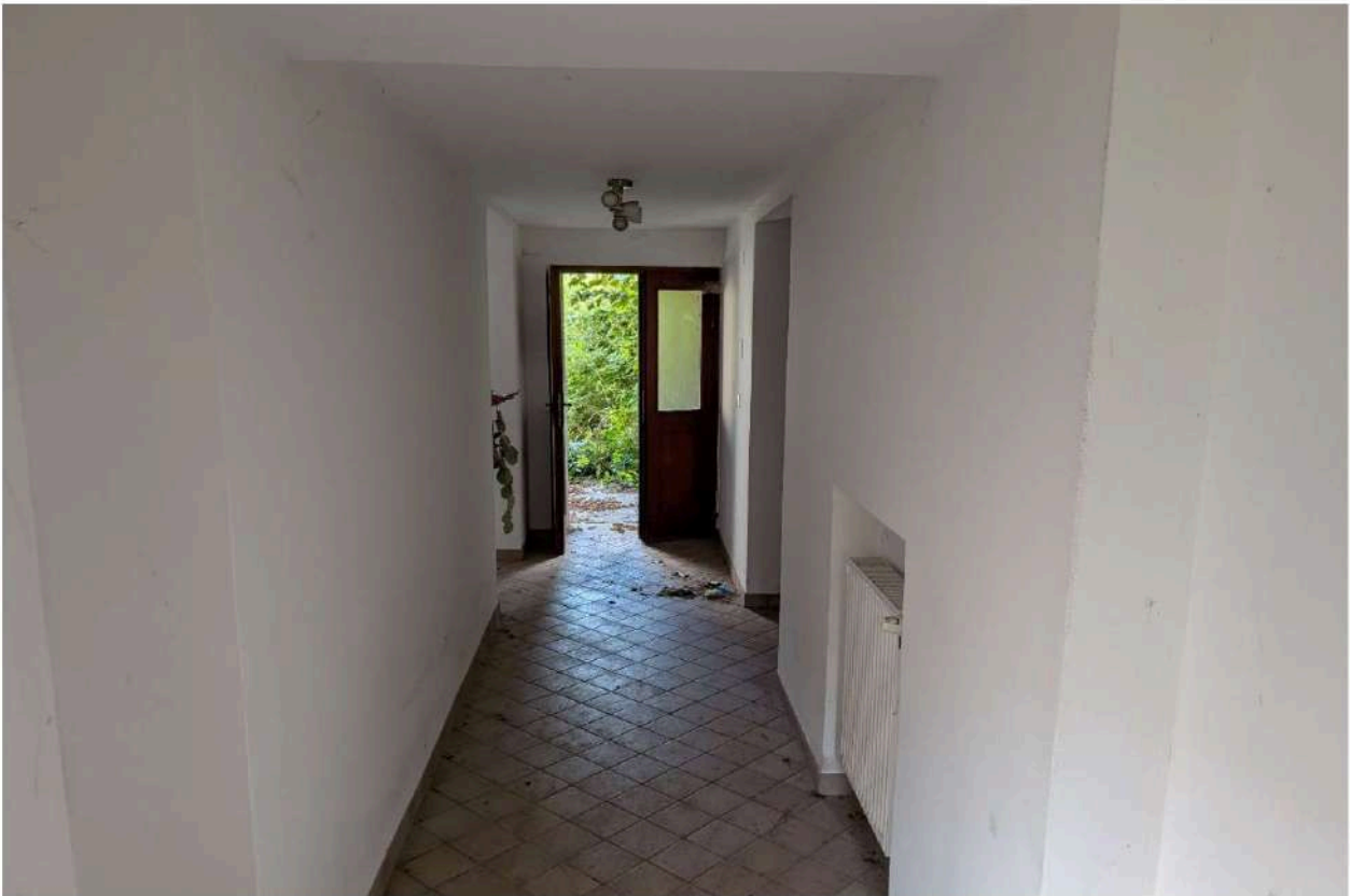
Foto n. 13 – Corridoio al piano terra: in fondo portoncino d'ingresso, sulla destra accesso al piano scale e a sinistra alla cucina.

DOC. FOTOGRAFICA – Beni in FANNA (PN) – via Toffoli n. 100.