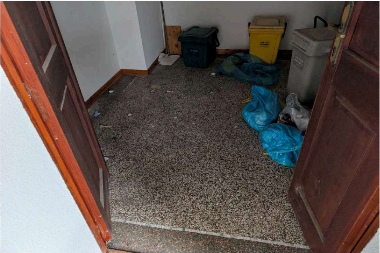
Foto n. 27 – Stanza con accesso diretto dal ballatoio al piano primo.

DOC. FOTOGRAFICA – Beni in FANNA (PN) – via Toffoli n. 100.