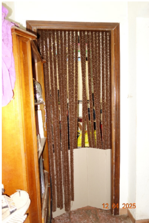
Foto 23 Ripostiglio