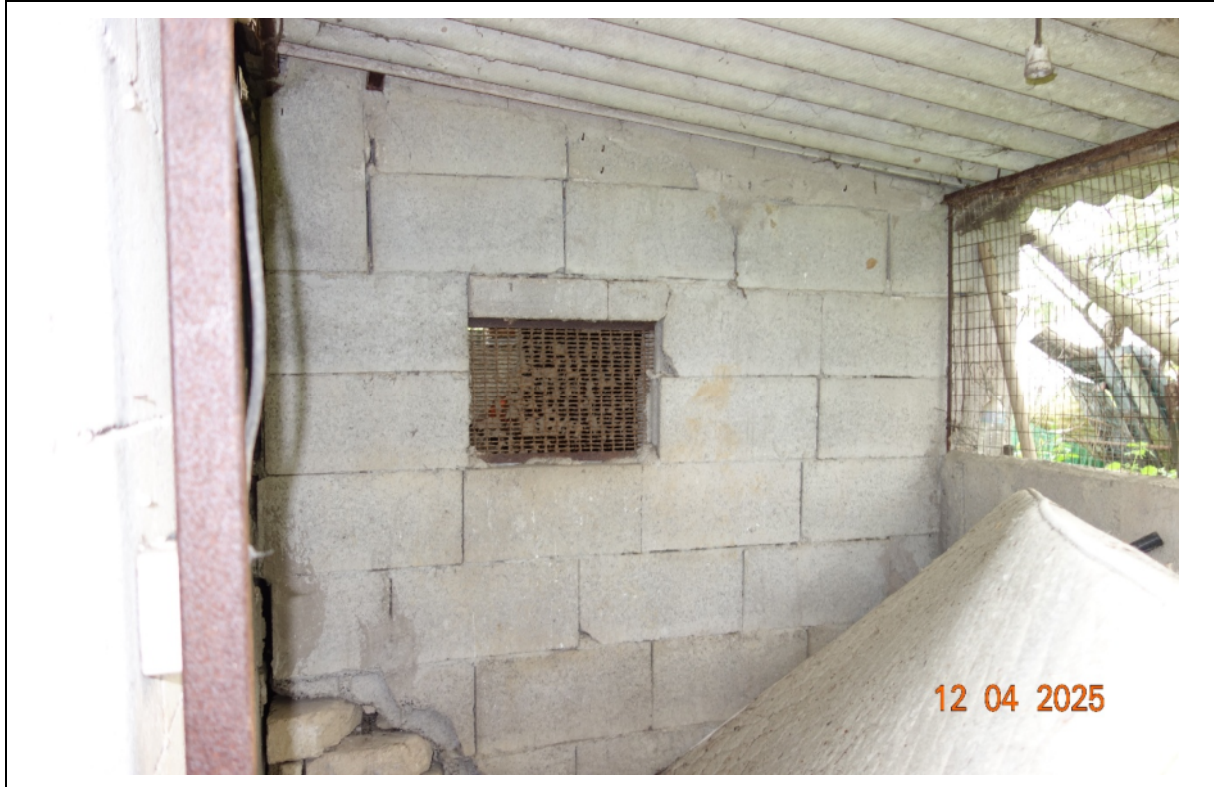
Foto 36 Tettoia posta sul retro del magazzino