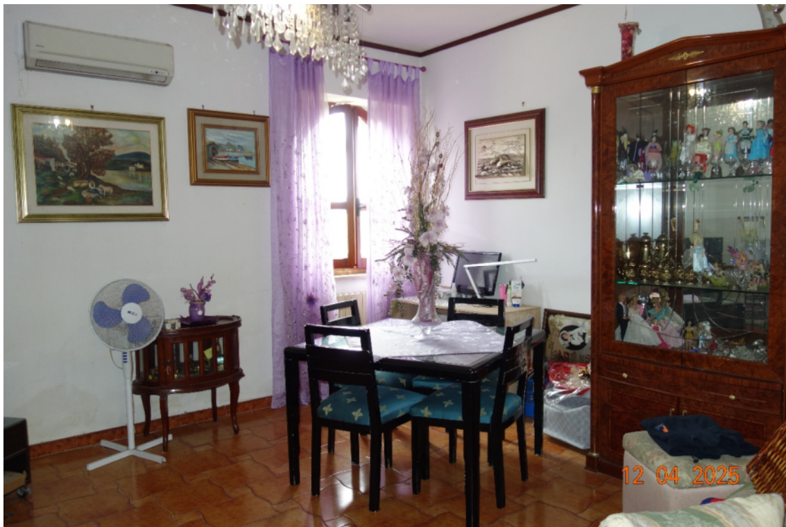
Foto 27 Soggiorno