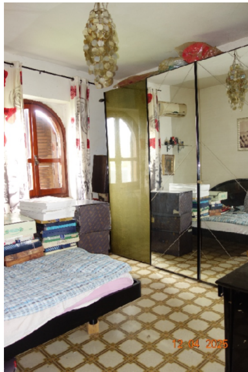
Foto 30 Stanza da letto matrimoniale