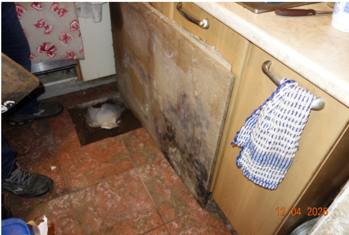
Foto 16 Posizione del pozzo all'interno del cucinino a quota 0,00