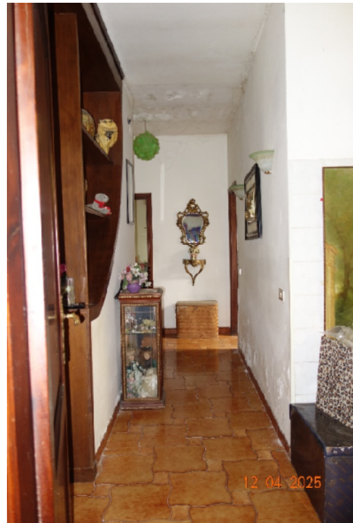
Foto 24 Corridoio