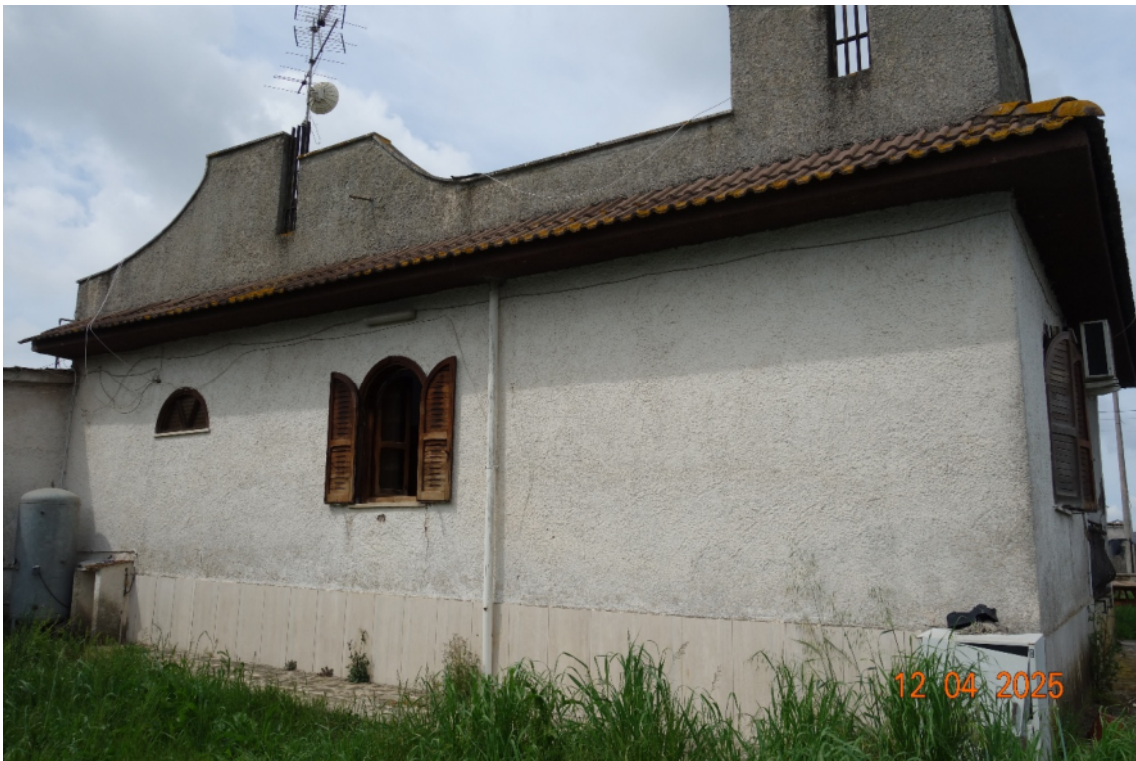
Foto 6 Vista del prospetto posteriore