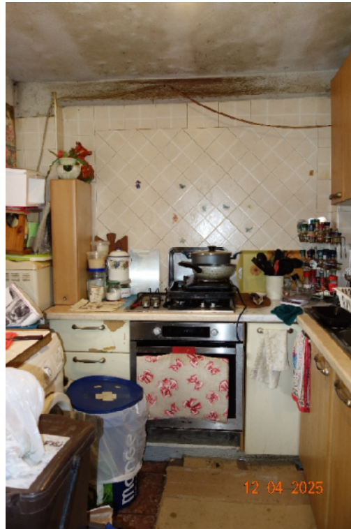
Foto 15 Vista del cucinino a quota 0,00