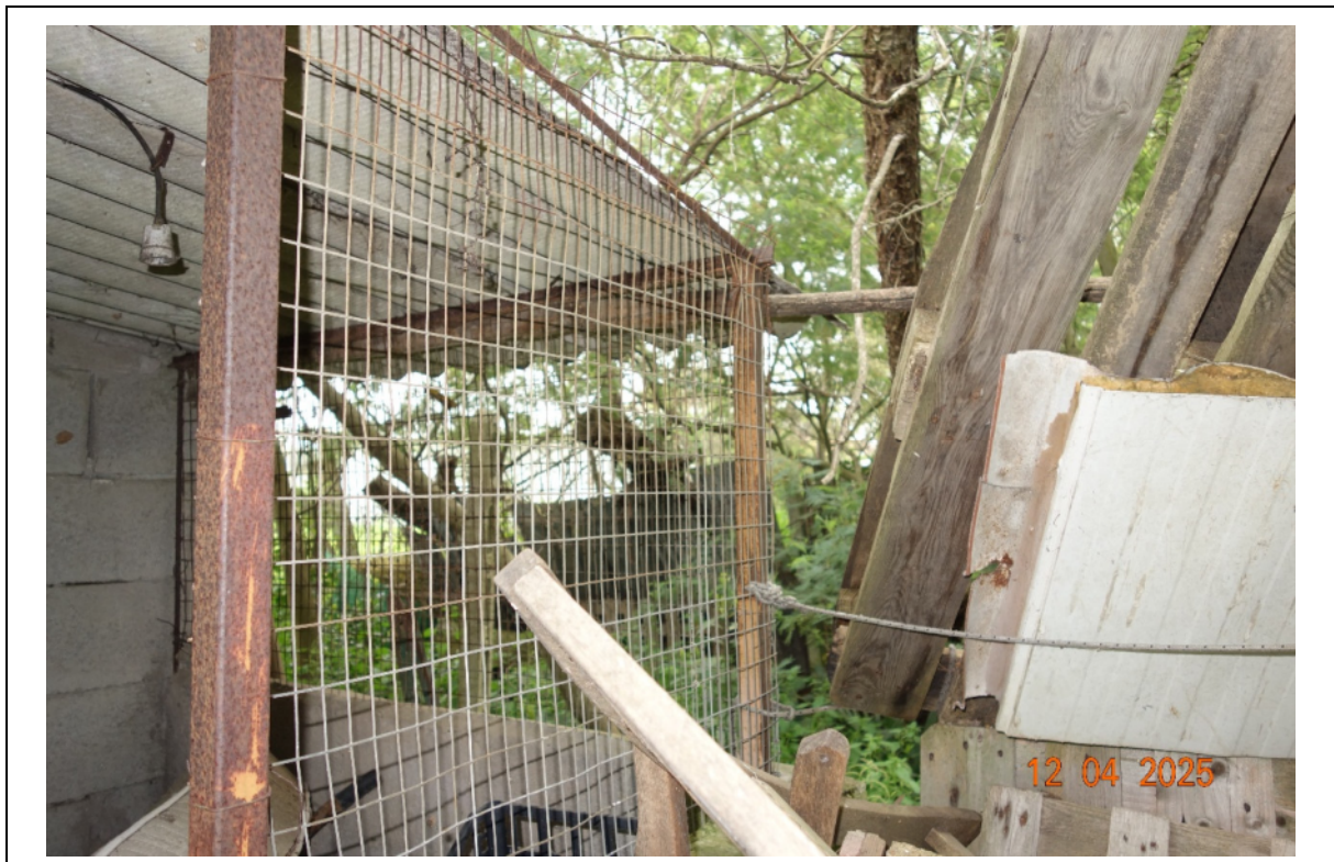
Foto 37 Tettoia posta sul retro del magazzino