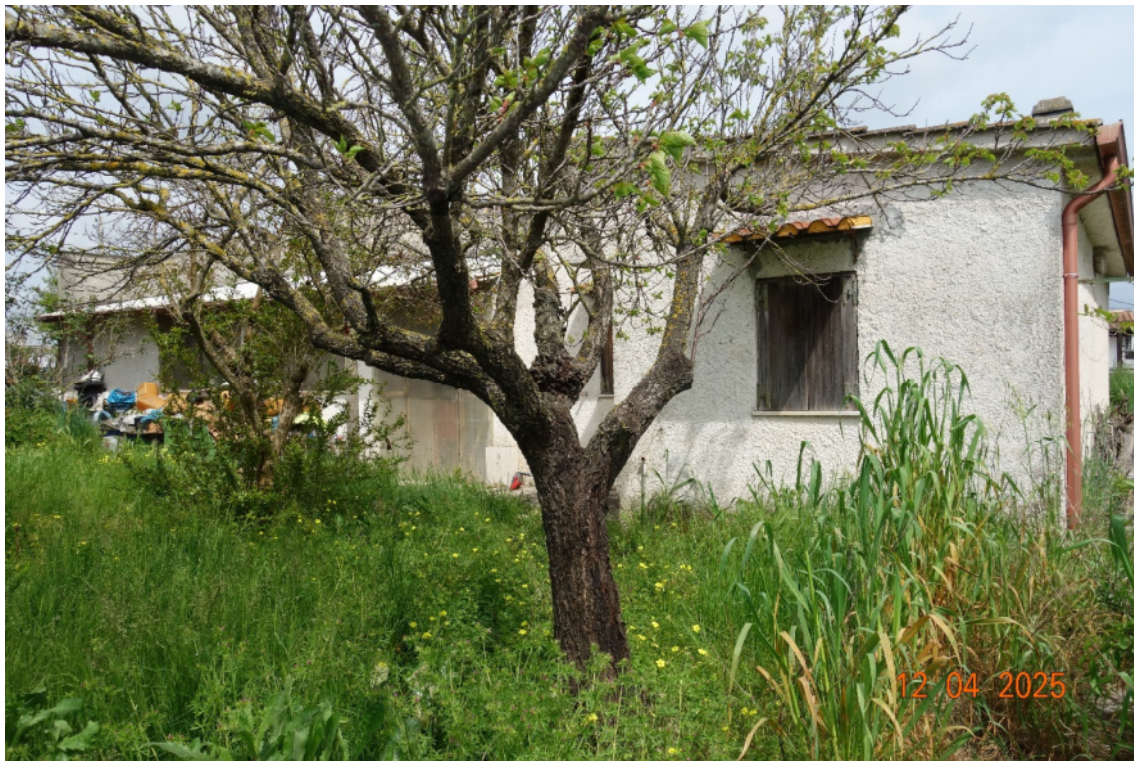
Foto 8 Vista del prospetto laterale, lato quota 0,00