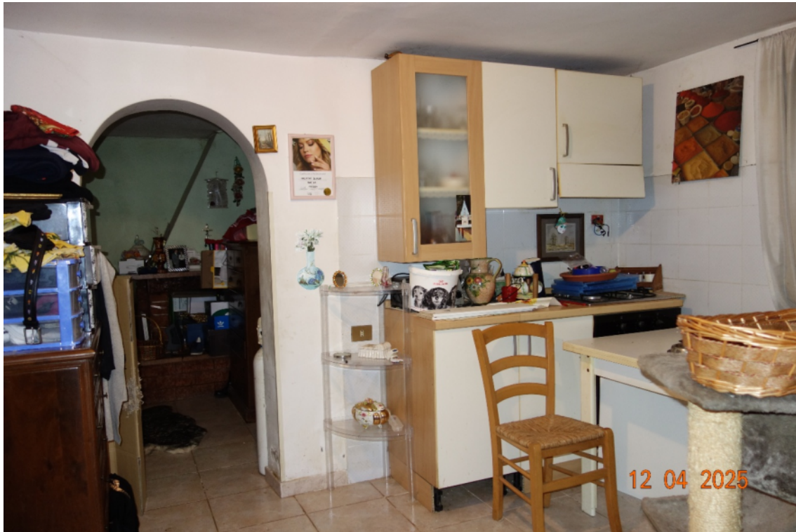
Foto 17 Cucina