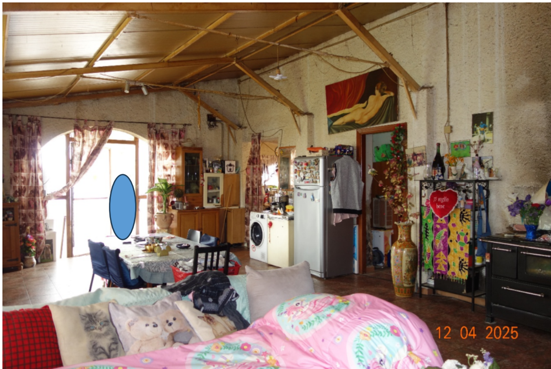
Foto 13 Vista del soggiorno/pranzo a quota 0,00