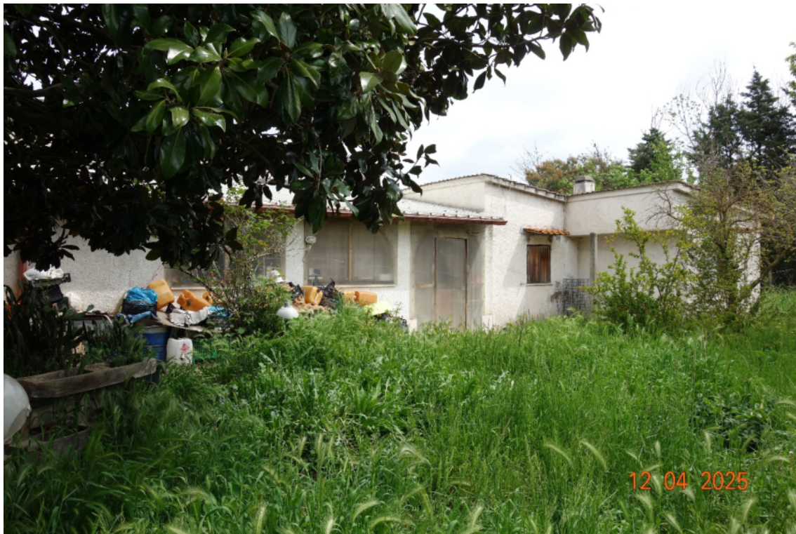
Foto 10 Vista del prospetto laterale, lato quota 0,00