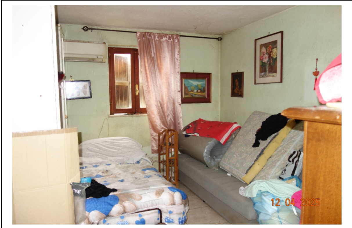
Foto 19 Stanza da letto