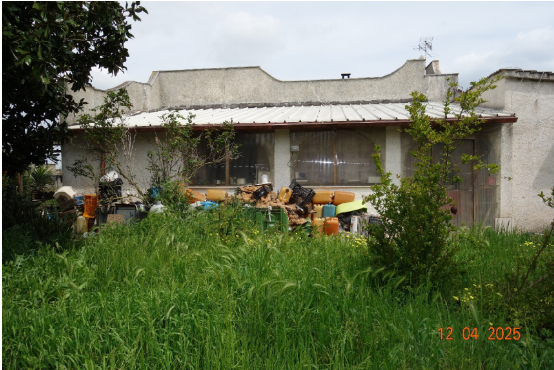
Foto 9 Vista del prospetto laterale, lato quota 0,00