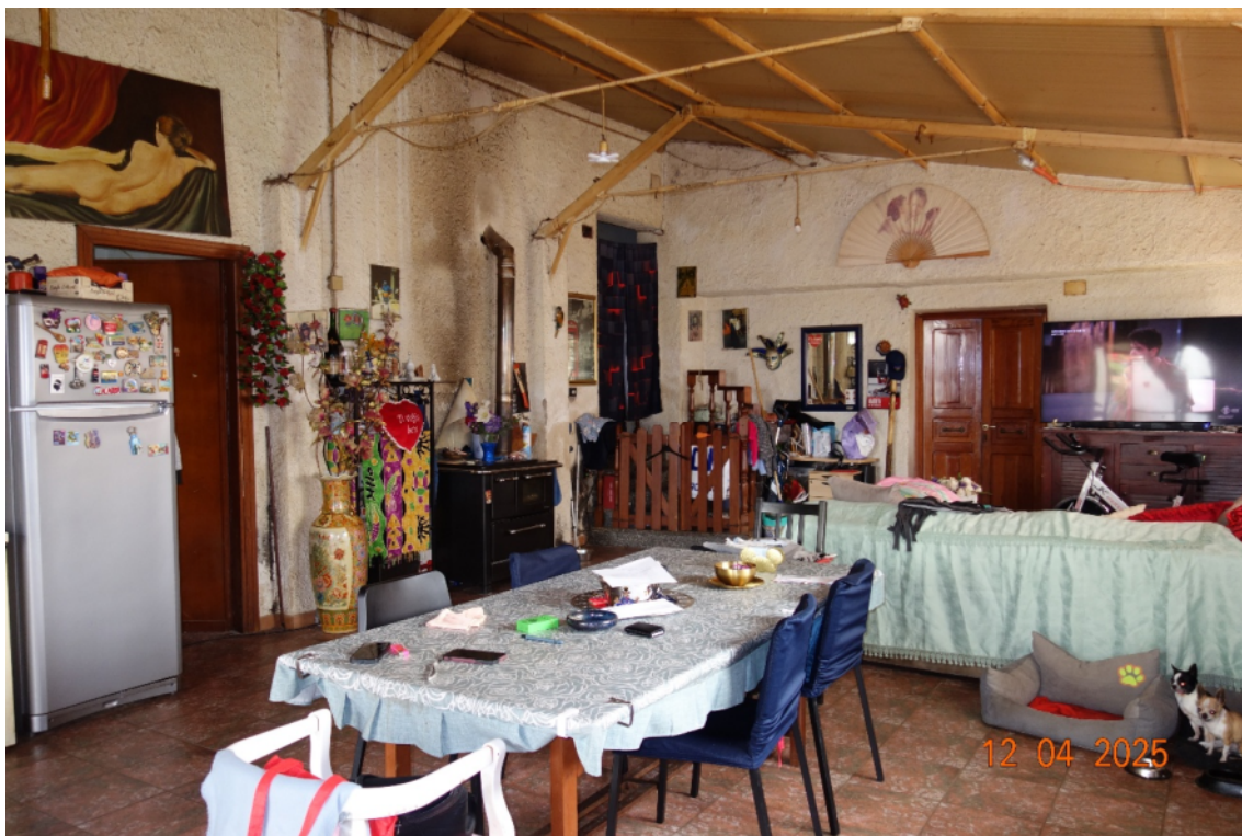
Foto 14 Vista del soggiorno/pranzo a quota 0,00