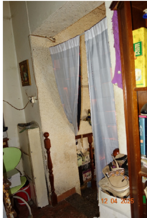
Foto 22 Vista dal disimpegno verso il vano di ingresso