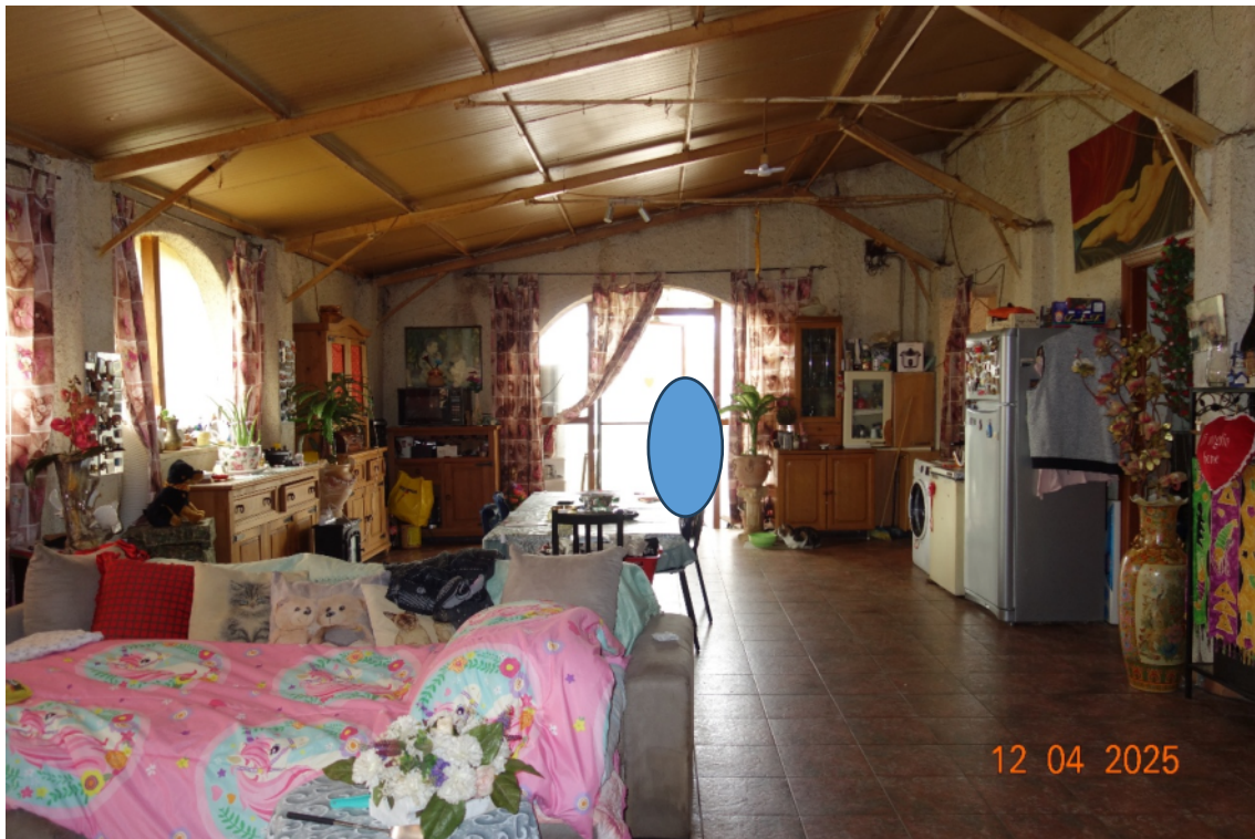
Foto 12 Vista del soggiorno/pranzo a quota 0,00