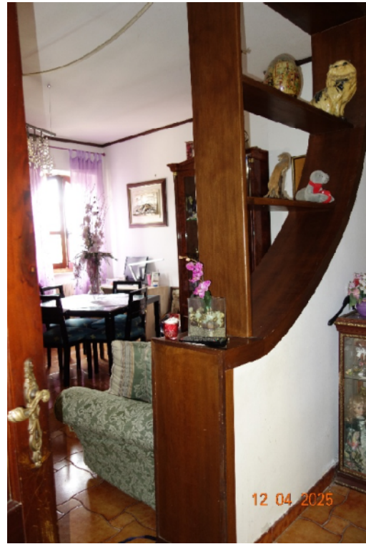
Foto 26 Vista del soggiorno dal corridoio