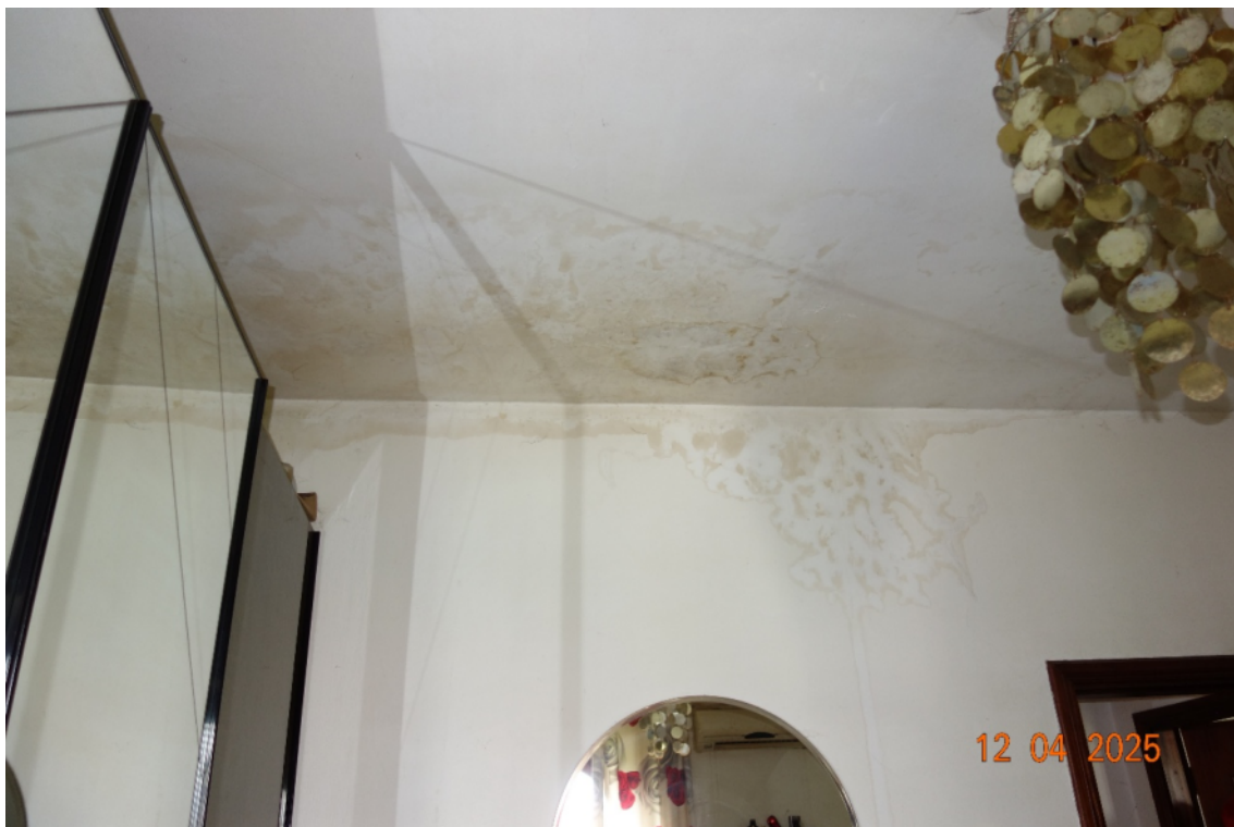
Foto 31 Dettaglio del soffitto della stanza da letto matrimoniale: macchie derivanti da infiltrazioni