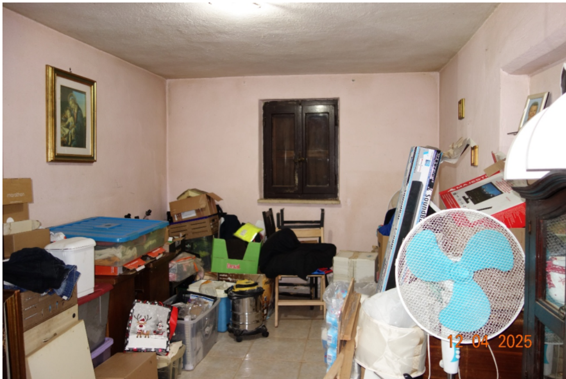
Foto 18 Vano pluriuso