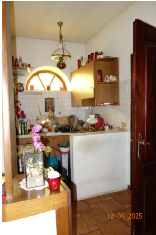
Foto 25 Cucinino