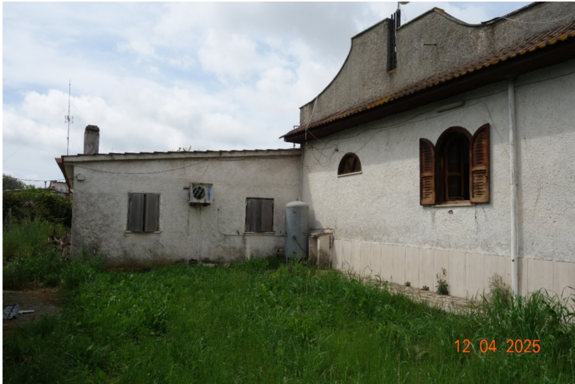
Foto 7 Vista del prospetto posteriore