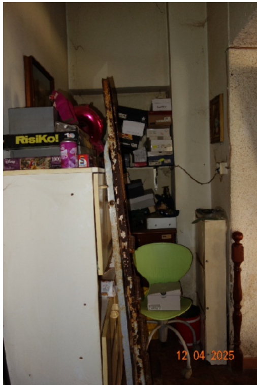
Foto 21 Disimpegno