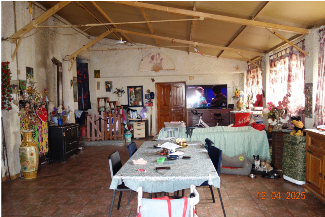
Foto 11 Vista del soggiorno/pranzo a quota 0,00