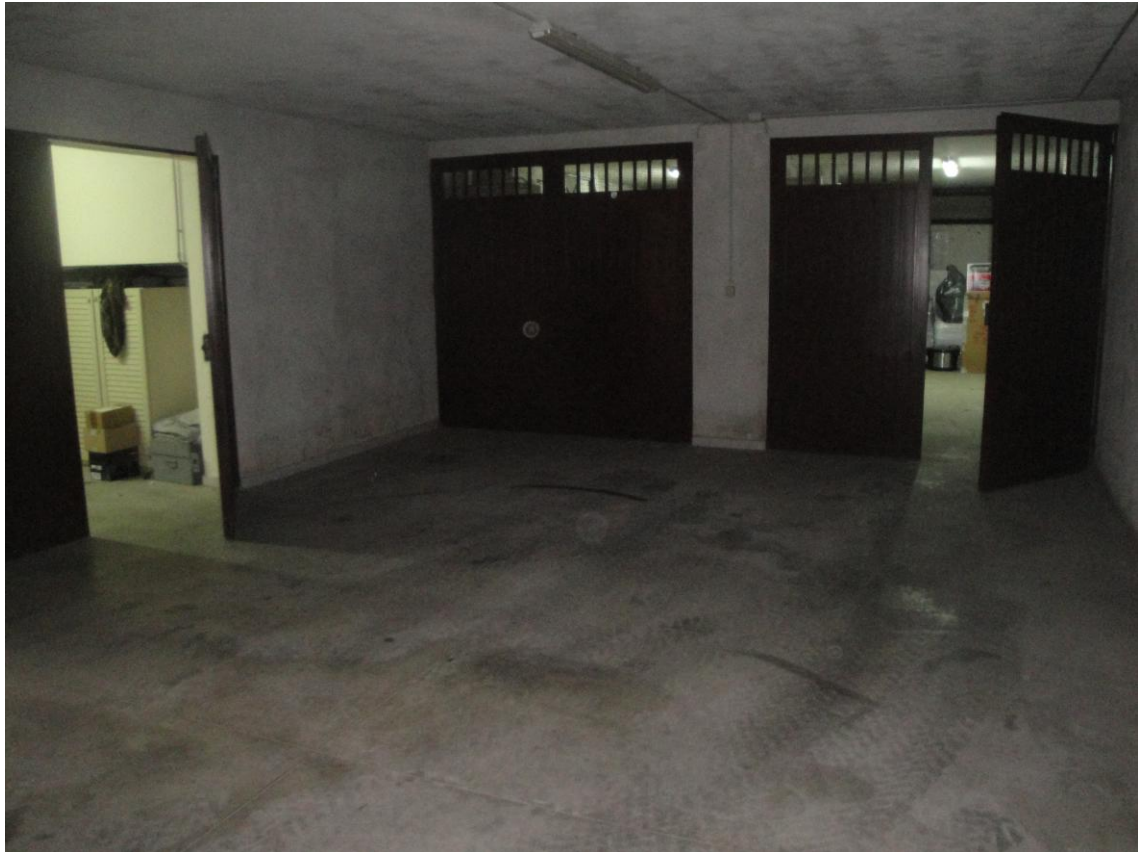
Foto 16: LOTTO 3. Immobile F. Locale box sito in Cerignola (FG), alla Via dei Tulipani snc, piano S.1, interno 2. Interno del box.