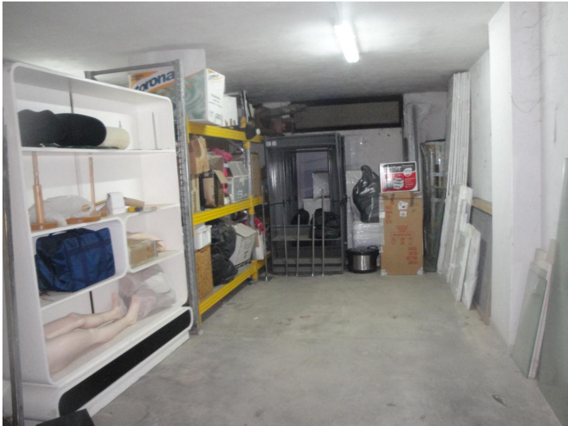
Foto 18: LOTTO 3. Immobili F-G. Locali box siti in Cerignola (FG), alla Via dei Tulipani snc, piano S.1. Rampa d'accesso alla corsia di manovra dell'autorimessa.