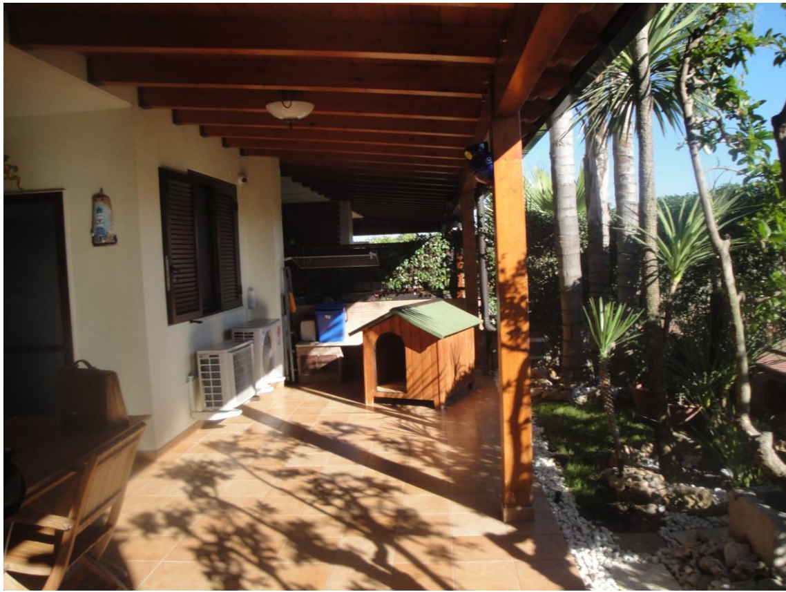
Foto 4: LOTTO 1. Immobile A. Appartamento sito in Cerignola (FG), alla Via dei Tulipani snc, piano S1-T-1-2. Sala in p.t..