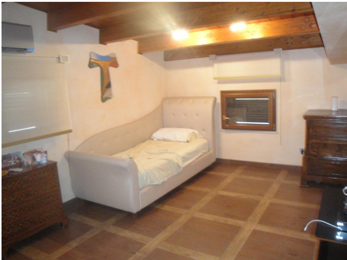
Foto 16: LOTTO 1. Immobile A. Appartamento sito in Cerignola (FG), alla Via dei Tulipani snc, piano S1-T-1-2. Sottotetto in p.2.