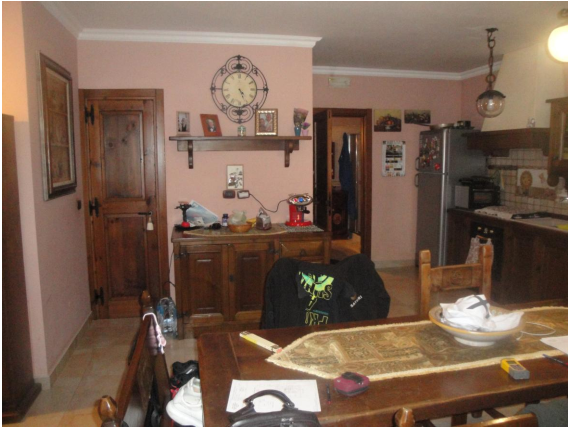
Foto 6: LOTTO 2. Immobile C. Appartamento sito in Cerignola (FG), alla Via dei Tulipani snc, piano S1-T. Soggiorno in piano T.