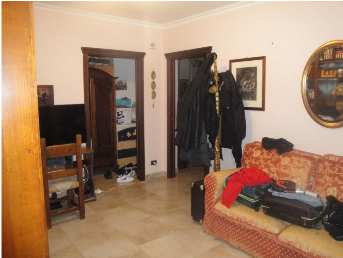
Foto 8: LOTTO 2. Immobile C. Appartamento sito in Cerignola (FG), alla Via dei Tulipani snc, piano S1-T. Camera da letto in piano T.