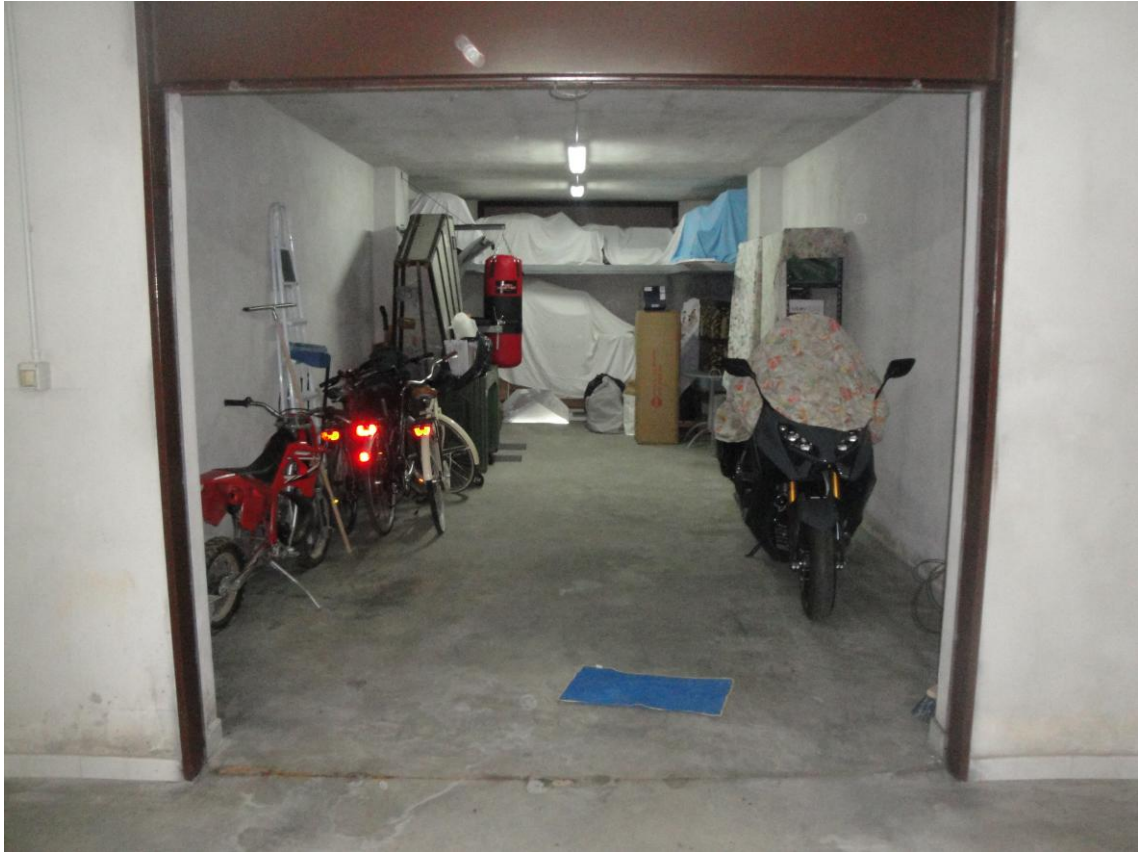
Foto 2: LOTTO 4. Immobile H. Locale box sito in Cerignola (FG), alla Via dei Tulipani snc, piano S.1, interno 5. Interno del box.