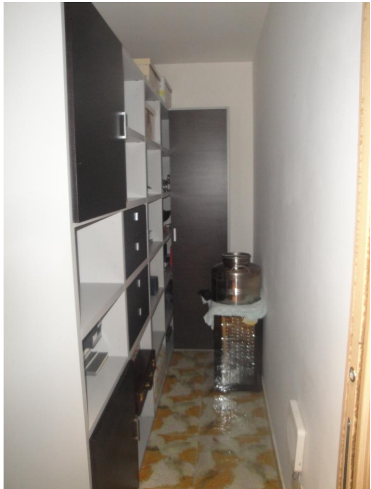
Foto 10: LOTTO 1. Immobile A. Appartamento sito in Cerignola (FG), alla Via dei Tulipani snc, piano S1-T-1-2. Ripostiglio in p.S1.