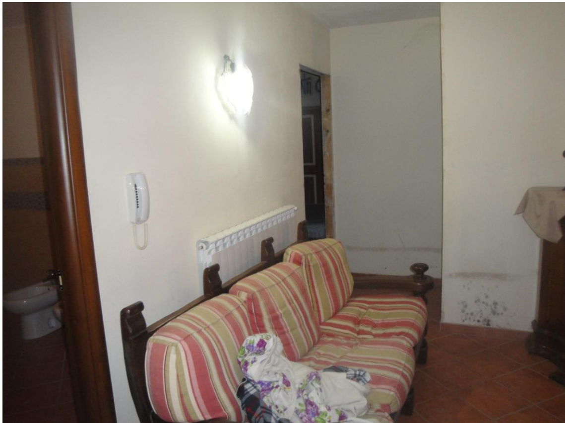
Foto 14: LOTTO 2. Immobile C. Appartamento sito in Cerignola (FG), alla Via dei Tulipani snc, piano S1-T. Tavernetta in piano S1.