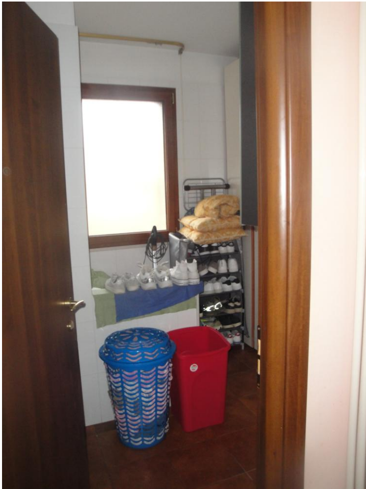
Foto 6: LOTTO 3. Immobile E. Appartamento sito in Cerignola (FG), alla Via dei Tulipani snc, piano T-1-2. Lavanderia in P.1.