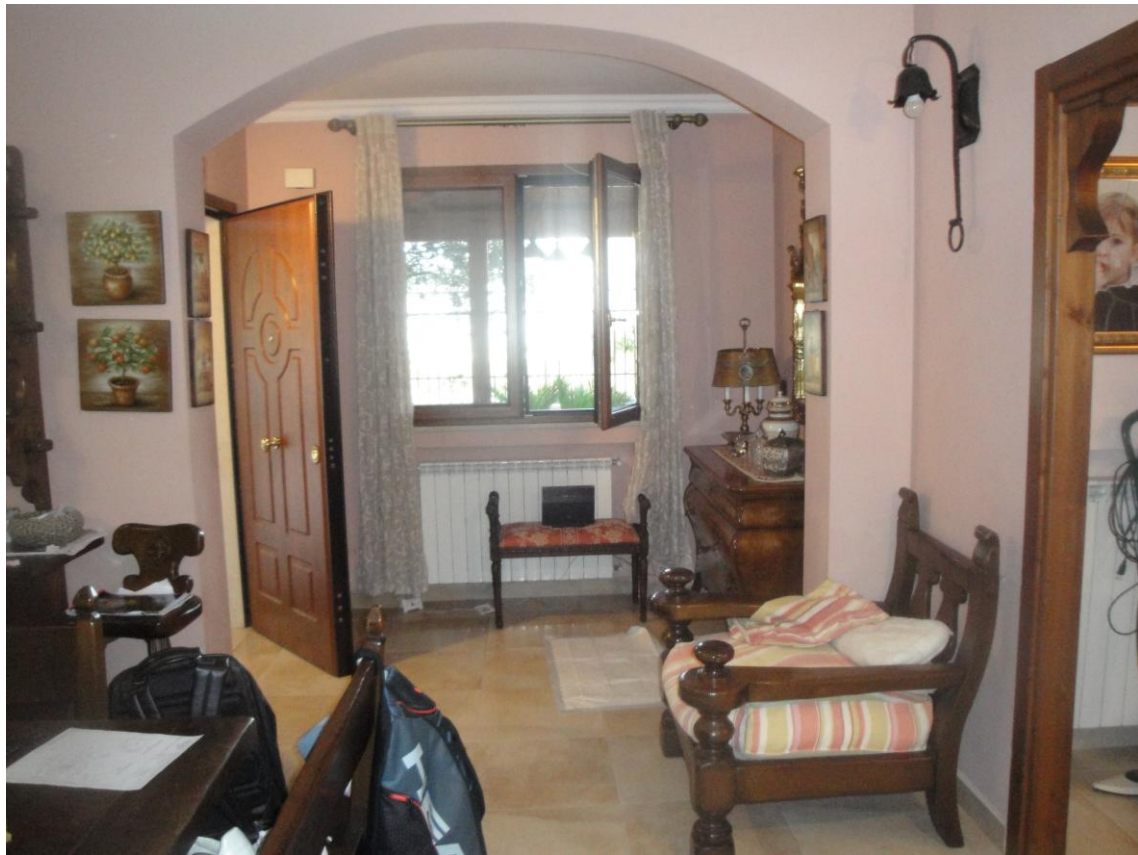
Foto 4: LOTTO 2. Immobile C. Appartamento sito in Cerignola (FG), alla Via dei Tulipani snc, piano S1-T. Sala in piano T.