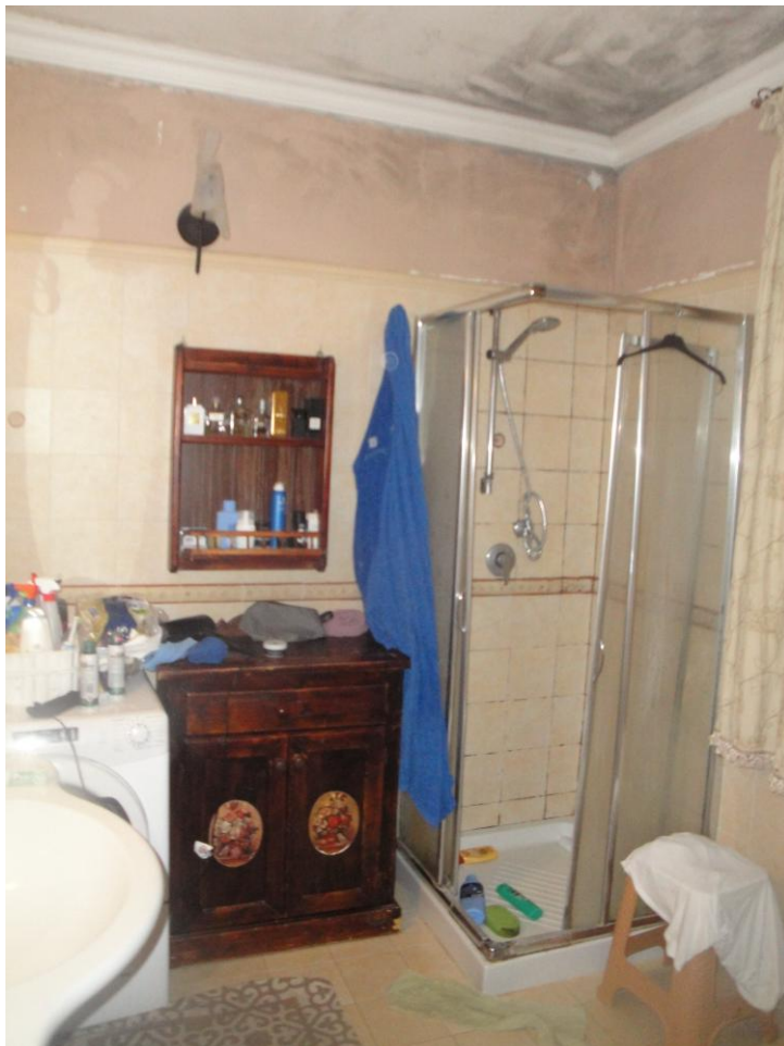
Foto 10: LOTTO 2. Immobile C. Appartamento sito in Cerignola (FG), alla Via dei Tulipani snc, piano S1-T. Altro bagno in piano T.