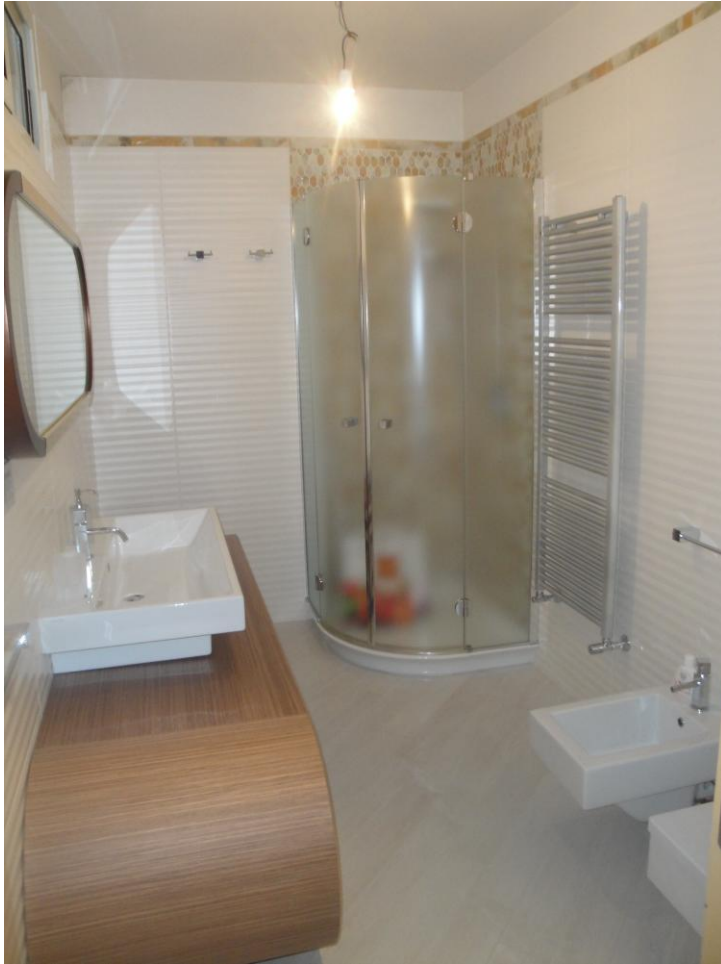
Foto 9: LOTTO 1. Immobile A. Appartamento sito in Cerignola (FG), alla Via dei Tulipani snc, piano S1-T-1-2. Locale wc in p.S1.