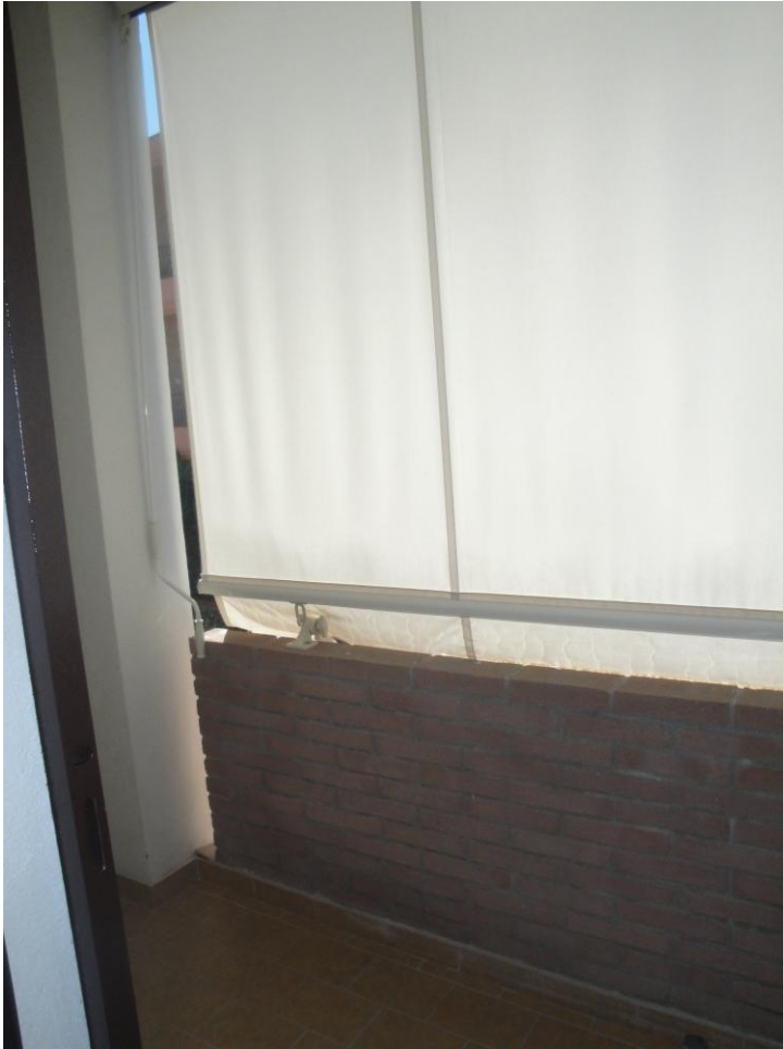
Foto 15: LOTTO 1. Immobile A. Appartamento sito in Cerignola (FG), alla Via dei Tulipani snc, piano S1-T-1-2. Balcone in p.1.