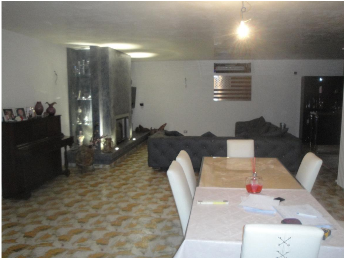
Foto 8: LOTTO 1. Immobile A. Appartamento sito in Cerignola (FG), alla Via dei Tulipani snc, piano S1-T-1-2. Tavernetta in p.S1.