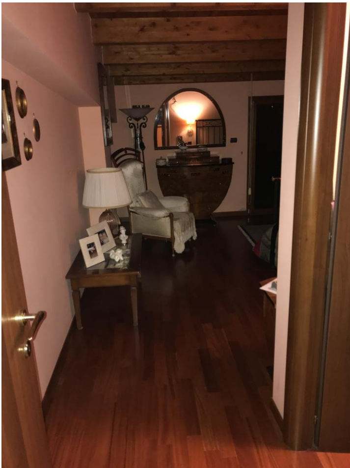
Foto 10: LOTTO 3. Immobile E. Appartamento sito in Cerignola (FG), alla Via dei Tulipani snc, piano T-1-2. Sottotetto in P.2.