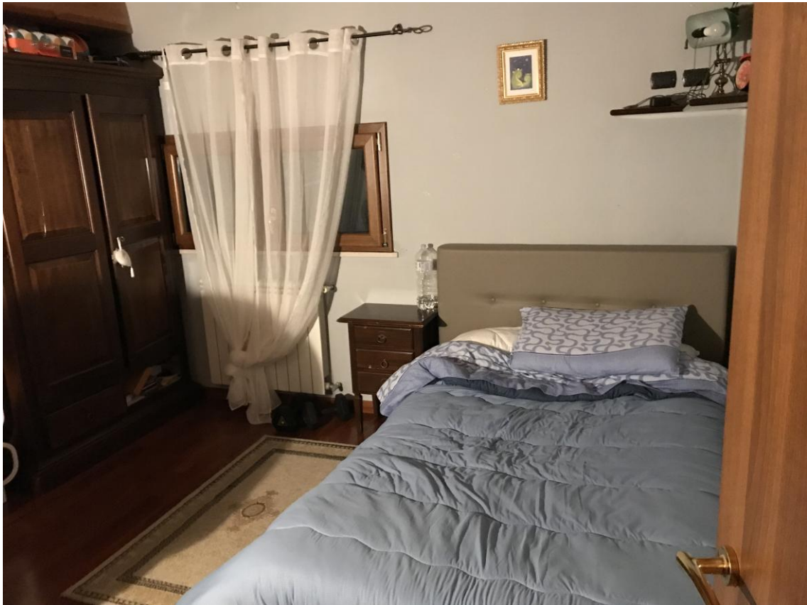
Foto 12: LOTTO 3. Immobile E. Appartamento sito in Cerignola (FG), alla Via dei Tulipani snc, piano T-1-2. Camera in P.2.