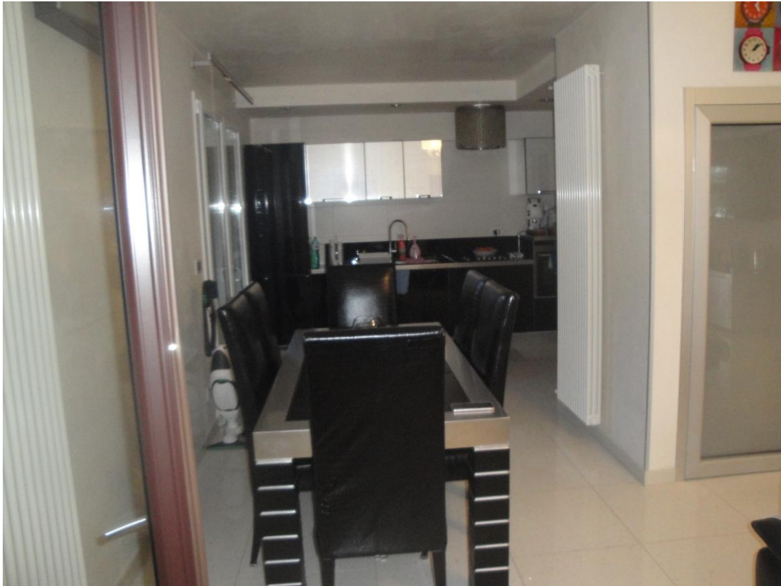
Foto 6: LOTTO 1. Immobile A. Appartamento sito in Cerignola (FG), alla Via dei Tulipani snc, piano S1-T-1-2. Cucina in p.t..