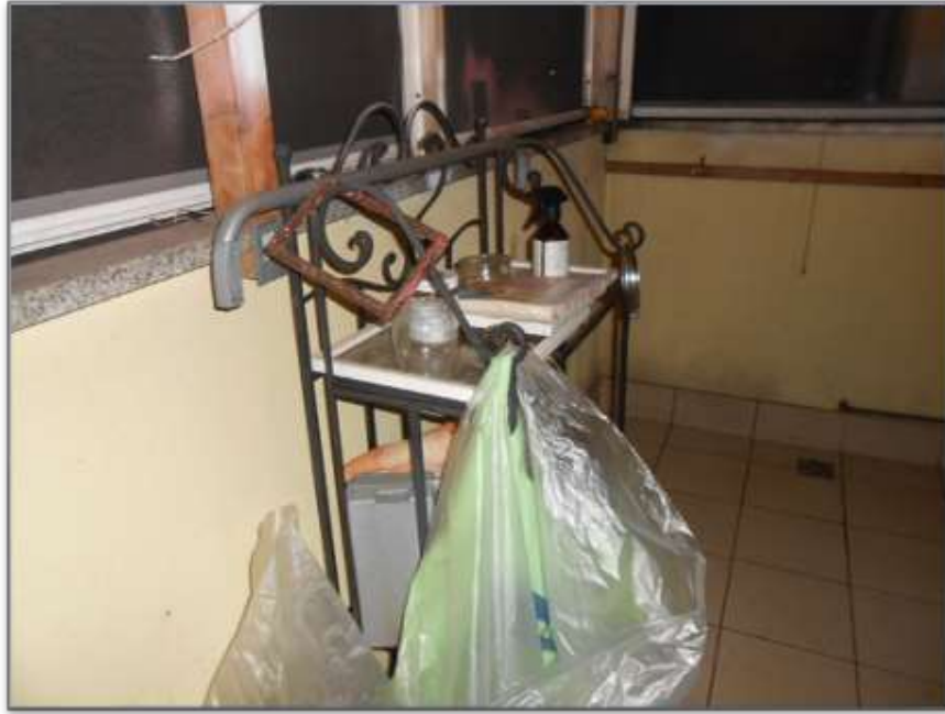
Foto 13 balcone 2 chiuso abusivamente