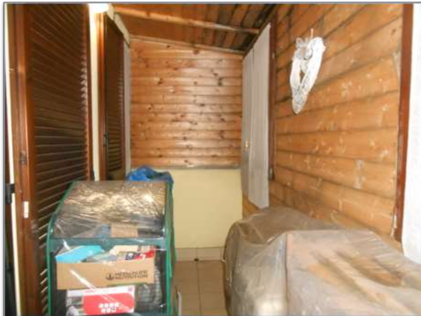
Foto 14 balcone 3 chiuso abusivamente