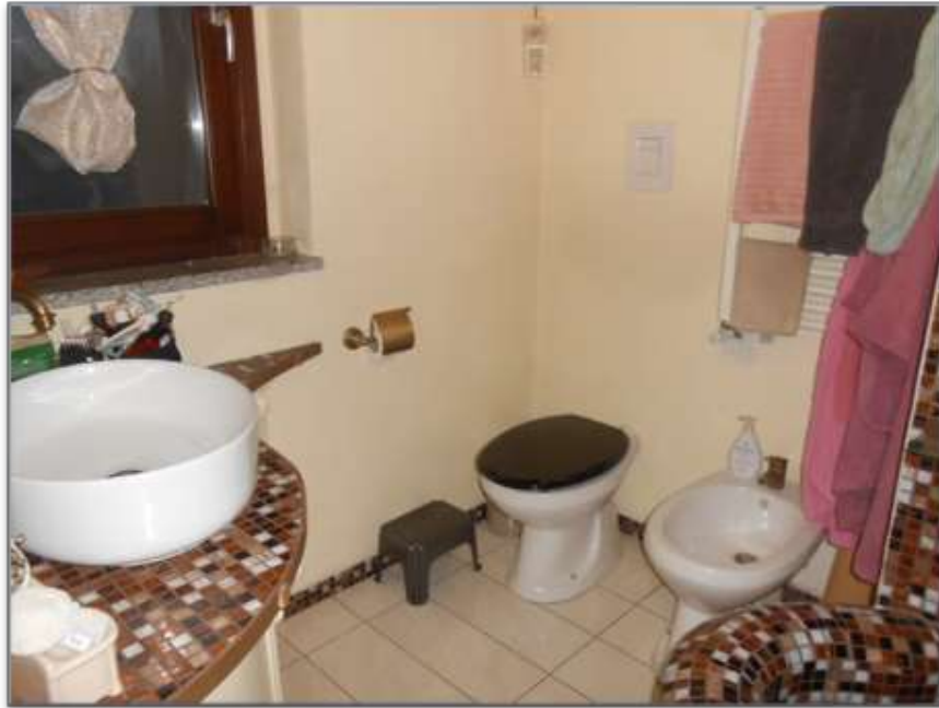
Foto 9 bagno 2