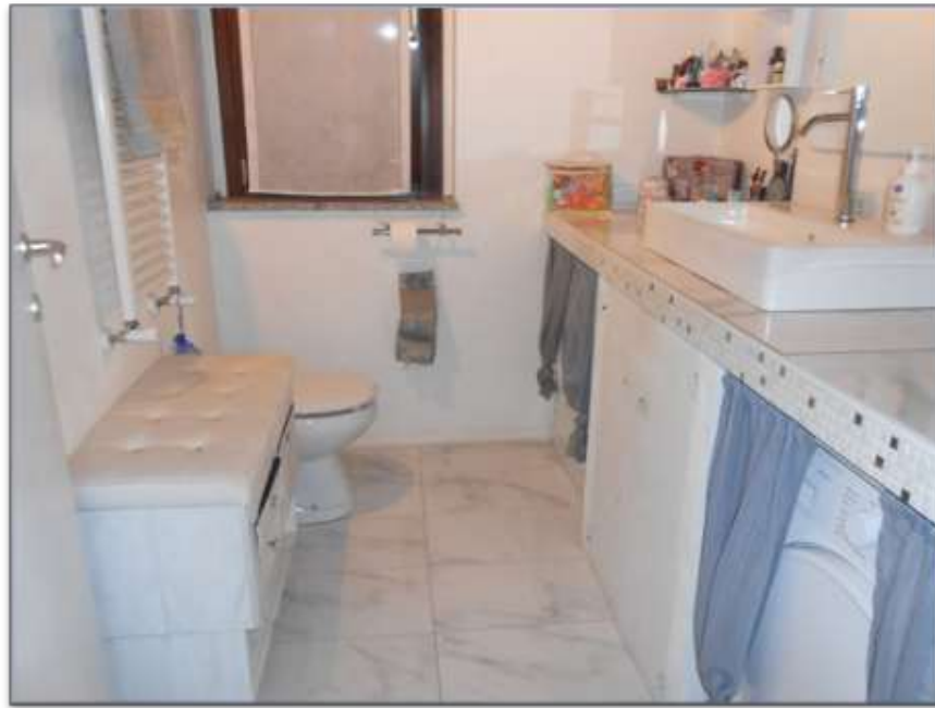
Foto 7 bagno 1