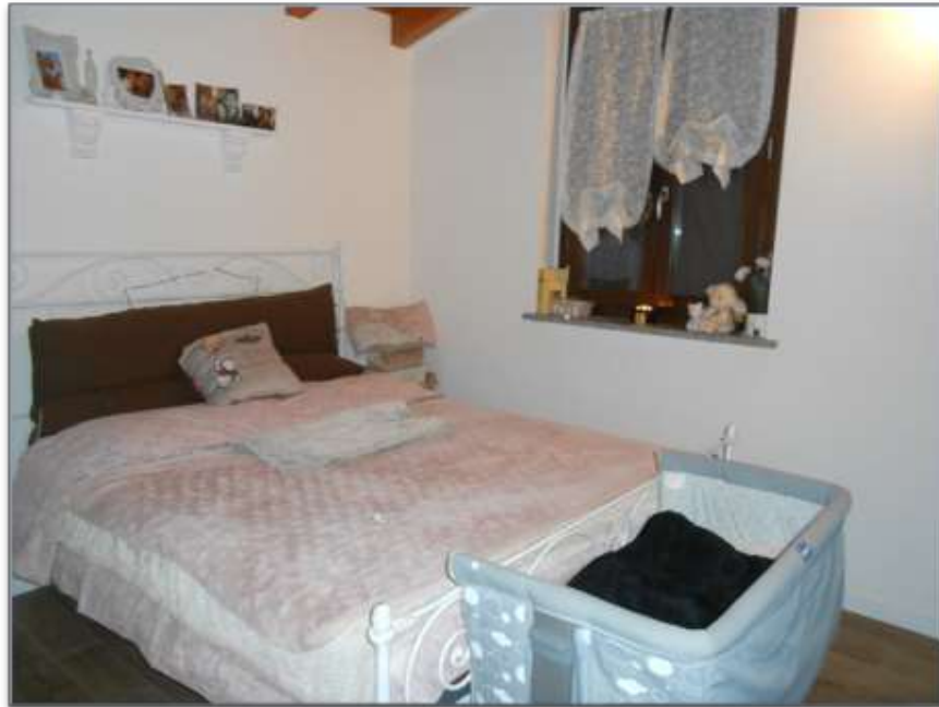
Foto 5 camera matrimoniale