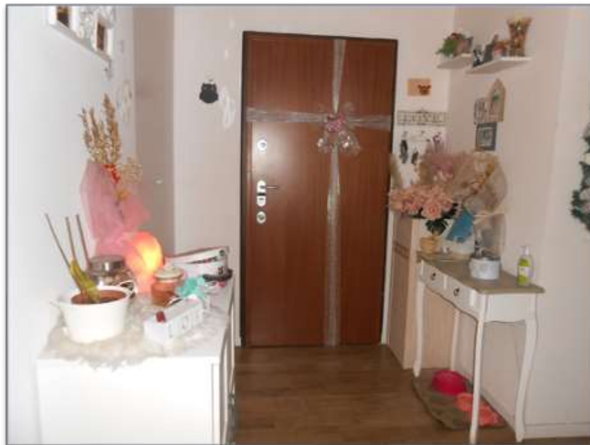
Foto 4 ingresso