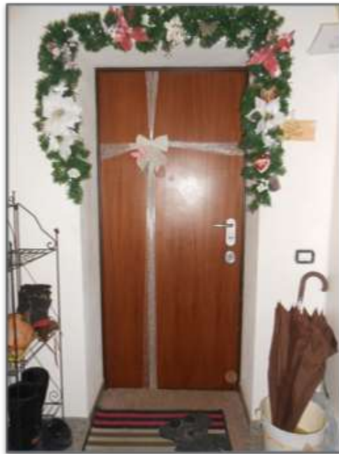
Foto 1 ingresso all'immobile