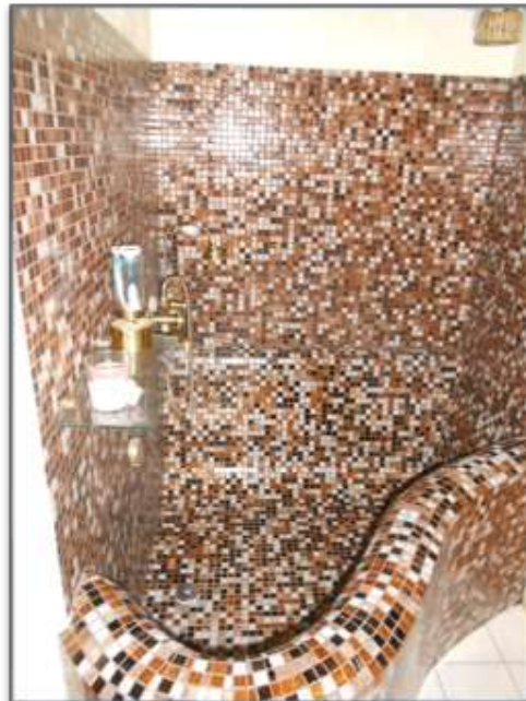
Foto 10 bagno 2