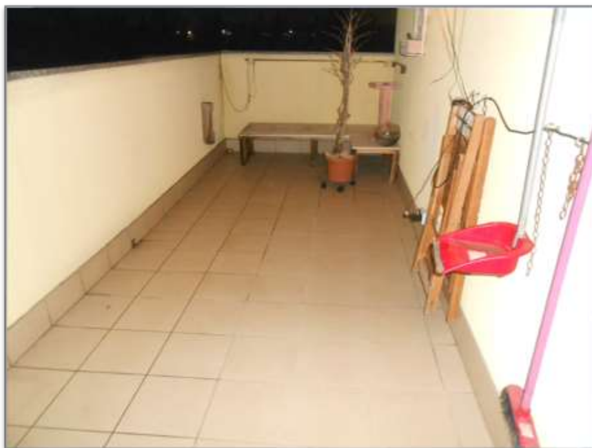
Foto 12 balcone 1