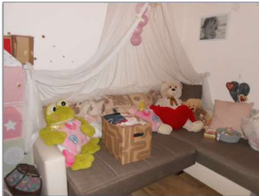
Foto 6 cameretta