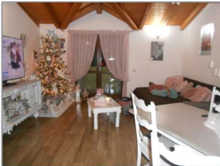
Foto 2 soggiorno