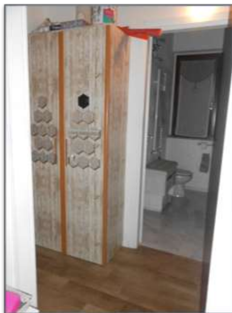
Foto 8 disimpegno