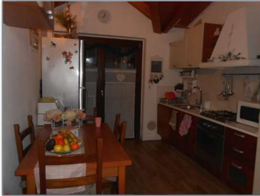
Foto 3 angolo cottura