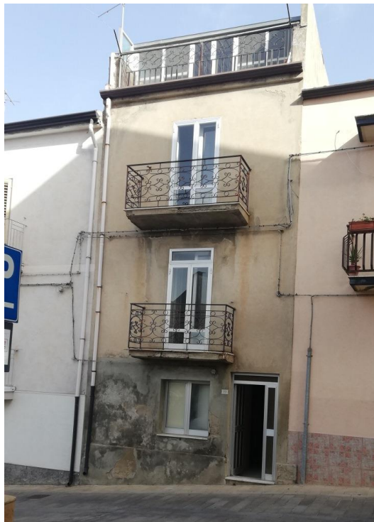
Fabbricato oggetto di pignoramento

L'edificio è stato costruito (nel suo impianto originario) in epoca antecedente al 1942, ma è stato successivamente sopraelevato nel 1974.