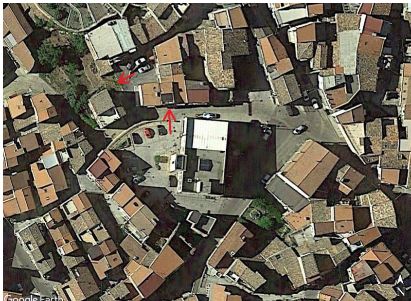
Foto aerea con indicazione del fabbricato e del terreno pertinenziale

Nelle immediate vicinanze al fabbricato, oltre al municipio, sono state rilevate le seguenti attrezzature o attività di tipo collettivo: scuole pubbliche, ufficio postale, chiese e bar.