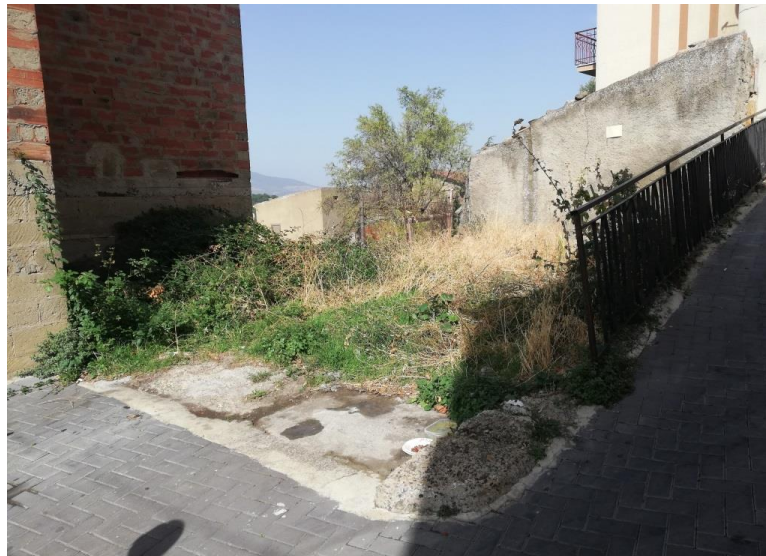
Porzione di terreno oggetto di pignoramento

Tale terreno può considerarsi come una pertinenza del fabbricato denominato corpo "A", in quanto dista da esso soltanto 30 metri circa.