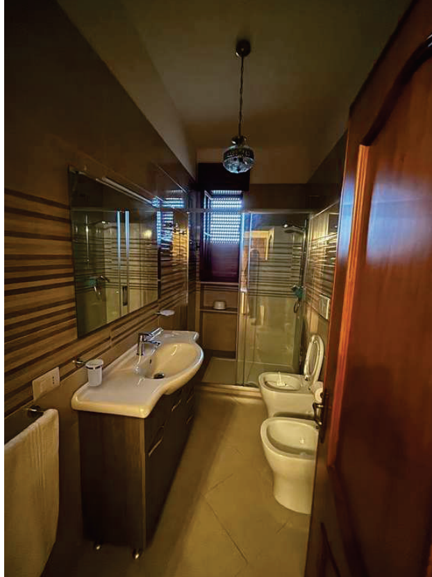
APP. Dx "B" – FOTO N.5