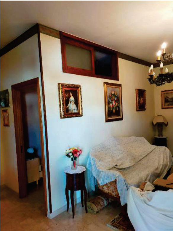
APP. Dx "B" – FOTO N.3