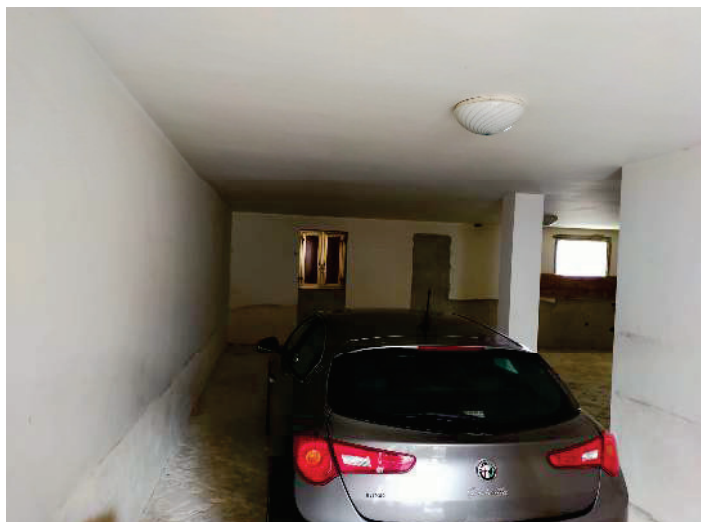
DEP. FOTO N.8