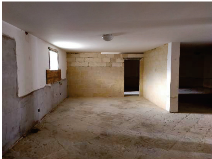
DEP. FOTO N.10