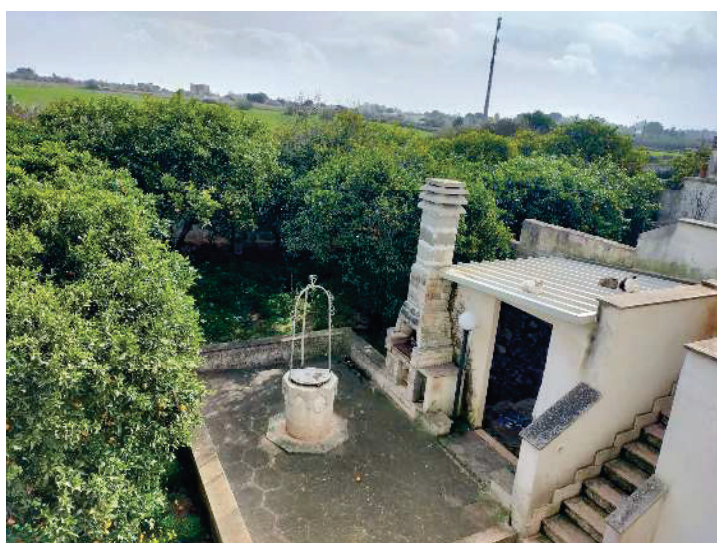
GIARDINO E LEGNAIA