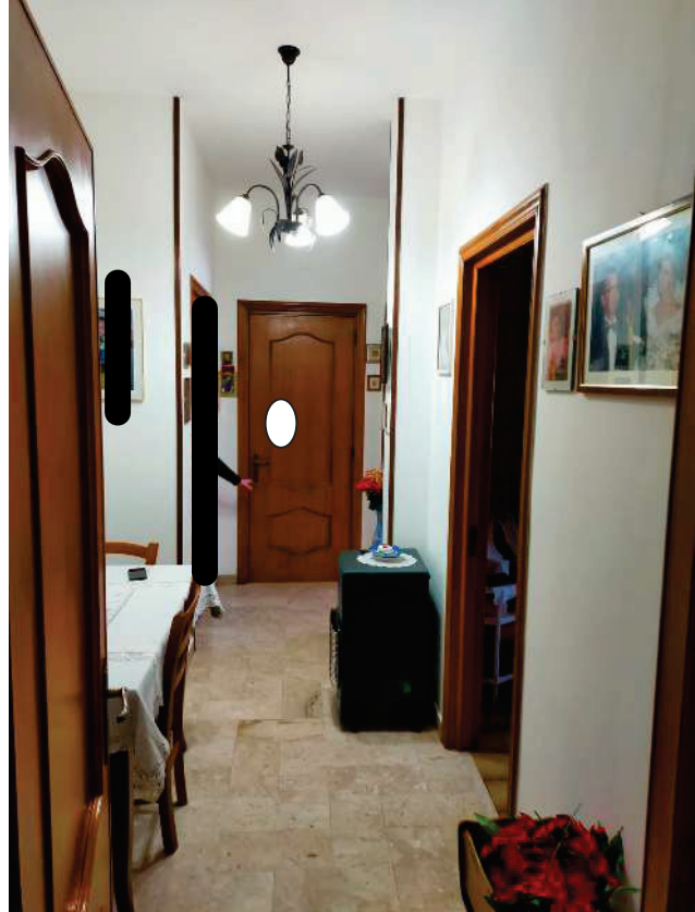
APP. Sx "A" – FOTO N.7