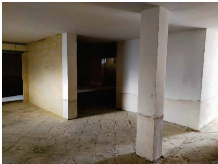
DEP. FOTO N.9