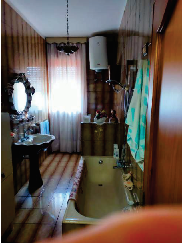
APP. Sx "A" – WC