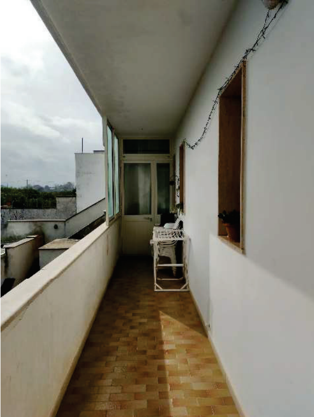
APP. Dx "B" – BALCONE CHIUSO