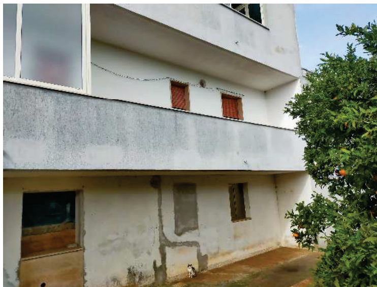
DEP. FOTO N.16