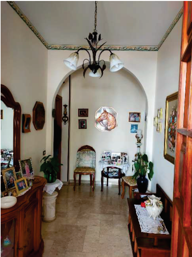
APP. Sx "A" – FOTO N.6