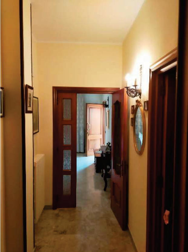
APP. Dx "B" – FOTO N.4