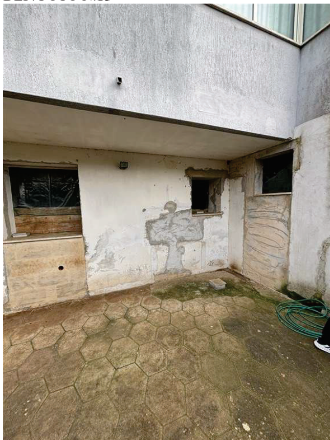
DEP. FOTO N.15