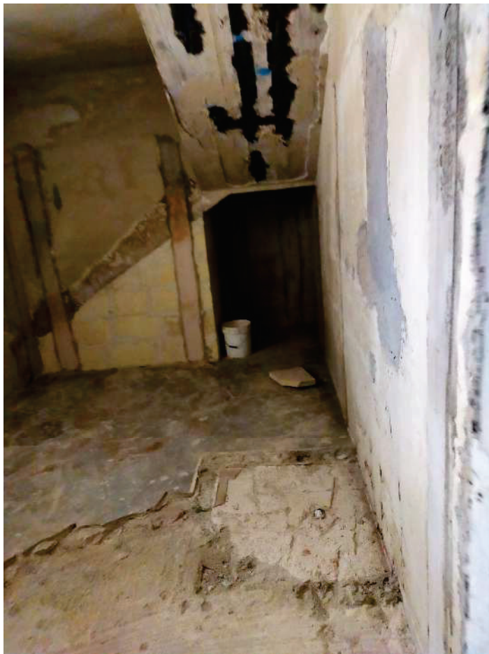
DEP. FOTO N.13