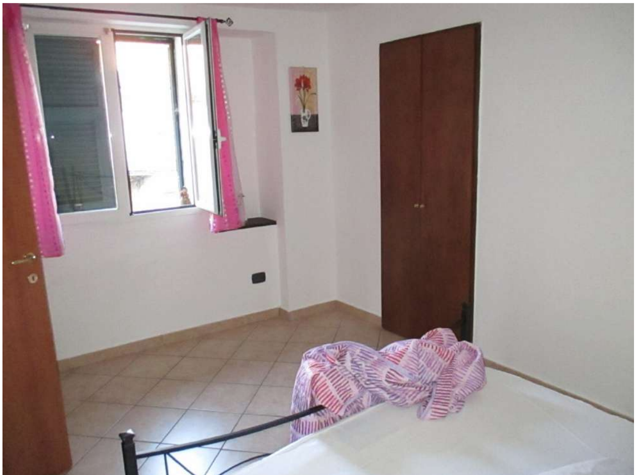
BDA foglio 10 particella 154 subalterno 7 - vista interna (porzione non conforme oggetto di lavori)