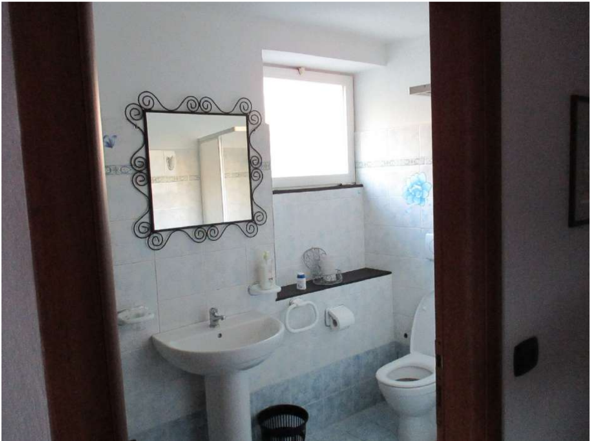
BDA foglio 10 particella 154 subalterno 7 - vista interna (porzione non conforme oggetto di lavori)