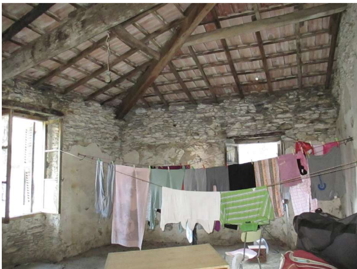
BDA foglio 10 particella 154 subalterno 7 - vista interna (porzione conforme non oggetto di lavori)