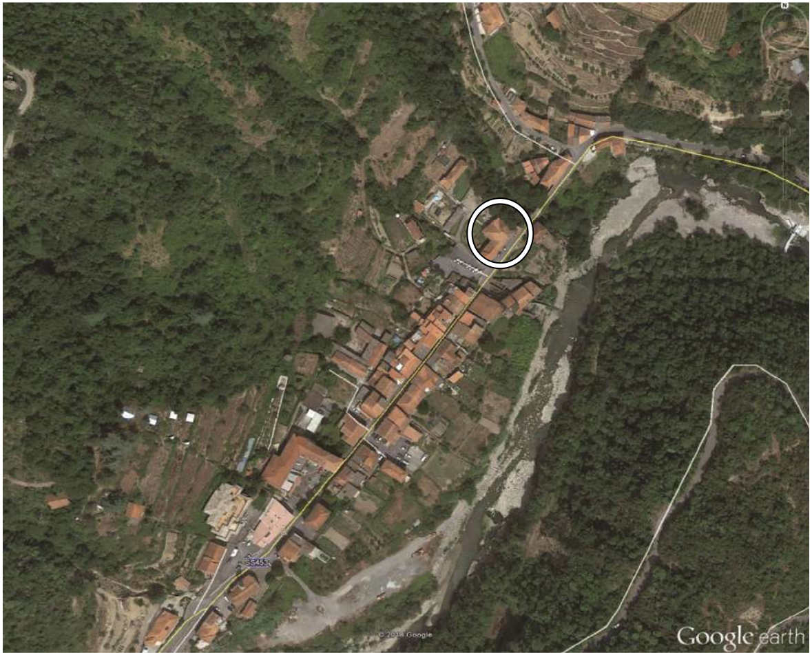
vista aerea per inquadramento di insieme