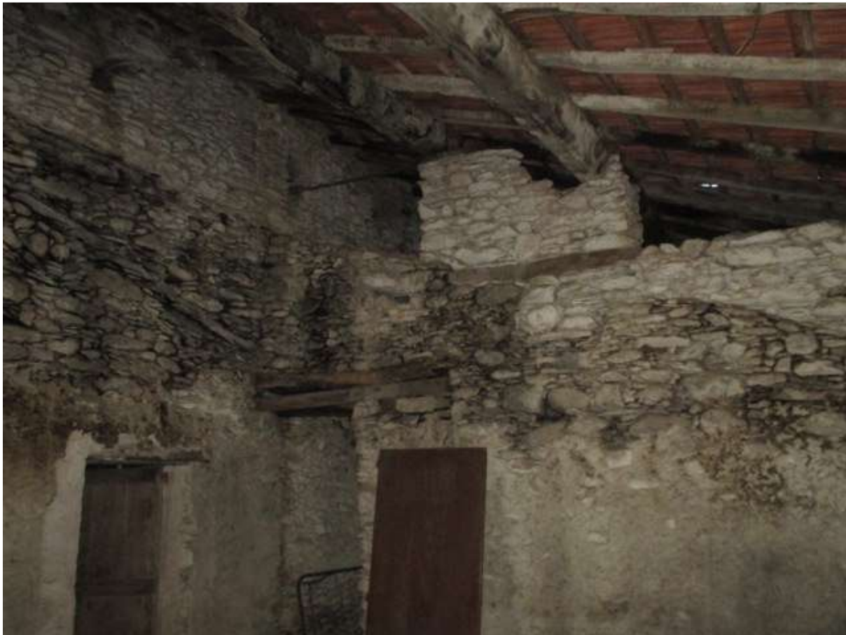
BDA foglio 10 particella 154 subalterno 7 - vista interna (porzione conforme non oggetto di lavori)