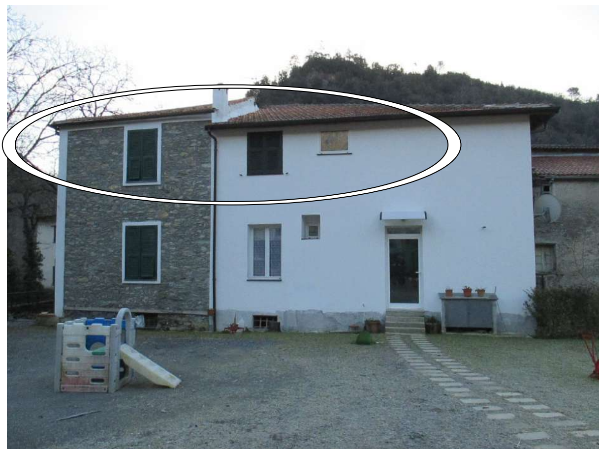
BDA foglio 10 particella 154 subalterno 7 - vista esterna