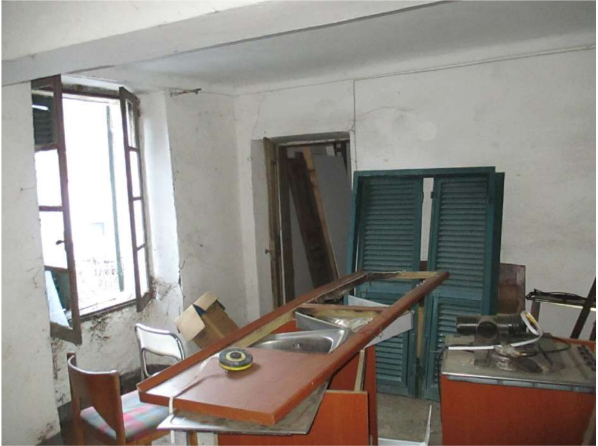
BDA foglio 10 particella 154 subalterno 5 - vista interna (porzione conforme non oggetto di lavori)