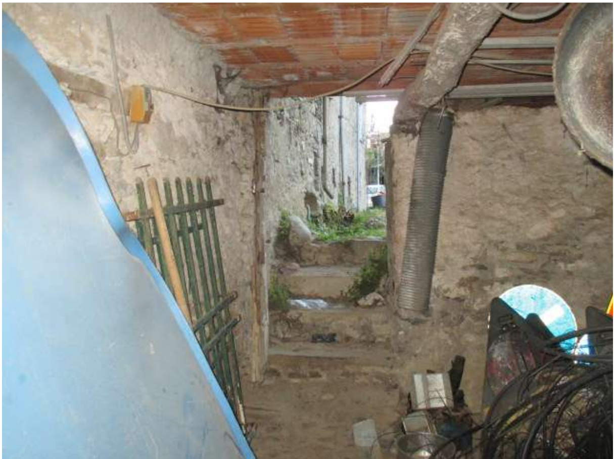
BDA foglio 10 particella 154 subalterno 3 - vista interna