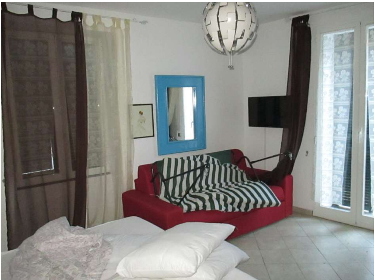
BDA foglio 10 particella 154 subalterno 5 - vista interna (porzione non conforme oggetto di lavori)