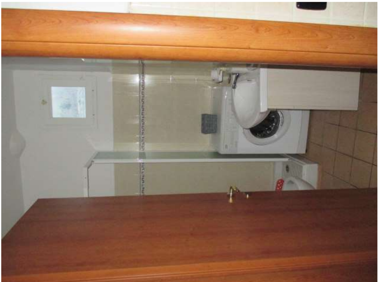
BDA foglio 10 particella 154 subalterno 5 - vista interna (porzione non conforme oggetto di lavori)