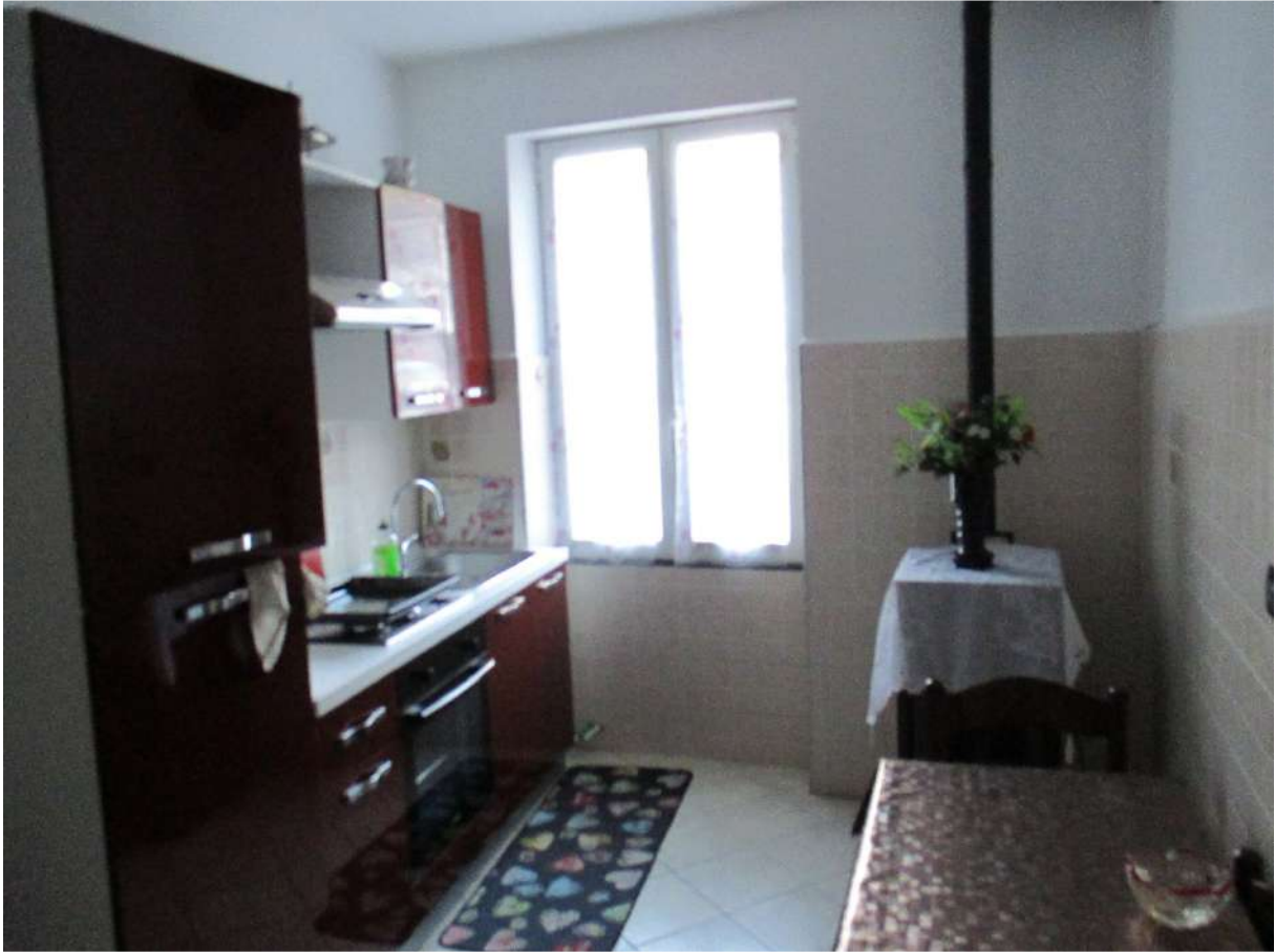
BDA foglio 10 particella 154 subalterno 5 - vista interna (porzione non conforme oggetto di lavori)