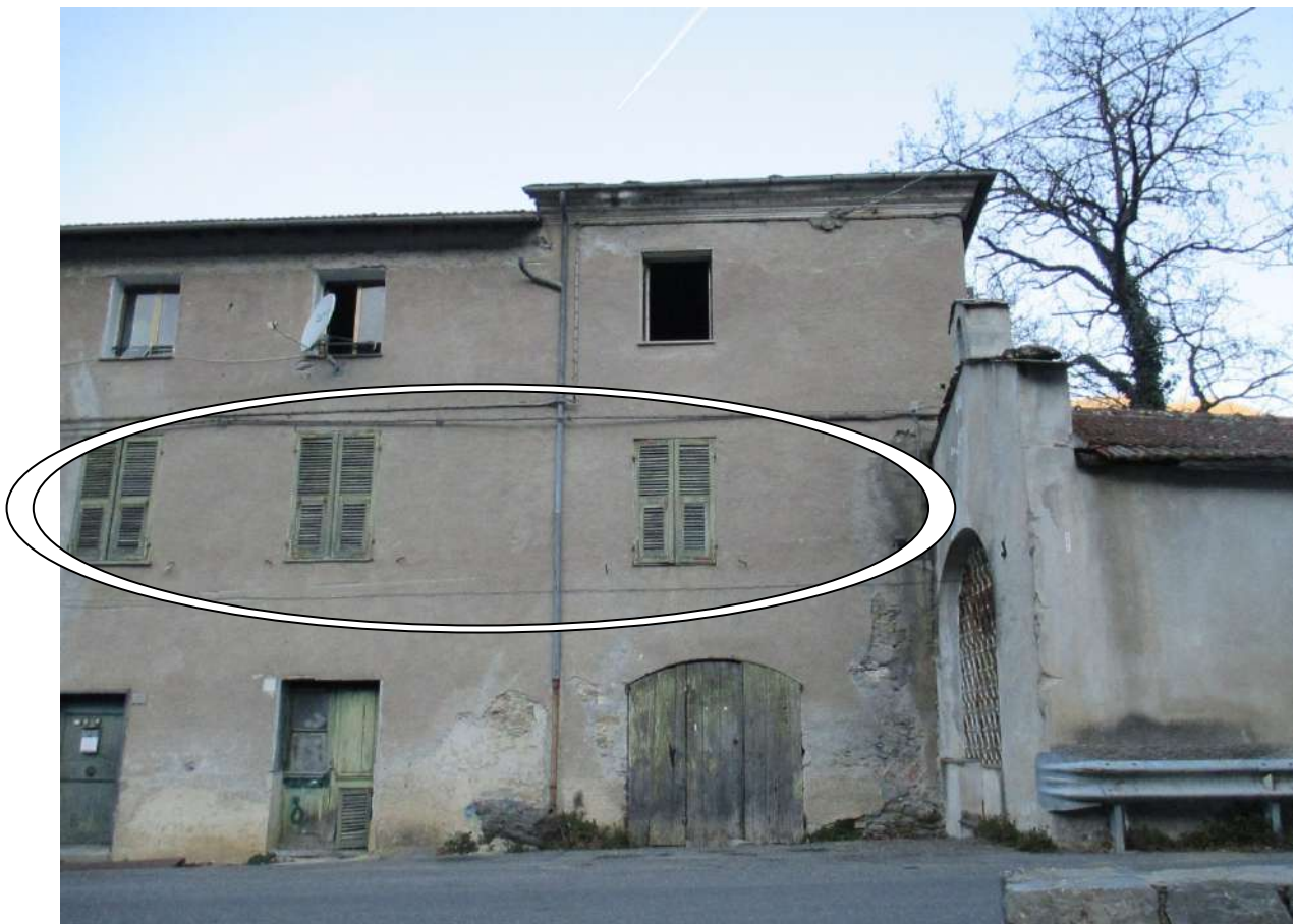
BDA foglio 10 particella 154 subalterno 5 - vista esterna