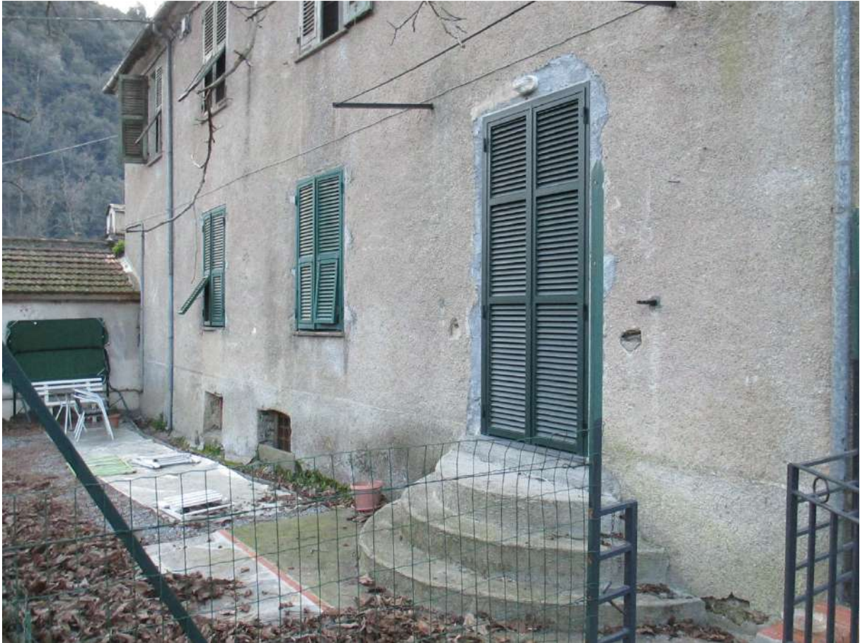
BDA foglio 10 particella 154 subalterno 3 e 5 - vista esterna