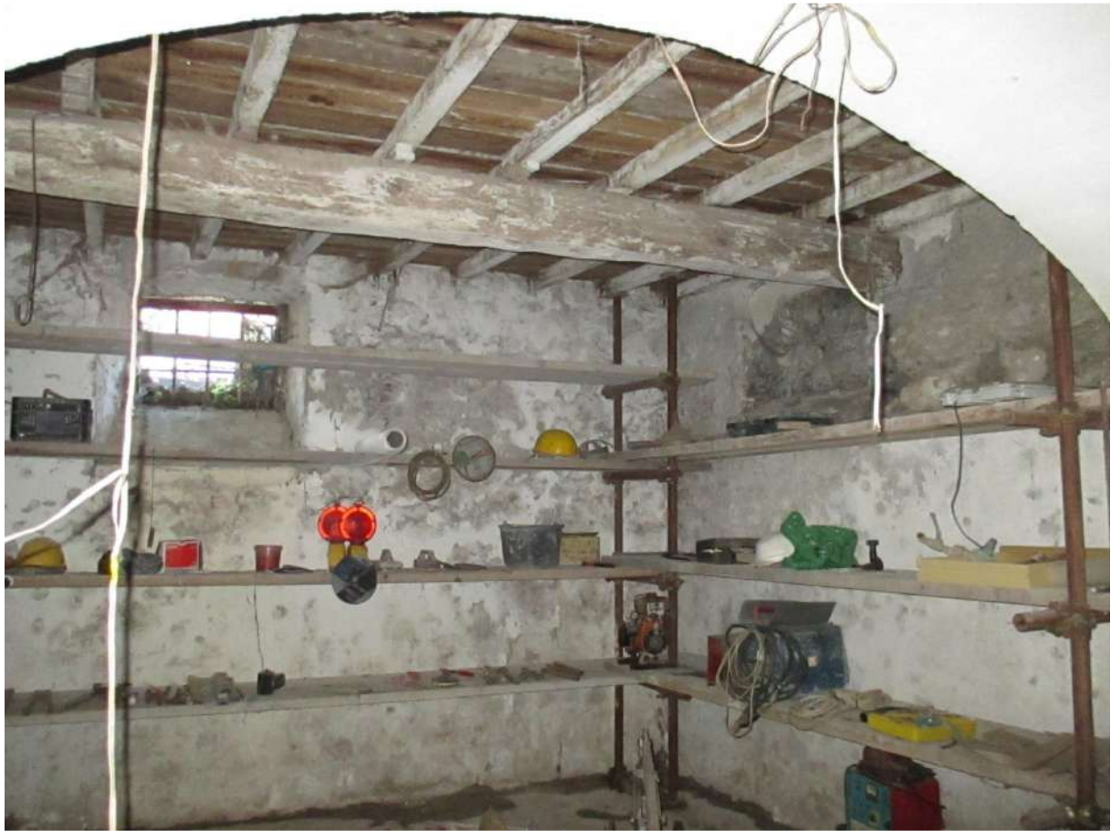
BDA foglio 10 particella 154 subalterno 3 - vista interna