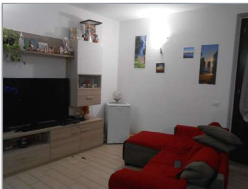
Foto 2 soggiorno