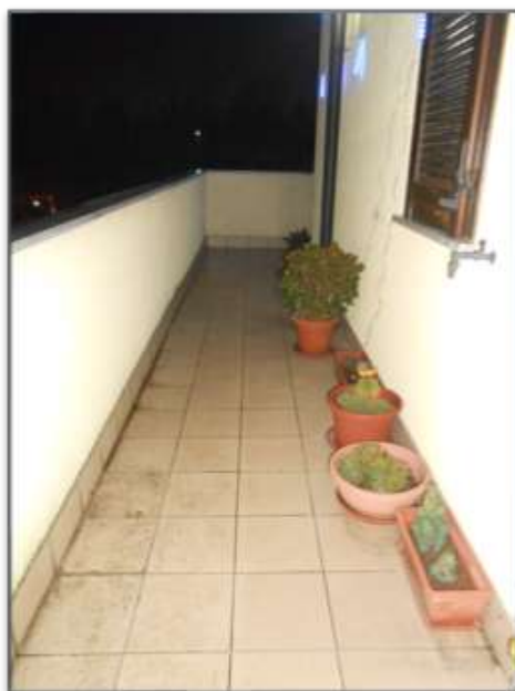
Foto 9 balcone