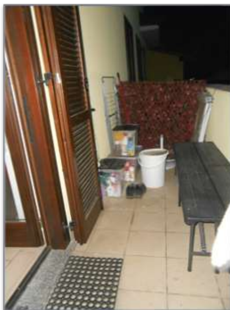
Foto 10 balcone