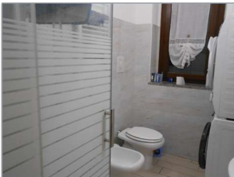
Foto 6 bagno