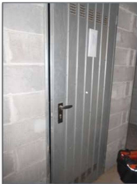
Foto 1 porta ingresso al magazzino/cantina