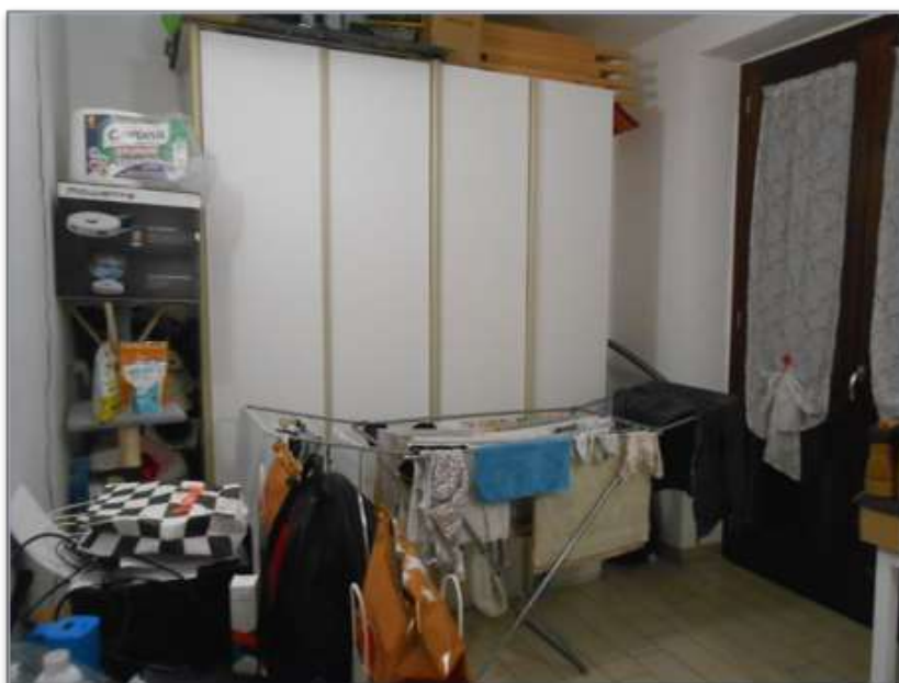
Foto 4 camera