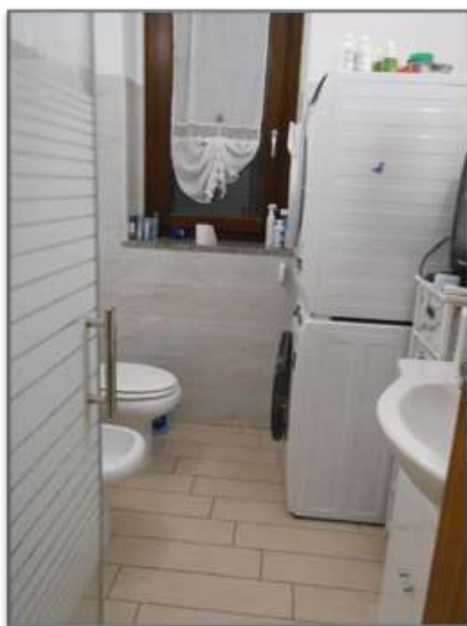
Foto 7 bagno