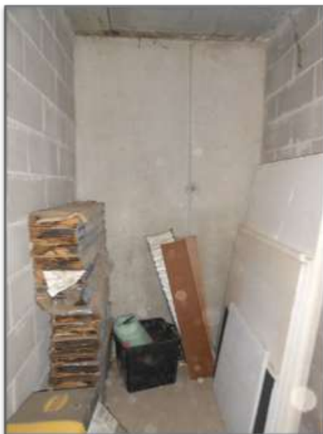
Foto 2 magazzino/cantina