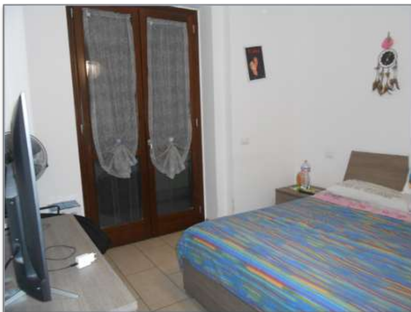
Foto 5 camera matrimoniale