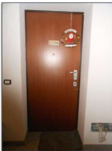
Foto 1 ingresso all'immobile