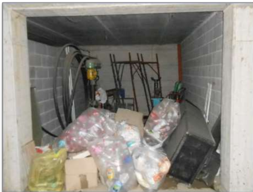
Foto 1 box