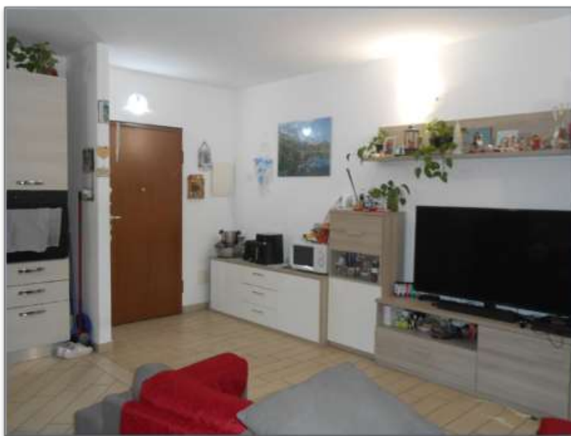
Foto 3 soggiorno