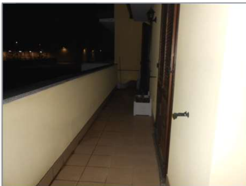
Foto 8 balcone