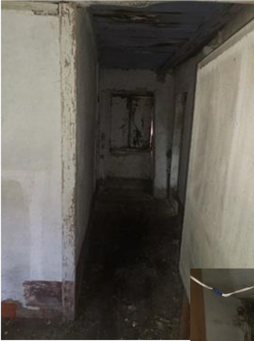
PIANO PRIMO CORRIDOIO