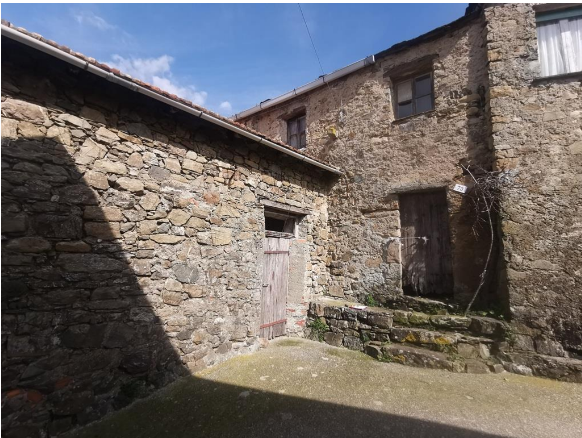
PROSPETTO SUD – OVEST