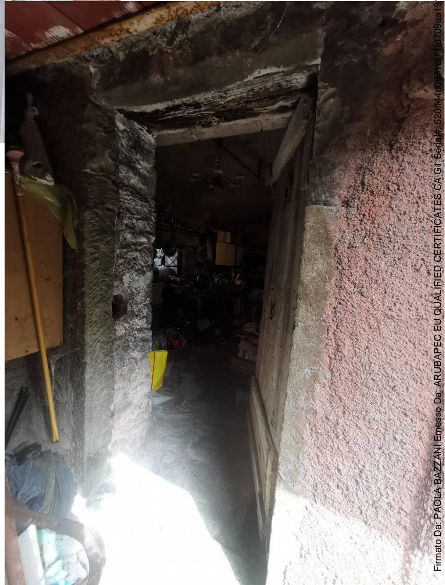
PIANO TERRA – INGRESSO AL DEPOSITO