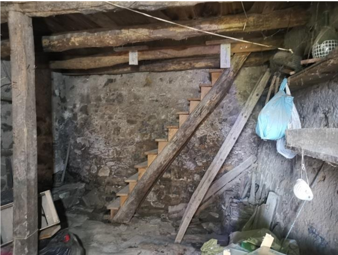
LOCALE D'INGRESSO – VISTA DELLA SCALA AL PRIMO PIANO