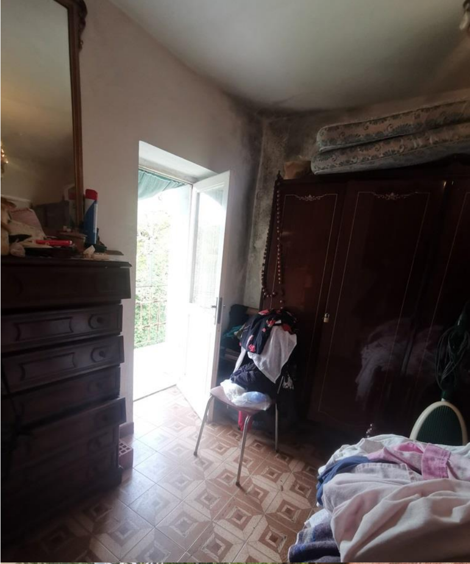
CAMERA CON VISTA SUL BALCONE