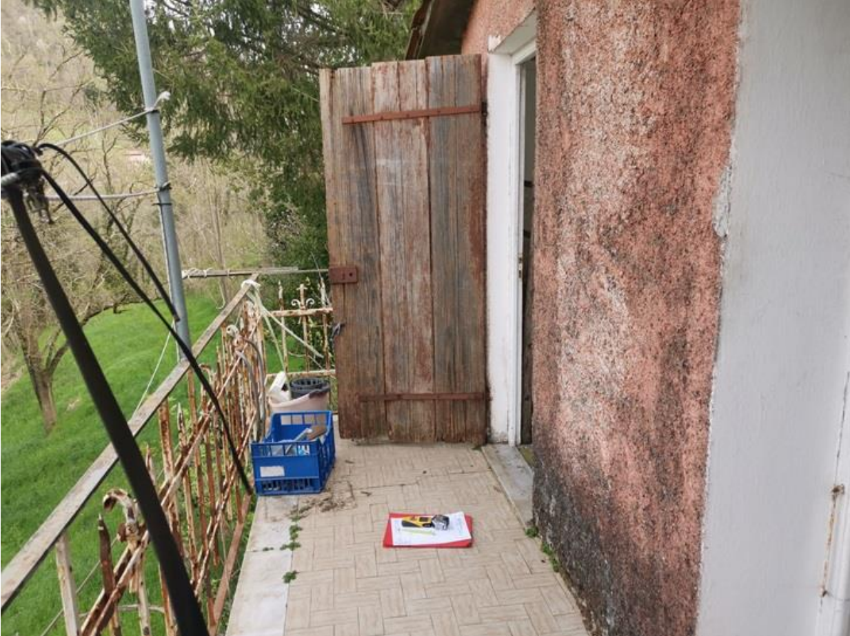
BALCONE CON VISTA DELLA PORTA DEL BAGNO