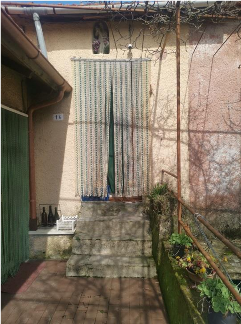
PORTA D'ACCESSO CIVICO 14