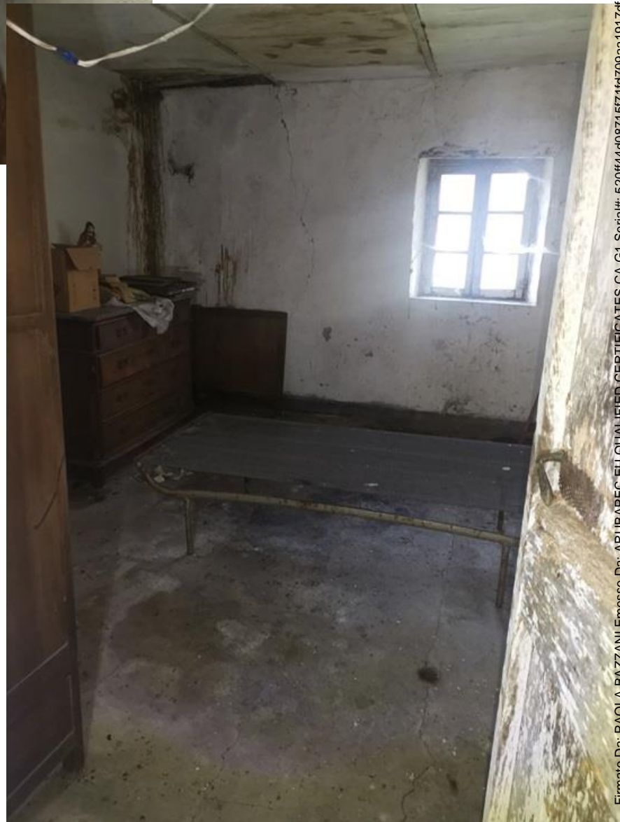
PIANO PRIMO LOCALE 1