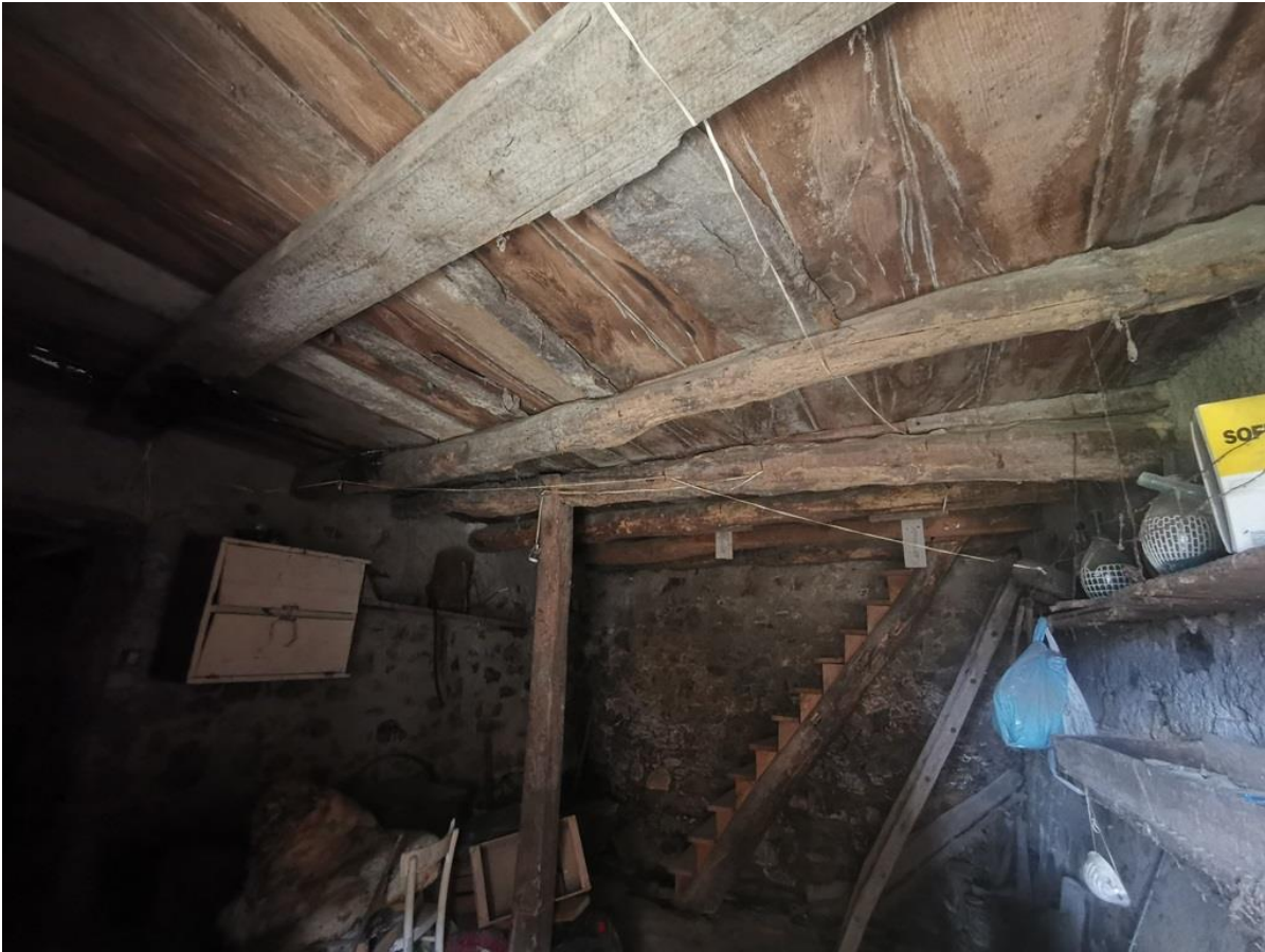
LOCALE INGRESSO PARTICOLARE DELL'ESTRADOSSO DEL SOLAIO DEL 1° PIANO