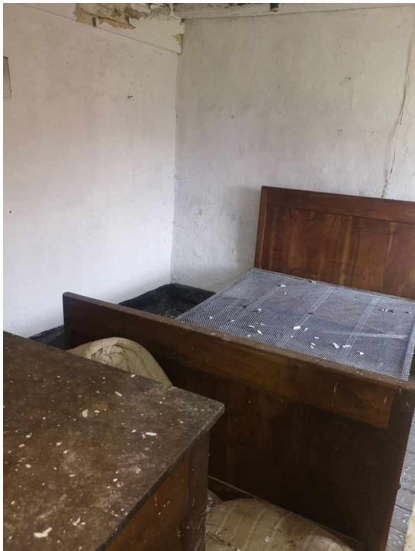
PIANO PRIMO – LOCALE 3