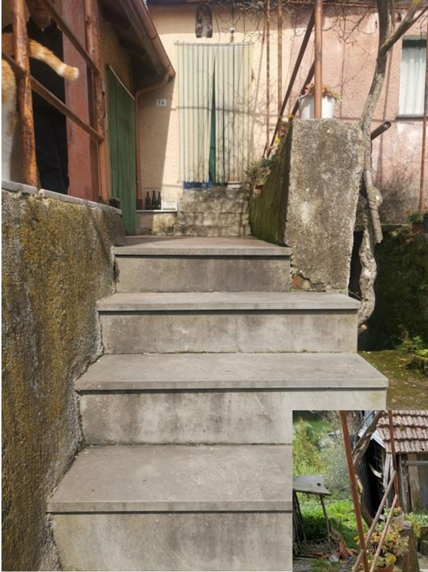
SCALE E TERRAZZO IN COMUNE CON UNITA' IMMOBILIARE CIVICO 12