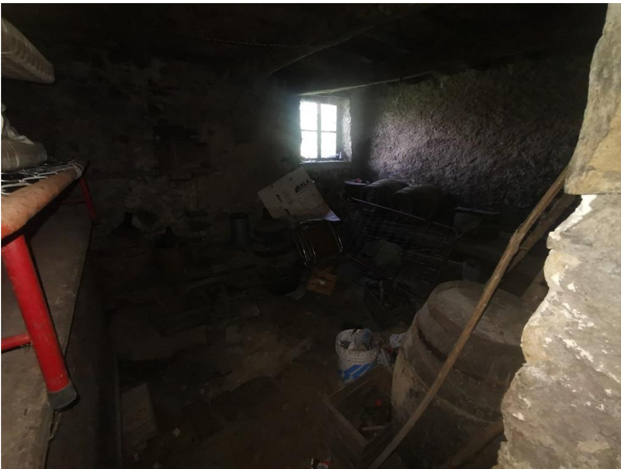
PIANO TERRA – DEPOSITO