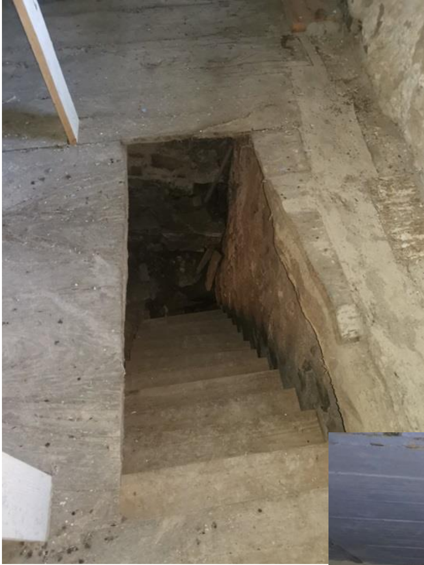
PIANO PRIMO – SCALA DAL P.T.