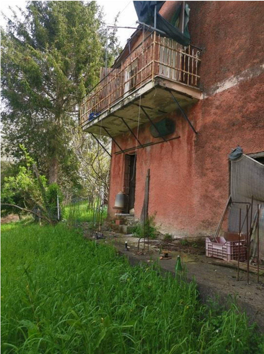
PROSPETTO NORD – OVEST – PARTICOLARE DELLA SOLETTA ESTERNA