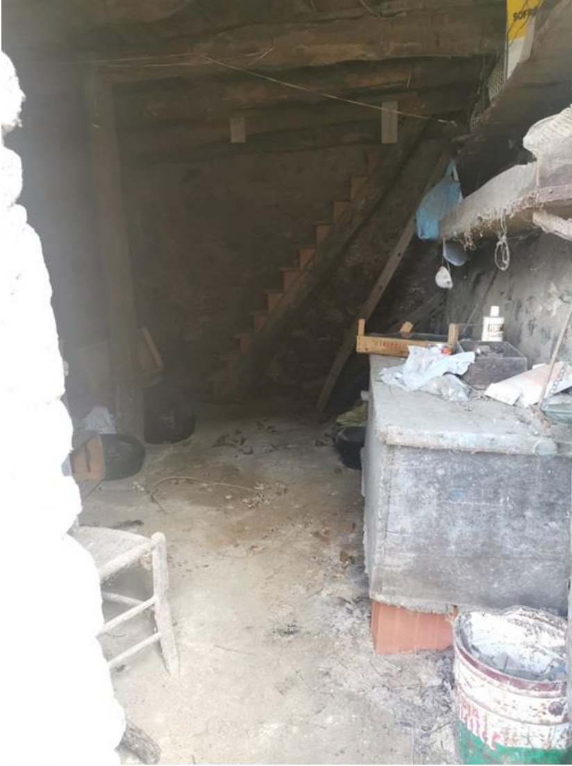
VISTA DALLA PORTA D'ACCESSO