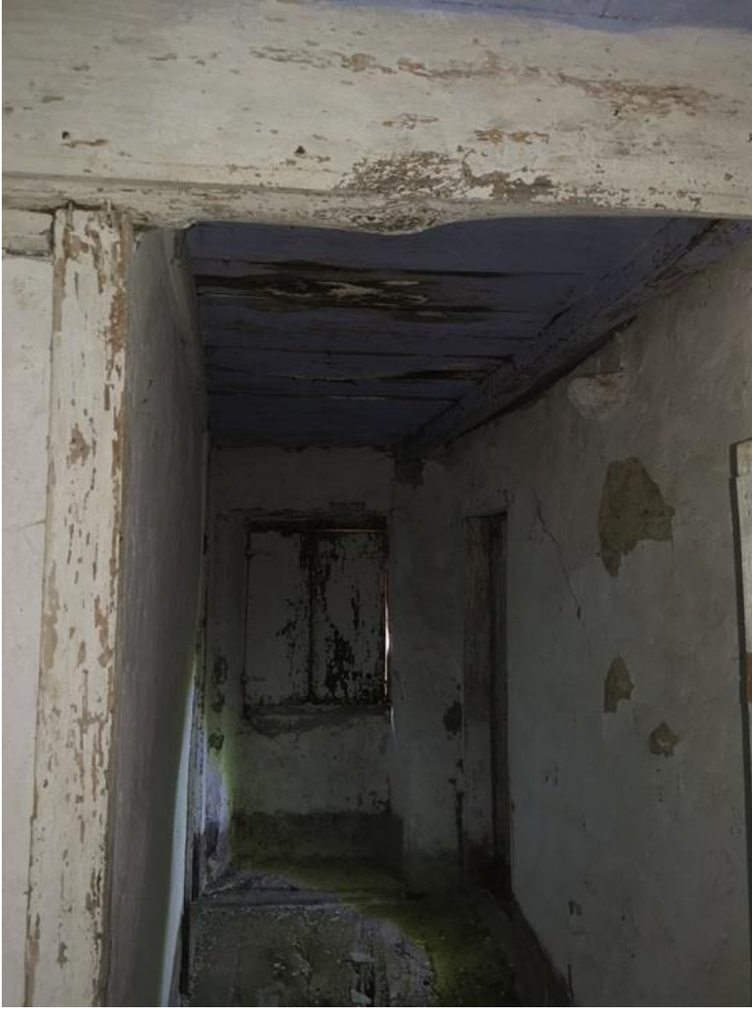
PIANO PRIMO CORRIDOIO – PARTICOLARE DELLE TRAVI AMMALORATE