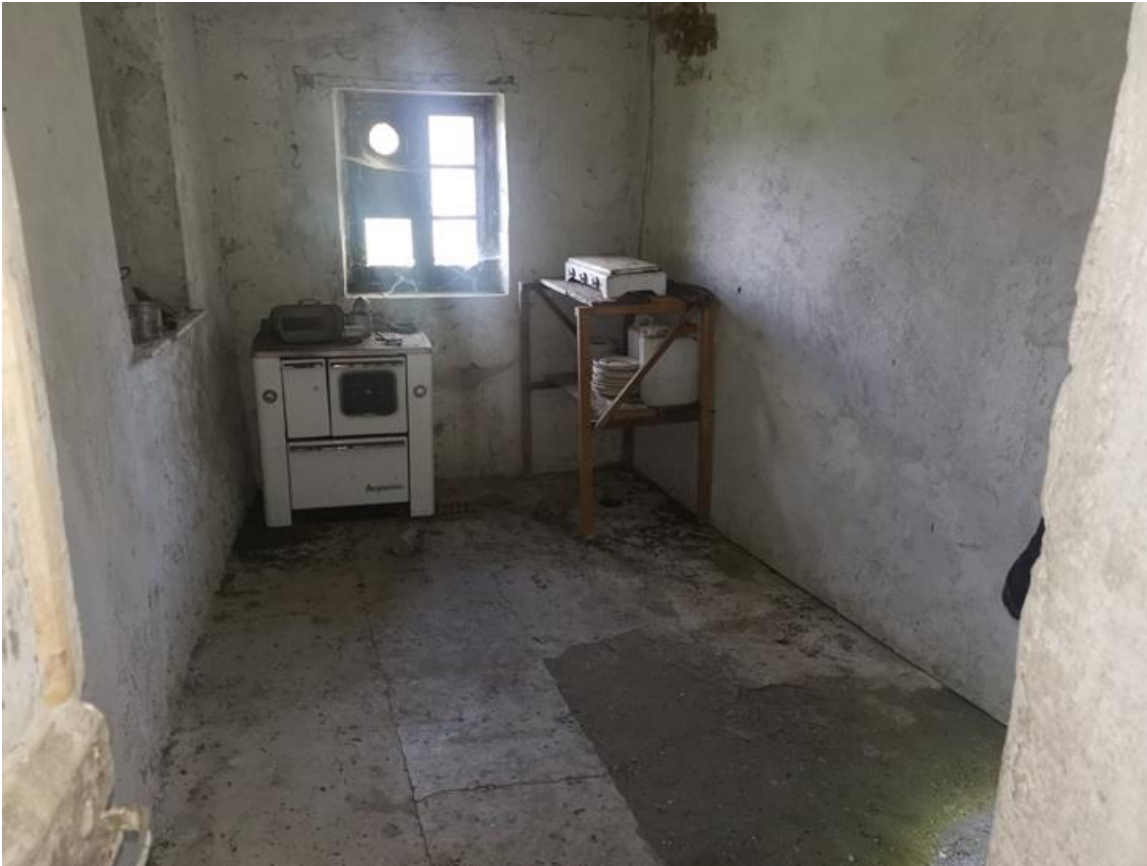
PIANO PRIMO LOCALE 2