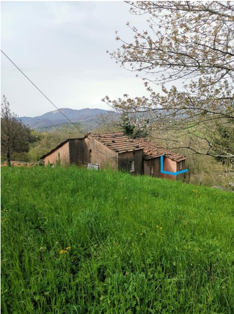
VISTA DALLA STRADA CARRABILE