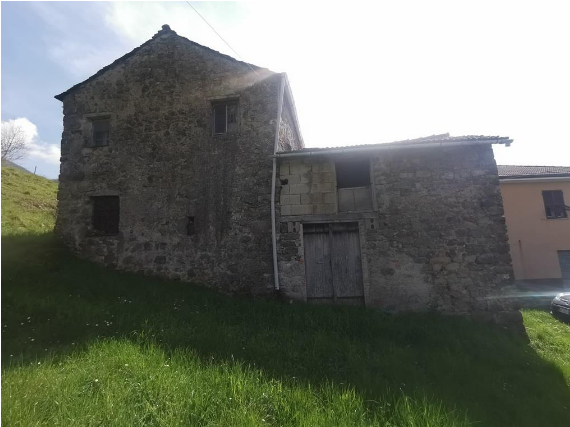
ESTERNO CON TERRENO – PROSPETTO NORD