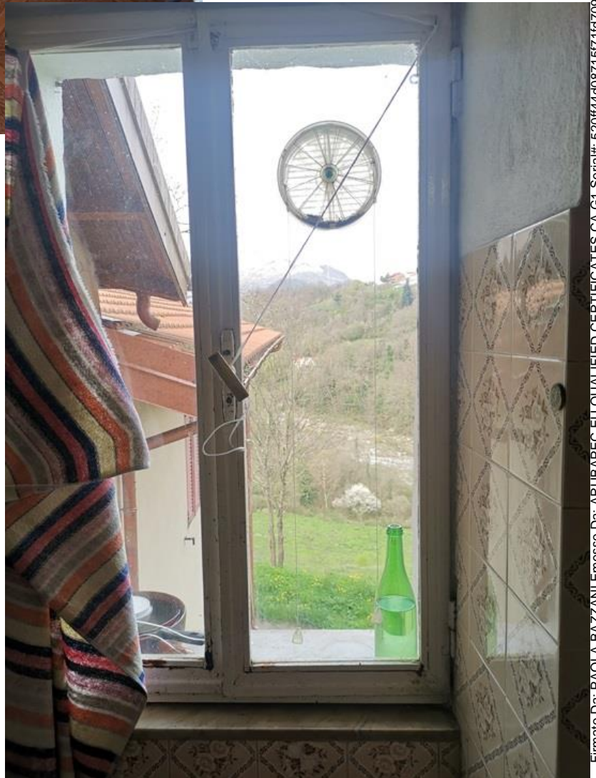
FINESTRA DELLA CUCINA