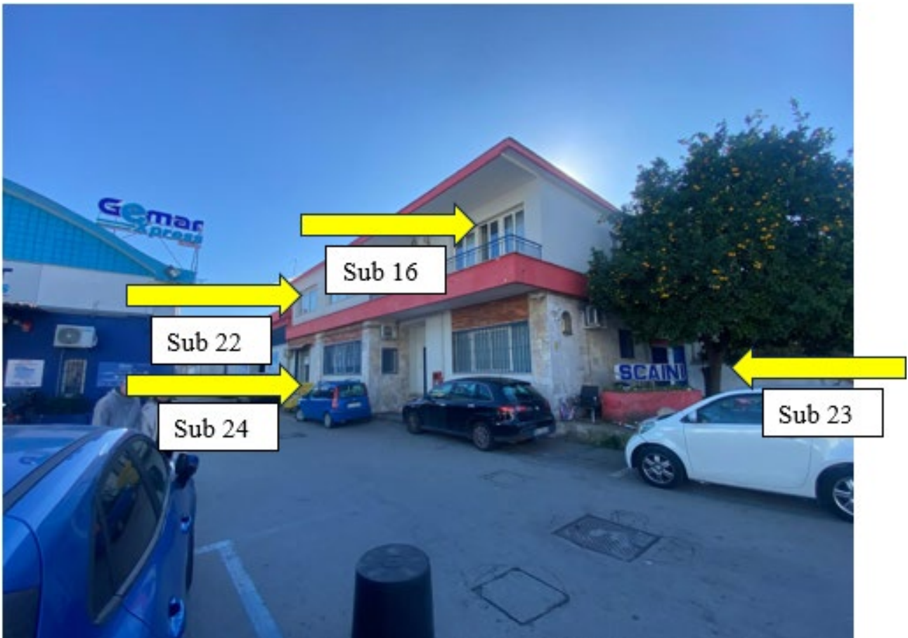
Particolare del fronte del fabbricato si individuano gli immobili staggiti oggetto del presente Lotto 3