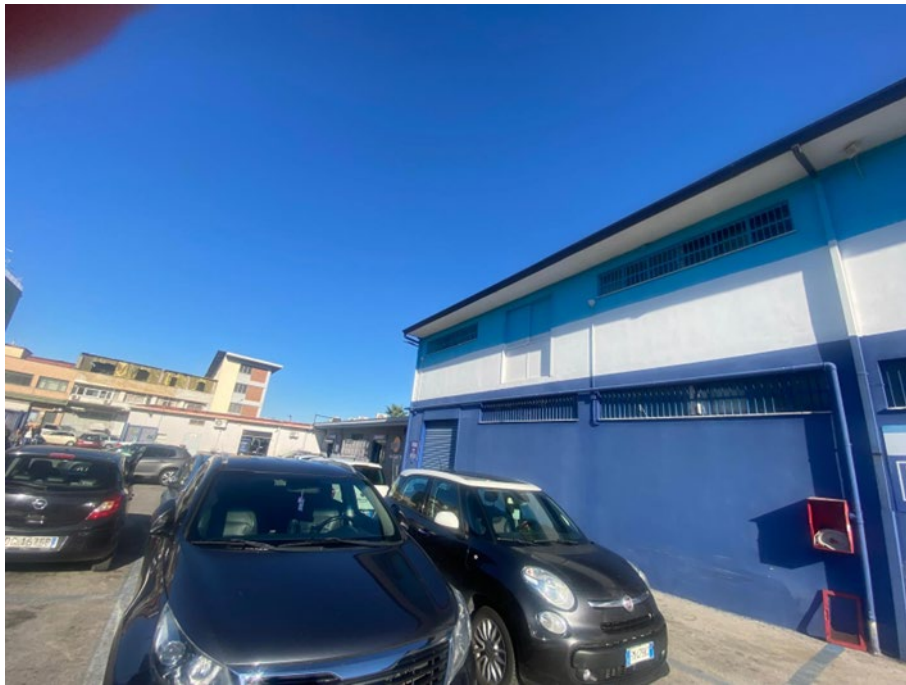
Particolare del fronte di ingresso del fabbricato