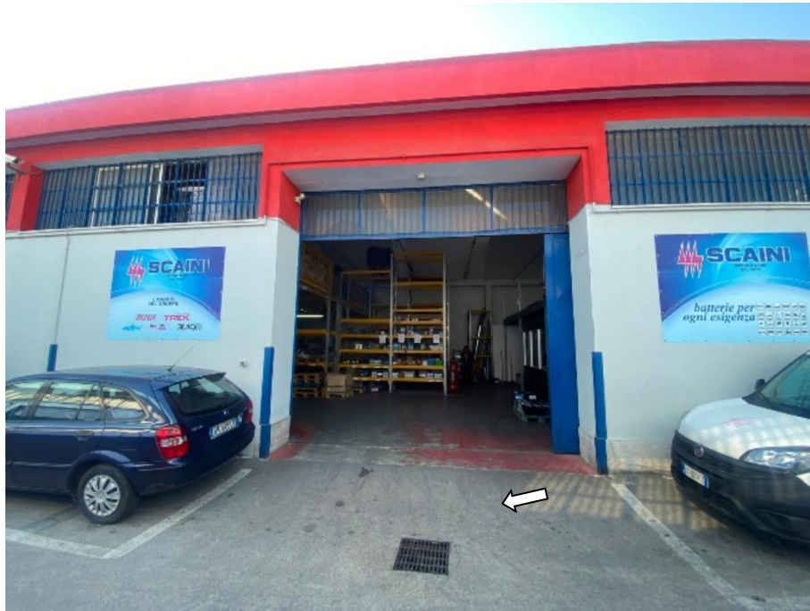
Vista dell'ingresso dal cortile comune