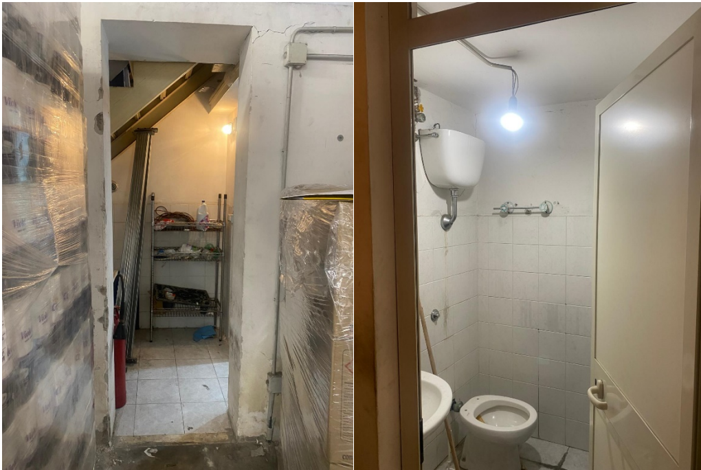
Vano antibagno e vano W.C.