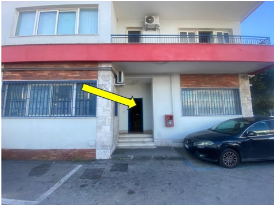
Particolare del fronte del fabbricato si individua l'accesso all'immobile staggito