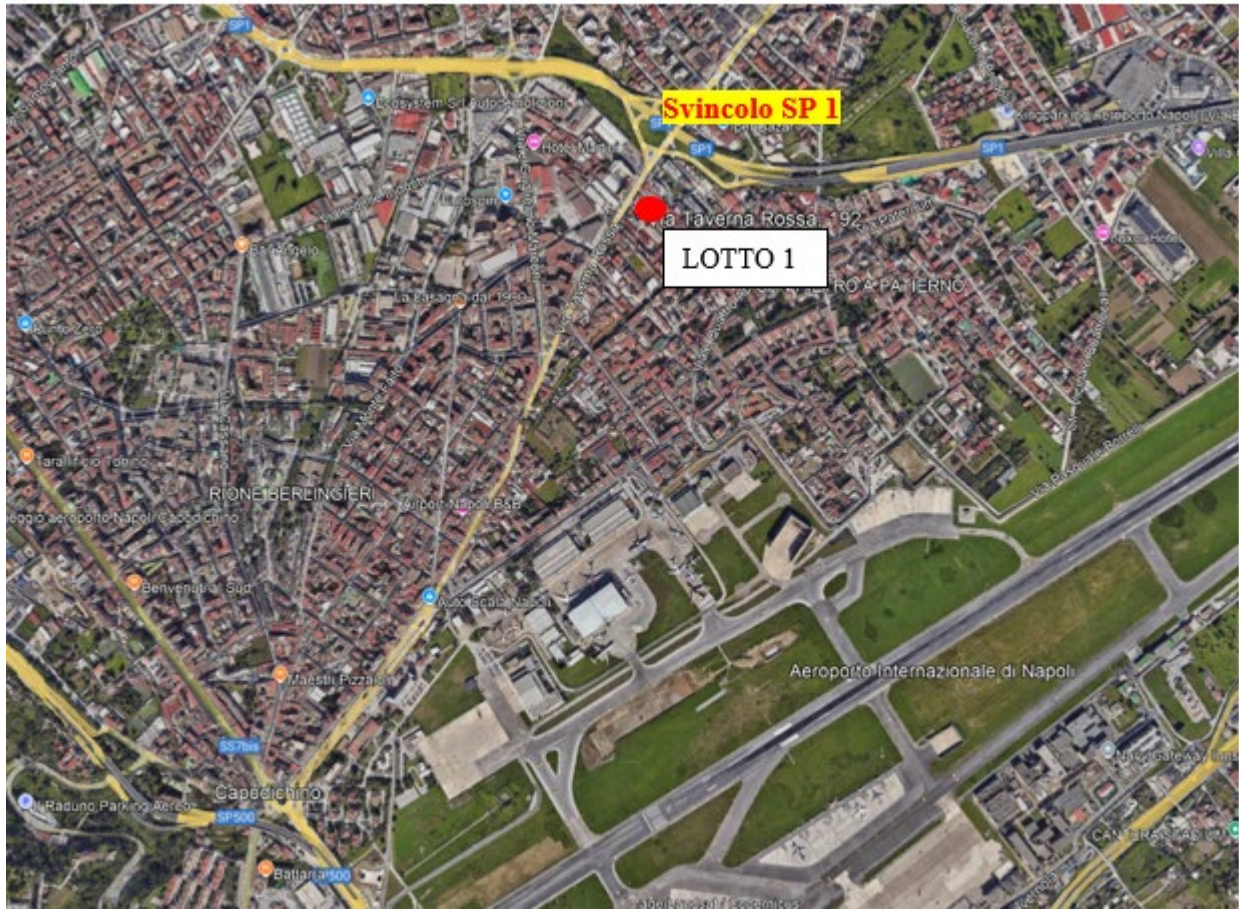
Contesto urbano con indicazione del fabbricato