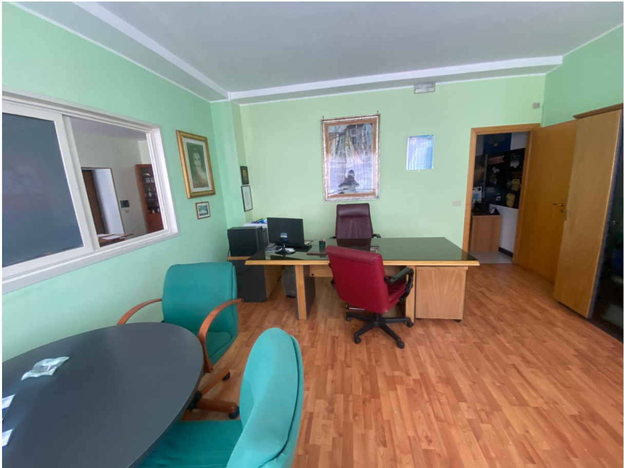
Vano Ufficio 2