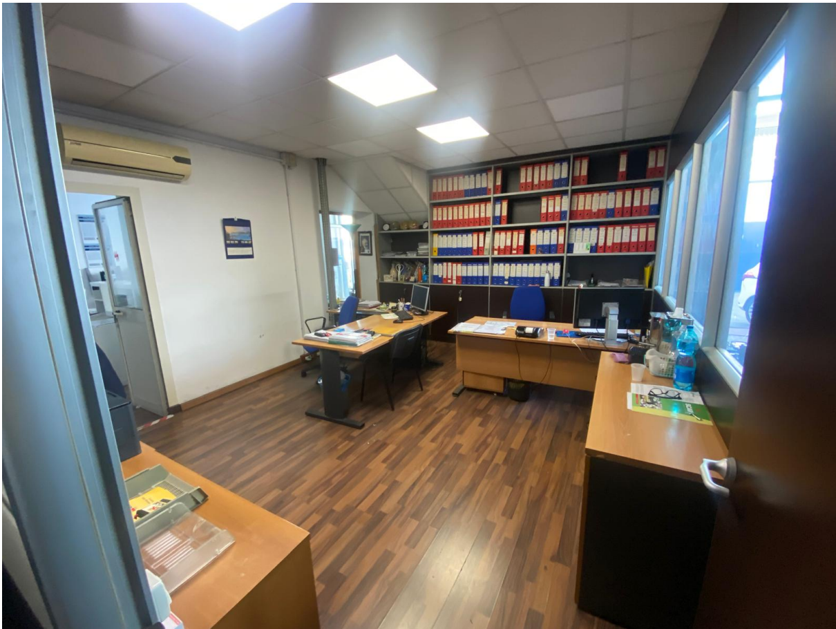
Ufficio posto al piano terra