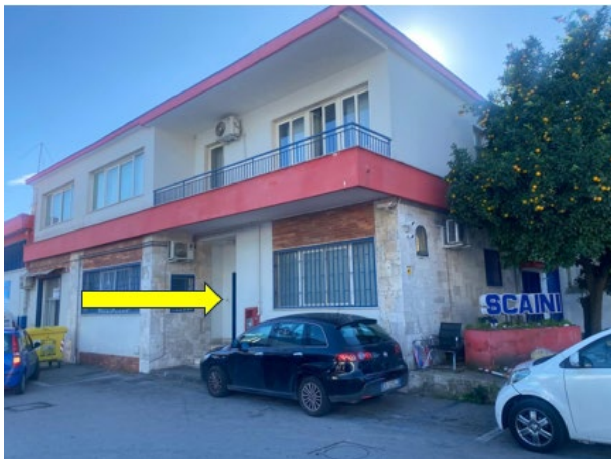
Particolare del fronte del fabbricato si individua l'accesso all'immobile staggito Sub 15