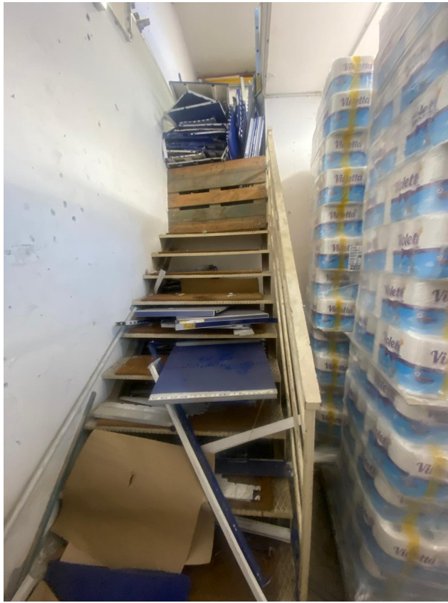
Scala di accesso al Vano 2 posto al piano primo