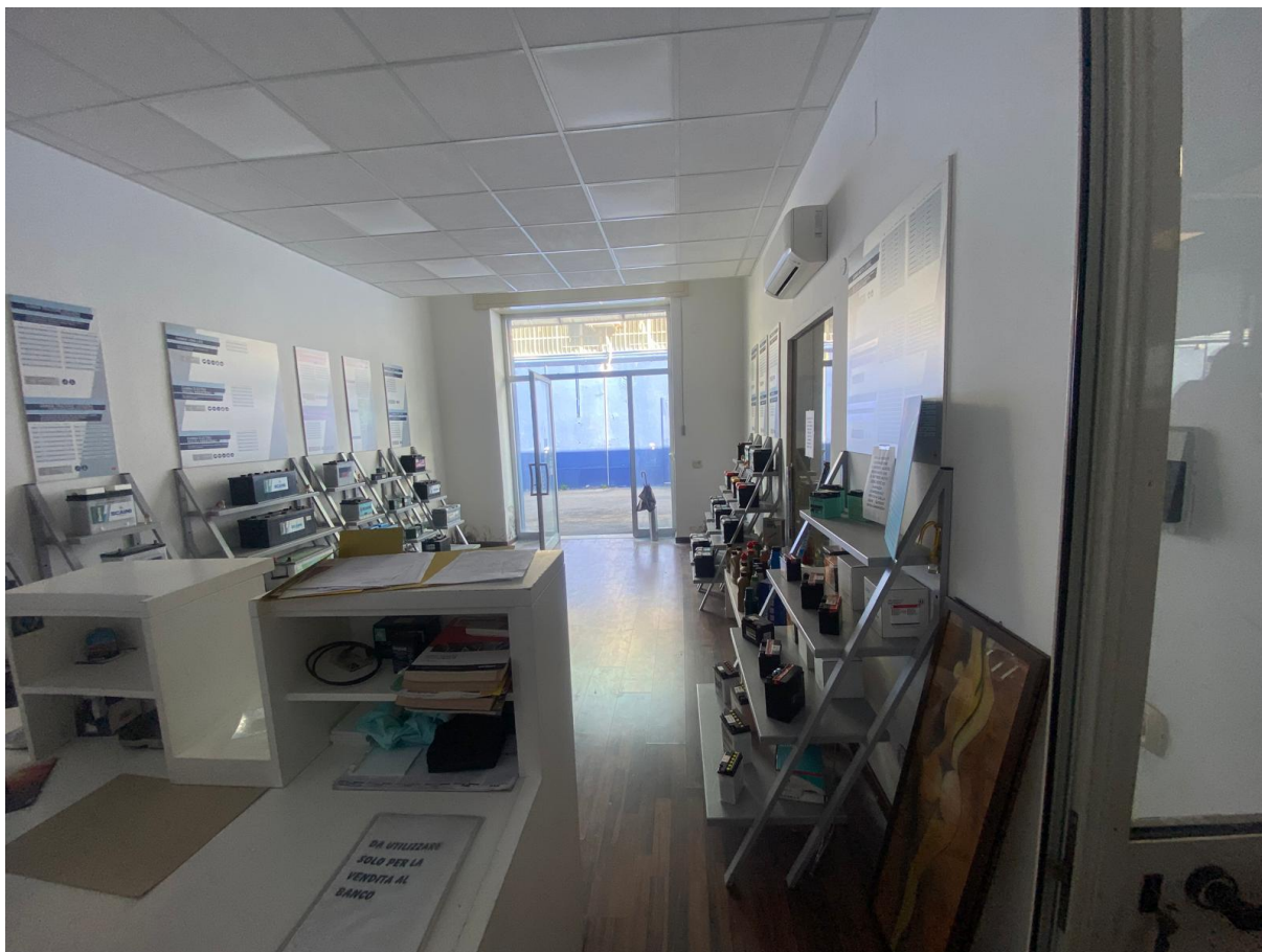
Vista verso l'ingresso