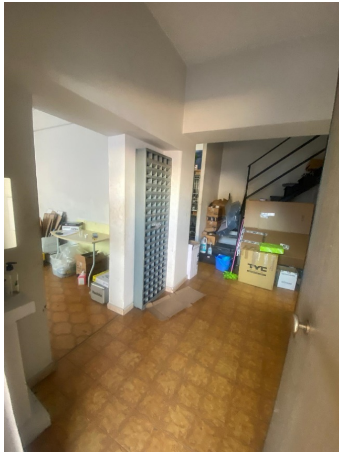
Vista del disimpegno dall'ingresso