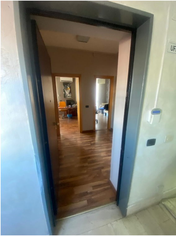
Vista dell'ingresso dall'atrio di piano comune