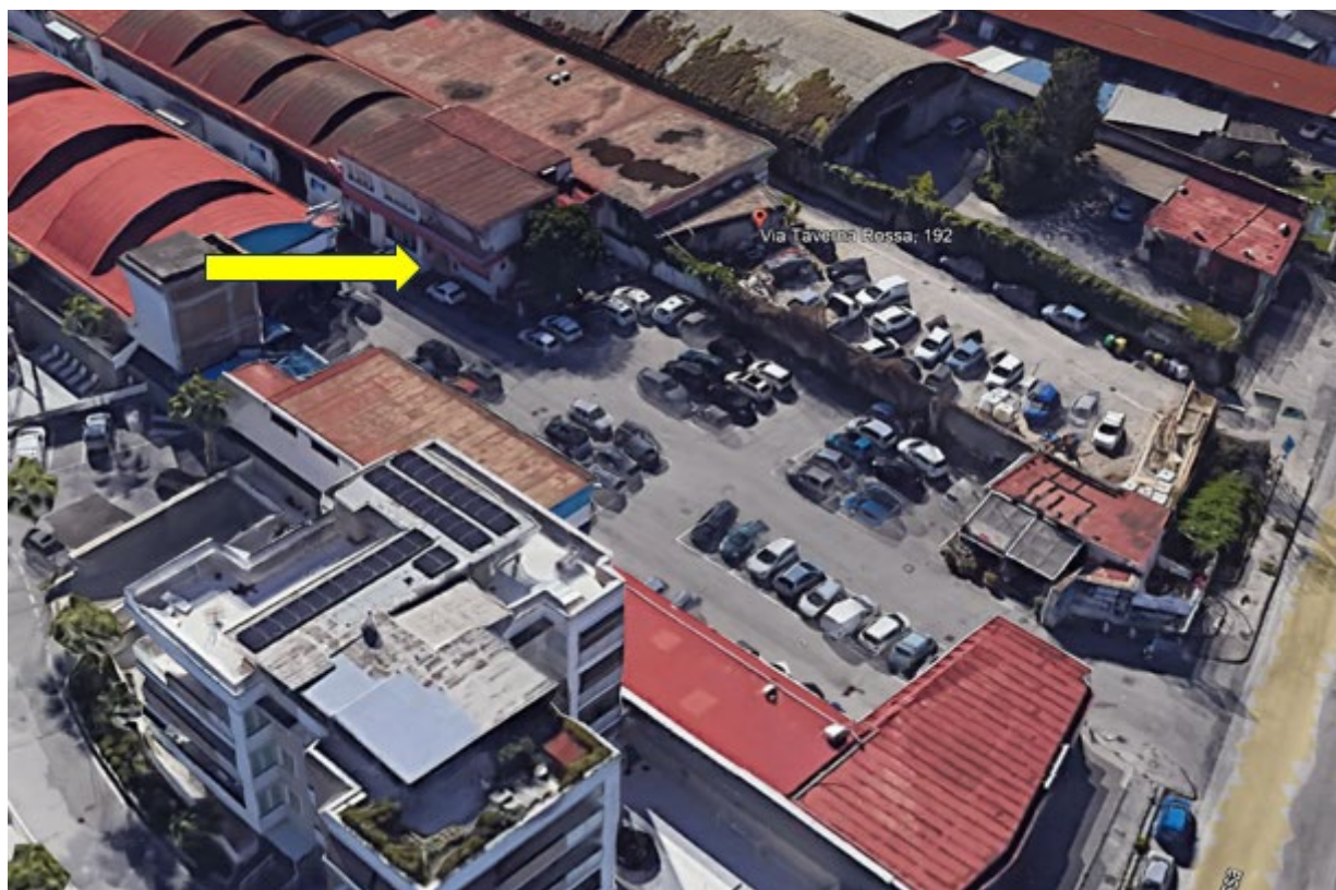
Immagine satellitare ed individuazione del fabbricato