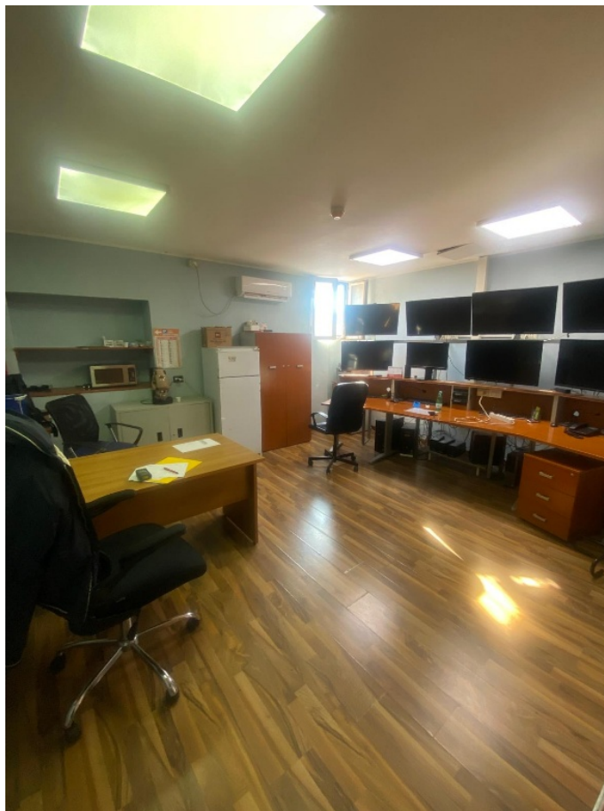
Vano Ufficio 3