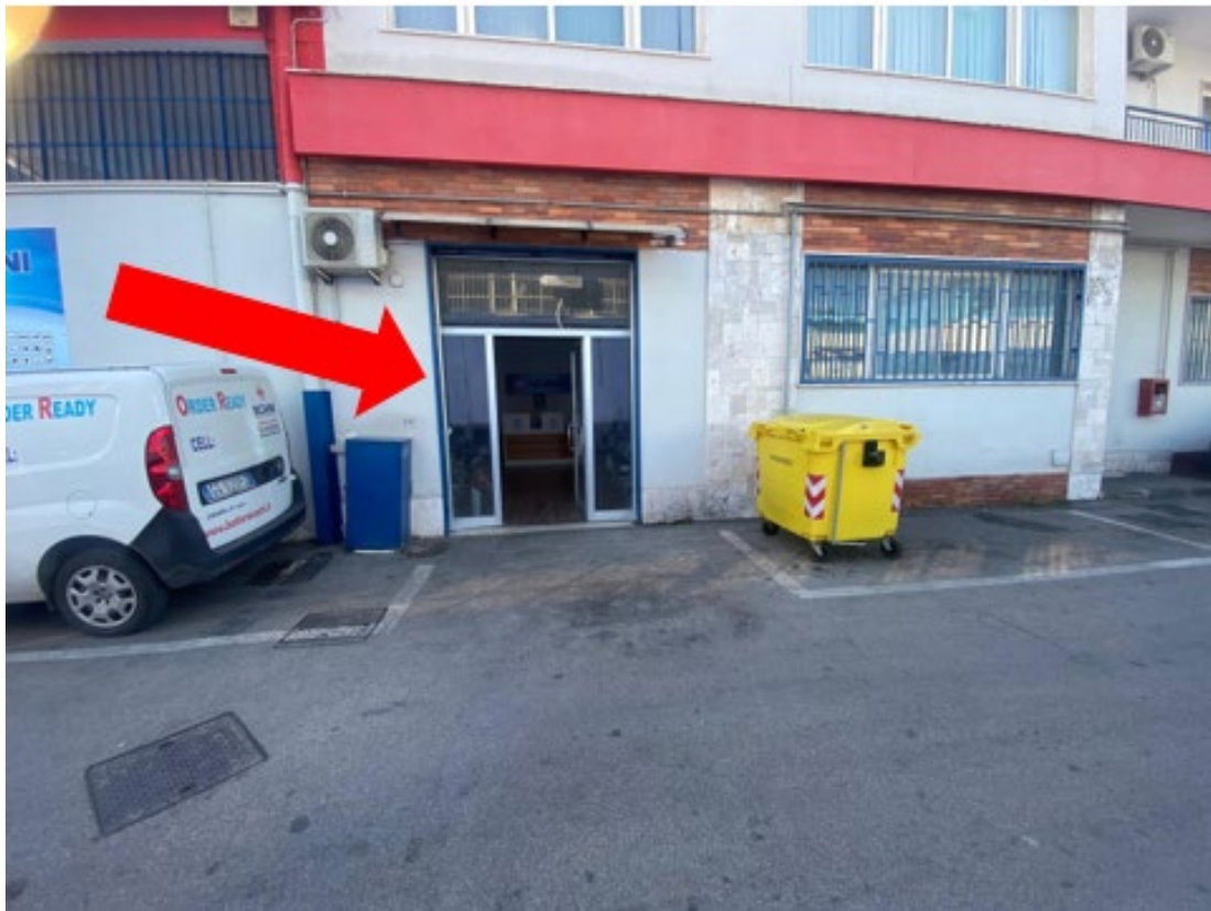
Si individua l'accesso al sub 24