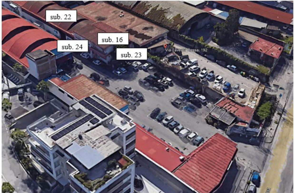
Immagine satellitare ed individuazione dei sub costituenti il Lotto 3 (Google Earth)