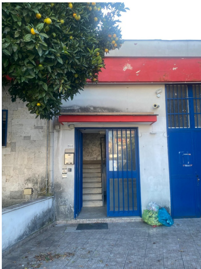
Vista dell'ingresso alle scale comuni dal cortile