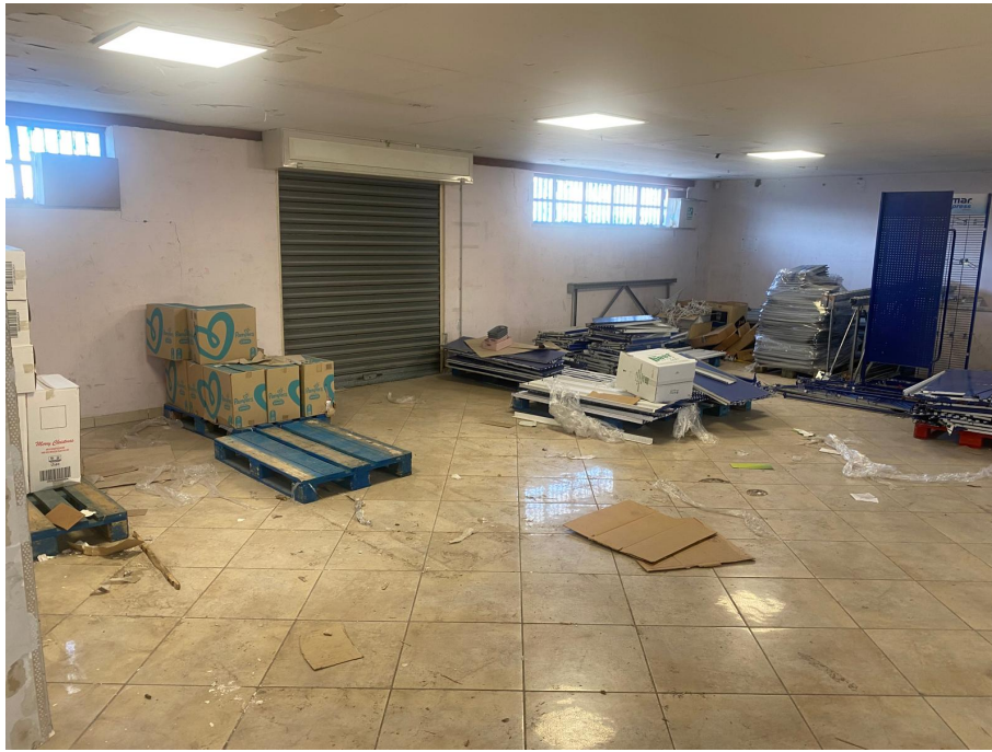
Vano 2 posto al piano primo