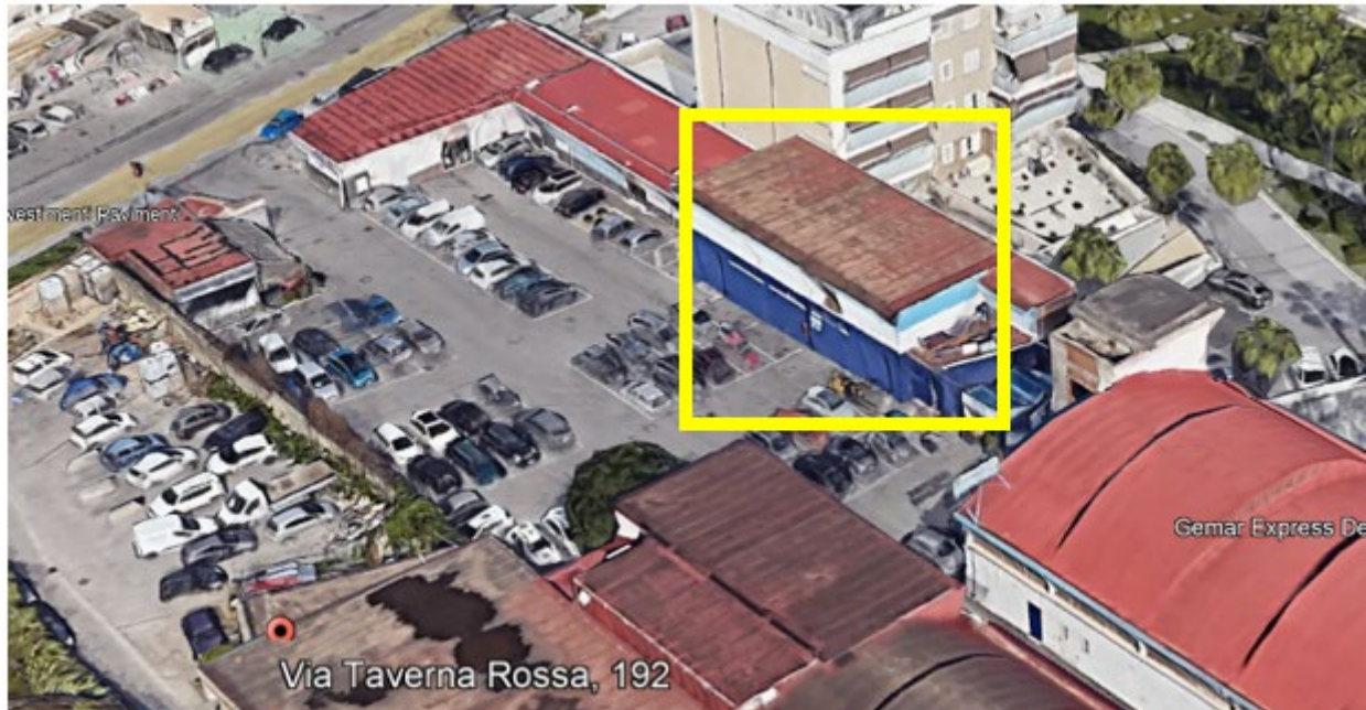
Foto Satellitare Google Earth, Si individua l'accesso al fabbricato