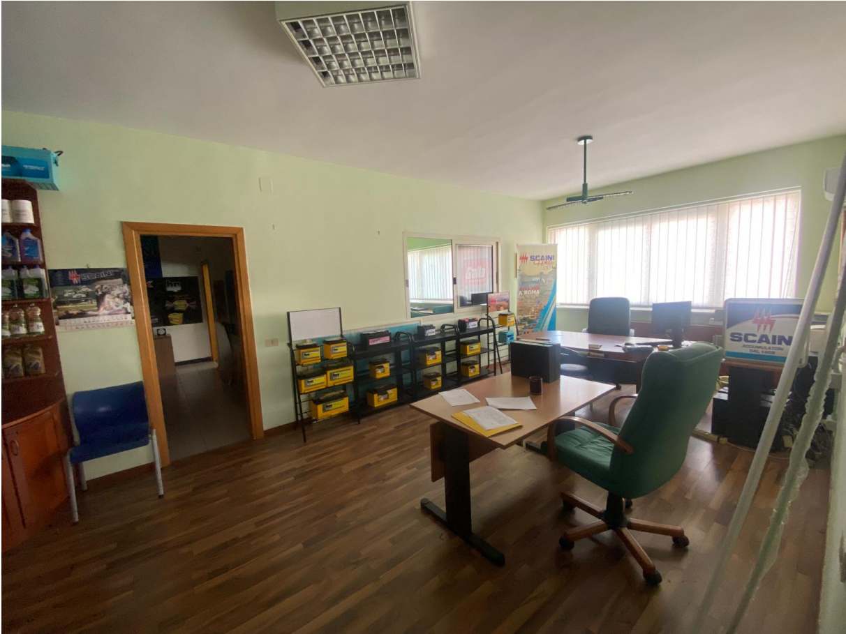
Vano Ufficio 1