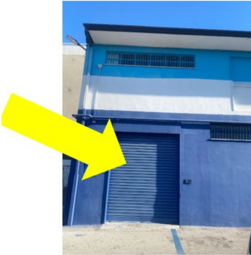
Particolare del fronte del fabbricato si individua l'accesso all'immobile staggito