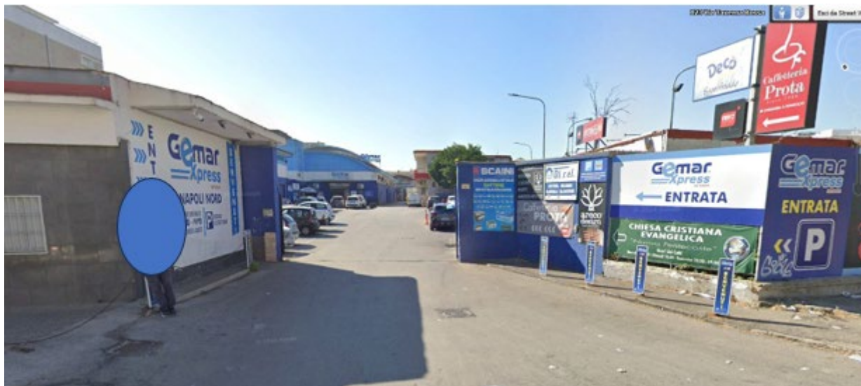
Immagine satellitare ed individuazione dell'accesso all'area sulla quale insiste il compendio staggito (Google Earth)