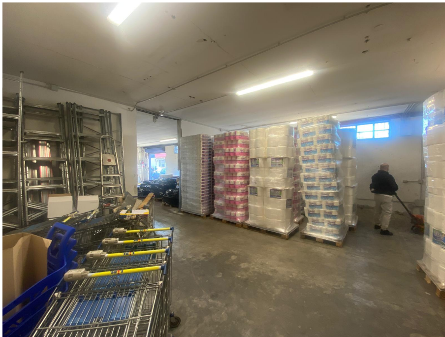
Vano Piano Terra