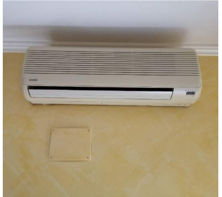
Imm. 15-16 Vista della caldaia posta all'interno della cucina, e del climatizzatore nella zona giorno.