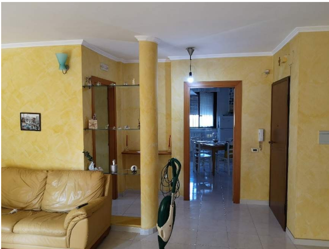
Imm. 3-4 Vista dell'ingresso dal vano scale condominiale e della zona giorno dell'appartamento al piano rialzato, composta da soggiorno e cucina abitabile. Il soggiorno, ha doppio affaccio, verso il giardino privato su via Vecellio.