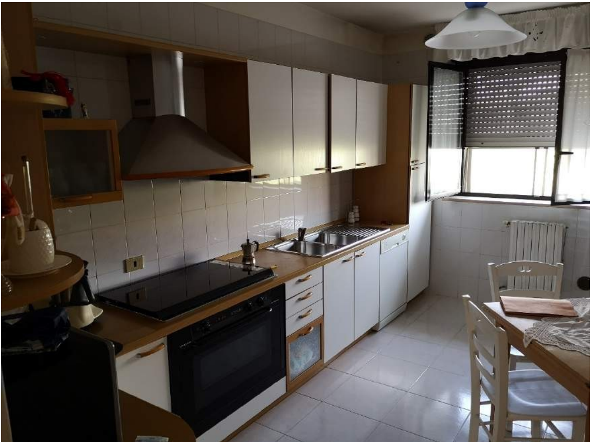
Imm. 5-6 Vista della cucina abitabile, con affaccio su via Giambellino. Rivestita con piastrelle in ceramica di colore bianco a tutt'altezza. L'appartamento ha termosifoni in ghisa.