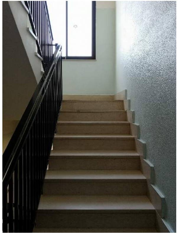
mm. 23-24 Vista del vano scale condominiale, con gradini in pietra e pareti rivestite di colore celeste.