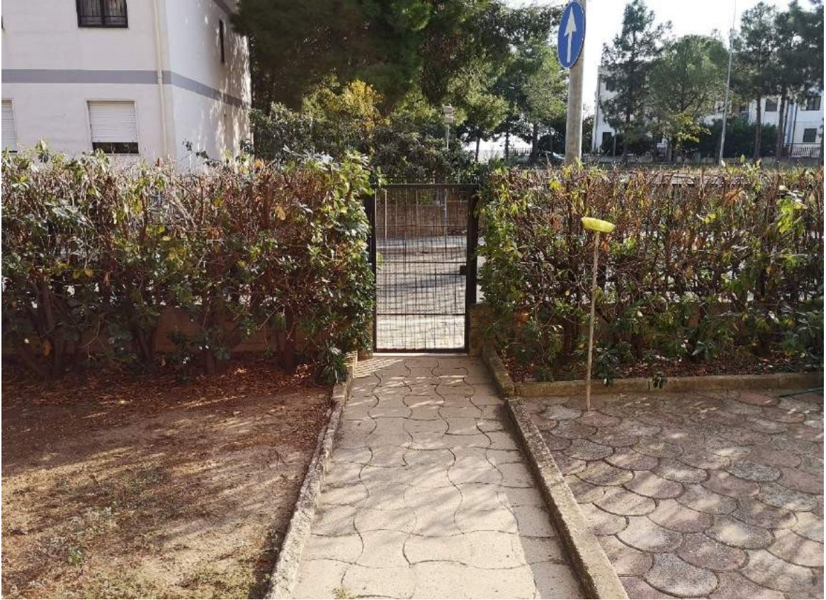
imm. 18 Vista dell'ingresso al giardino da via Vecellio, tramite cancello pedonale. Il giardino è delimitato con recinzione metallica bassa. Pavimentazione autobloccante in cemento, da esterni.