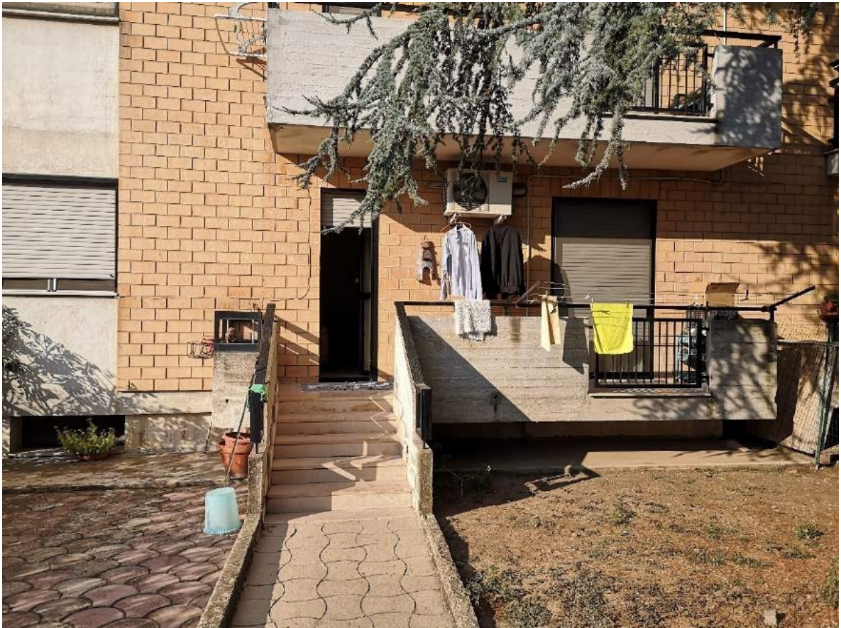
Imm. 17 Vista dell'immobile al piano terra, su via Vecellio, affaccio retrostante su giardino privato di pertinenza esclusiva. Fabbricato rivestito con laterizio e intonacato. Balconi in cemento.