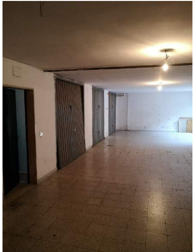
mm. 25-26 Vista del vano scale che conduce al piano dei box, posto al livello S-1. Vista della corsia di manovra dei box, con accesso da via Vecellio. Pavimentazione in marmette carrabili e pareti di colore bianco.