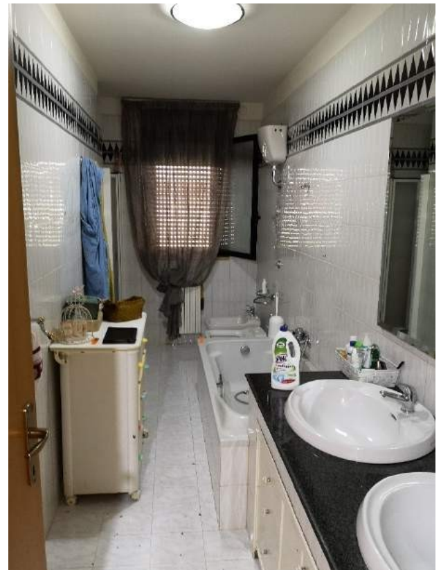
Imm. 9-10 Vista del bagno a servizio dell'abitazione, con rivestimento in ceramica colore bianco sfumato, come il pavimento e greca decorativa sommitale di colore nero alle pareti. Il bagno è dotato di doppio lavabo e di tutti i sanitari: wc, bidet, vasca e doccia in nicchia.