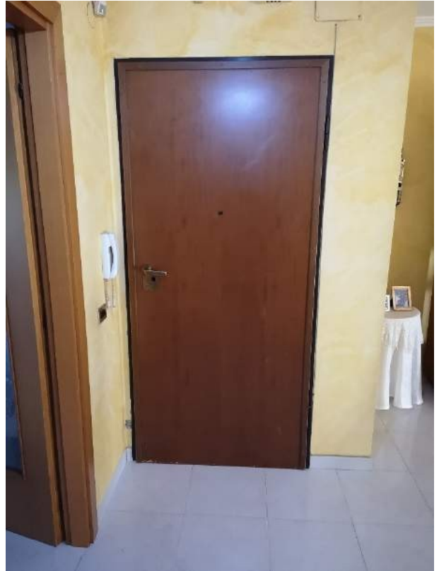
Imm. 7-8 Vista del disimpegno d'ingresso con porta blindata verso il vano scale condominiale e cucina sulla destra, e del corridoio della zona notte con il ripostiglio in fondo, camera matrimoniale e bagno sulla destra e cameretta a sinistra.