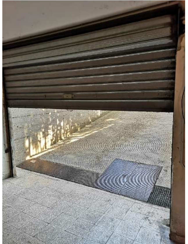
Imm. 27-28 Vista della rampa dei box con serranda carrabile e del box di proprietà xxxxxxxxxxxxxxxx, identificato al sub.56, con finestra alta su via Giambellino.