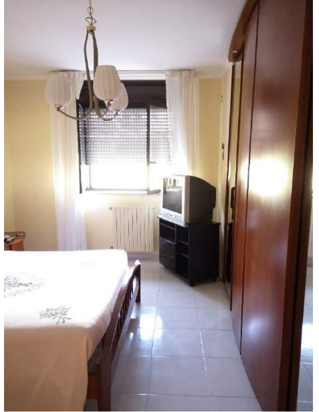
Imm. 11-12 Vista della camera da letto matrimoniale con affaccio su via Giambellino. Pareti tinteggiate di colore giallo effetto stucco, pavimentazione in ceramica chiara venata come il resto dell'appartamento.