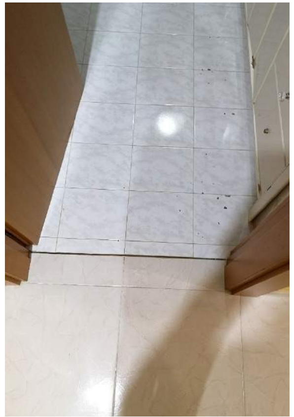
Imm.13-14 Vista del vano ripostiglio in fondo al corridoio. Vista dei diversi tipi di pavimentazione all'interno.