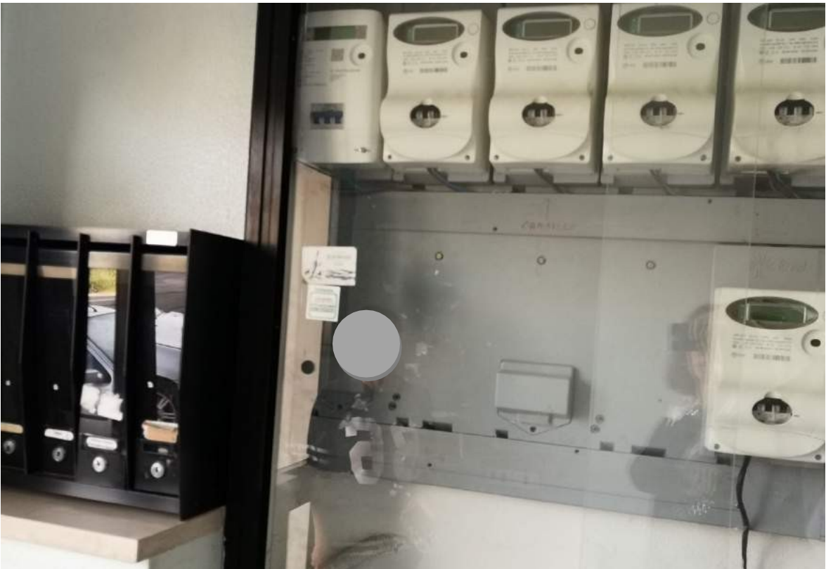
Imm. 22 Vista delle cassette postali e del vano contatori all'interno del vano scale condominiale, con accesso pedonale da via Giambellino.