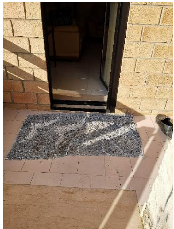
mm. 19-20 Vista del prospetto retrostante e della pavimentazione sul balcone verandato verso il giardino privato. Infissi in anticorodal di colore nero e zanzariere.