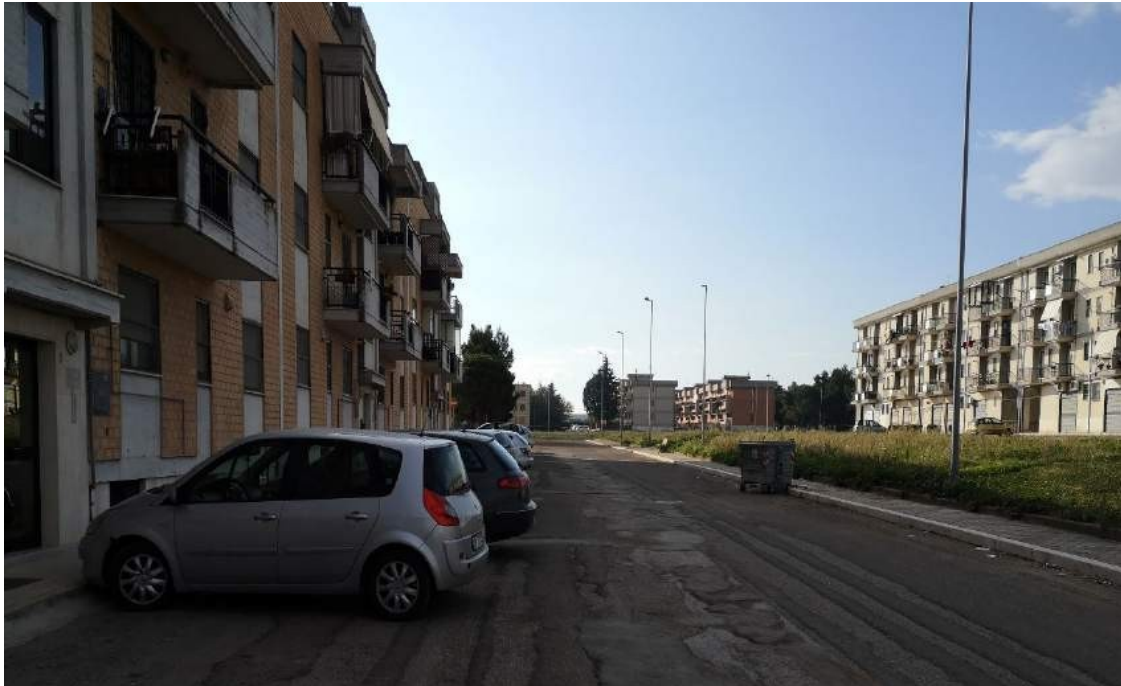
Imm. 2 Vista della pubblica via di accesso al vano scale condominiale, del fabbricato ove è sito l'immobile pignorato, via Giambellino, nella zona 167 del Comune di Stornara.