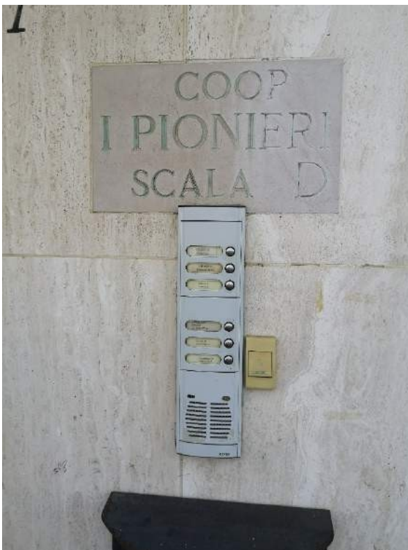
Imm. 29 Vista del citofono al civico 7 di via Giambellino.