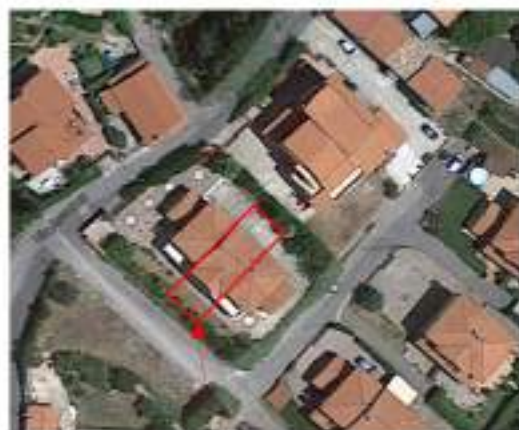
Porzione di fabbr. in oggetto