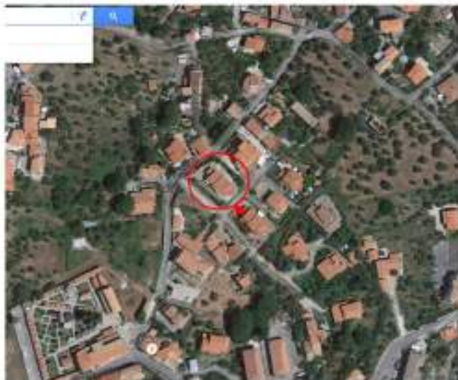
Edificio a schiera cui fa parte la porzione di fabbr. in oggetto

accesso all'immobile precitato è garantito dalla vicina strada comunale denominata Via dell'Assunta interposta tra la principale strada provinciale SP 86, che collega il centro urbano di Marano M. con i propri territori vallivi, nonché con le città di Rende e Cosenza. Altresì dista dallo snodo autostradale di Cosenza Nord a circa 9 Km.