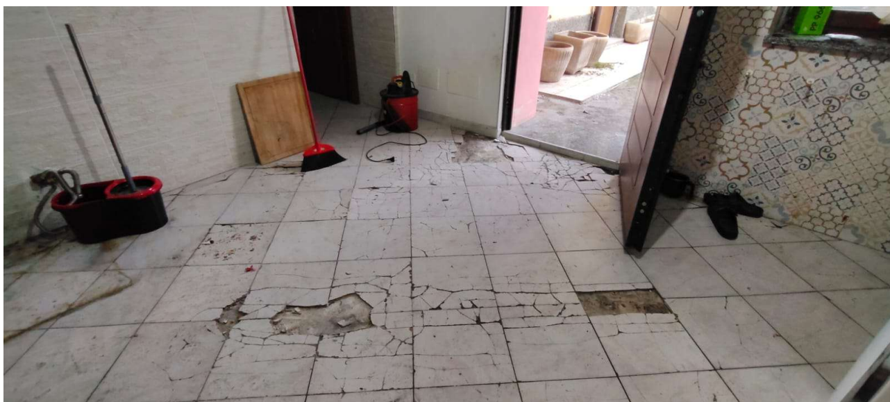
Lo stato manutentivo della pavimentazione del locale soggiorno