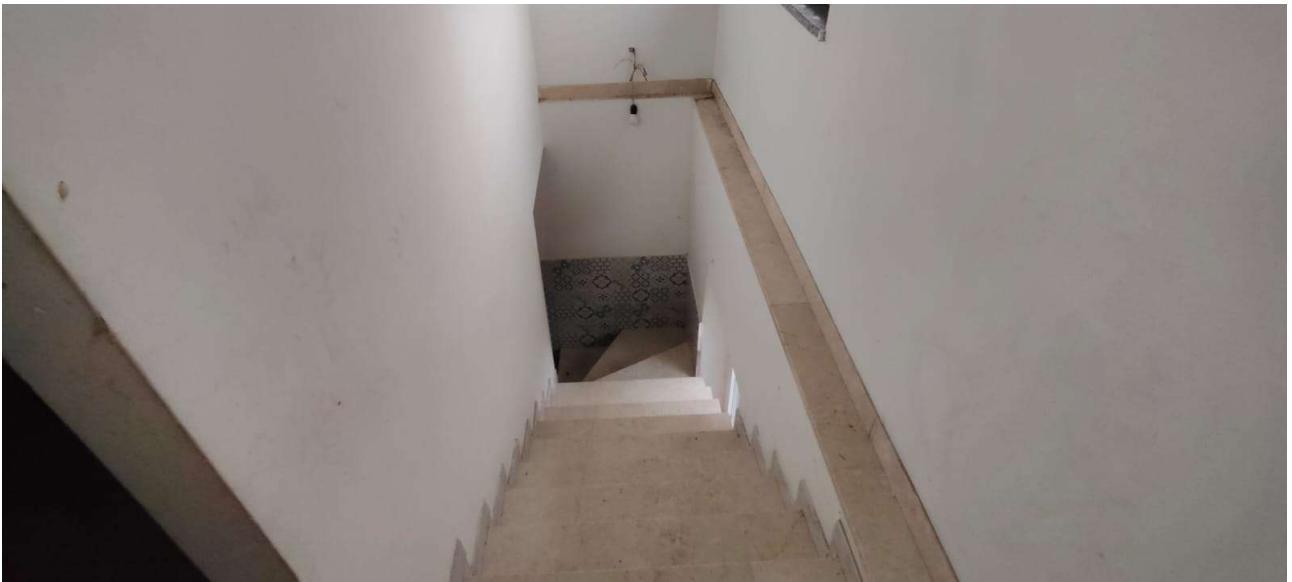
La scala di collegamento al piano 1