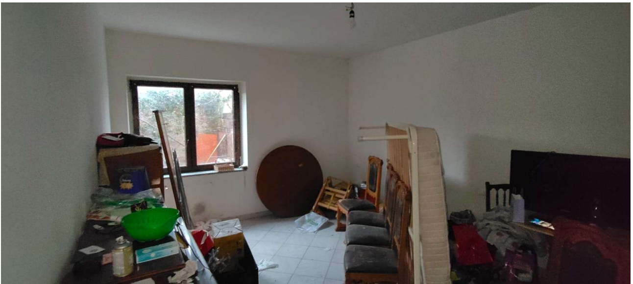
Il secondo locale al piano terra