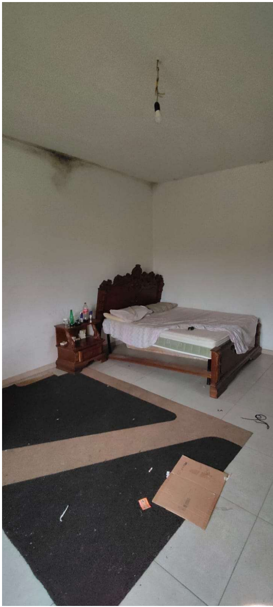
Camera da letto al piano 1