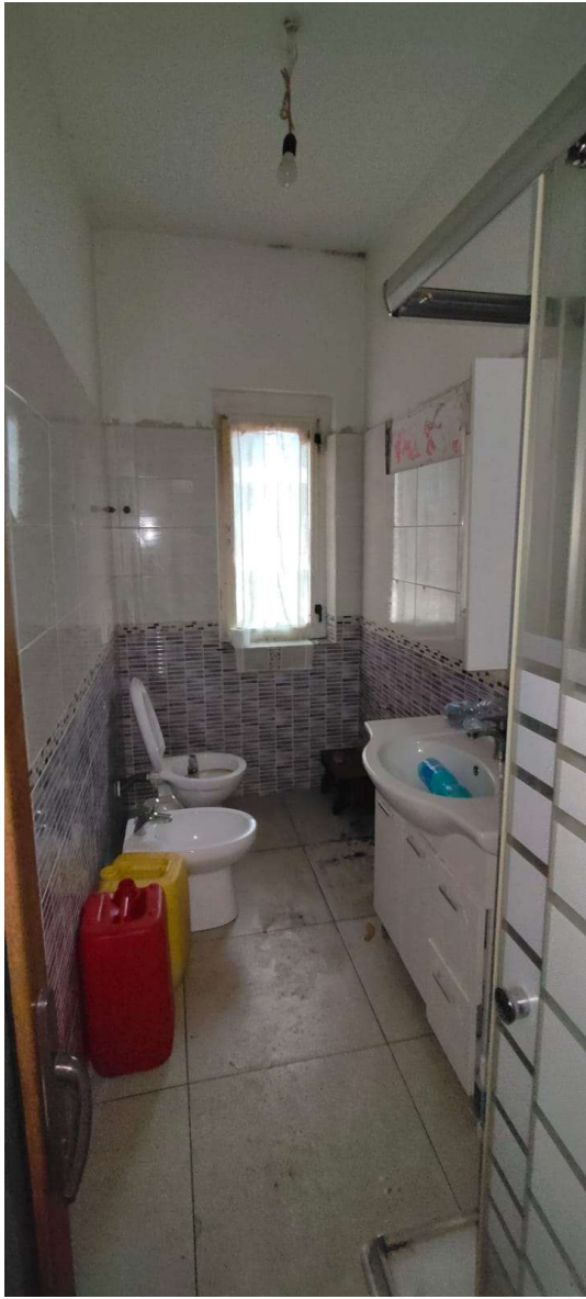
Bagno al piano 1