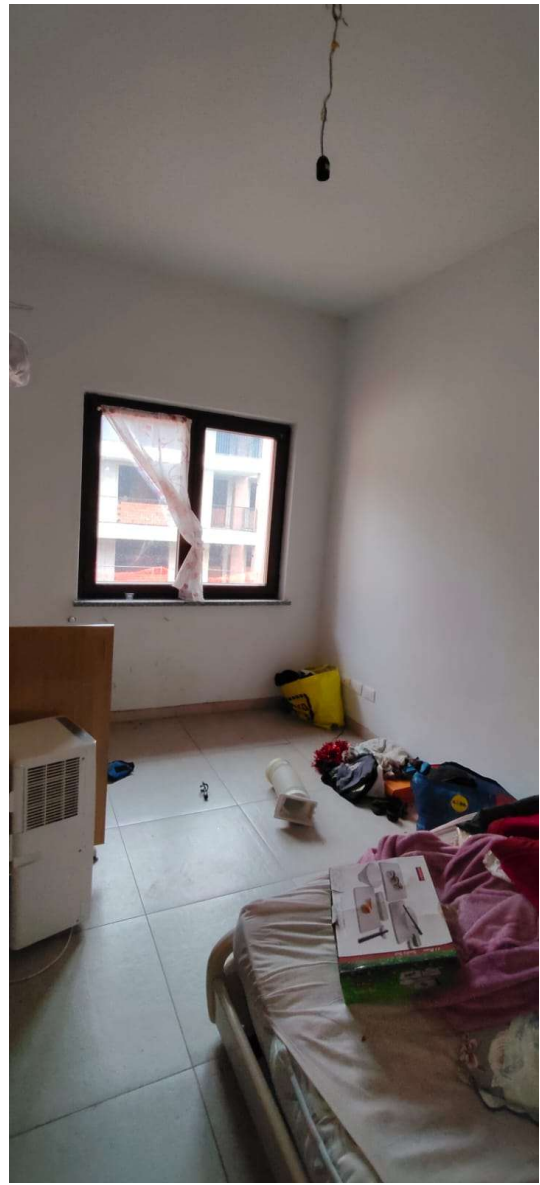
Camera da letto al piano 1