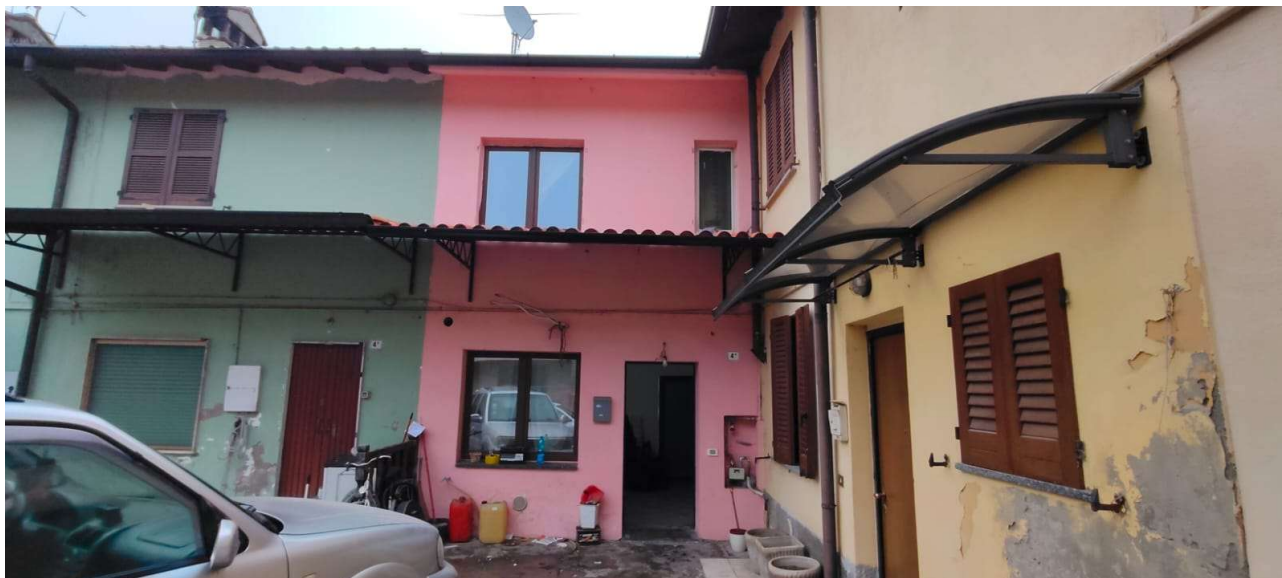
Prospetto dell'unità immobiliare oggetto di valutazione