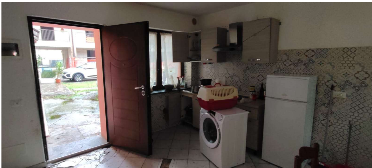
Il soggiorno con angolo cottura a vista