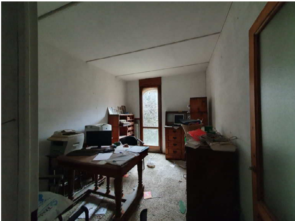
FOTO 30 – Ripresa fotografica blocco C, parte centrale piano terra, Interni