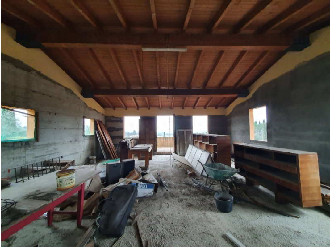
FOTO 07 – Ripresa fotografica vano piano primo blocco C lato valle (controcampo)