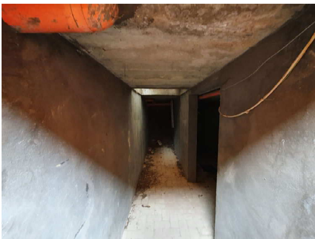
FOTO 22 – Ripresa fotografica blocco C, piano interrato oggetto di ordinanza di demolizione