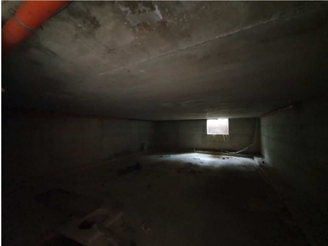
FOTO 23 – Ripresa fotografica blocco C, piano interrato oggetto di ordinanza di demolizione