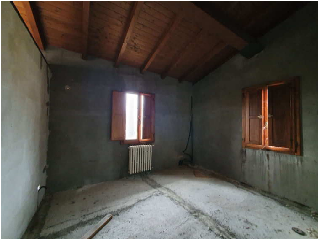
FOTO 33 – Ripresa fotografica blocco C, parte centrale piano primo, Interni