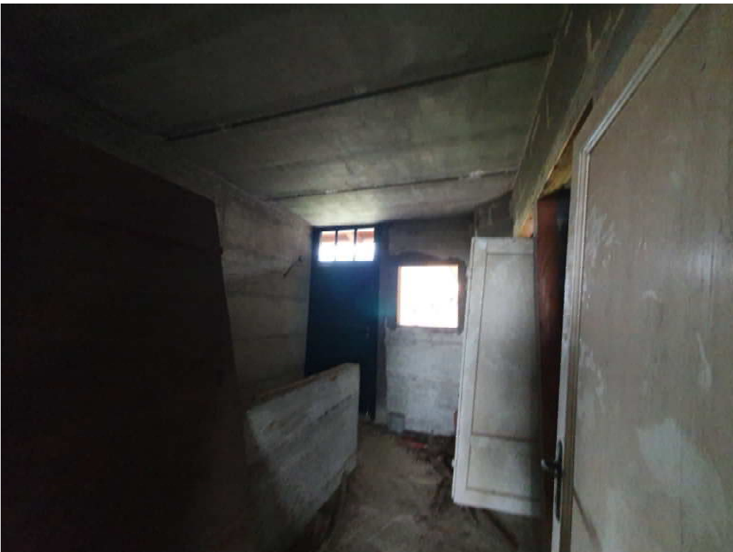
FOTO 14 – Ripresa fotografica interno piano terra blocco C lato valle (zona servizi)