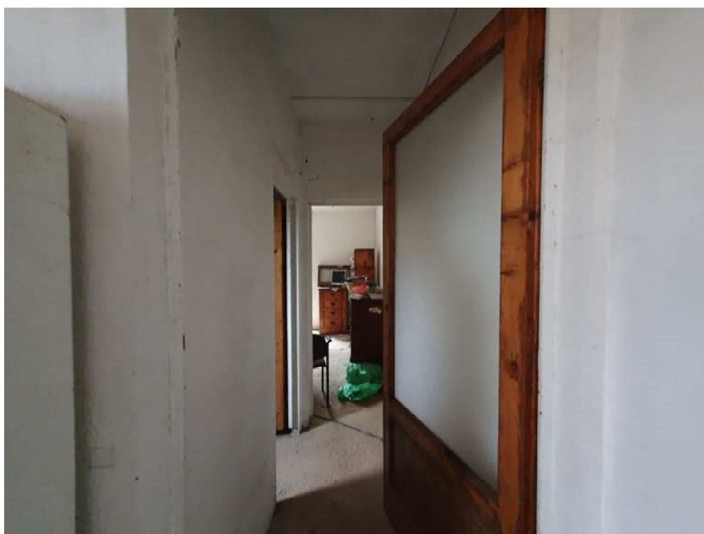
FOTO 28 – Ripresa fotografica blocco C, parte centrale piano terra, Interni