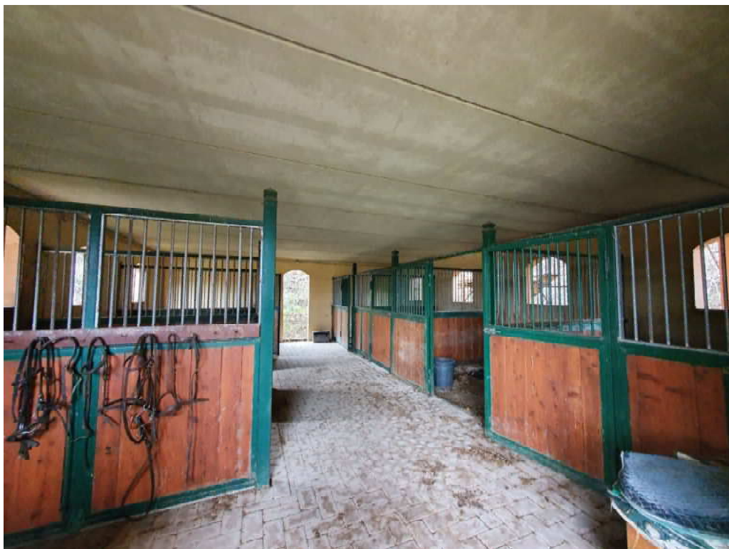
FOTO 38 – Ripresa fotografica blocco C, stalle a comune parte a monte