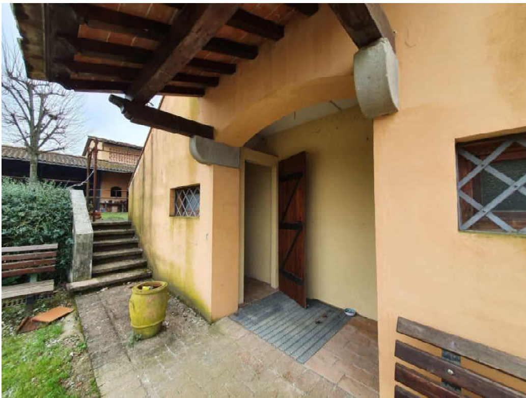
FOTO 24 – Ripresa fotografica blocco C, piano terra zona servizi igienici