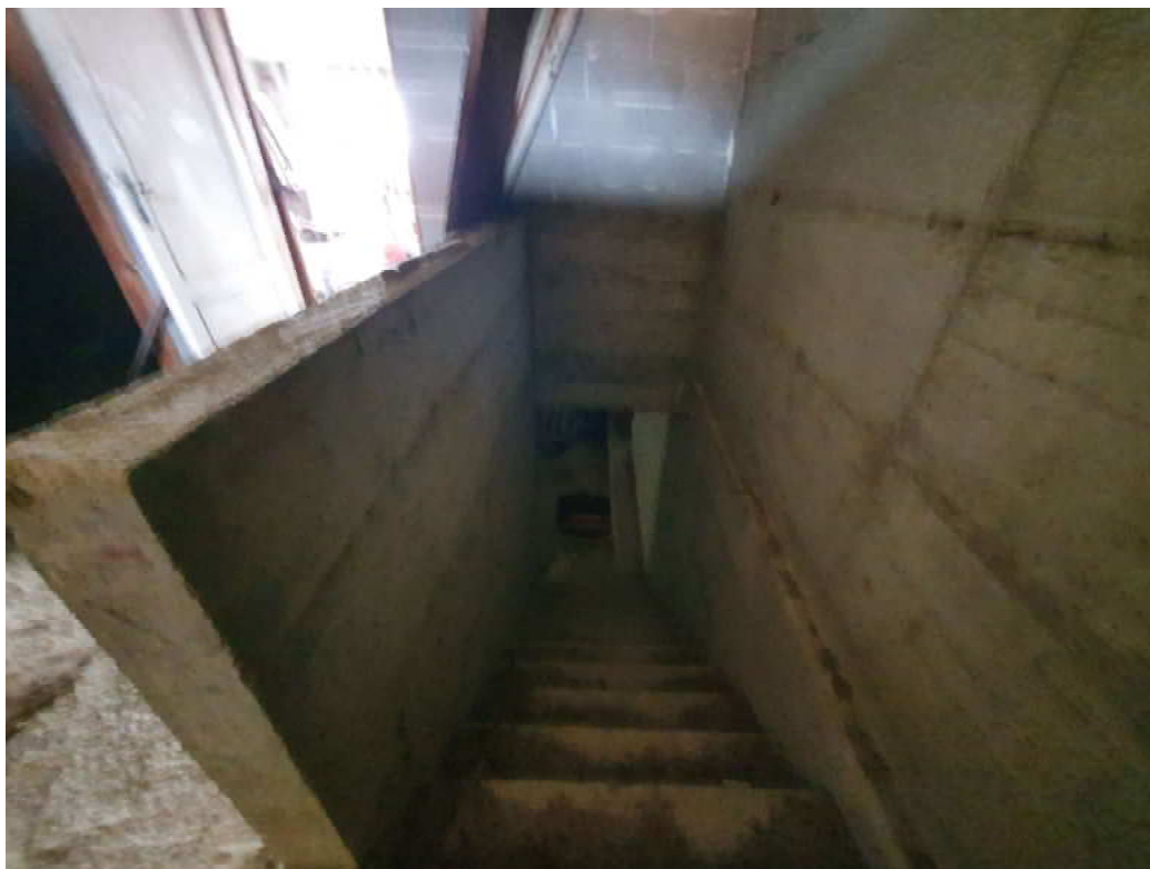
FOTO 15 – Ripresa fotografica interno piano terra blocco C lato valle, scala che conduce al piano interrato oggetto di ordinanza di demolizione