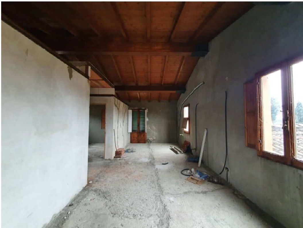
FOTO 32 – Ripresa fotografica blocco C, parte centrale piano primo, Interni