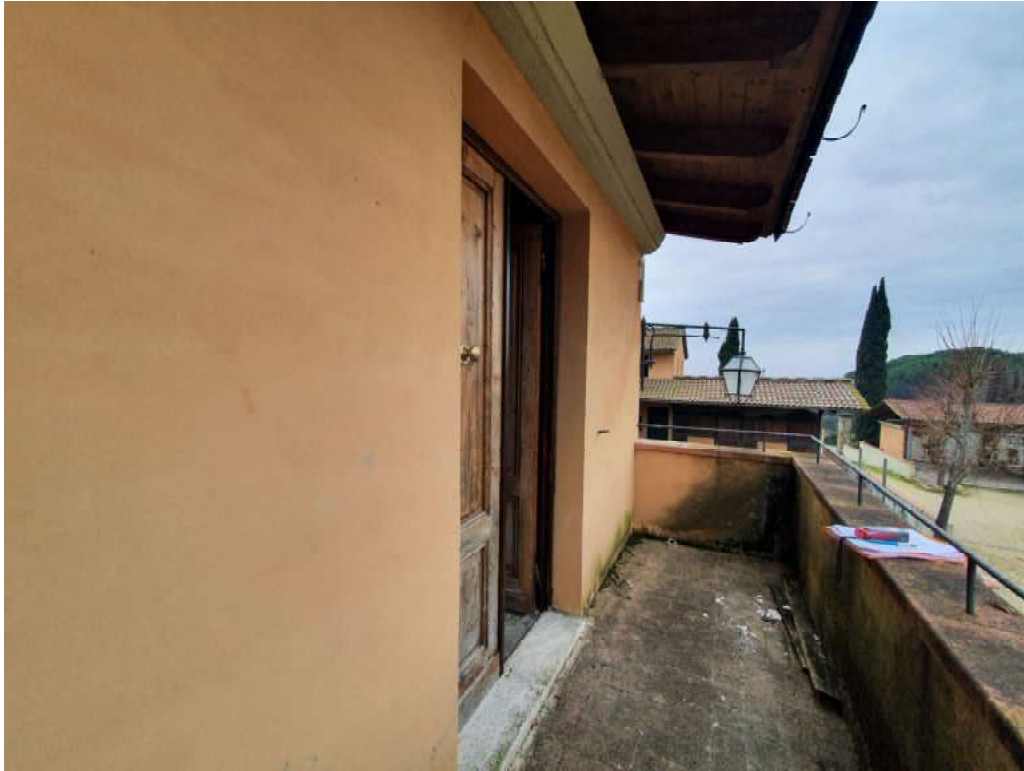
FOTO 31 – Ripresa fotografica blocco C, parte centrale piano primo, Terrazza