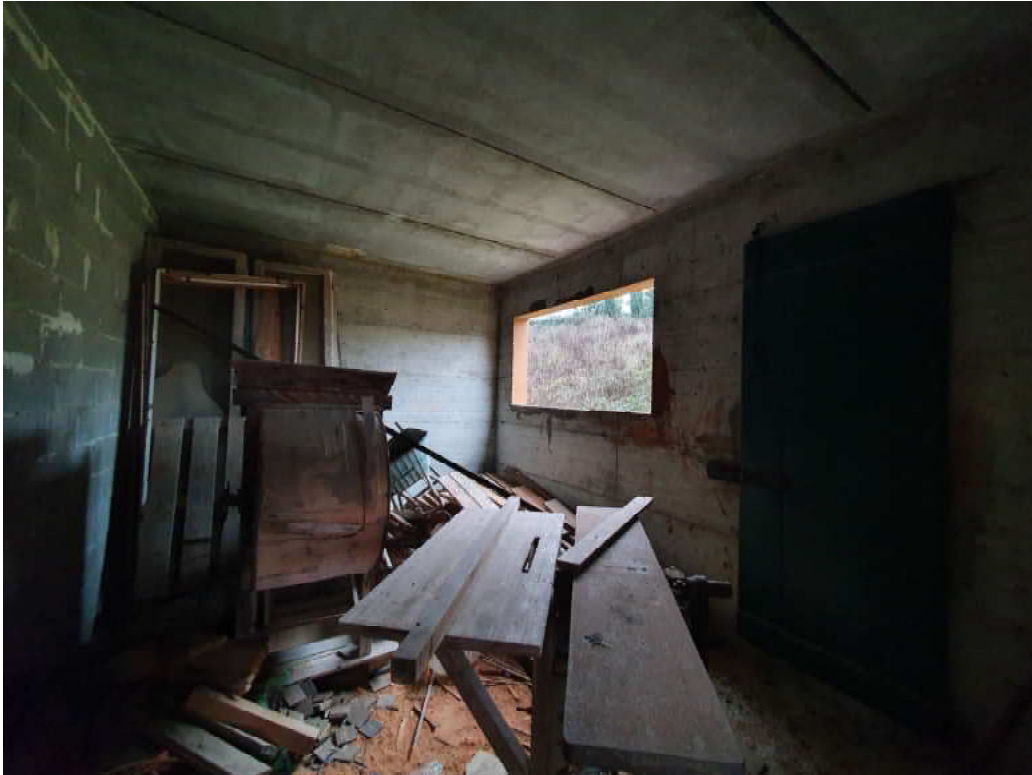
FOTO 13 – Ripresa fotografica interno piano terra blocco C lato valle