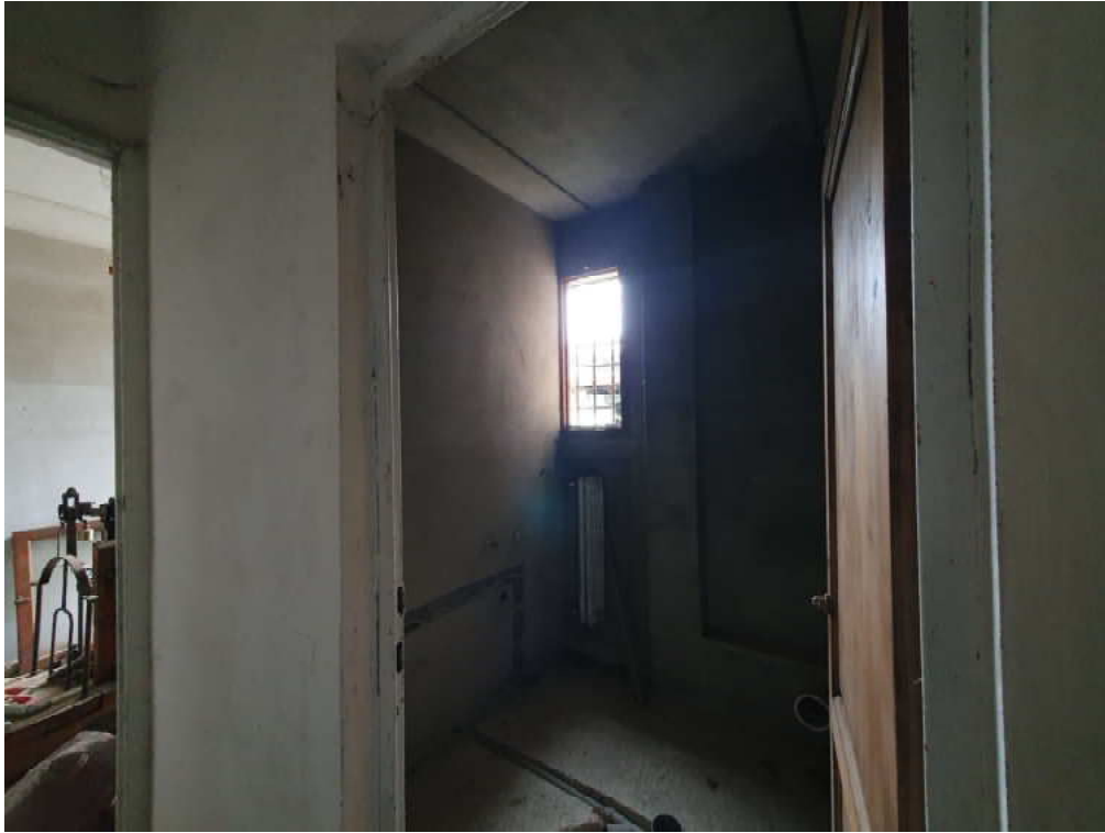
FOTO 29 – Ripresa fotografica blocco C, parte centrale piano terra, Interni