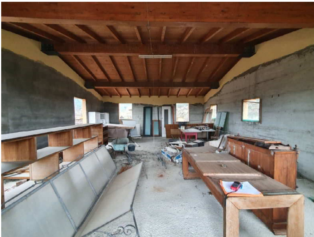
FOTO 06 – Ripresa fotografica vano piano primo blocco C lato valle