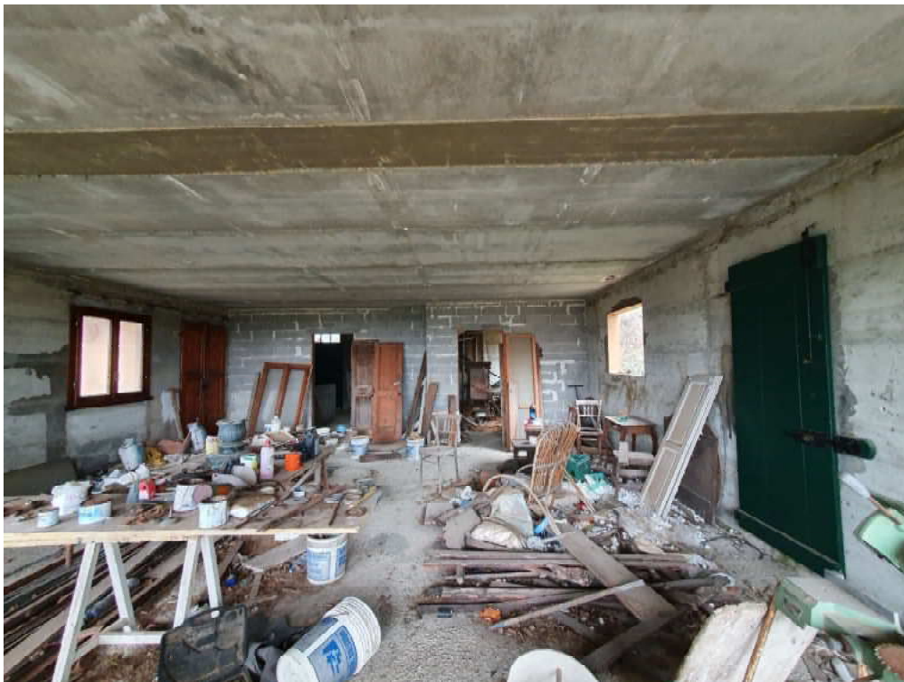
FOTO 12 – Ripresa fotografica interno piano terra blocco C lato valle