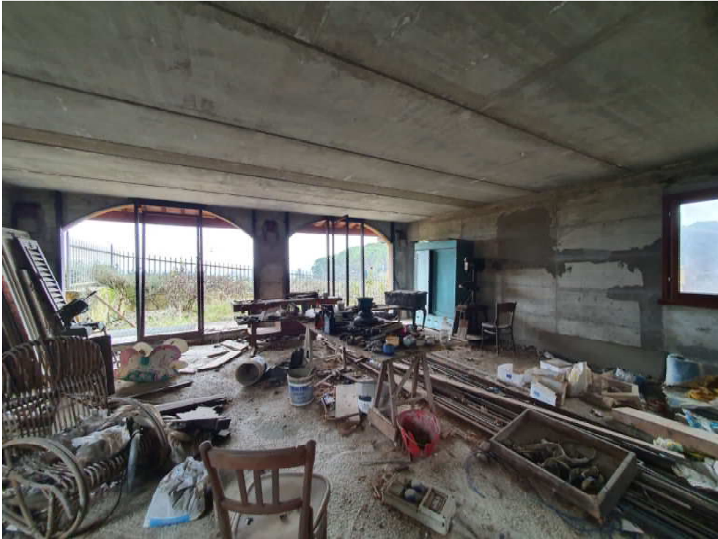
FOTO 11 – Ripresa fotografica interno piano terra blocco C lato valle