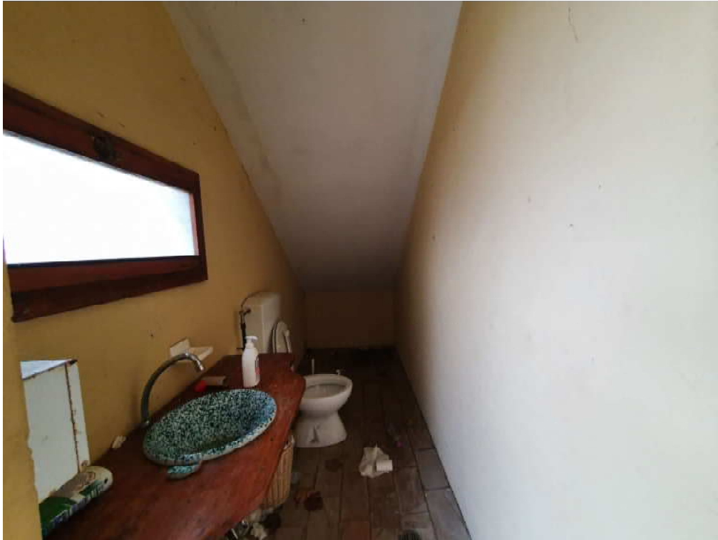
FOTO 25 – Ripresa fotografica blocco C, piano terra servizi igienici