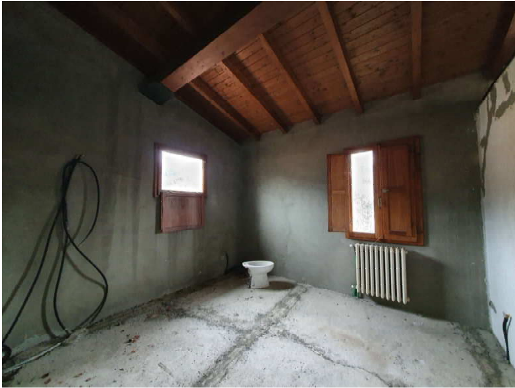
FOTO 35 – Ripresa fotografica blocco C, parte centrale piano primo, Interni