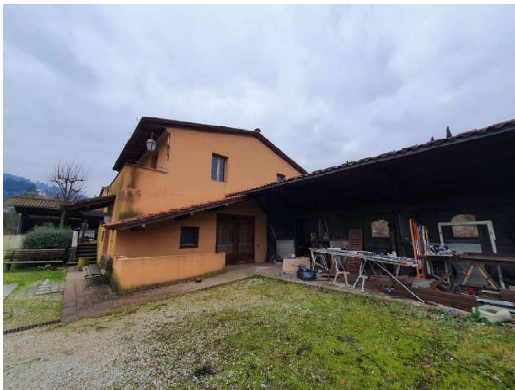
FOTO 17 – Ripresa fotografica blocco C stalle e porzione di mezzo