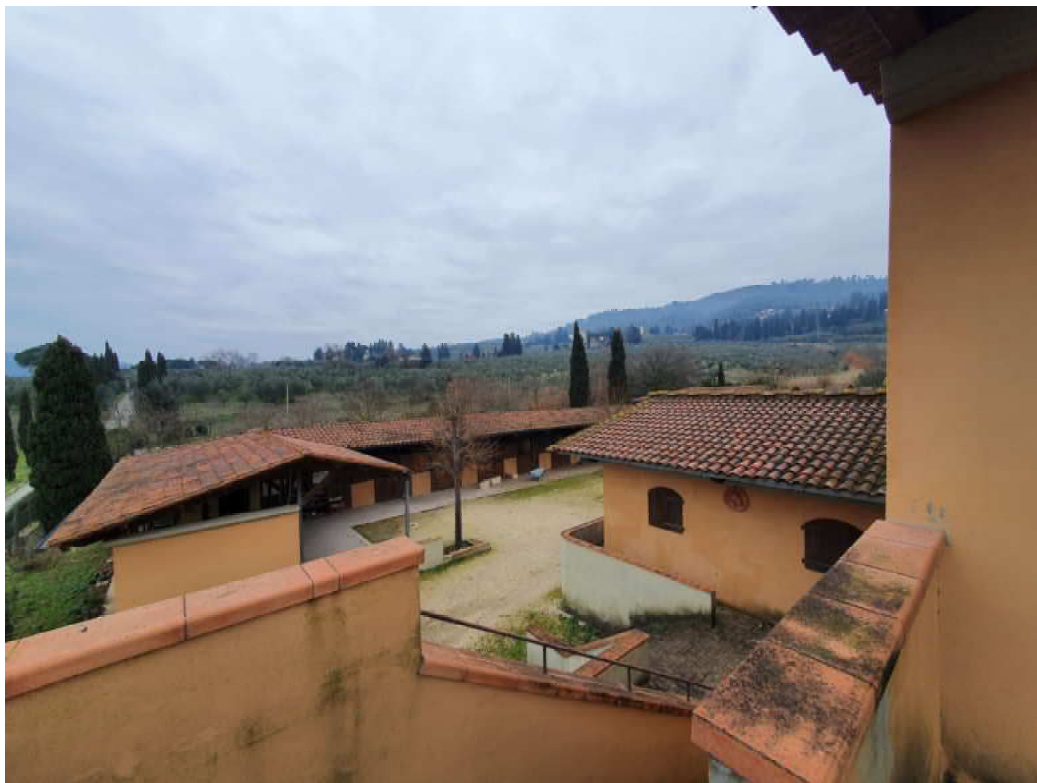
FOTO 08 – Ripresa fotografica del maneggio/stalla dal terrazzo del piano primo blocco C lato valle