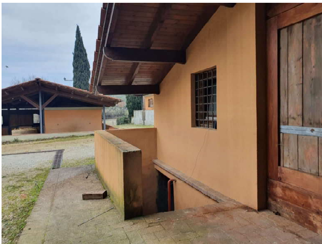
FOTO 21 – Ripresa fotografica blocco C scala che porta al piano interrato oggetto di ordinanza di demolizione