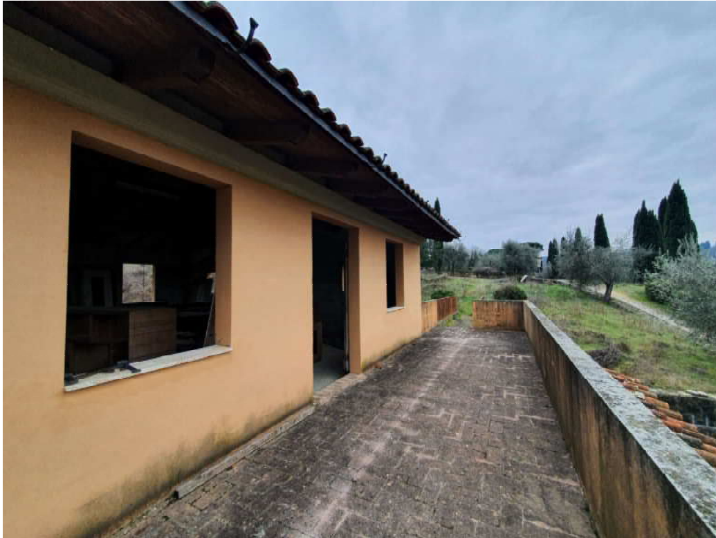
FOTO 05 – Ripresa fotografica terrazza piano primo blocco C lato valle