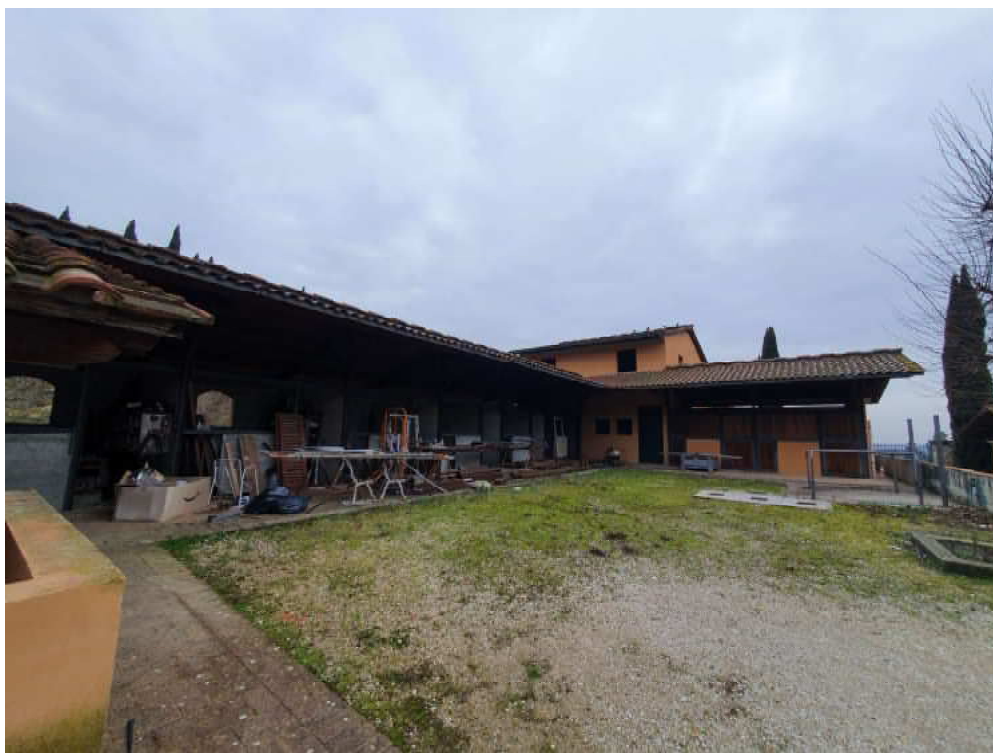
FOTO 18 – Ripresa fotografica blocco C stalle e porzione di valle