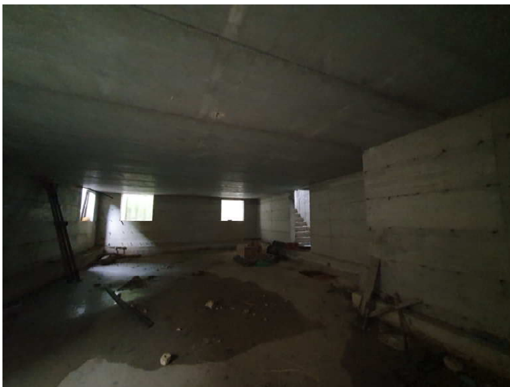
FOTO 16 – Ripresa fotografica interno piano terra blocco C lato valle, piano interrato oggetto di ordinanza di demolizione