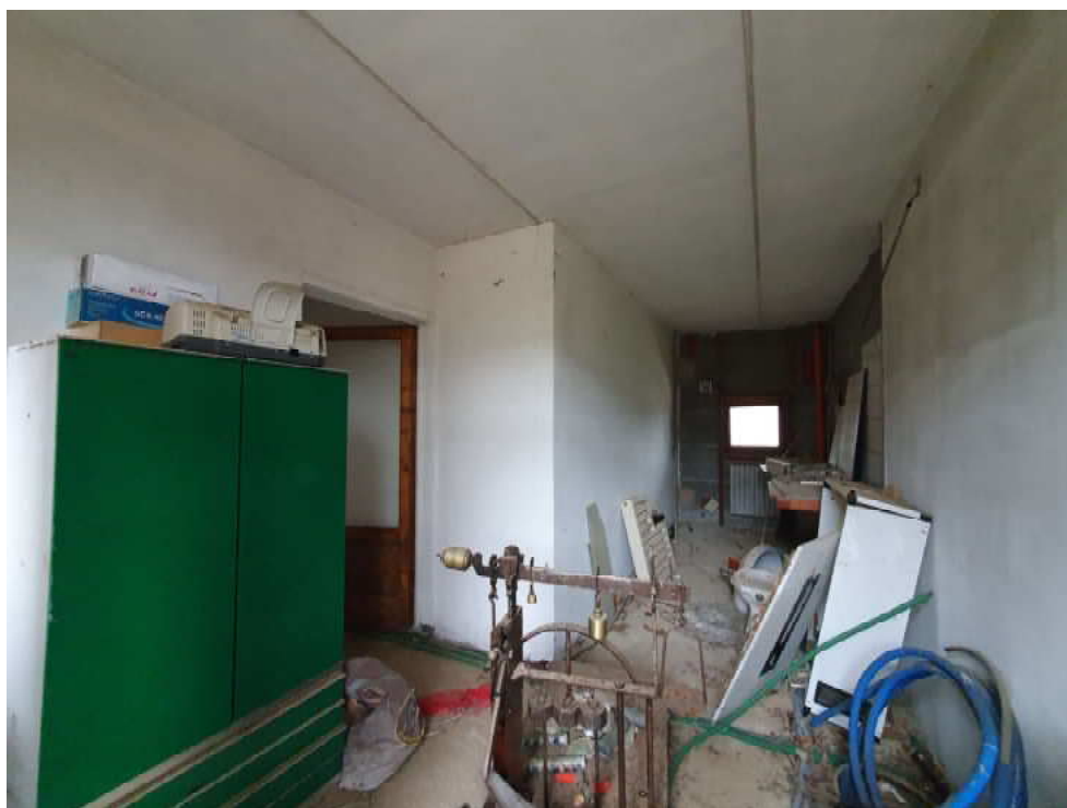
FOTO 27 – Ripresa fotografica blocco C, parte centrale piano terra, Interni