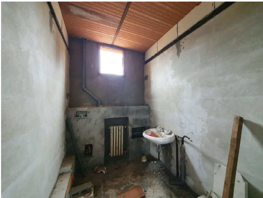
FOTO 34 – Ripresa fotografica blocco C, parte centrale piano primo, Interni