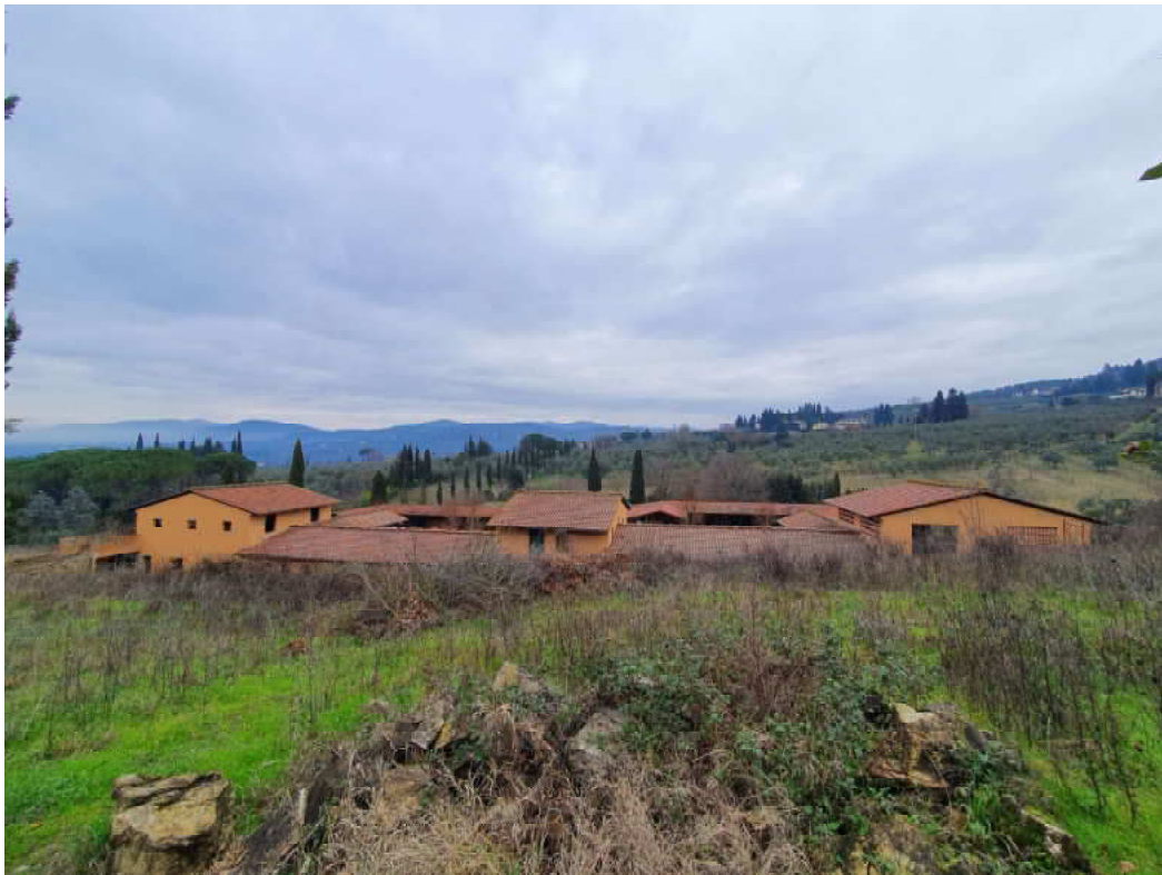
FOTO 03 – maneggio/stalla ripreso dai terreni limitrofi (punto di accesso secondo campo di allenamento cavalli)