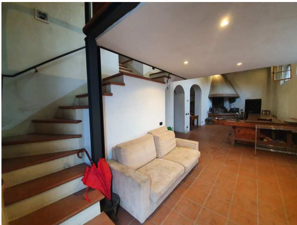
FOTO 05 – Ripresa fotografica del vano della zona soggiorno con scala per il soppalo e piano primo