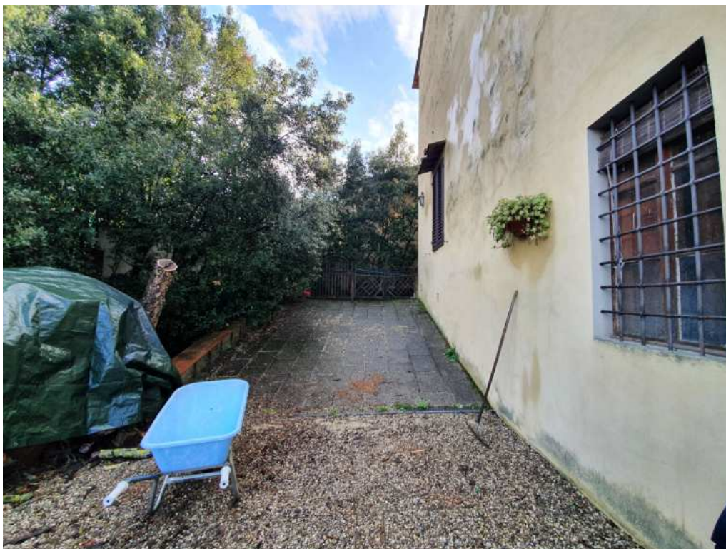
FOTO 03 – vialetto di ingresso (porzioni di terreno a comune con la villa storica)