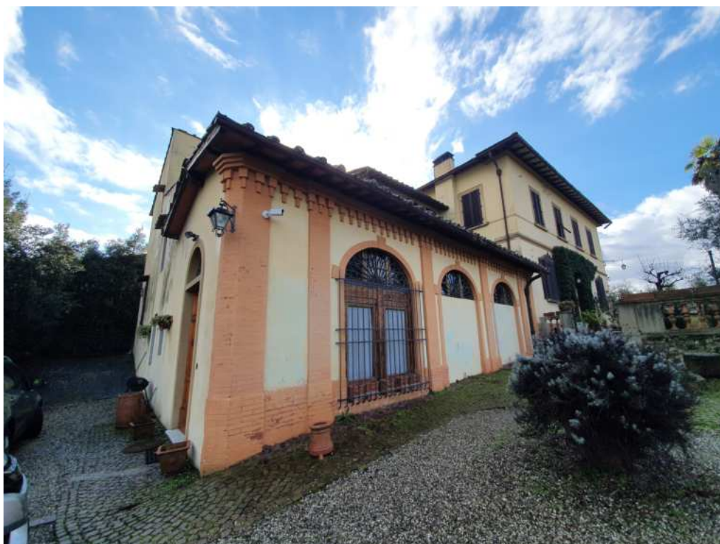
FOTO 04 – Ripresa fotografica dell'abitazione al sub 501 con accesso sul lato