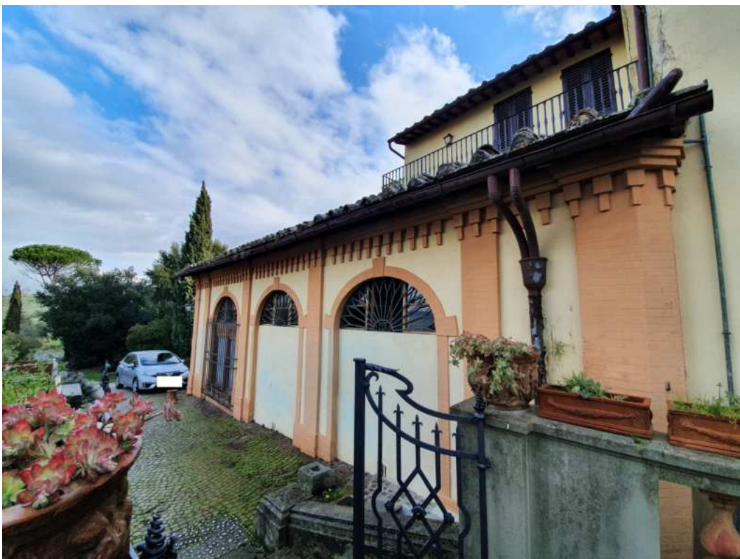
FOTO 20 – Ripresa fotografica dell'esterno che porta ai vani tecnici interrati (non oggetto di esecuzione)