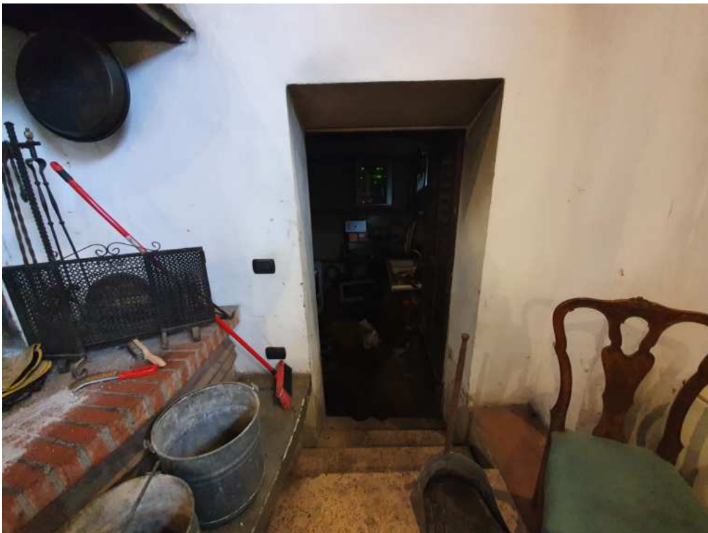
FOTO 08 – Ripresa fotografica dell'accesso al vano tecnico (non oggetto di esecuzione)