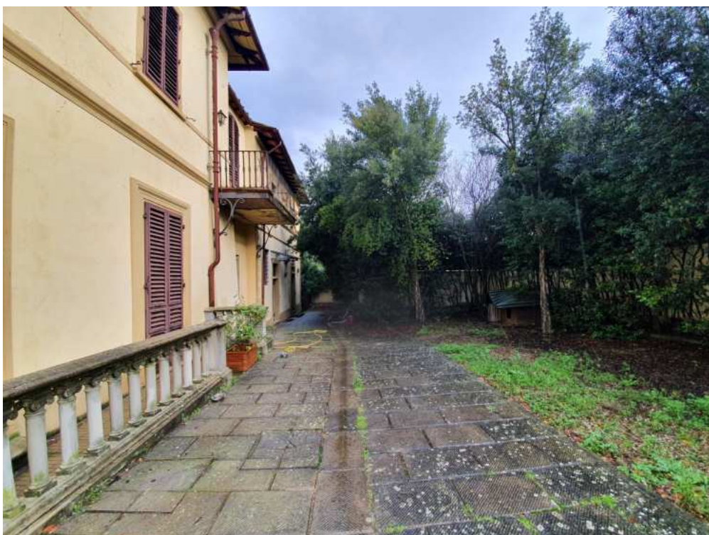
FOTO 02 – vialetto di ingresso (porzioni di terreno a comune con la villa storica)