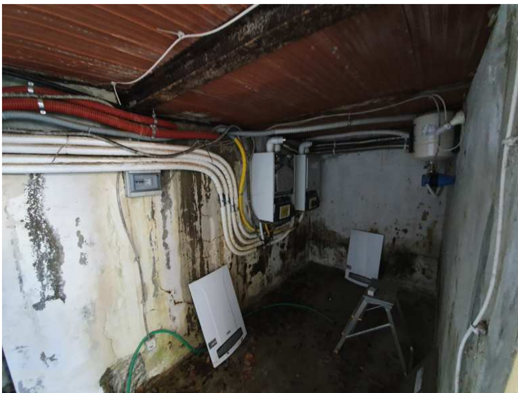
FOTO 23 – Ripresa fotografica dei vani tecnici interrati (non oggetto di esecuzione)