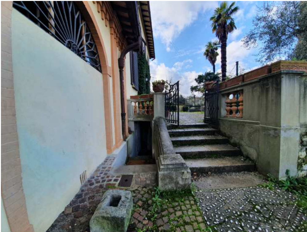
FOTO 21 – Ripresa fotografica dell'accesso ai vani tecnici interrati (non oggetto di esecuzione)