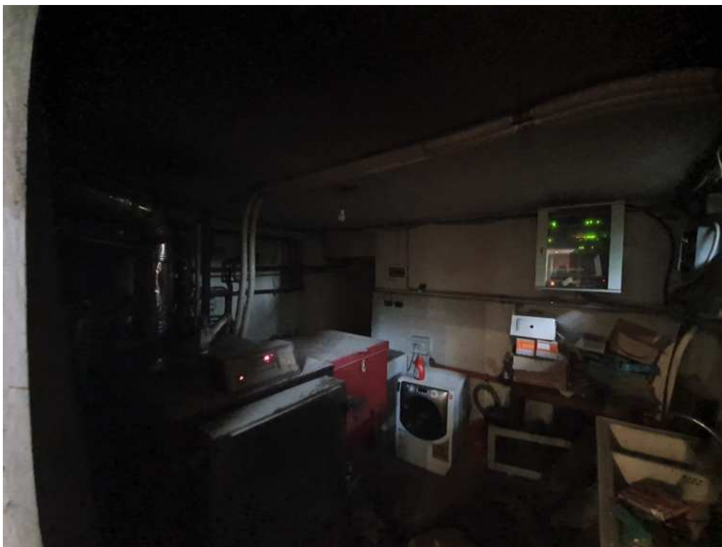
FOTO 09 – Ripresa fotografica del vano tecnico (non oggetto di esecuzione)