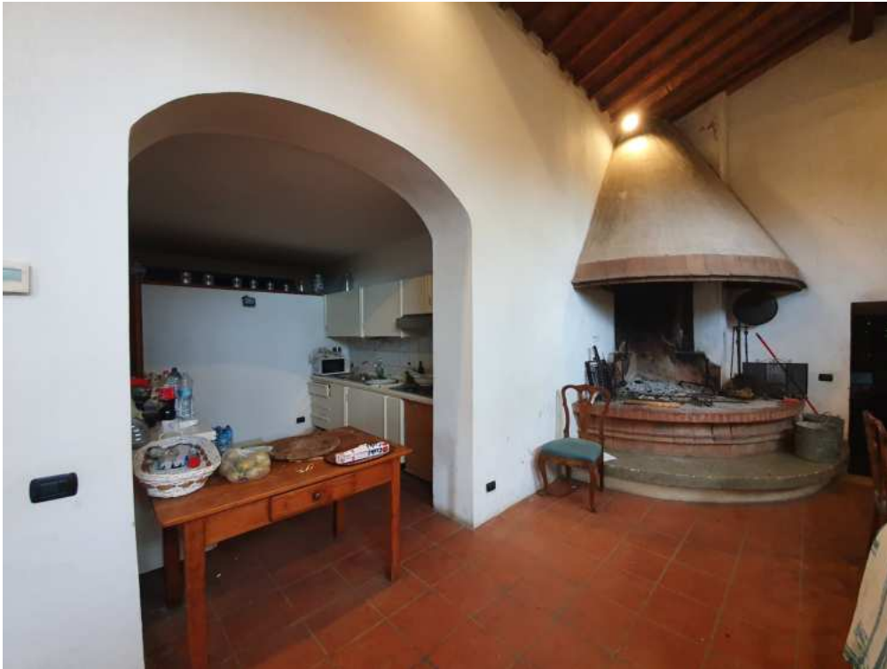
FOTO 07 – Ripresa fotografica del vano soggiorno con angolo cottura