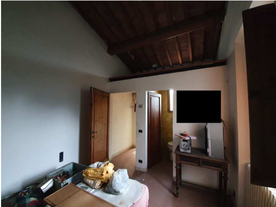
FOTO 19 – Ripresa fotografica della camera del piano primo con servizio igienico interno (controcampo).