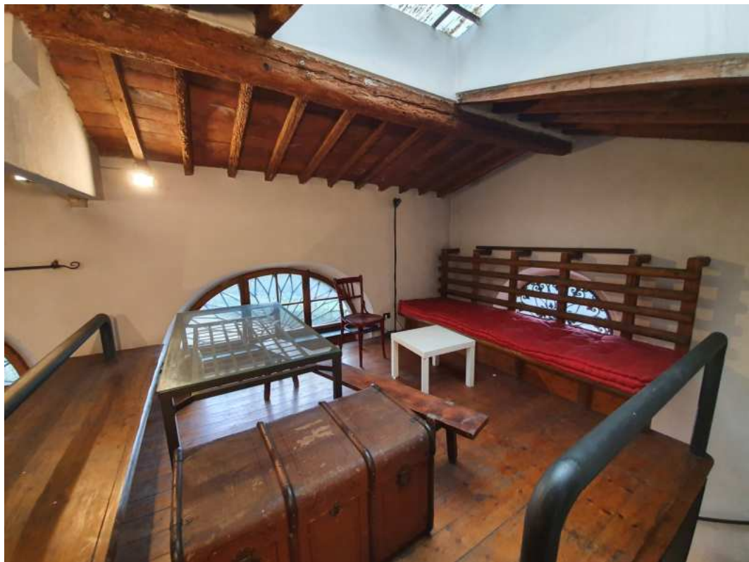
FOTO 16 – Ripresa fotografica del soppalco che affaccia sulla zona soggiorno