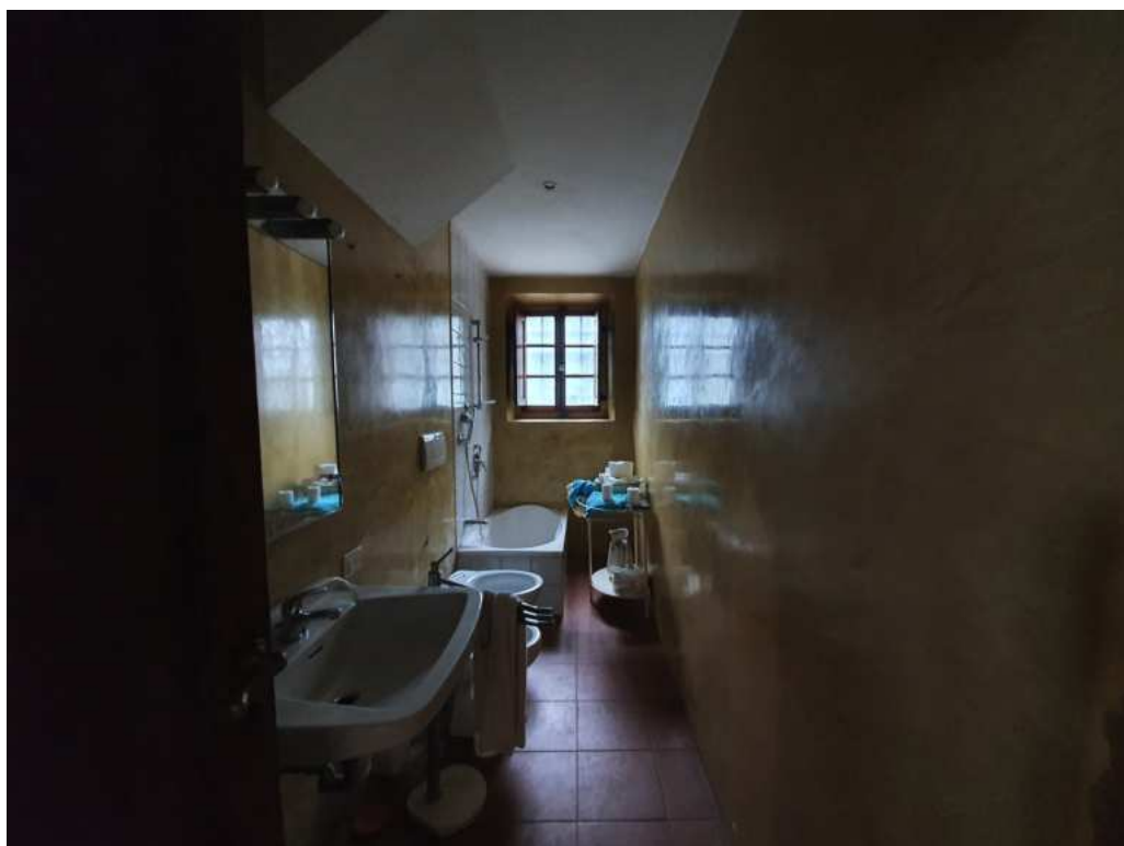
FOTO 12 – Ripresa fotografica del servizio igienico del piano terra