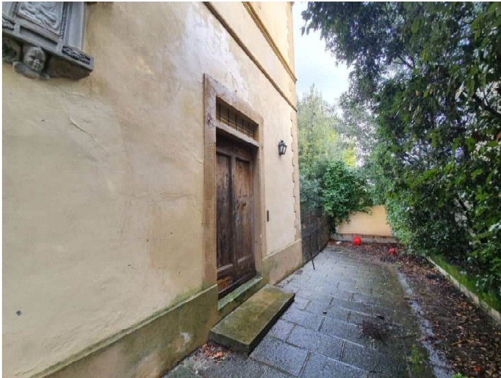
FOTO 03 – Ingresso sub 500 posto sul vialetto di ingresso (porzioni di terreno a comune con la villa storica).