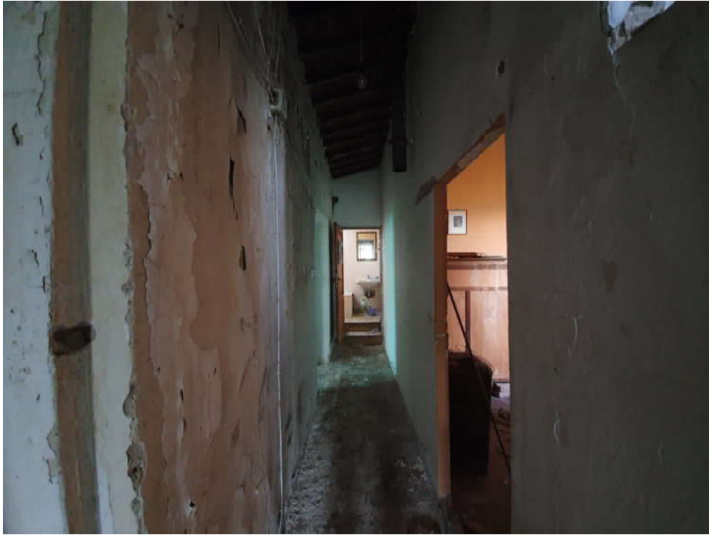
FOTO 09 – Ripresa fotografica del corridoio distributivo del piano primo