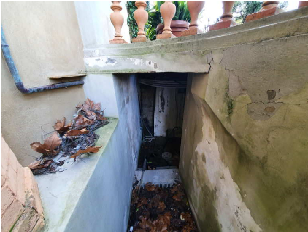
FOTO 16 – Ripresa fotografica dell'accesso ai vani tecnici interrati (non oggetto di esecuzione)