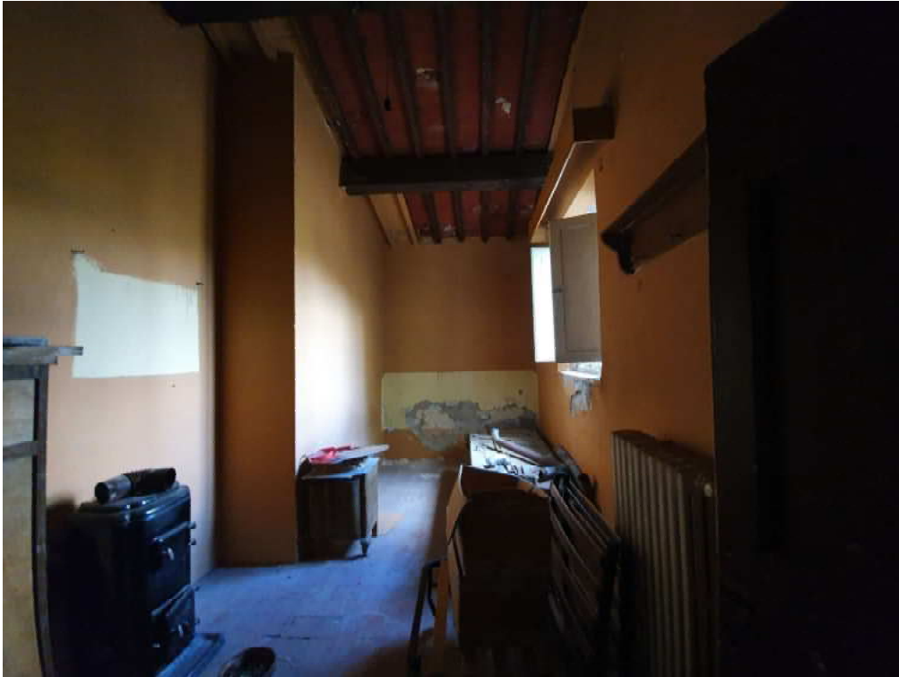
FOTO 11 – Ripresa fotografica di ulteriore camera del piano primo