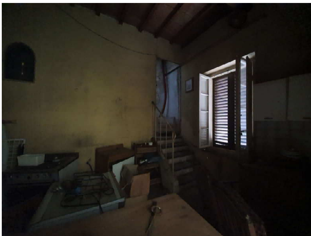
FOTO 08 – Ripresa fotografica del vano di accesso (scala che porta al piano superiore).