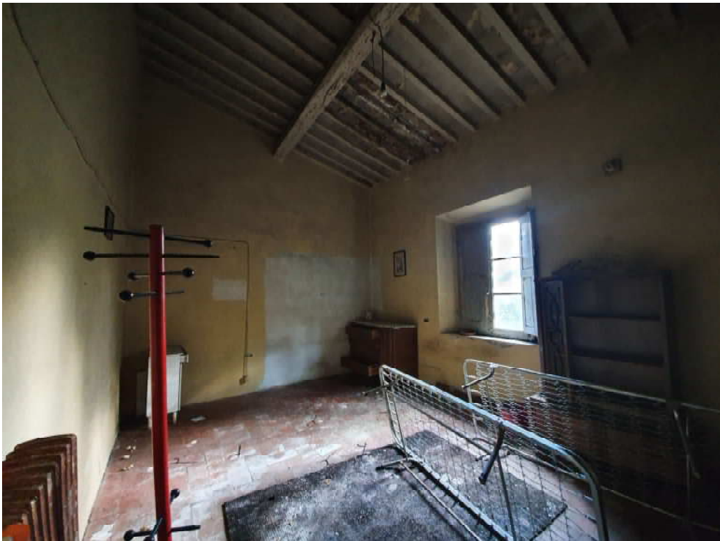
FOTO 10 – Ripresa fotografica di una delle camere del piano primo