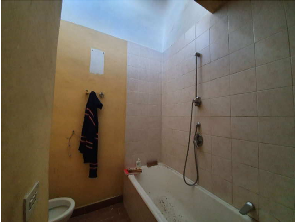
FOTO 13 – Ripresa fotografica del servizio igienico al piano primo