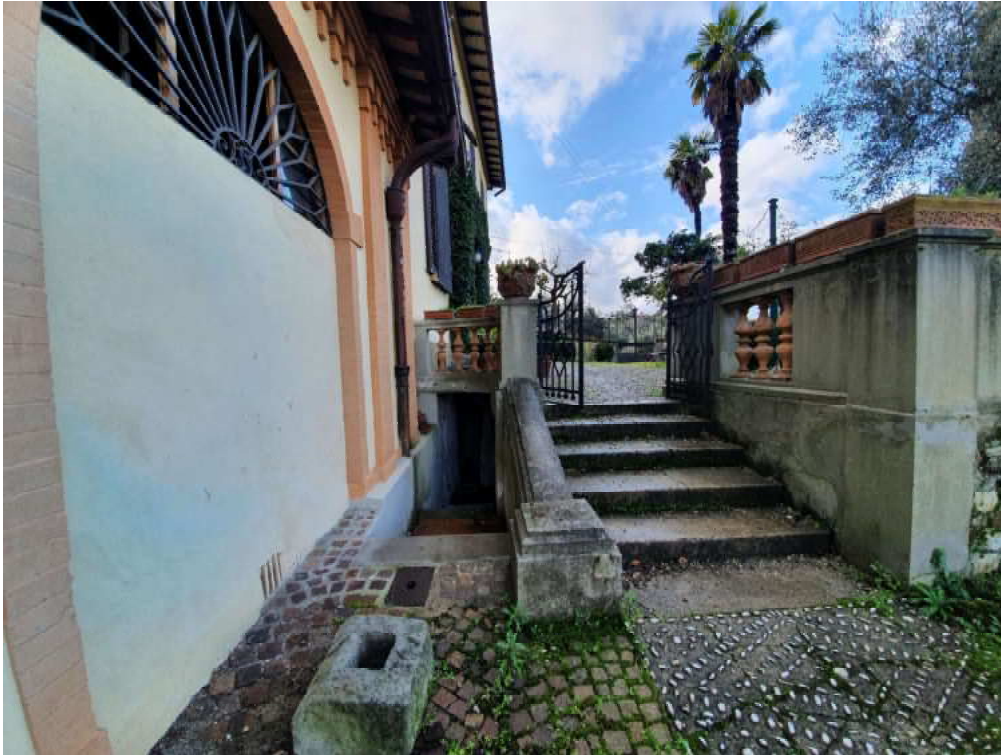
FOTO 15 – Ripresa fotografica dell'accesso ai vani tecnici interrati (non oggetto di esecuzione)