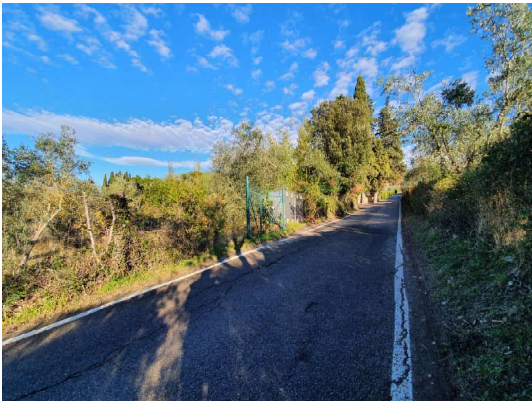
FOTO 12 – Ripresa fotografica di ulteriore cancello di accesso terreni verso monte