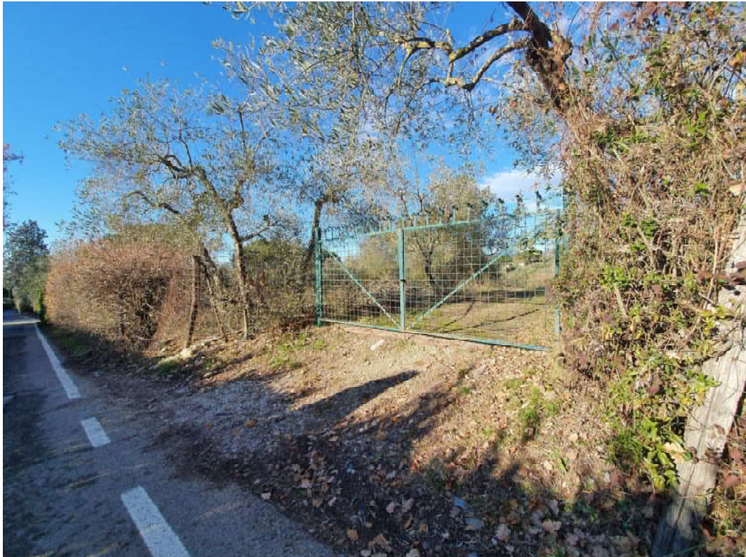
FOTO 11 – Ripresa fotografica del cancello di accesso terreni verso monte