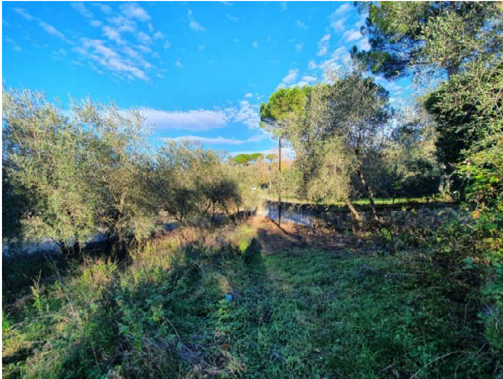
FOTO 05 – confine dei terreni posti a valle con muro di contenimento