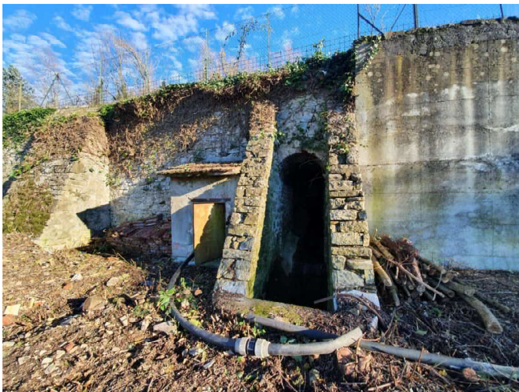
FOTO 08 – confine dei terreni posti a valle passaggio fosso con casotto pompa (non funzionante) posto sul muro di contenimento