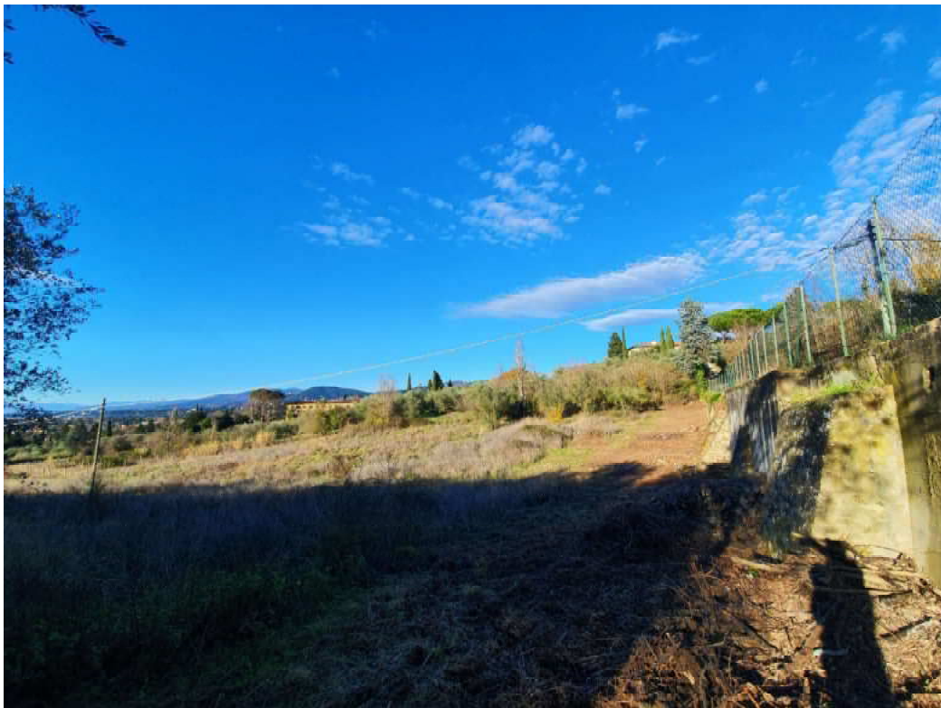
FOTO 06 – confine dei terreni posti a valle con muro di contenimento