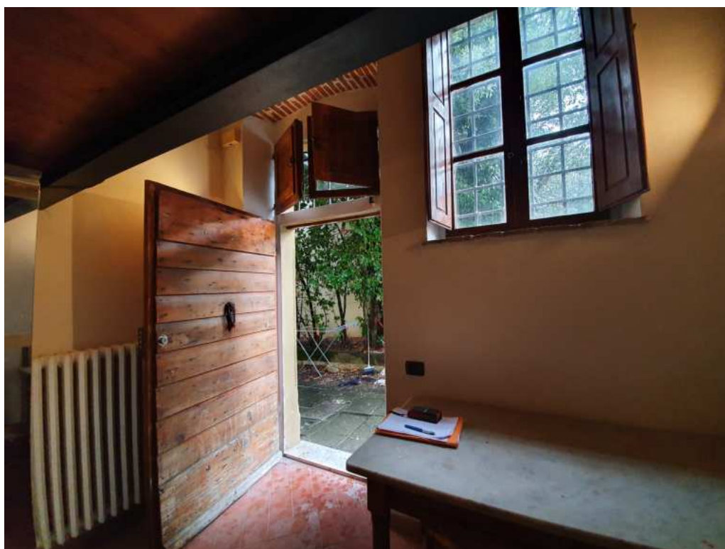
FOTO 06 – Ripresa fotografica del la zona giorno con angolo cottura e soppalco (controcampo).