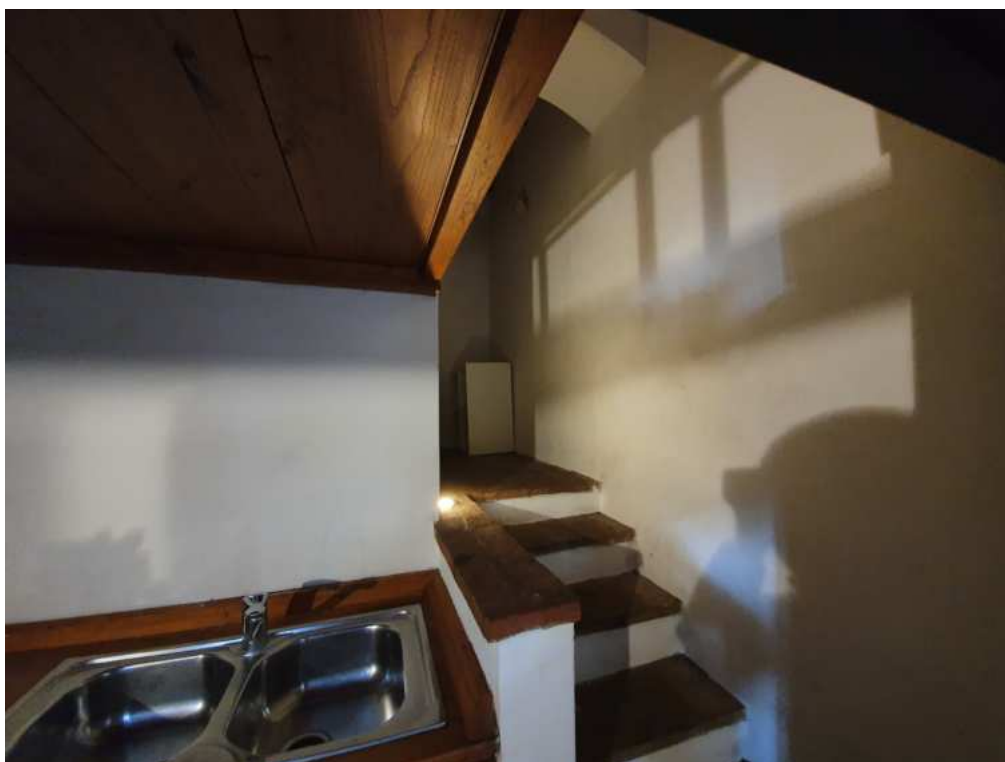
FOTO 05 – Ripresa fotografica del la zona giorno con le scale che portano alla zona notte