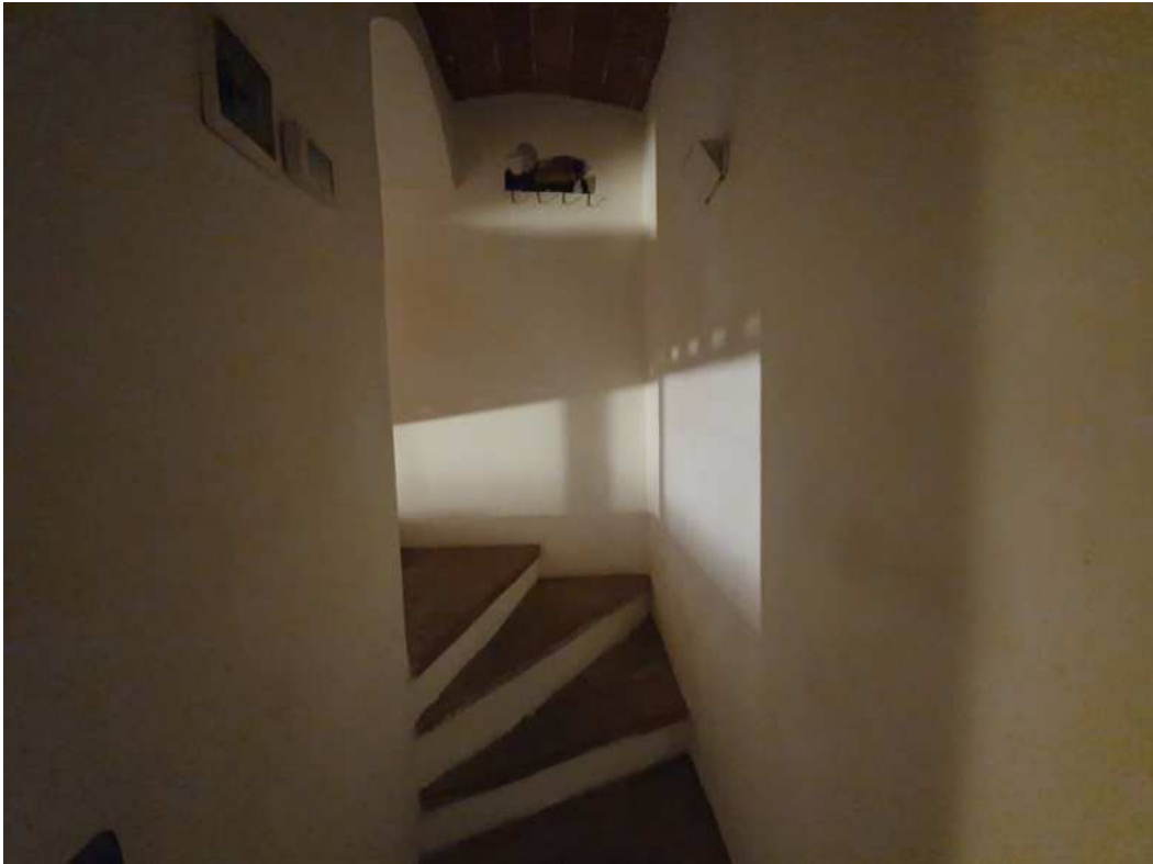
FOTO 09 – Ripresa fotografica delle scale che portano al soppalco