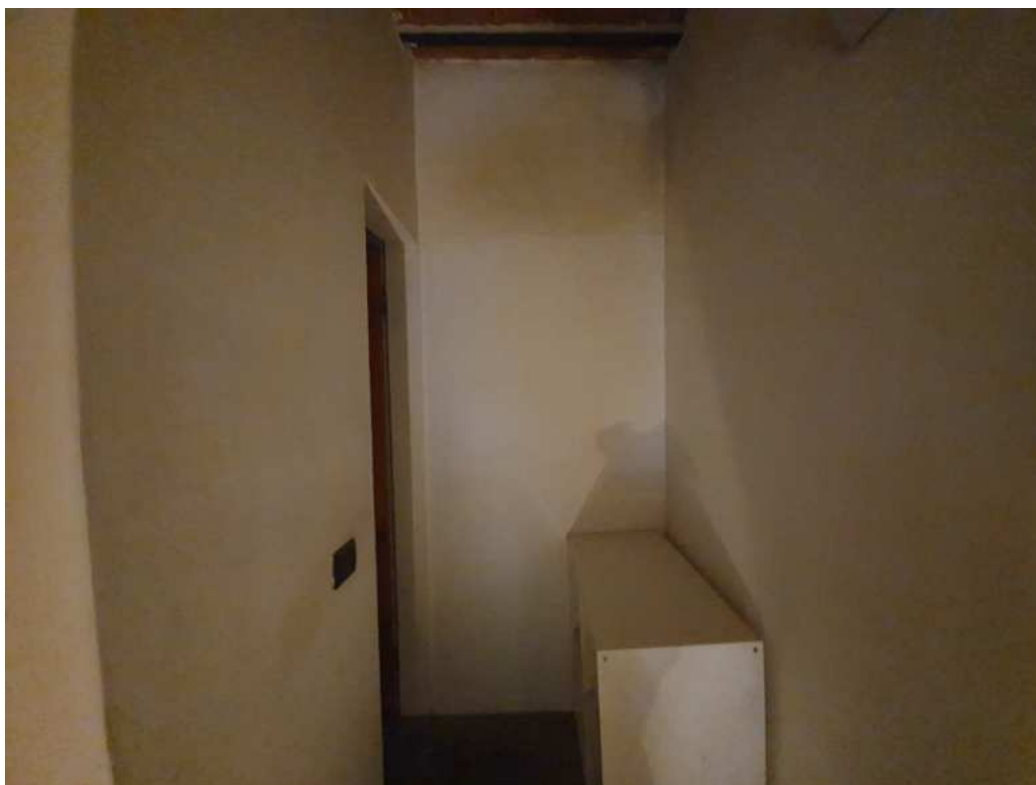
FOTO 08 – Ripresa fotografica del corridoio con la porta di accesso alla camera chiusa