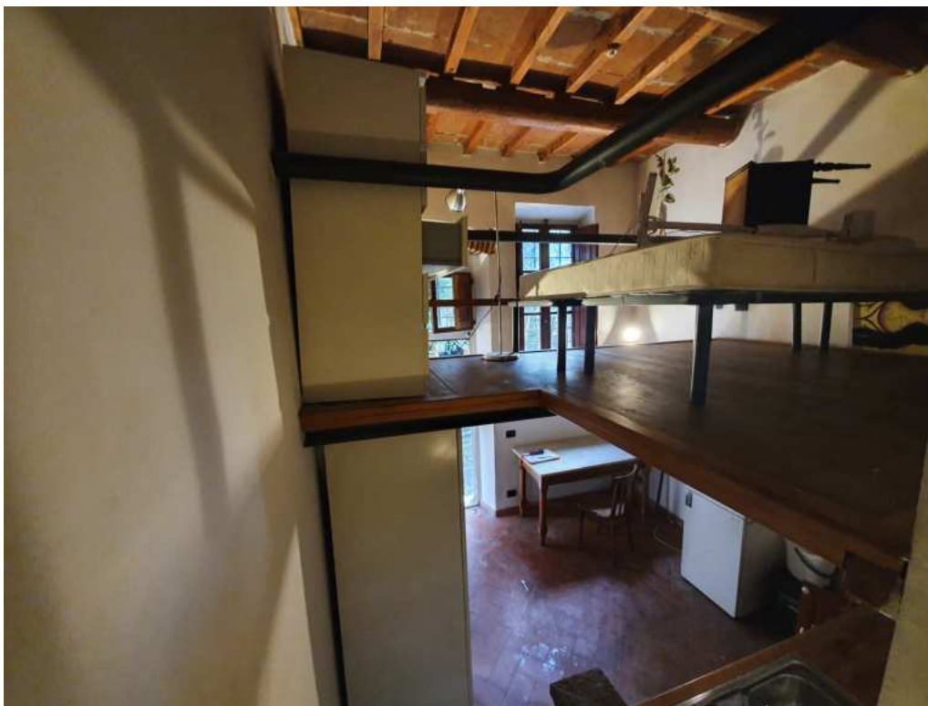
FOTO 07 – Ripresa fotografica del la zona giorno con angolo cottura e soppalco (controcampo)