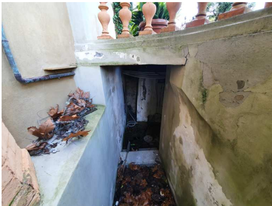
FOTO 16 – Ripresa fotografica dell'accesso ai vani tecnici interrati (non oggetto di esecuzione)