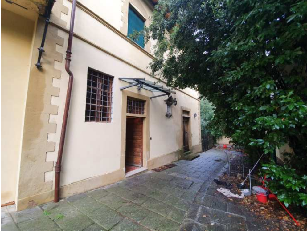
FOTO 03 – Ingresso sub 502 posto sul vialetto di ingresso (porzioni di terreno a comune con la villa storica).