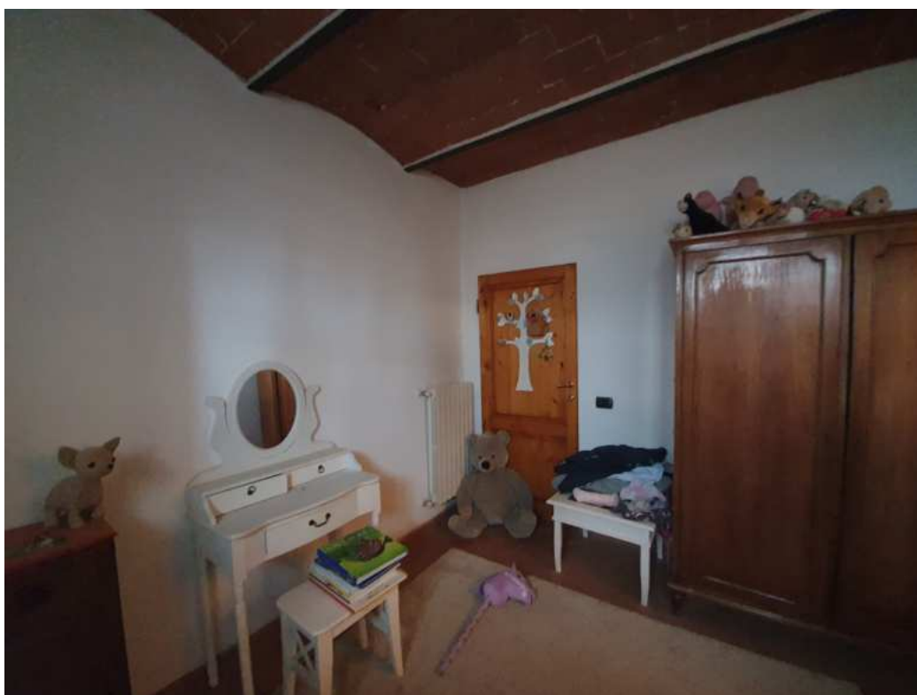
FOTO 12 – Ripresa fotografica della camera con la porta di collegamento chiusa