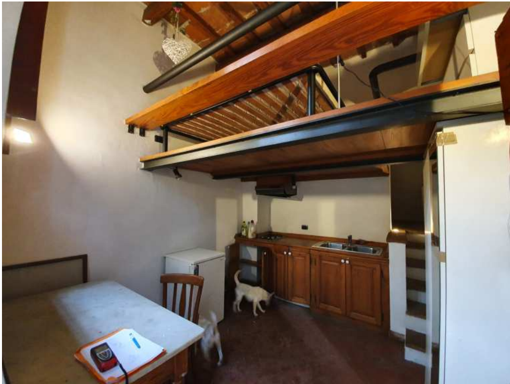
FOTO 04 – Ripresa fotografica del la zona giorno con angolo cottura e soppalco