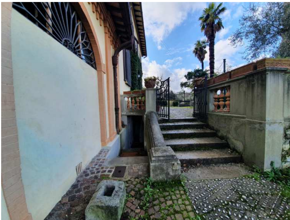
FOTO 15 – Ripresa fotografica dell'accesso ai vani tecnici interrati (non oggetto di esecuzione)