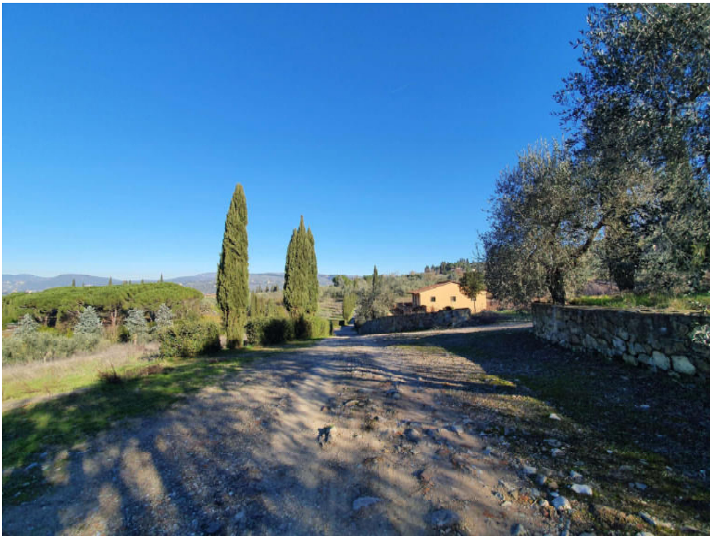
FOTO 33 – Ripresa fotografica strada di percorrenza principale verso il maneggio con strada laterale che porta ad ulteriore accesso da via Vernalese ed ad uno dei due campi di allenamento cavalli