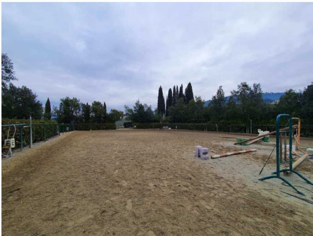
FOTO 38 – Ripresa fotografica di uno dei due campi di allenamento cavalli (controcampo)