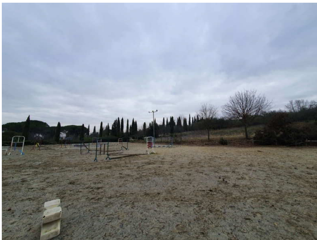
FOTO 44 – Ripresa fotografica di uno dei due campi di allenamento cavalli accanto al maneggio/stalle