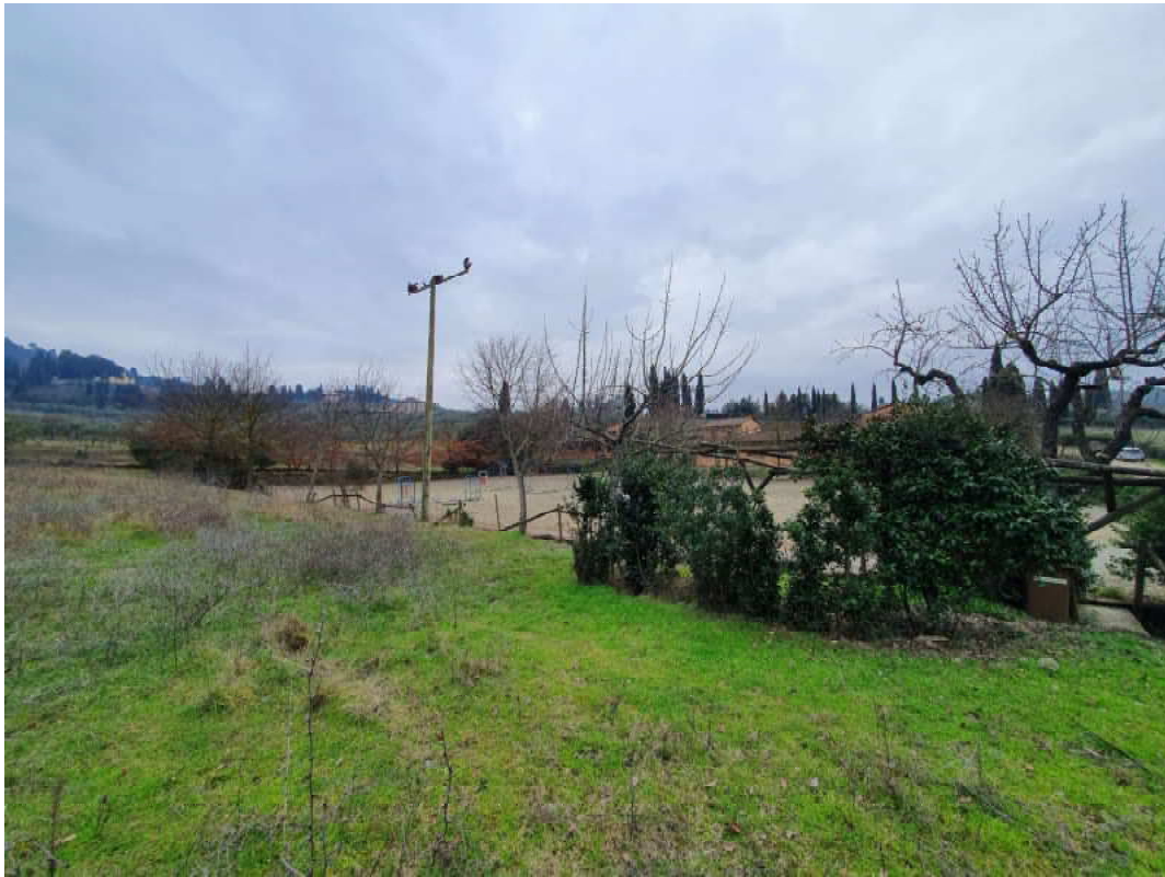
FOTO 41 – Ripresa fotografica di uno dei due campi di allenamento cavalli da strada di percorrenza interna principale