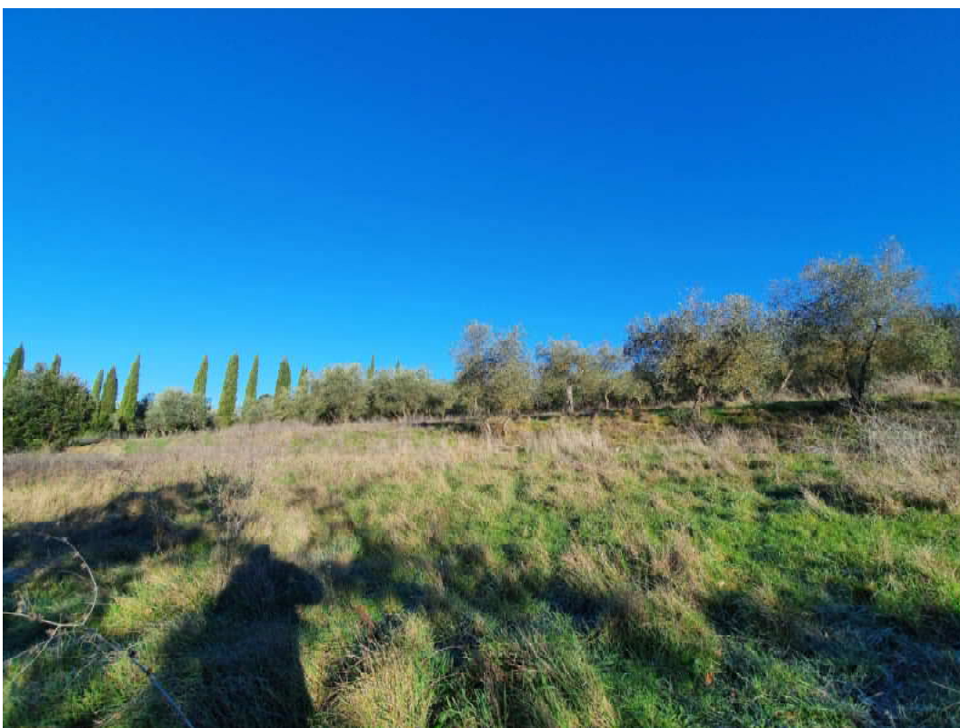
FOTO 46 – Ripresa fotografica terreni a monte del campo di allenamento cavalli