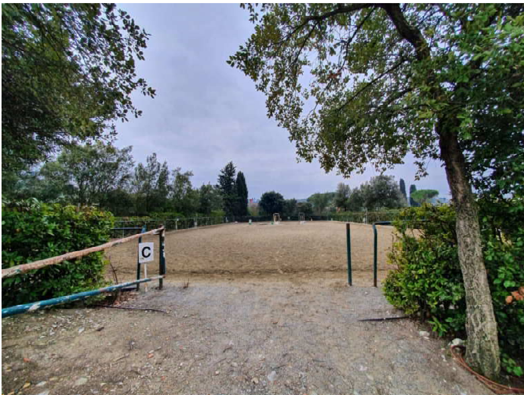
FOTO 36 – Ripresa fotografica di uno dei due campi di allenamento cavalli