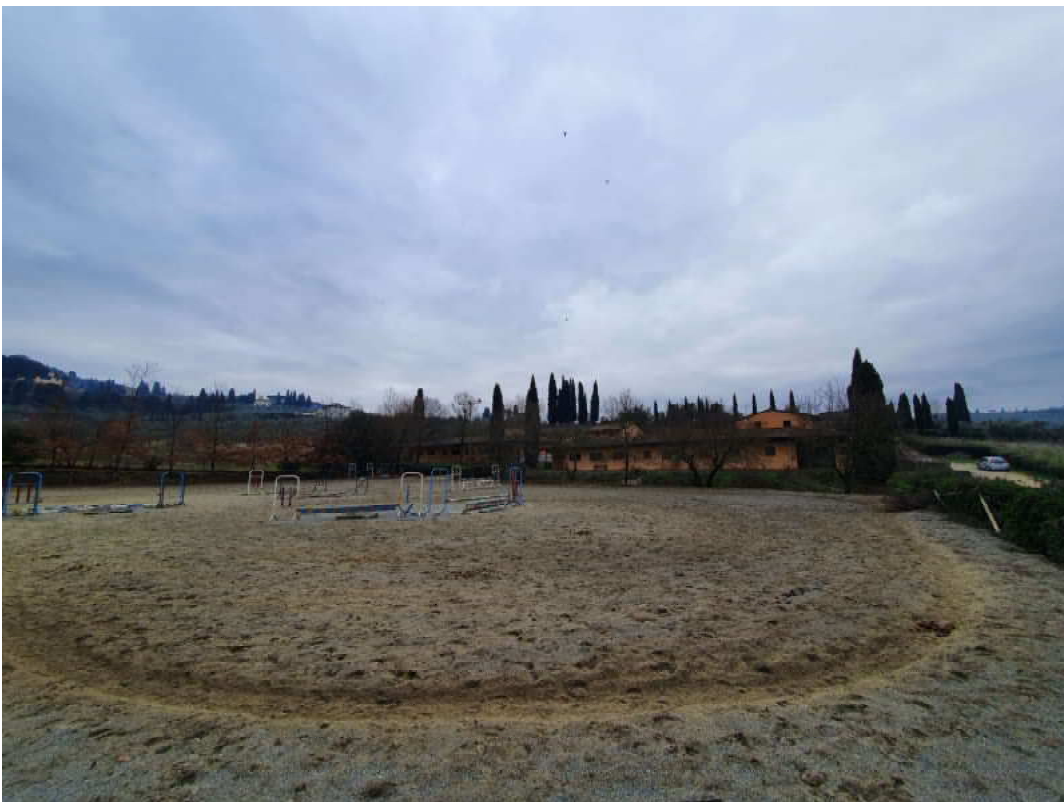
FOTO 42 – Ripresa fotografica di uno dei due campi di allenamento cavalli accanto al maneggio/stalle