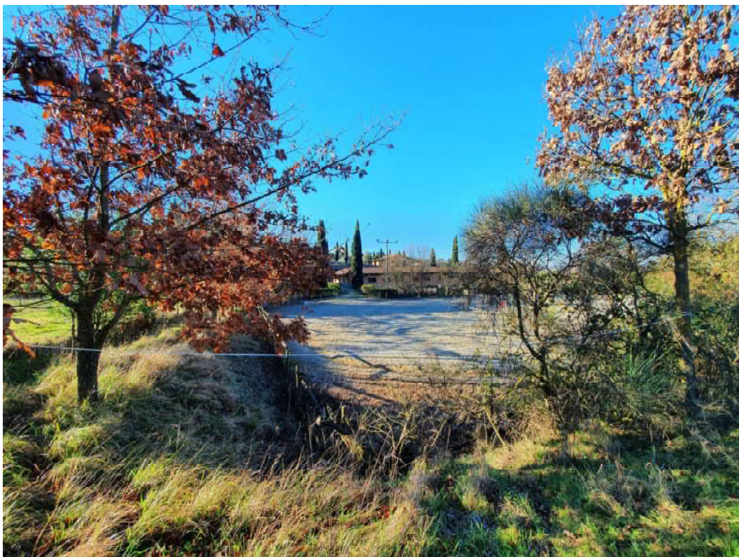
FOTO 45 – Ripresa fotografica di uno dei due campi di allenamento cavalli accanto al maneggio/stalle