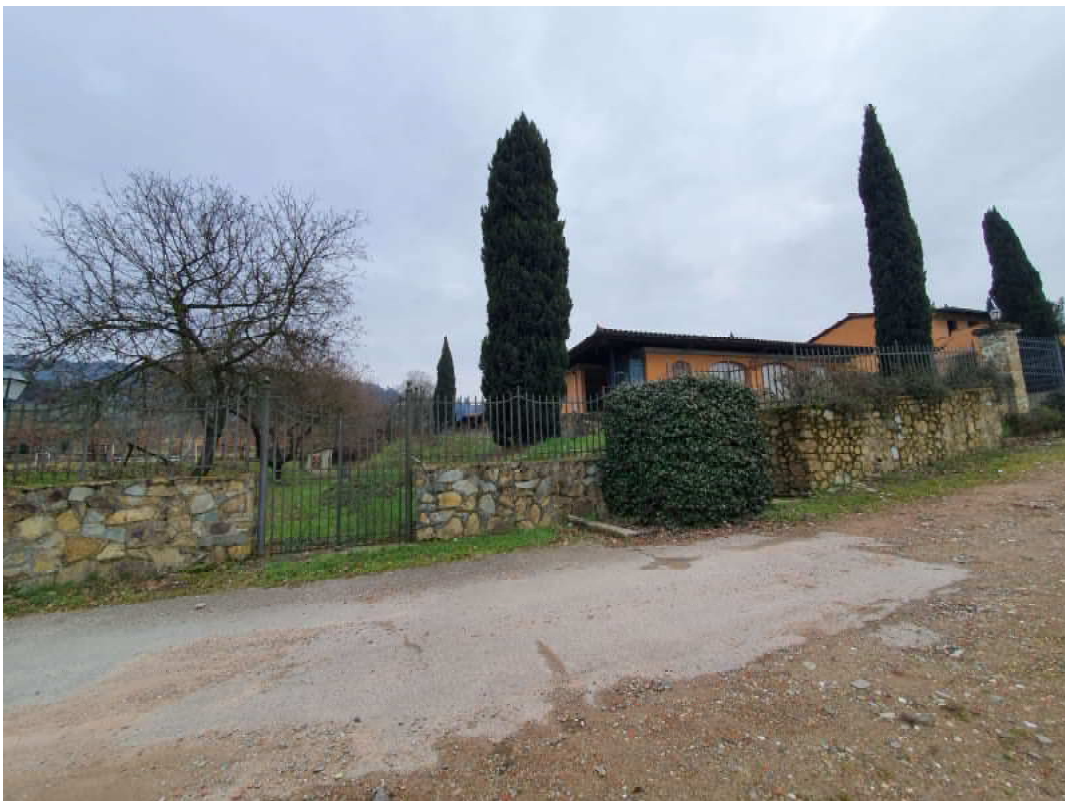
FOTO 40 – Ripresa fotografica maneggio/stalle da strada di percorrenza interna principale