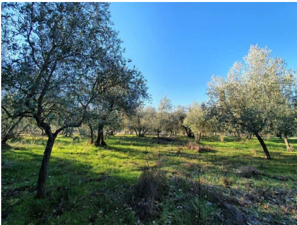
FOTO 49 – Ripresa fotografica terreni a monte del campo di allenamento cavalli