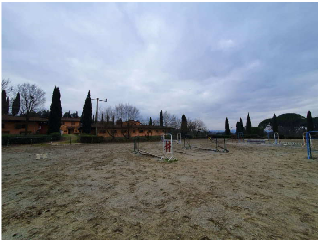
FOTO 43 – Ripresa fotografica di uno dei due campi di allenamento cavalli accanto al maneggio/stalle