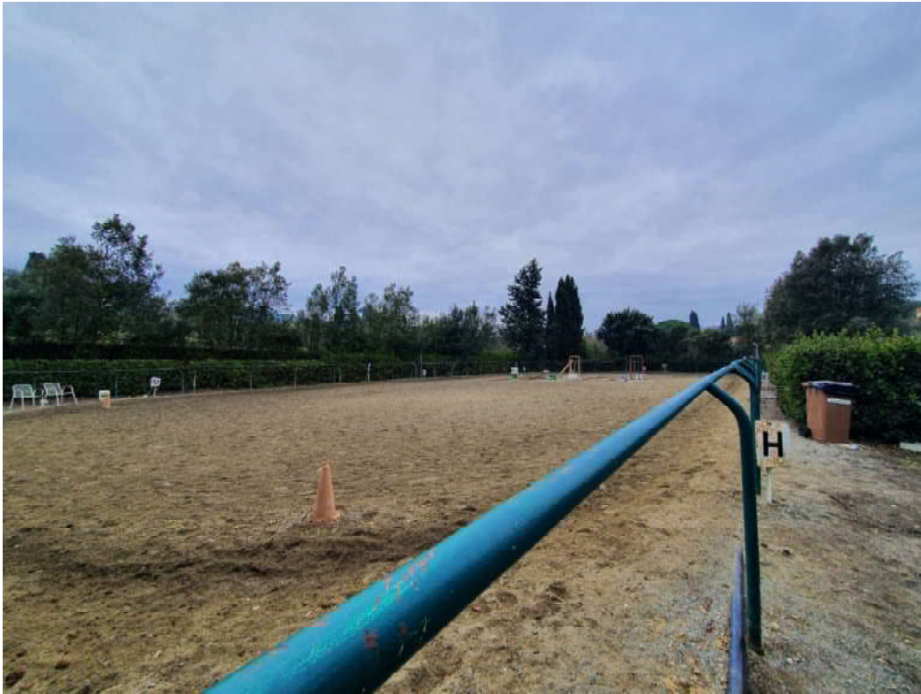
FOTO 37 – Ripresa fotografica di uno dei due campi di allenamento cavalli