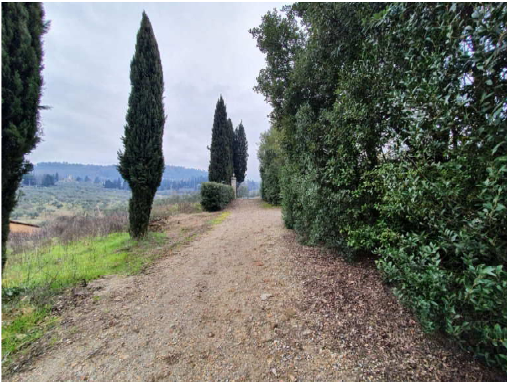
FOTO 35 – Ripresa fotografica strada laterale che porta ad ulteriore accesso da via Vernalese ed ad uno dei due campi di allenamento cavalli