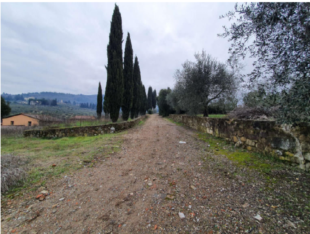
FOTO 34 – Ripresa fotografica strada laterale che porta ad ulteriore accesso da via Vernalese ed ad uno dei due campi di allenamento cavalli