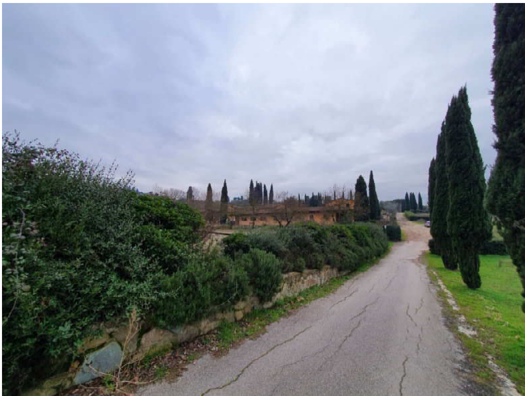
FOTO 01 – Ripresa fotografica strada interna di accesso al Maneggio/stalla