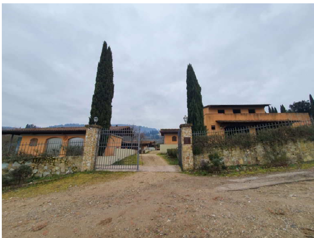
FOTO 02 – Ripresa fotografica ingresso accesso al Maneggio/stalla