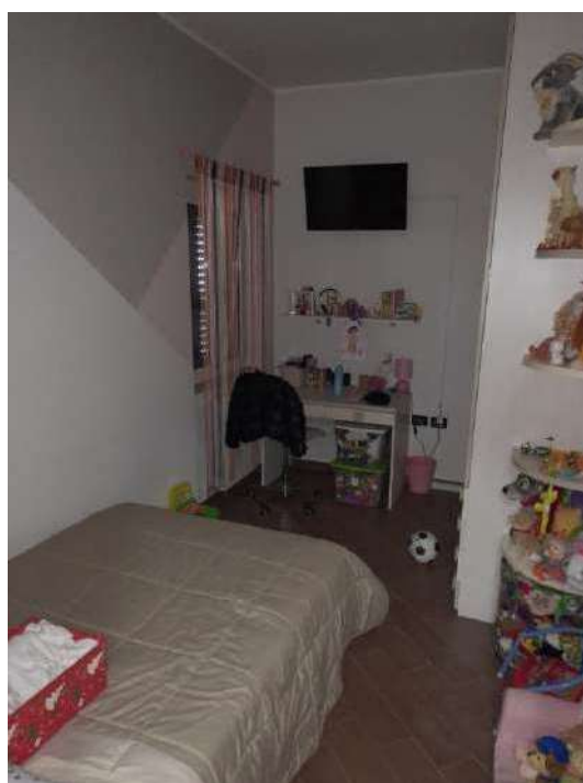
Ripostiglio e camera da letto adiacente al ripostiglio