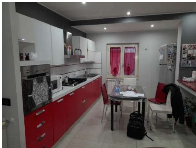
Ingresso al soggiorno e cucina