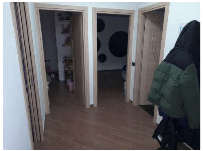
Camera da letto matrimoniale e disimpegno