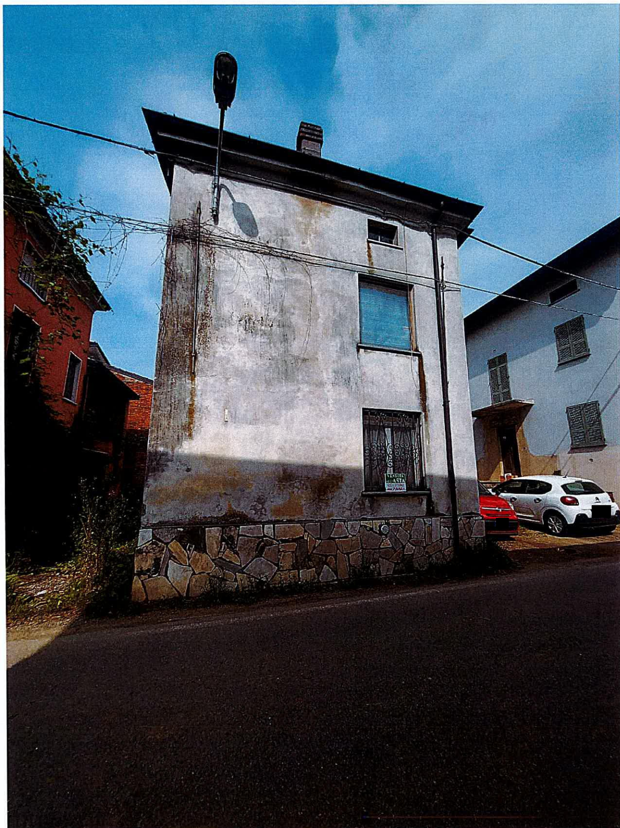
Foto esterne del fabbricato