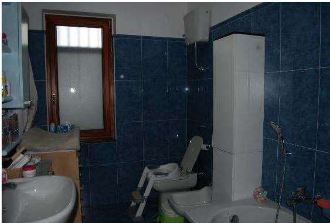
Foto n. 40 - LOTTO 1 - P1 - wc2