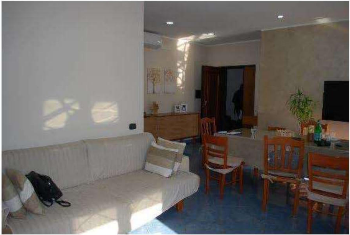
Foto n. 27 - LOTTO 1- P1 ingresso- soggiorno