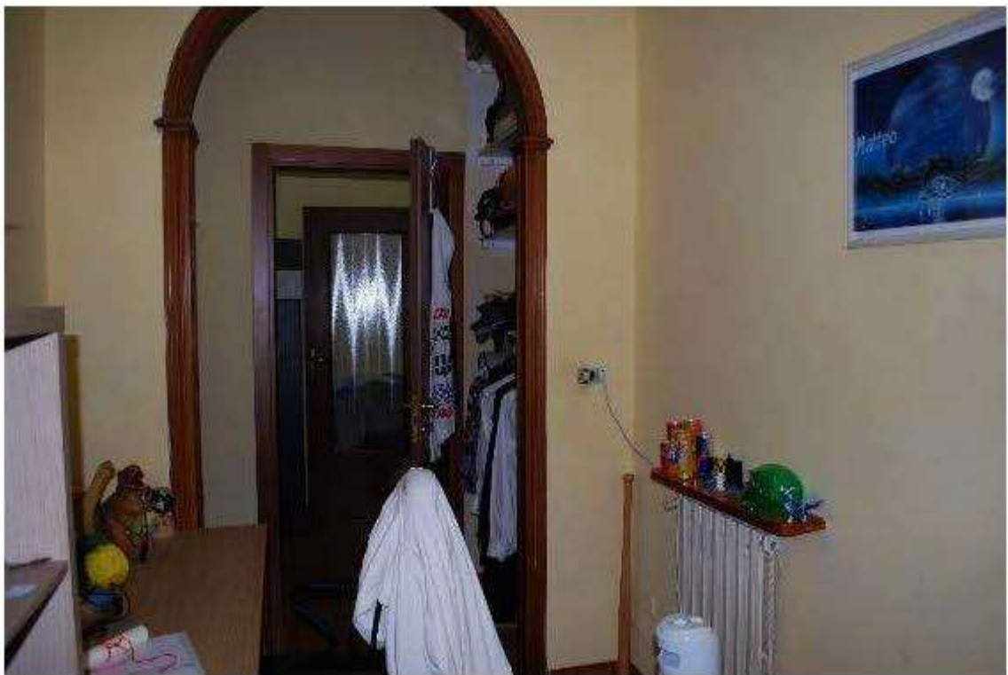
Foto n. 14 - LOTTO 1-PT- camera da letto 1