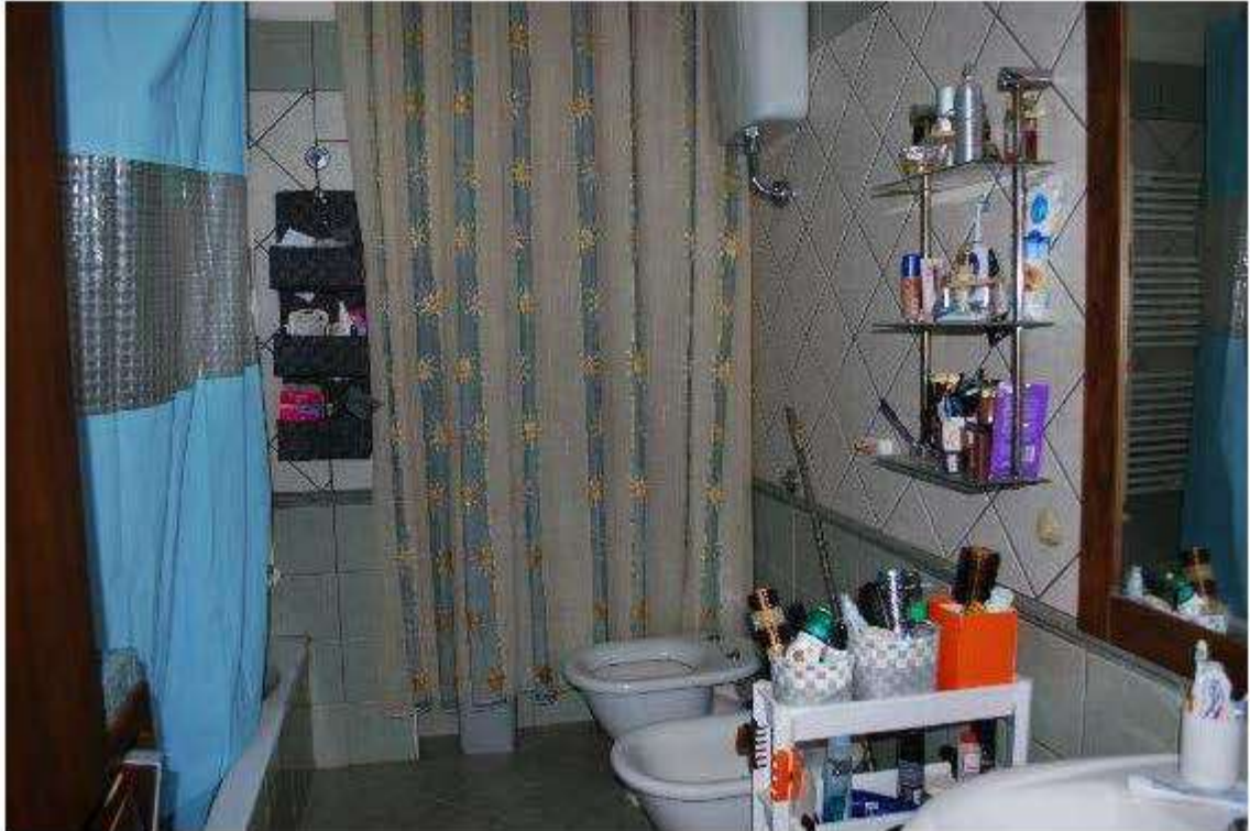
Foto n. 18 - LOTTO 1-PT-wc