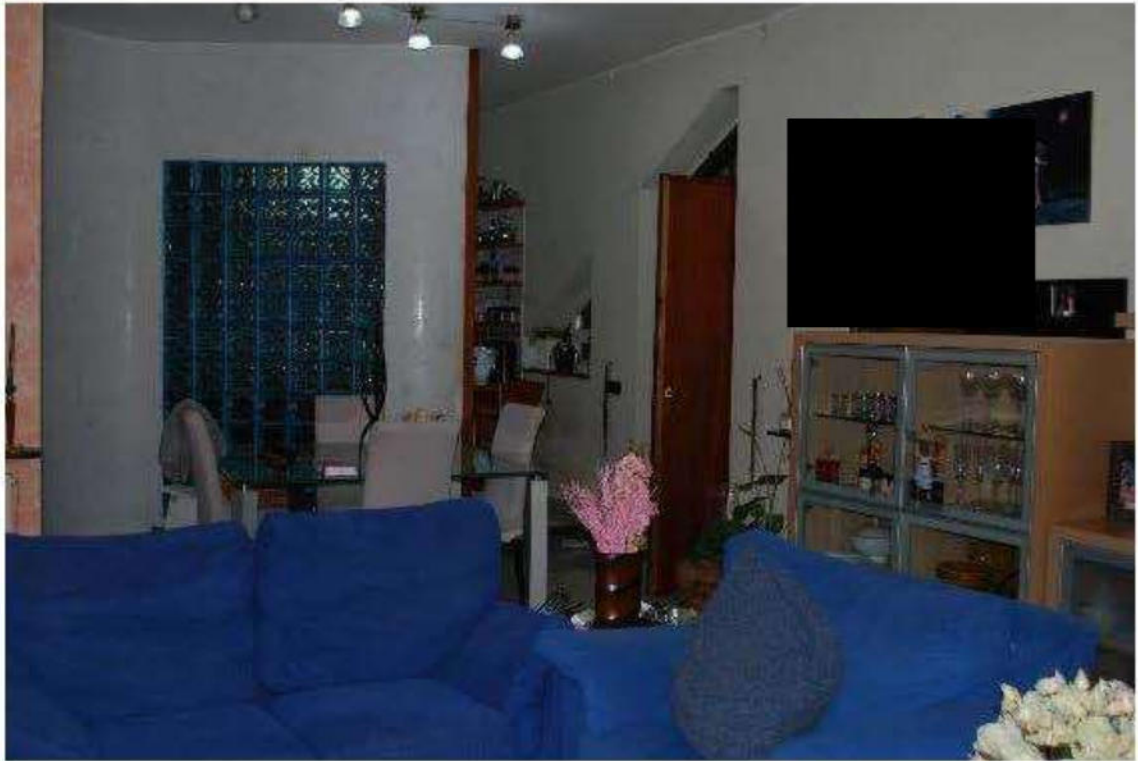
Foto n. 7 - LOTTO 1-PT-soggiorno