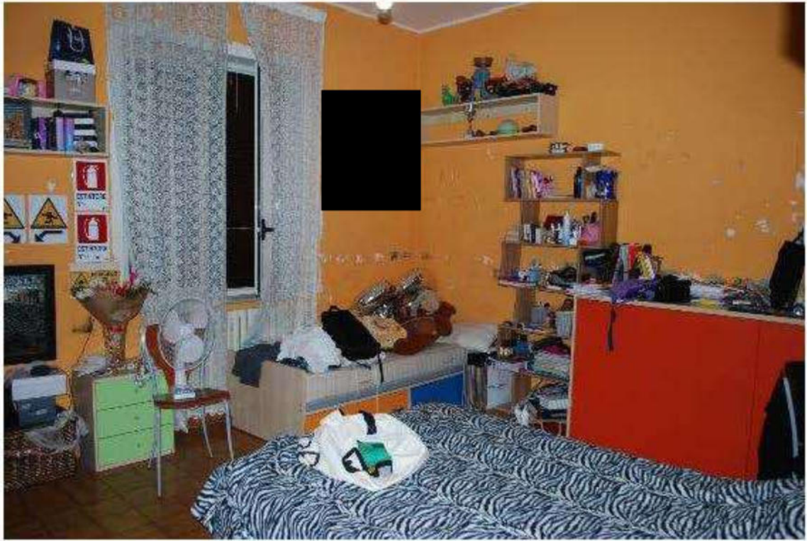
Foto n. 19 - LOTTO 1-PT- camera da letto 3