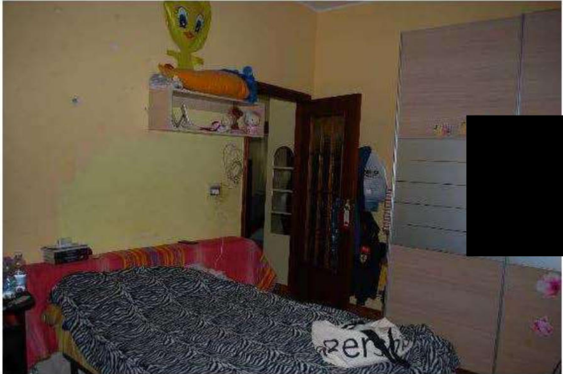
Foto n. 20 - LOTTO 1-PT- camera da letto 3