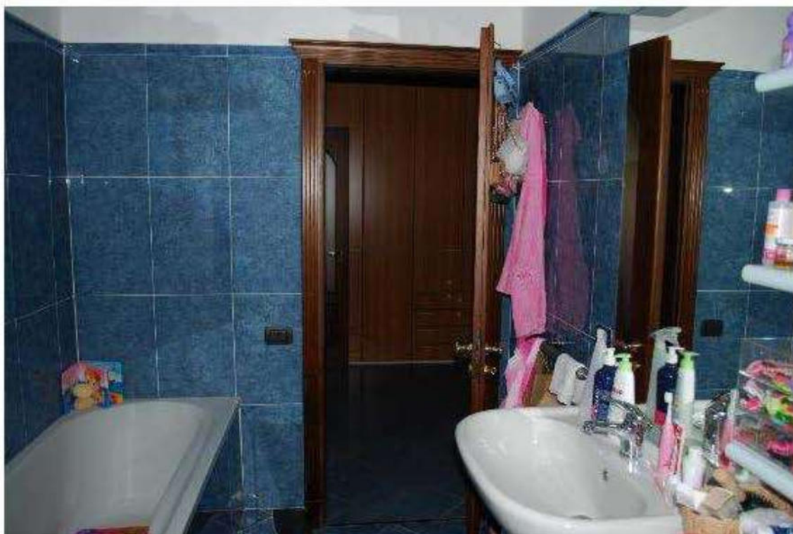
Foto n. 41 - LOTTO 1- P1- wc2