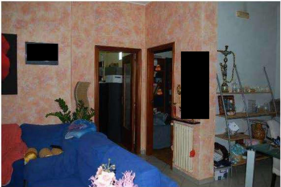
Foto n. 8 - LOTTO 1-PT-soggiorno