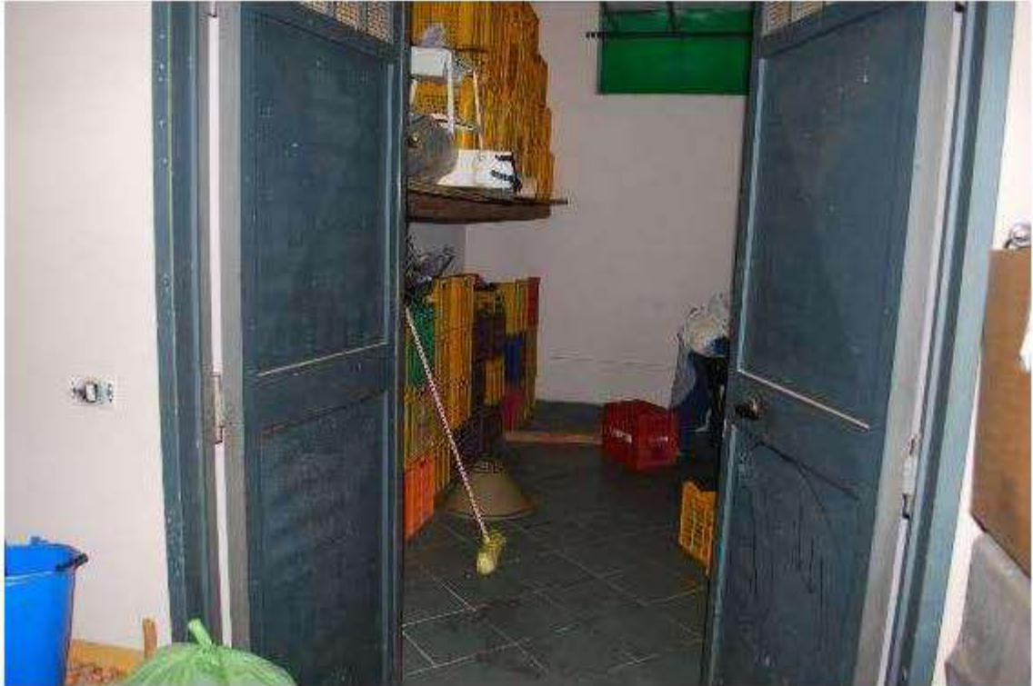
Foto n. 24 - LOTTO 1 - PT- garage/cantina