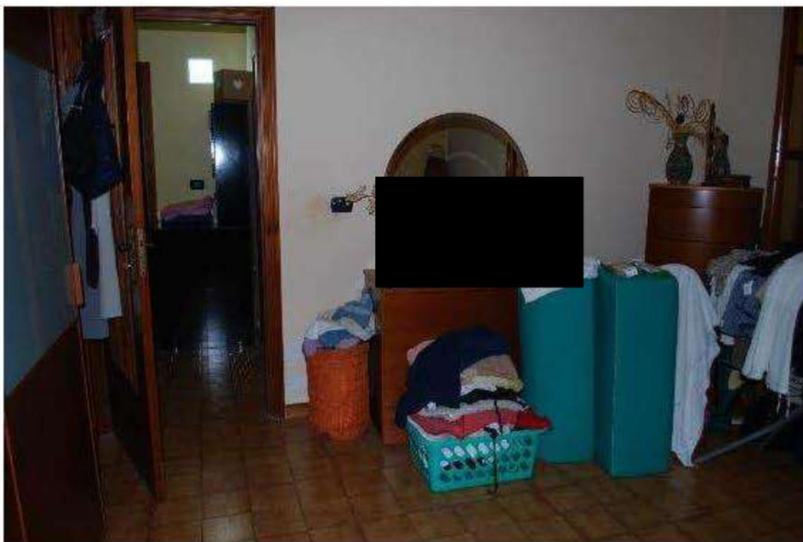
Foto n. 16 - LOTTO 1 -PT-camera da letto 2