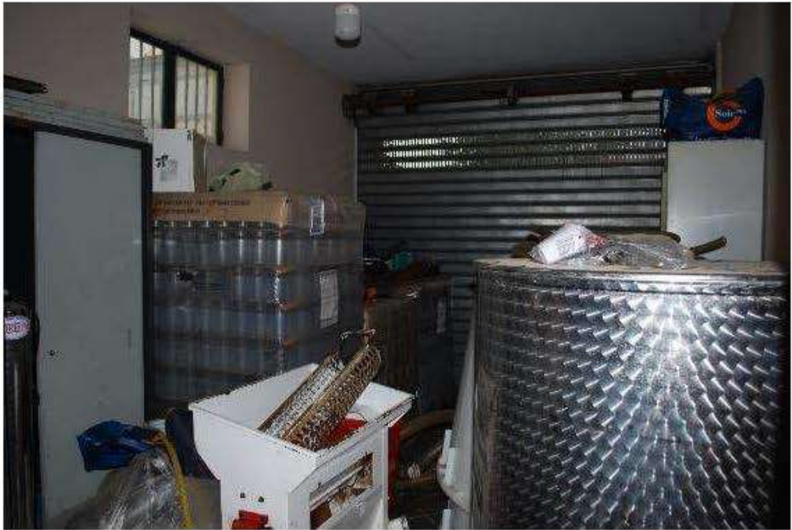
Foto n. 23 - LOTTO 1 -PT- garage/cantina