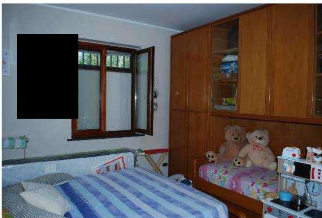
Foto n. 42 - LOTTO 1- P1- camera da letto 3