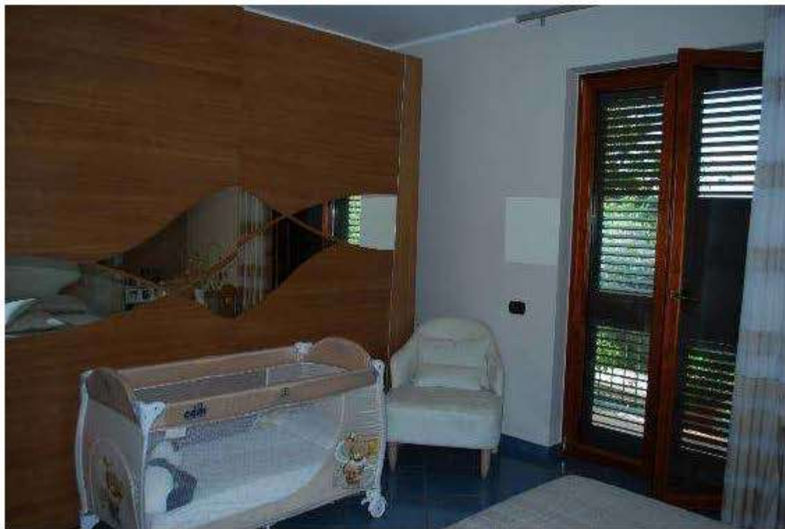
Foto n. 36 - LOTTO 1- P1-camera da letto 2