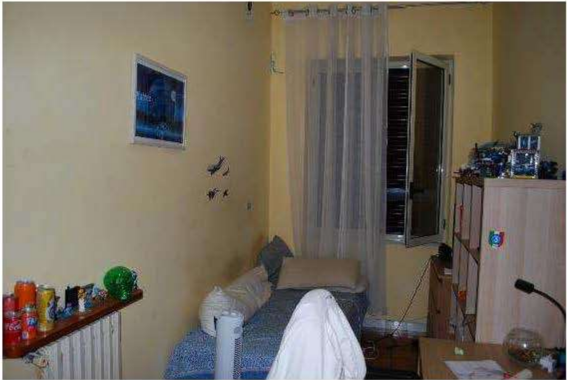
Foto n. 13 - LOTTO 1 -PT- camera da letto 1