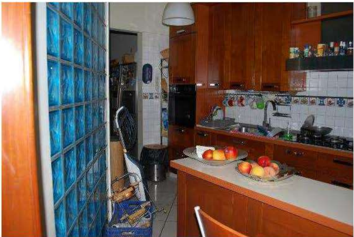
Foto n. 12 - LOTTO 1 -PT-cucina