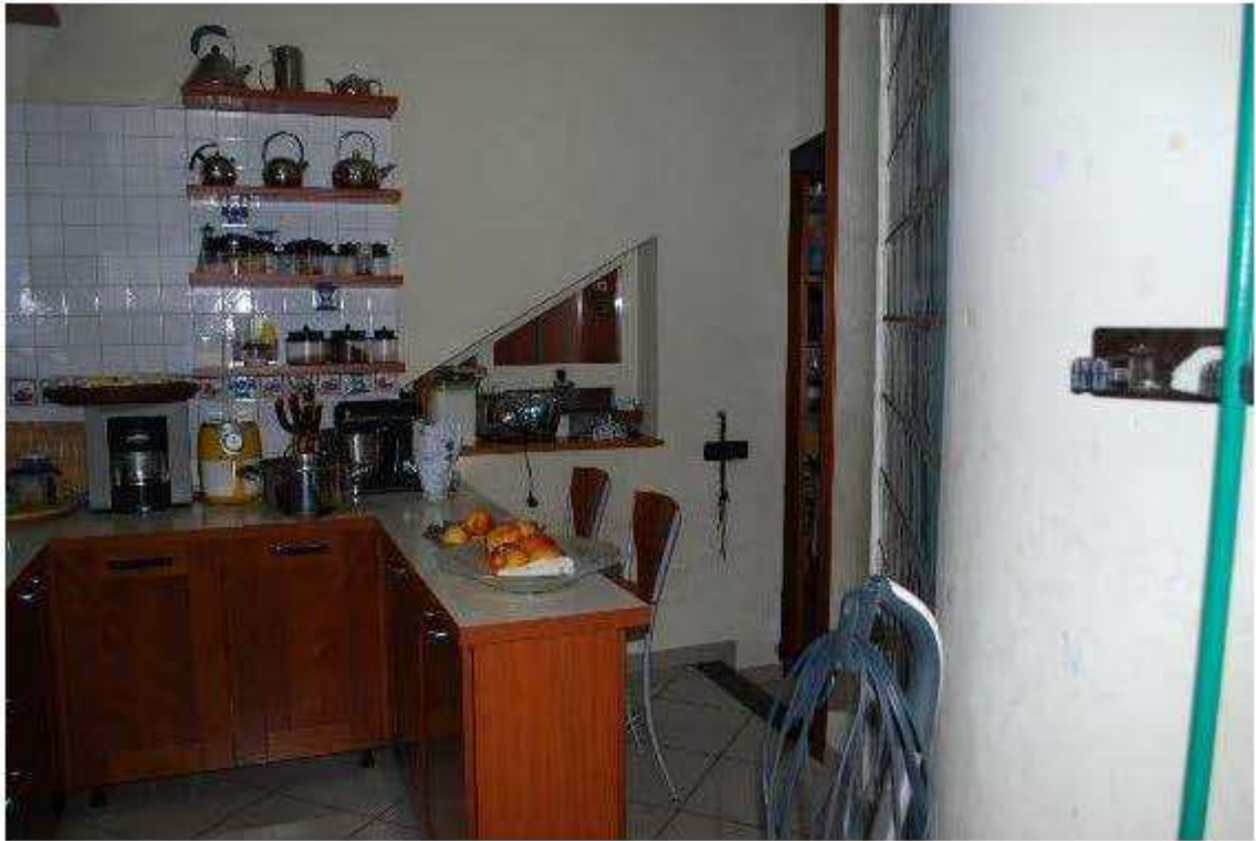
Foto n. 11 - LOTTO 1 -PT-cucina