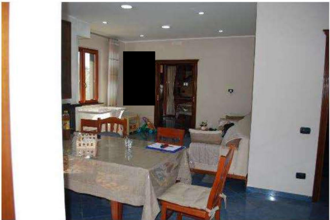
Foto n. 28 - LOTTO 1- P1- soggiorno