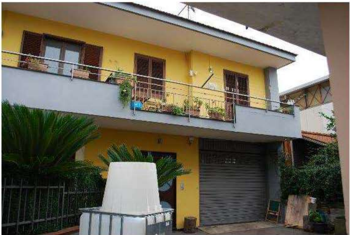
Foto n. 22 - LOTTO 1-PT-ingresso garage