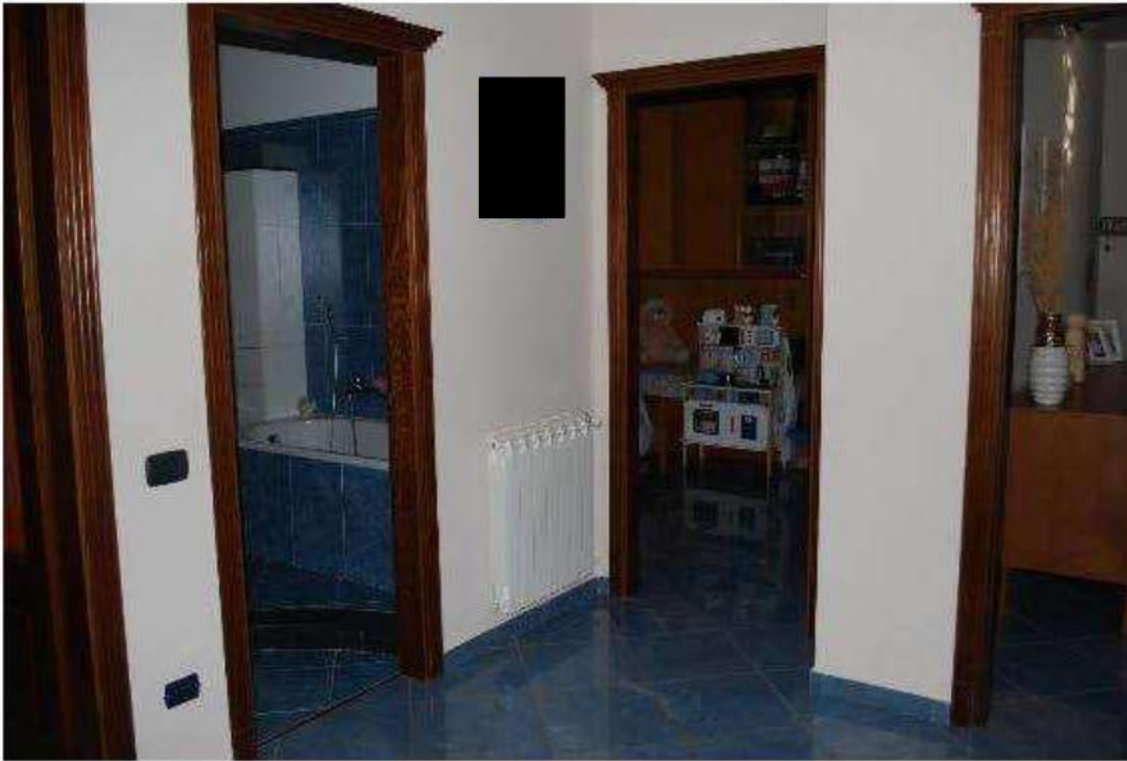
Foto n. 33 - LOTTO 1- P1- disimpegno