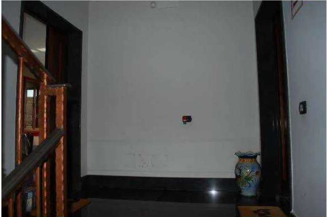
Foto n. 26 - LOTTO 1- P1 -pianerottolo primo piano