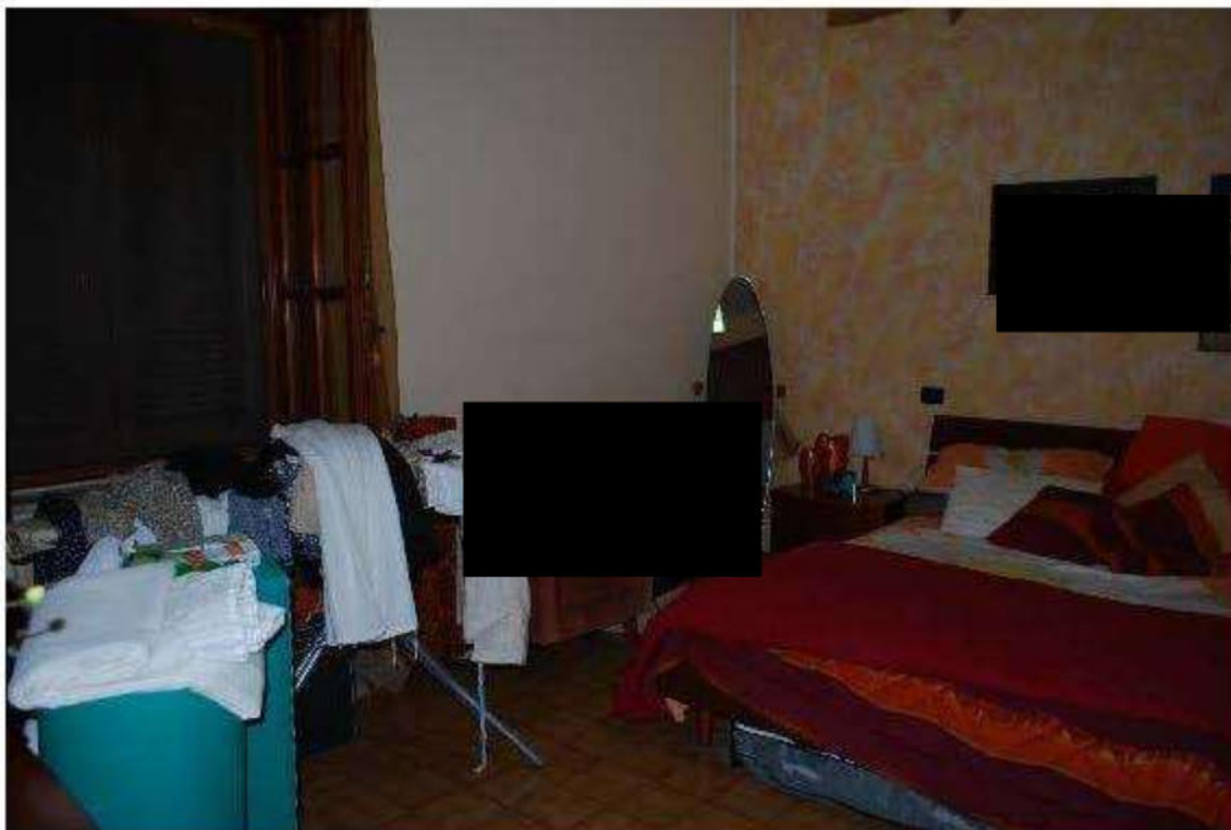
Foto n. 15 - LOTTO 1 - PT-camera da letto 2