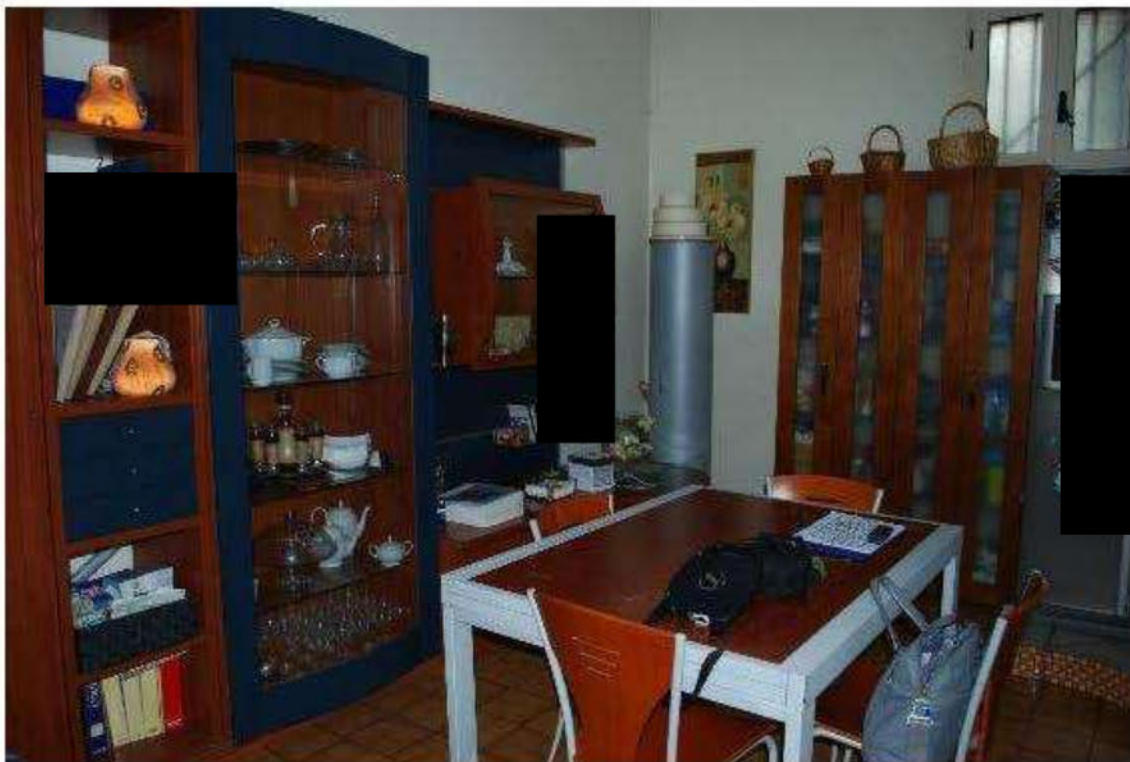
Foto n. 9 - LOTTO 1-PT-camera da pranzo