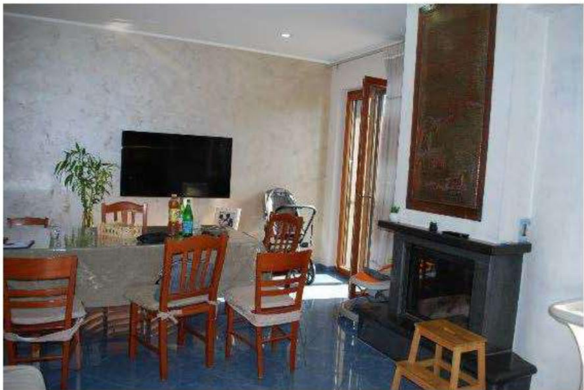
Foto n. 30 - LOTTO 1-P1- soggiorno