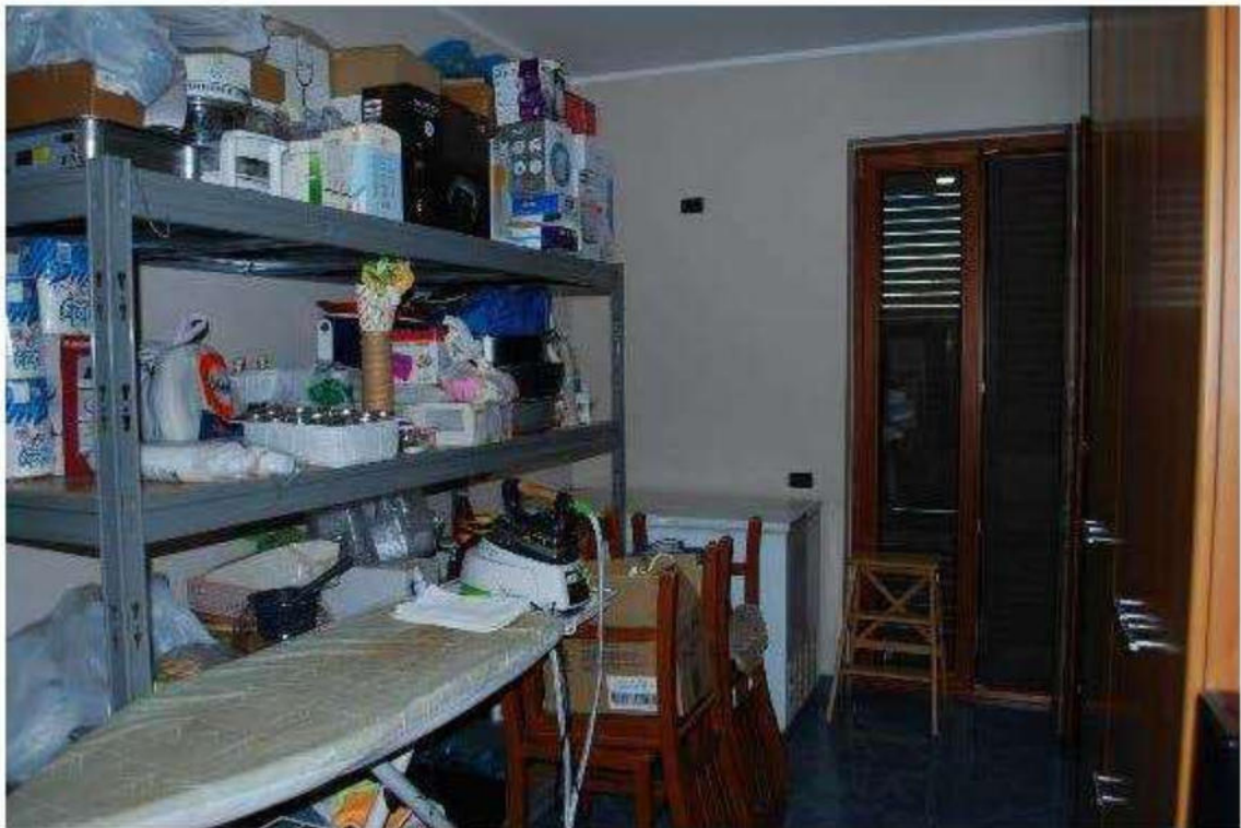
Foto n. 34 - LOTTO 1- P1- camera da letto 1