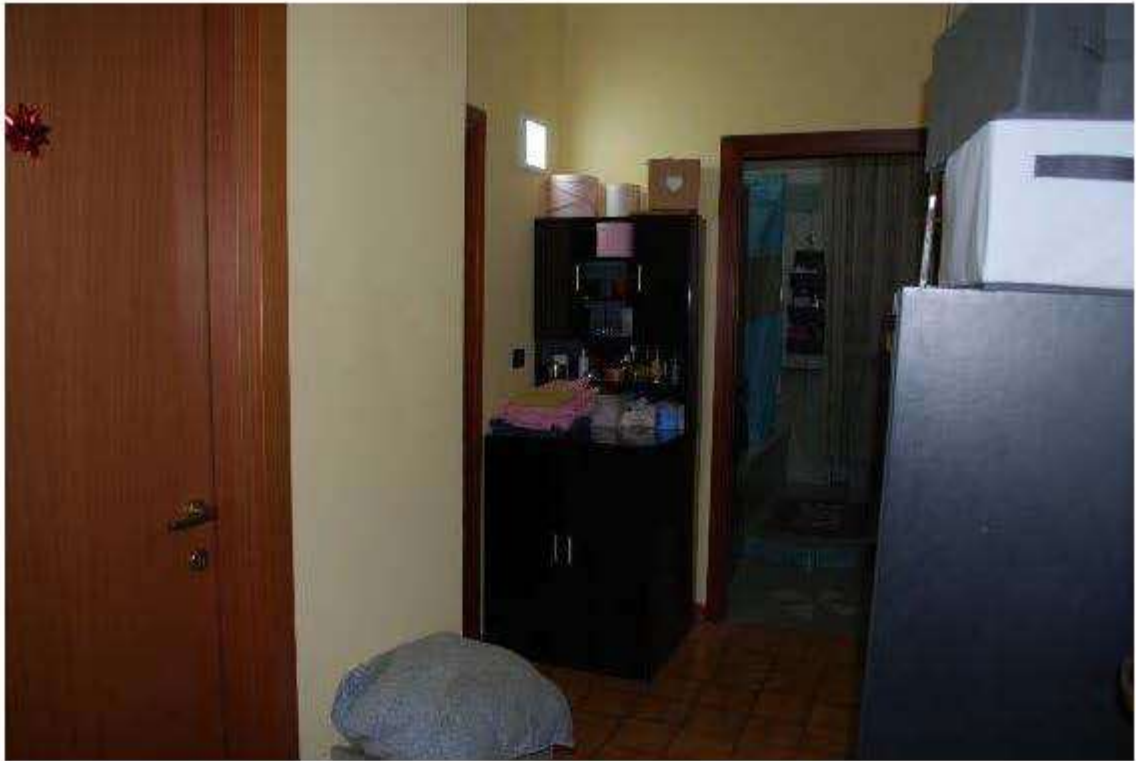
Foto n. 17 - LOTTO 1 -PT-disimpegno