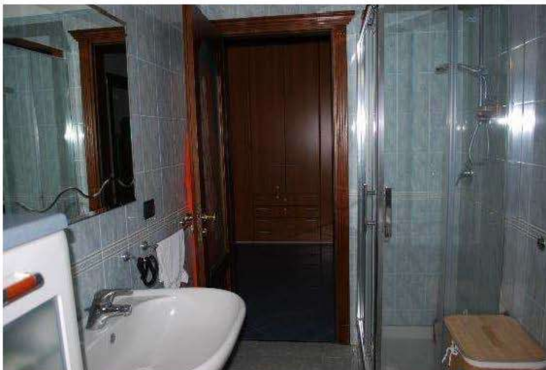
Foto n. 39 - LOTTO 1 - P1 - wc1