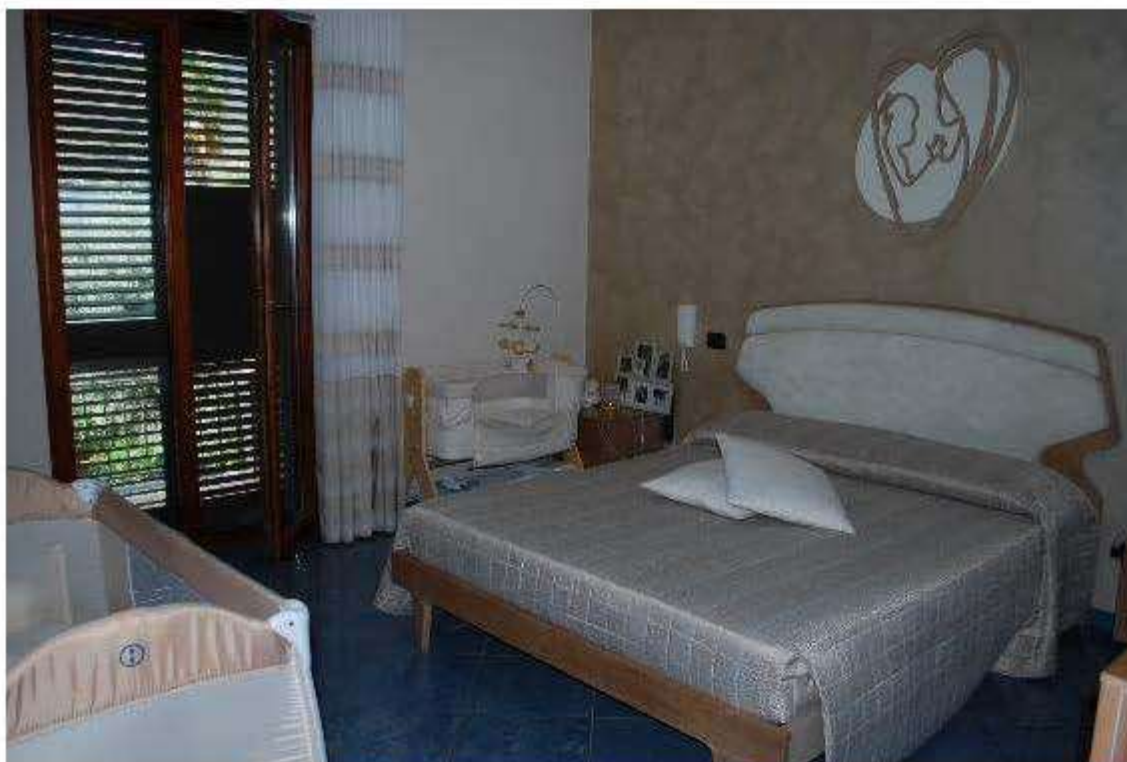
Foto n. 35 - LOTTO 1- P1-camera da letto 2