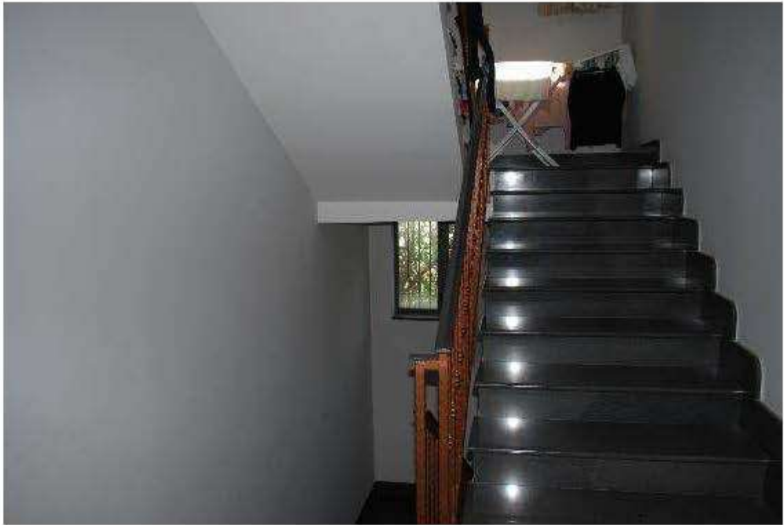
Foto n. 25 - LOTTO 1- P1 -scala