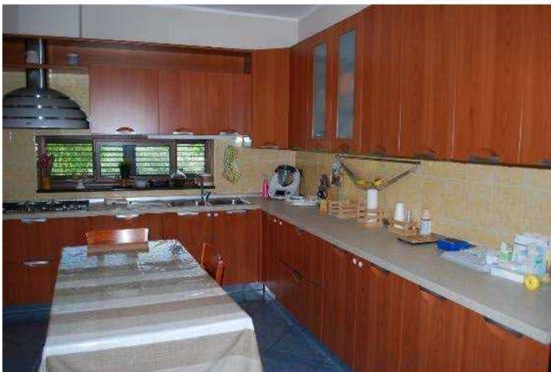
Foto n. 31 - LOTTO 1- P1- cucina