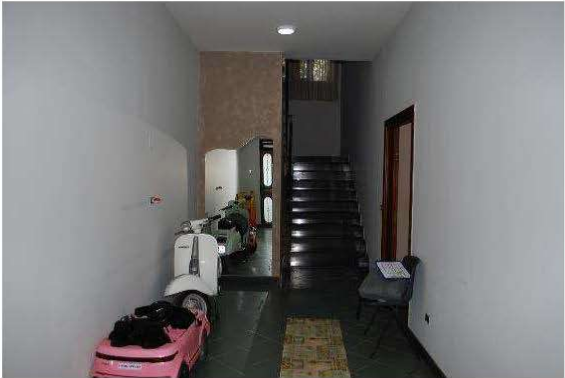
Foto n. 21 - LOTTO 1 - PT-androne