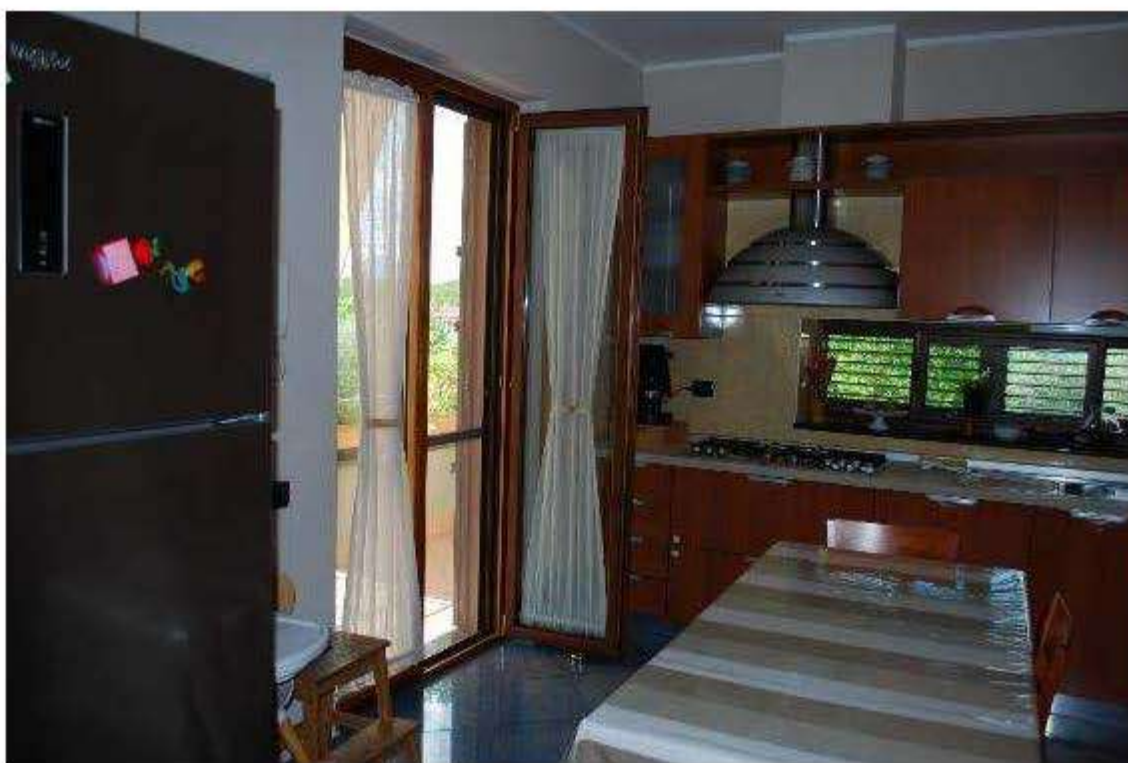
Foto n. 32 - LOTTO 1- P1- cucina