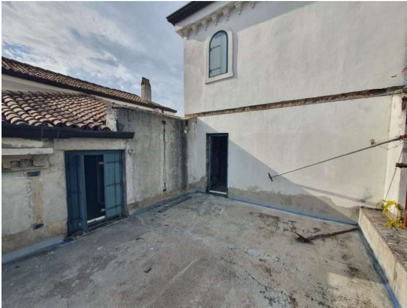
Esterno 3° Piano Terrazza (ex vano soffitta)