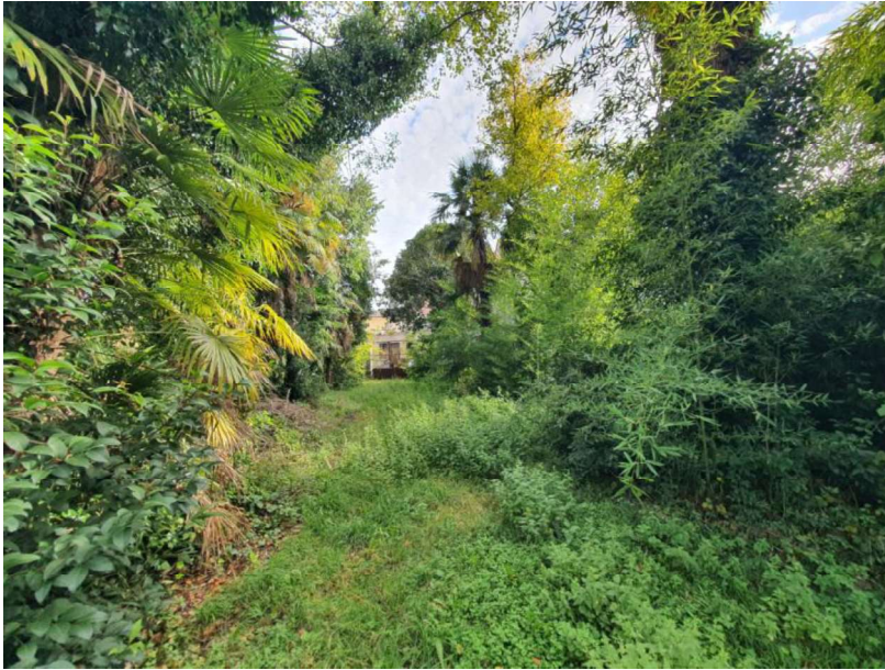
Esterno - Giardino comune