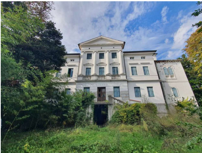
Esterno - Edificio condominiale