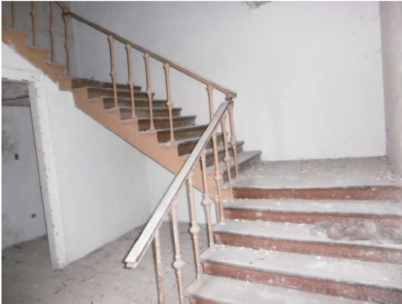
Interno 1° Piano Scala comune