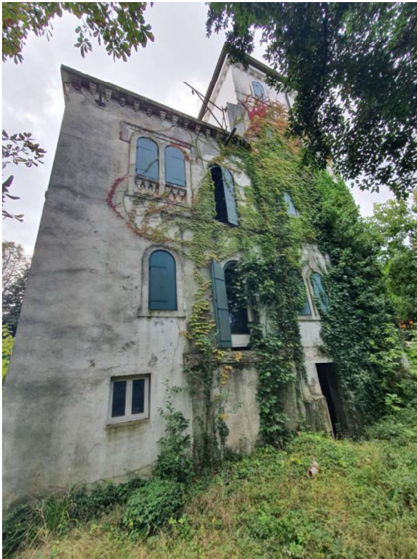
Esterno - Edificio Condominiale