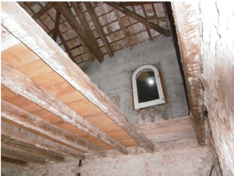
Interno – 3° piano - sub 9 Accesso sottotetto

L'esperto incaricato Geom. Antonio Lippi