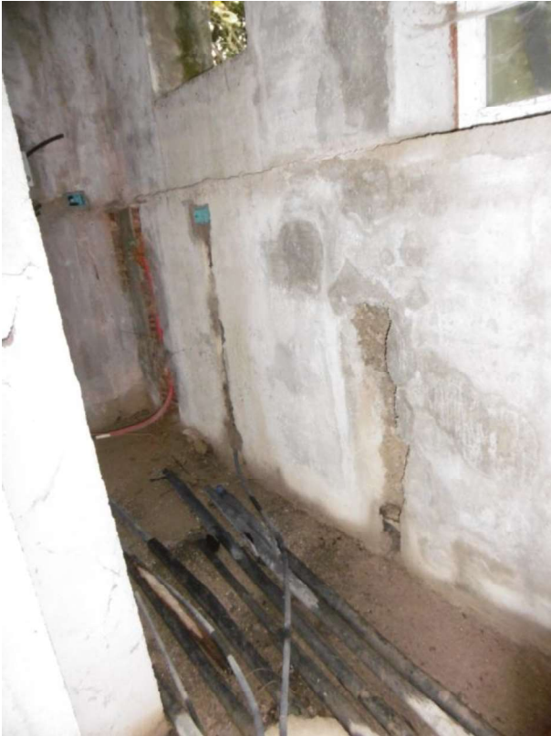
Interno – Piano Terra – Sub 9 -Cantina