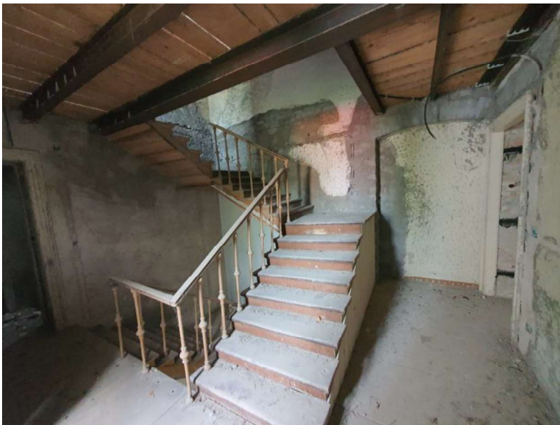
Interno 2° Piano Scala comune