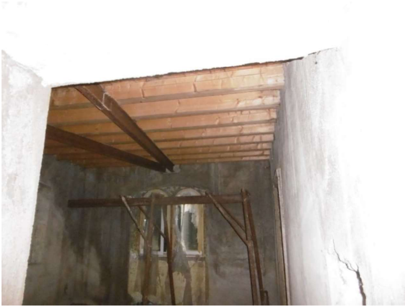
Interno – 2° Piano - sub 9