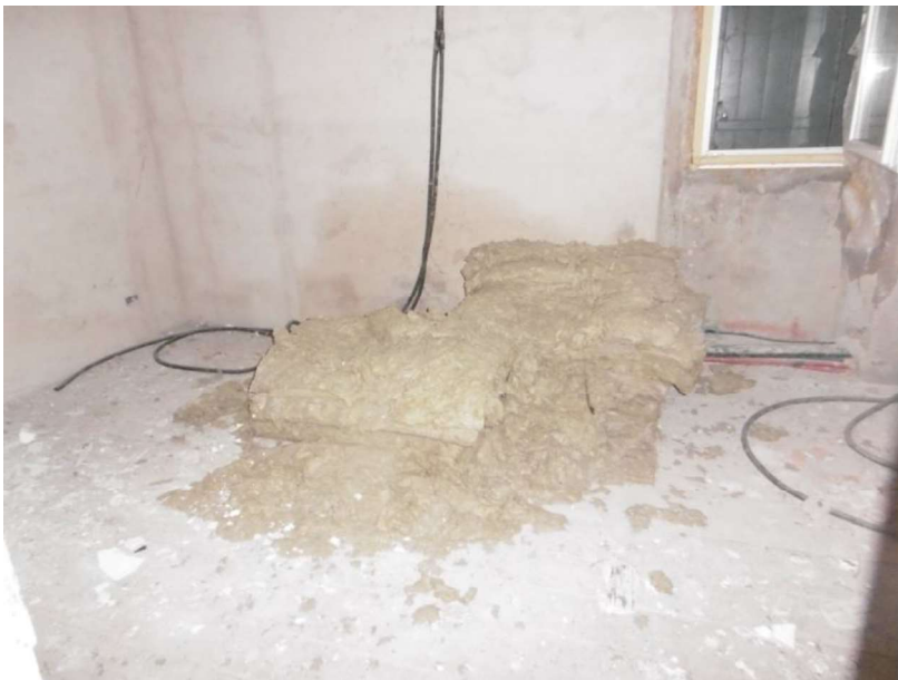
Interno – 2° Piano - sub 9

L'esperto incaricato Geom. Antonio Lippi