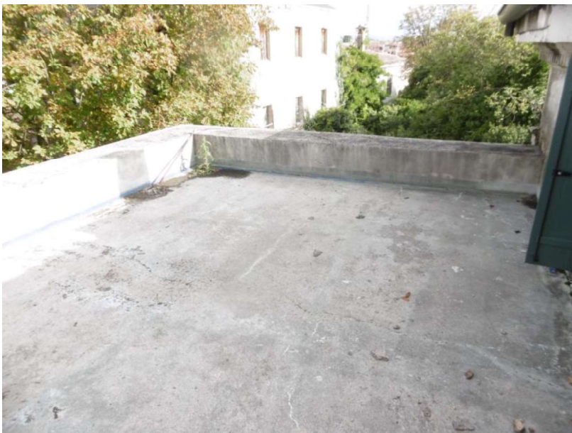
Esterno 3° Piano Terrazza (ex vano soffitta)