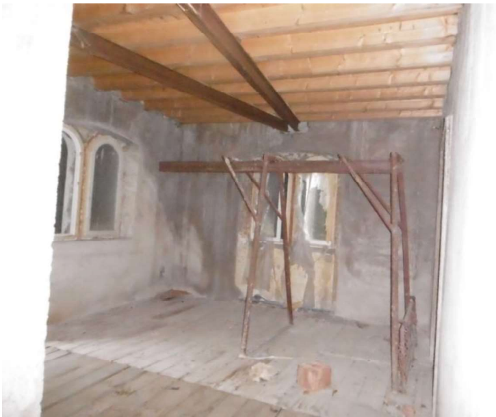
Interno – 2° Piano – sub 9

L'esperto incaricato Geom. Antonio Lippi