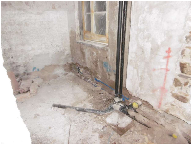
Interno – 2° Piano - sub 9