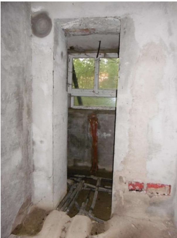
Interno – Piano Terra - Sub 9 -Cantina

L'esperto incaricato Geom. Antonio Lippi