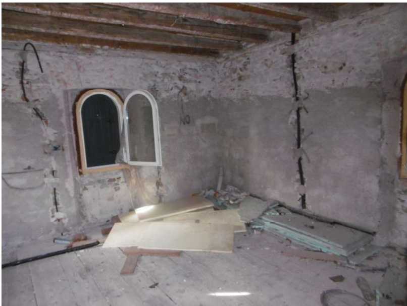
Interno – 3° Piano - sub 9

L'esperto incaricato Geom. Antonio Lippi