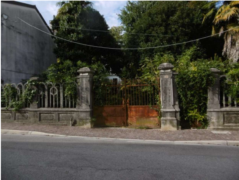
Ingresso proprietà comune (condominio)