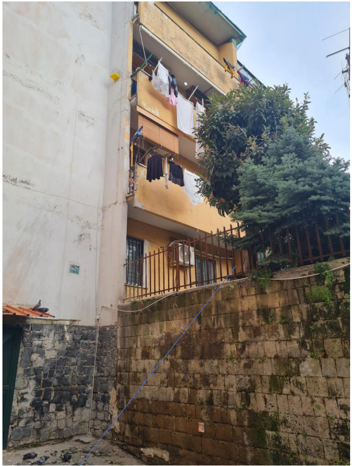
area annessa p.lla 187