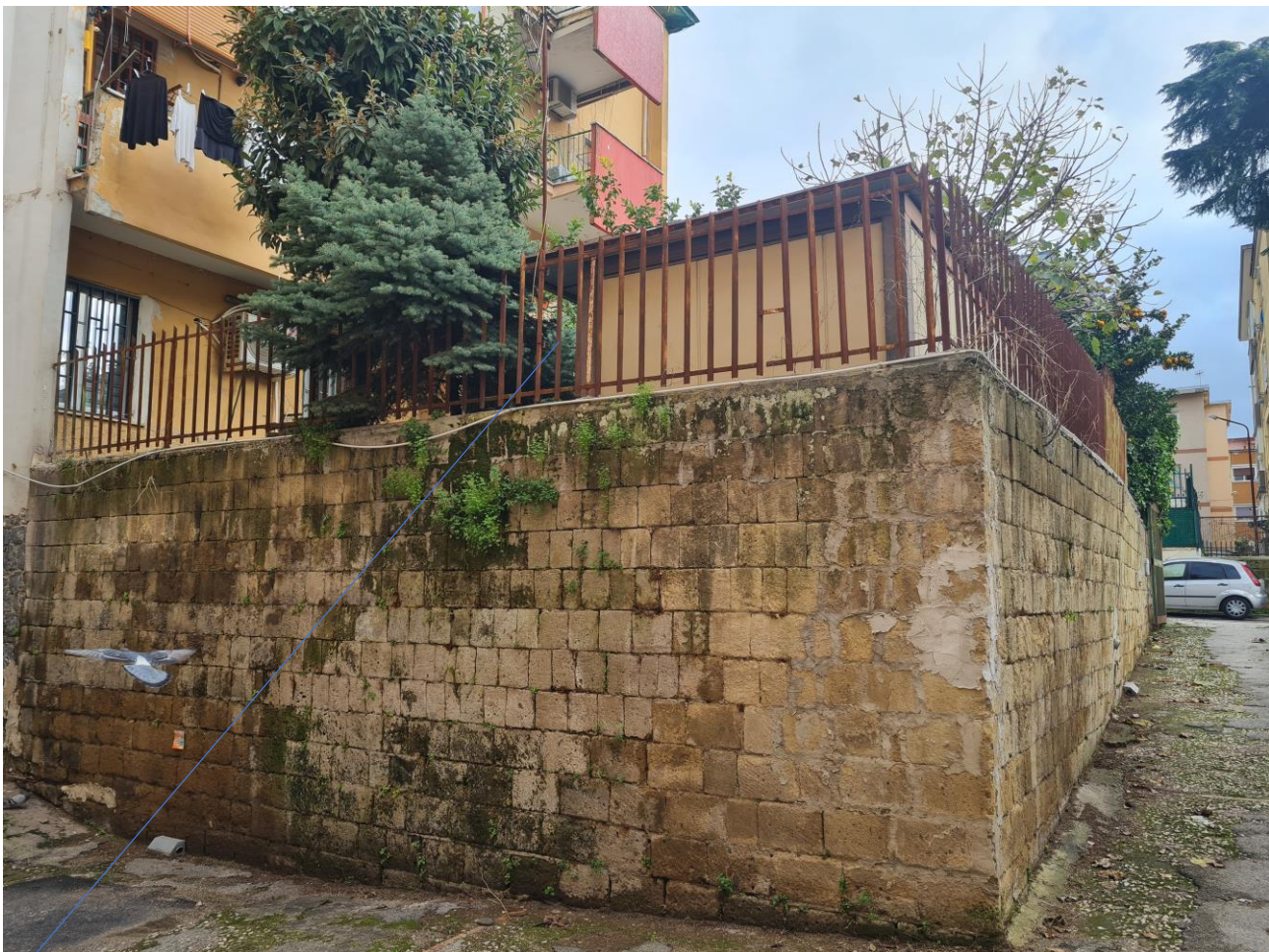
Area annessa p.lla 187