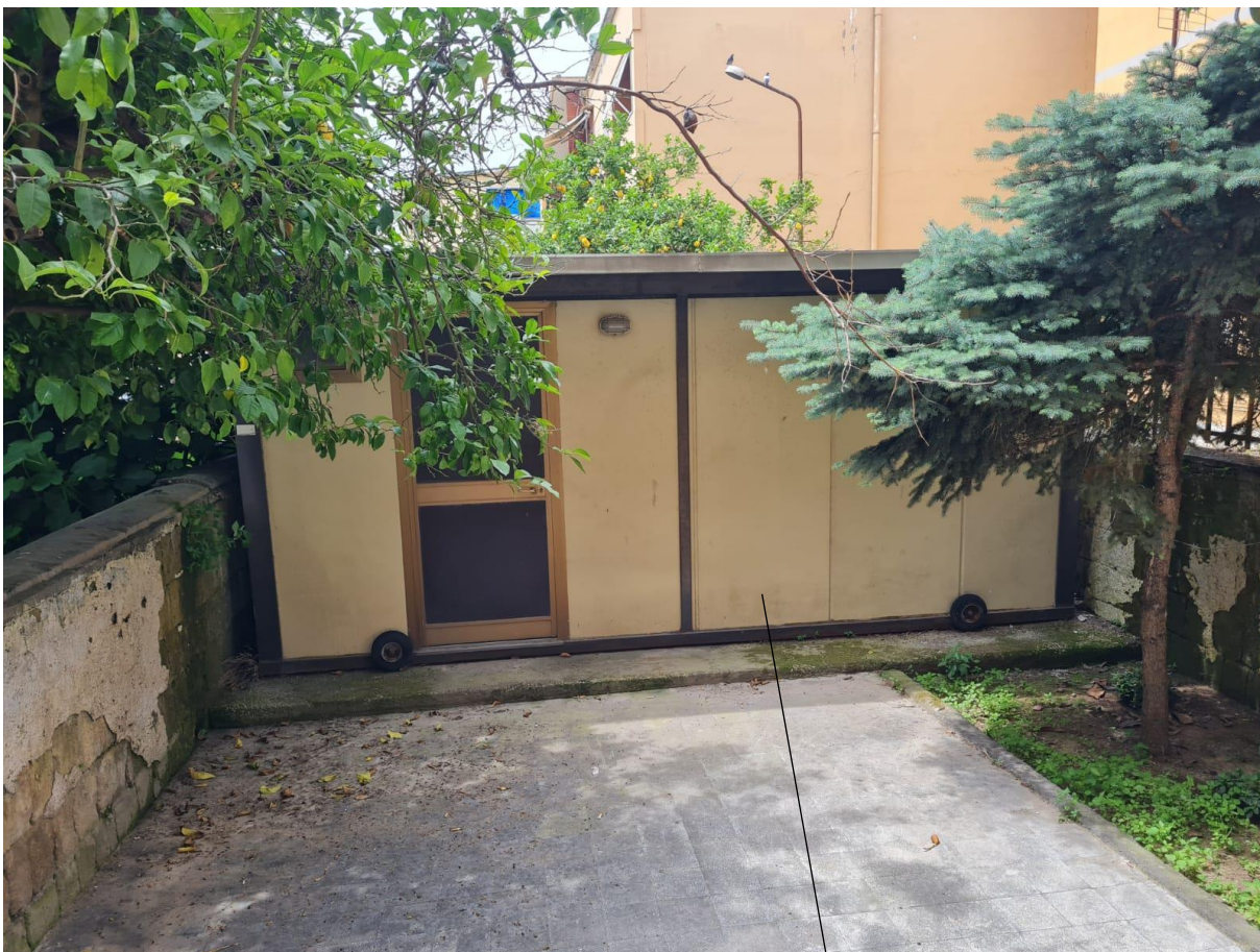
Area esterna annessa alla porzione immobiliare pignorata - ▼ manufatto prefabbricato di cui verranno considerati gli oneri di dismissione