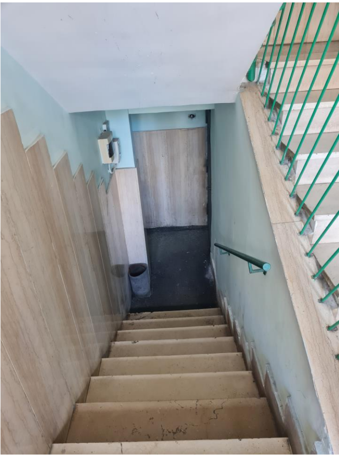
Accesso al piano seminterrato dalla scala del fabbricato