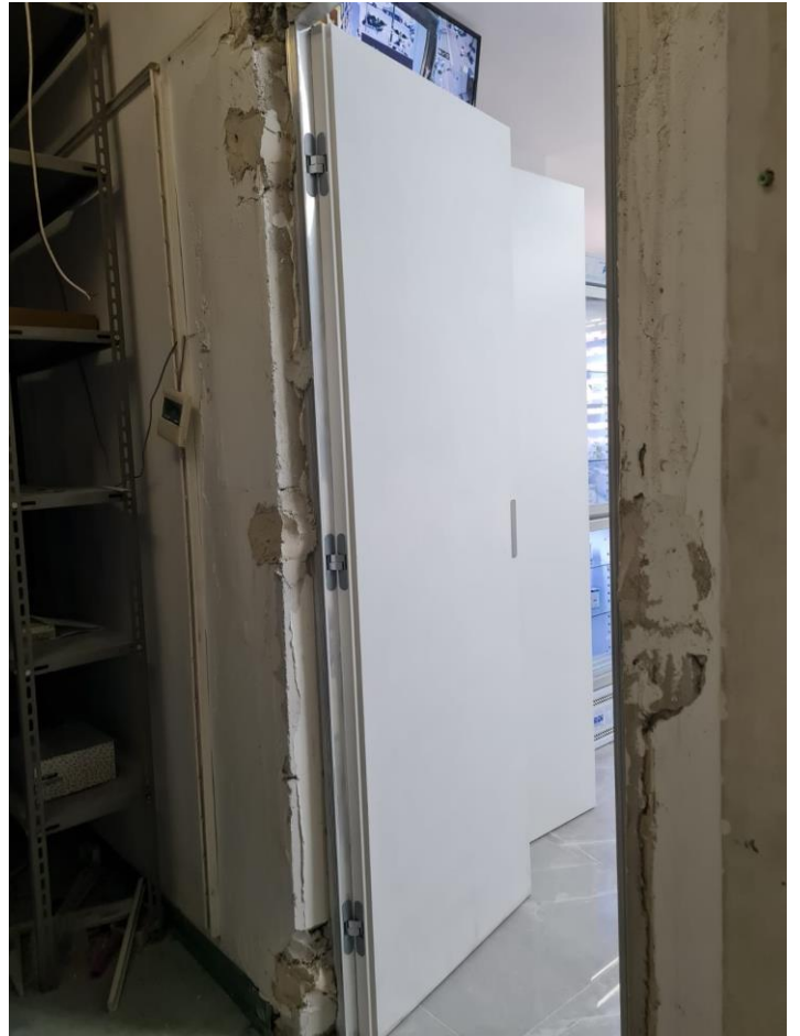
Porta nel corridoio (C1) di collegamento con il sub 13