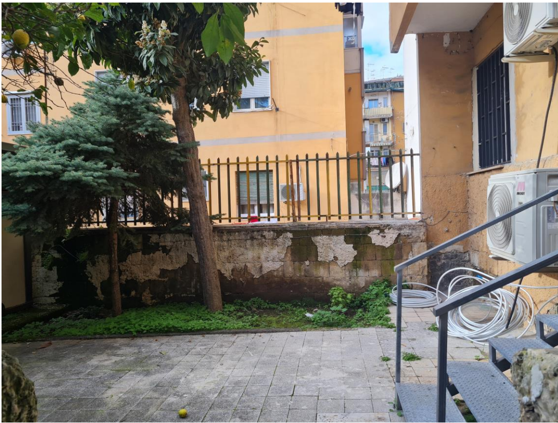
Area annessa all'immobile p.lla 187