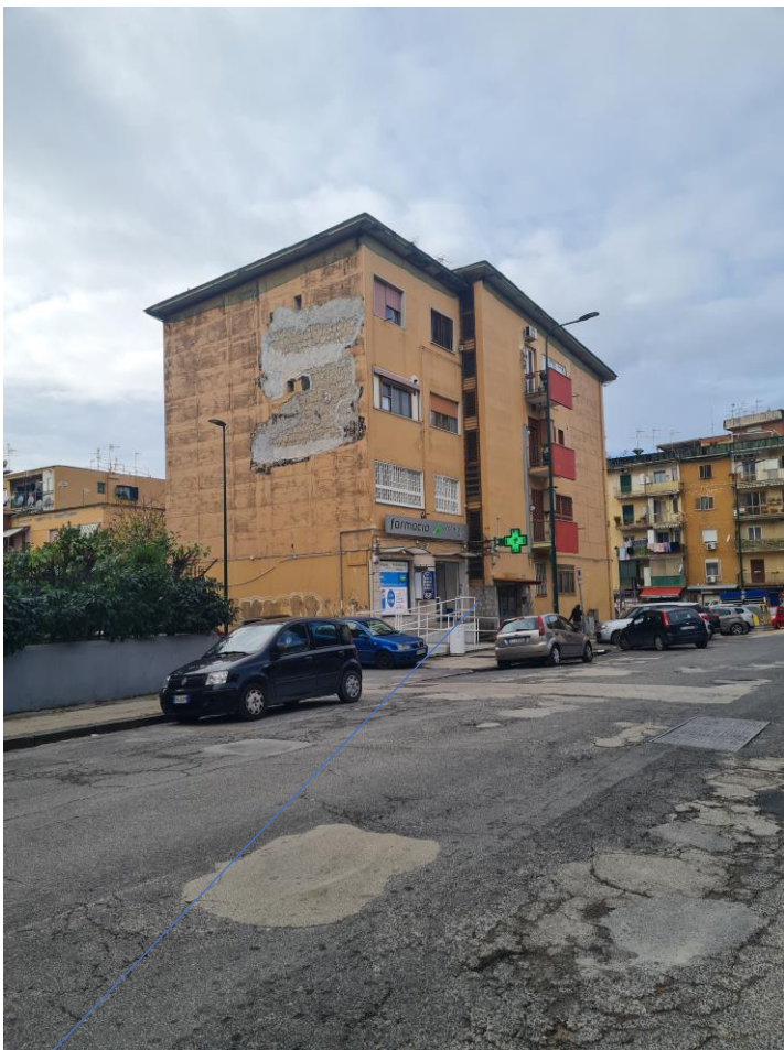
Fabbricato di cui è parte la porzione immobiliare subastata