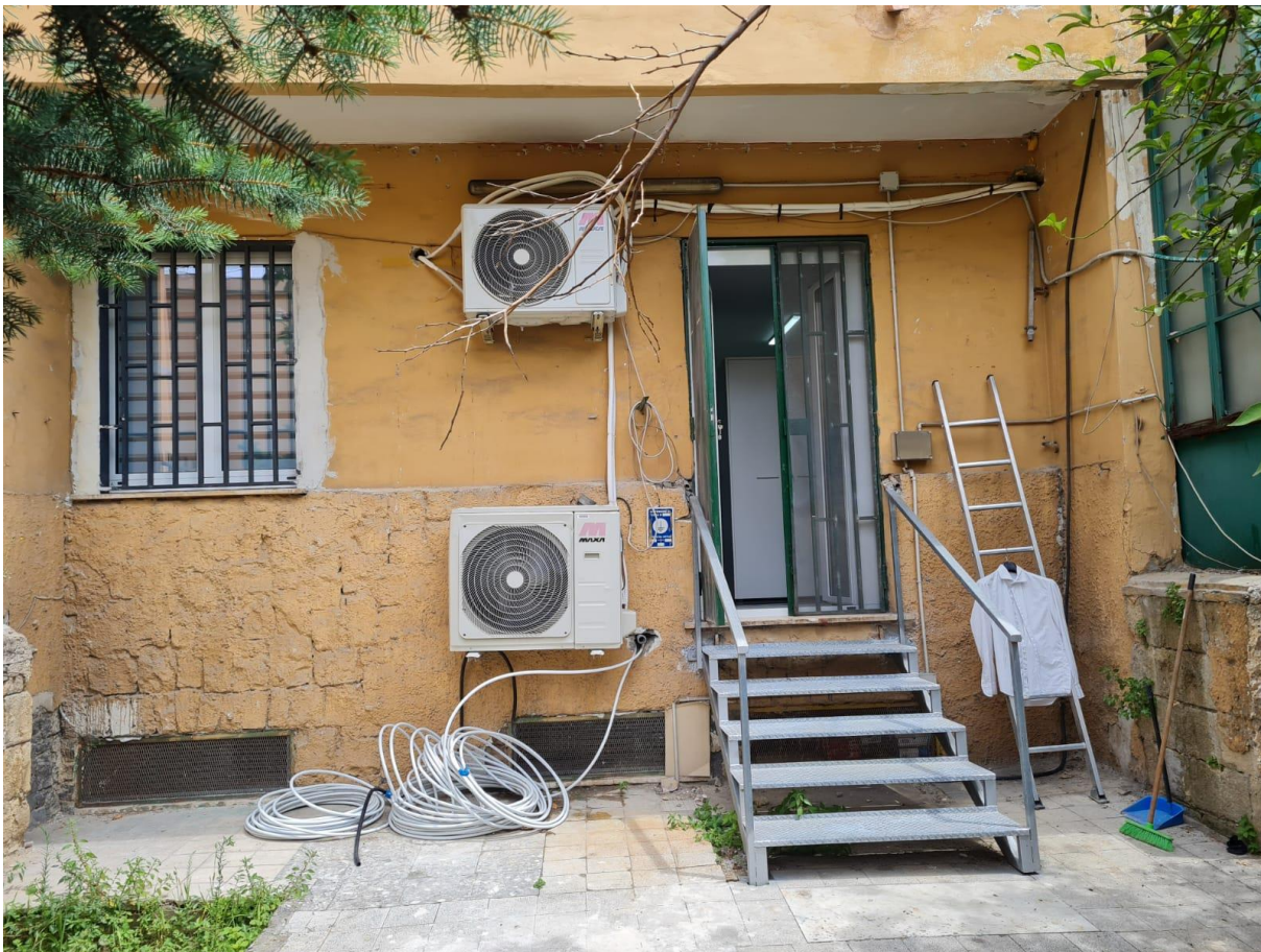
Area urbana connessa all'immobile