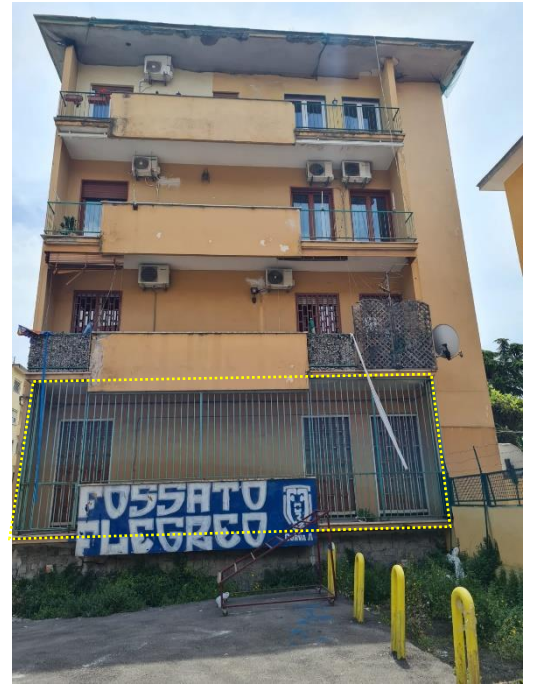
Prospetto su via Giustiniano