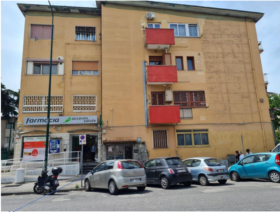
Napoli via Piave, n. 209