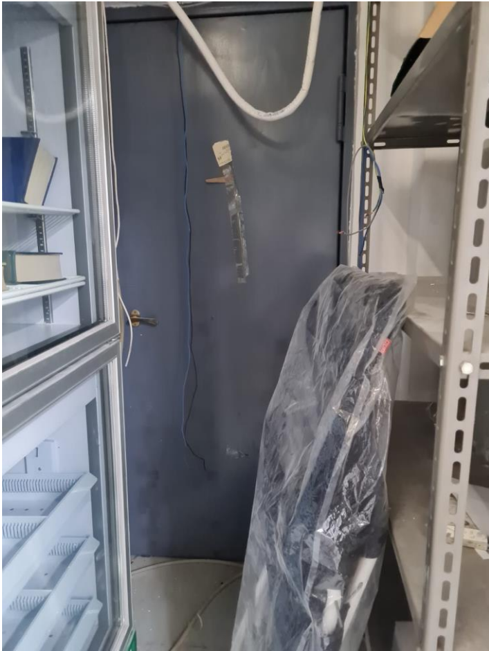
Ingresso (I) dal vano scala