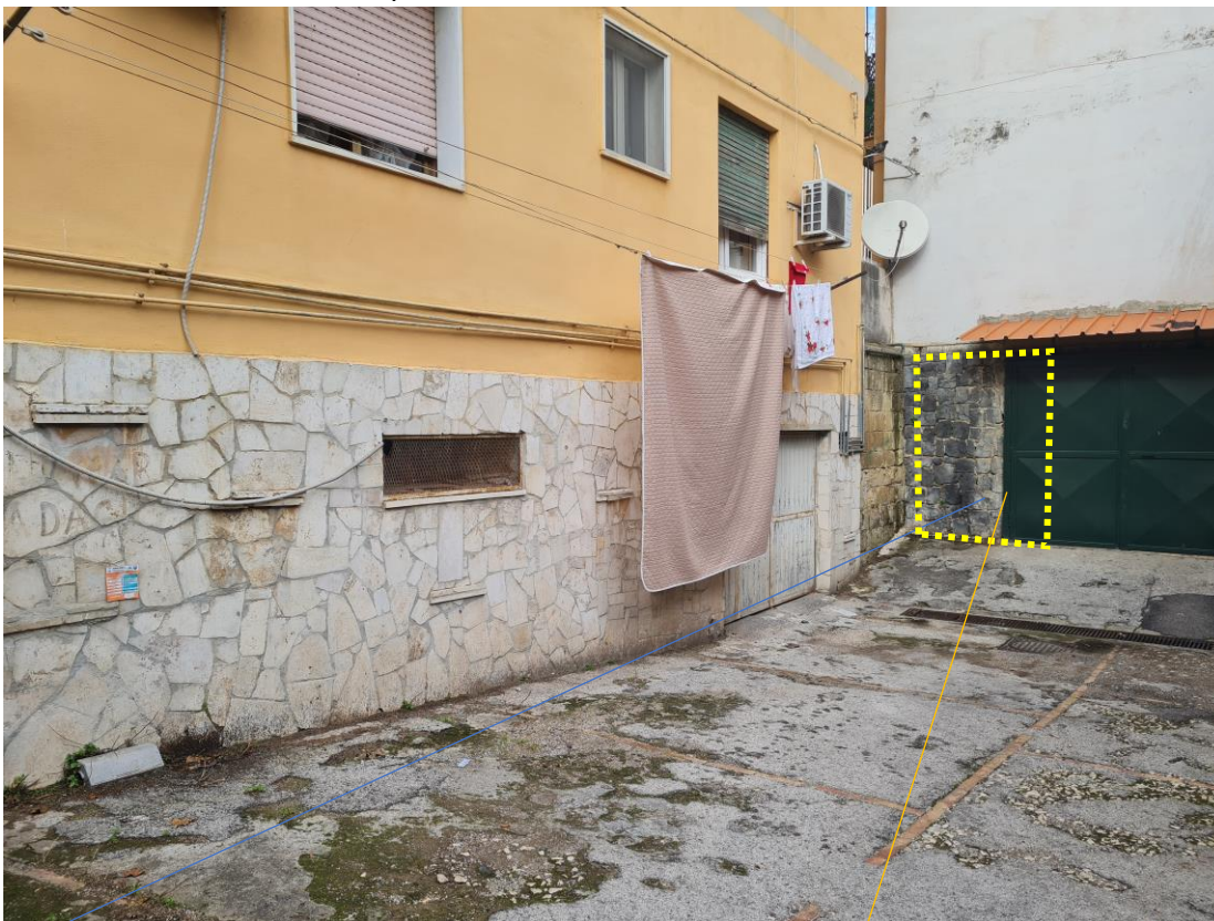
Accesso al piano seminterrato realizzato successivamente, prospetto originariamente occupato dalla cantinola demolita