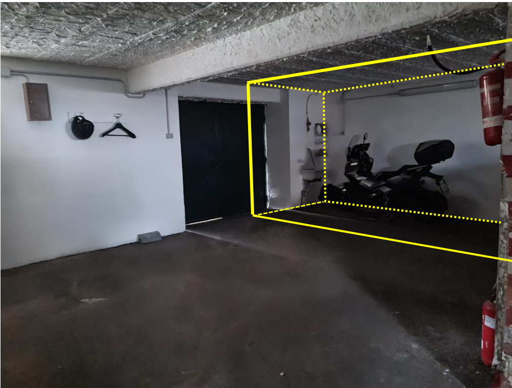
Spazio occupato dall'originaria cantinola