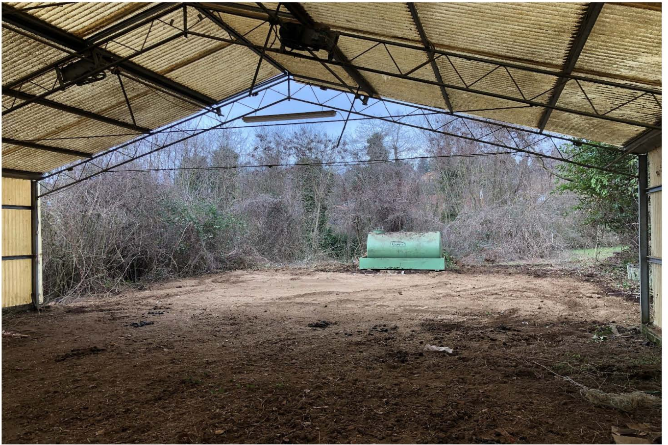
PORZIONE DI SERRA DEMOLITA NEMI F. 4 P.LLA 1691