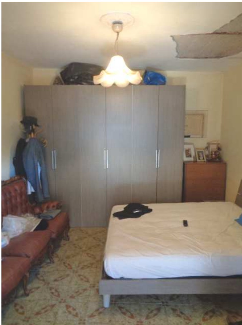
Foto n. 20: • Interni dell' unico vano costituente l'IMMOBILE N° 4.