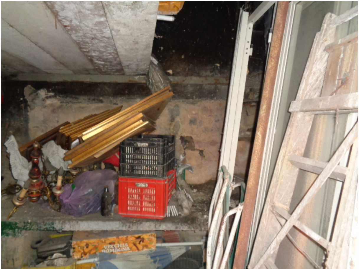
Foto n. 17: • IMMOBILE N° 3. • Interni (zona frontale entrando nel locale).