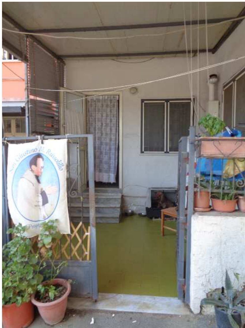
Foto n. 26: • Terrazzino a quota stradale che funge da ingresso all'IMMOBILE N° 5.