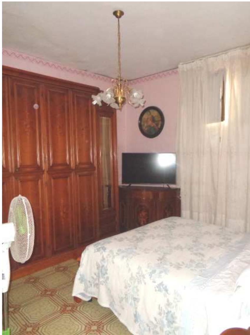
Foto n. 30: • IMMOBILE N° 5. • Camera da letto (le pareti perimetrali rivestite con pannelli di polistirolo).