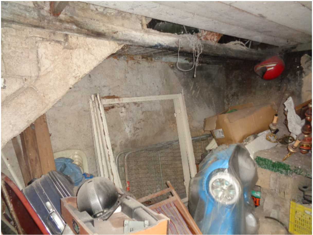
Foto n. 16: • IMMOBILE N° 3. • Interni (lato ribassato sottoscala a sinistra entrando nel locale).