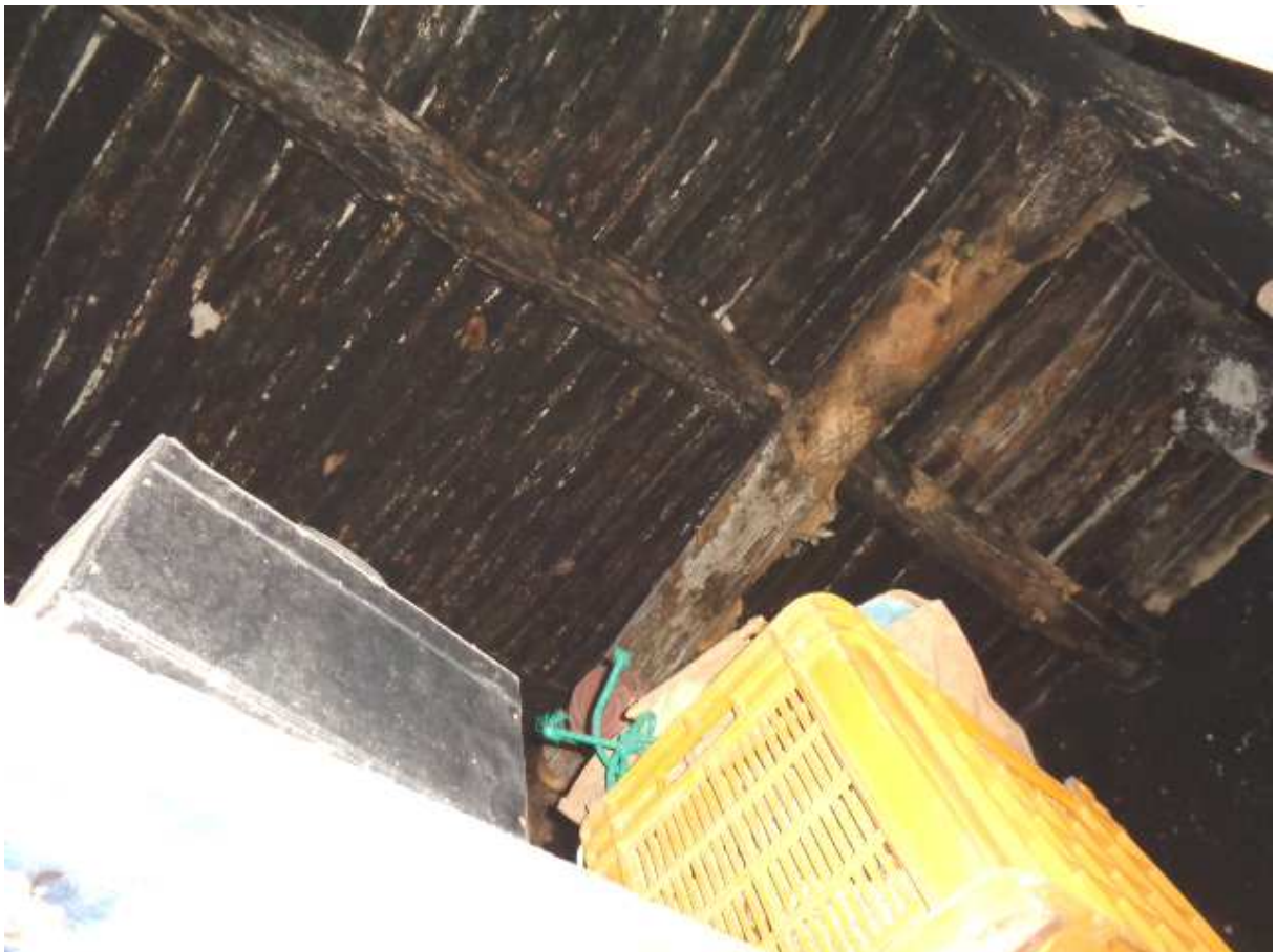
Foto n. 18: • Antichissimo solaio di copertura in legno dell'IMMOBILE N° 3.