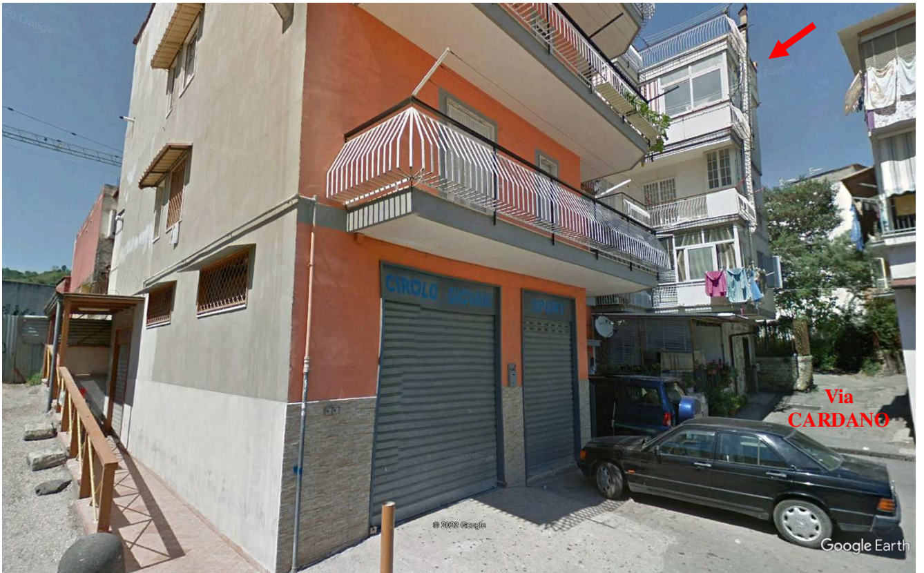
Foto n. 24: • Fabbricato comprendente l'IMMOBILE N° 5 (a sinistra entrando nello slargo distinto come civico 41 di Vai Dell'Avvenire).