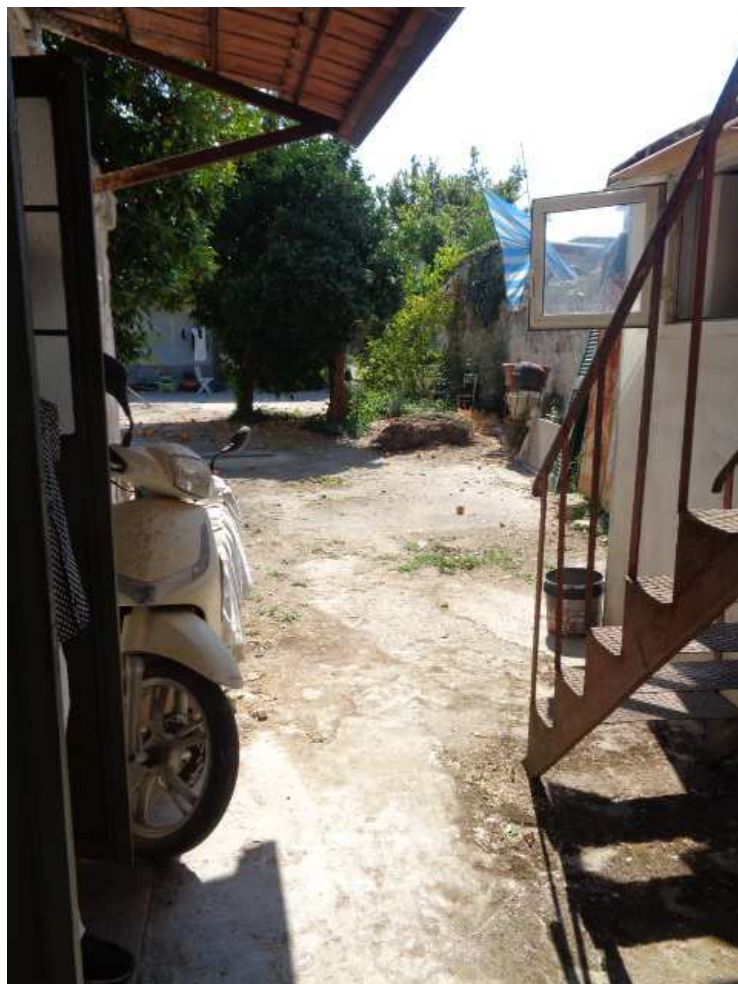
Foto n. 9: • Cortile/giardino retrostante al corpo di fabbrica (uscita porta di servizio IMMOBILE N° 1).