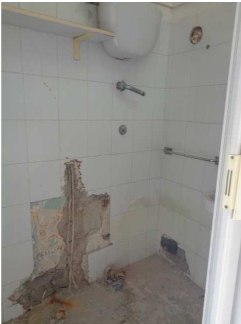
Foto n. 13: • IMMOBILE N° 2. • Predisposizioni idriche e di scarico nel bagno.