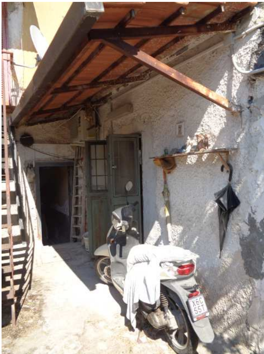
Foto n. 19: • Porta d'ingresso dell'IMMOBILE N° 4 da area scoperta annessa retrostante al corpo di fabbrica comprendente l'IMMOBILE N° 1 (di cui si sorge la "porta di servizio") e l'IMMOBILE N° 2 (di cui s'intravede la scala di accesso di servizio).