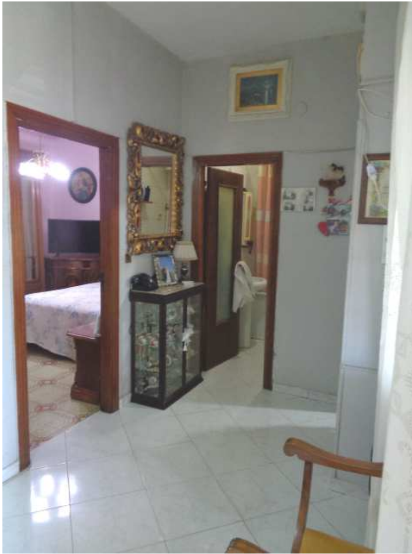
Foto n. 27: • IMMOBILE N° 5. • Disimpegno d'ingresso (si vedono le porte della camera da letto e del bagno).