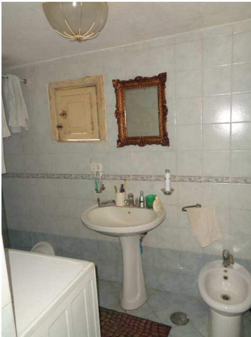
Foto n. 23: • Bagno asservito al vano d'interesse , ma facente parte di manufatto edificato su suolo di aporie aliena.