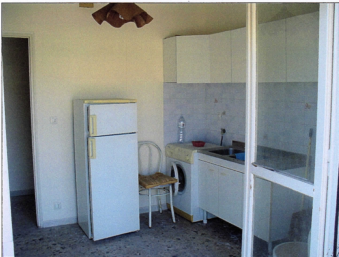
Foto 13_Lotto di vendita n.3_L'appartamento_Cucina