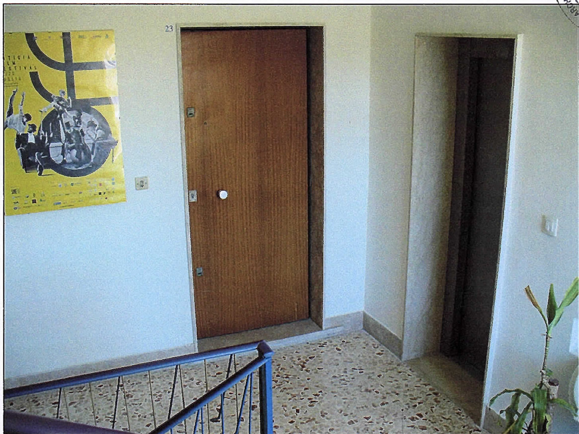
Foto 12_Lotto di vendita n.3_Vano scala condominiale_Ingresso dell'appartamento