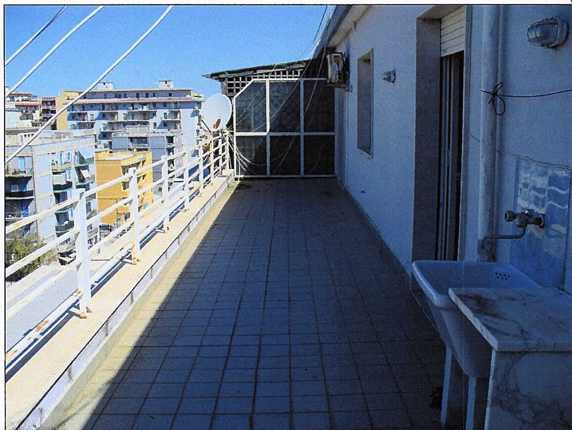
Foto 18_Lotto di vendita n.3_L'appartamento_Terrazzo di uso esclusivo