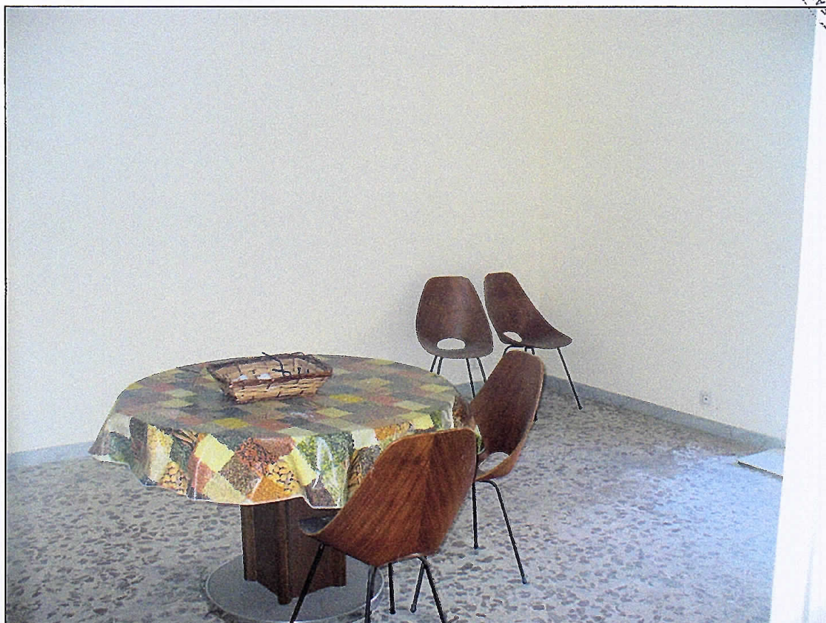
Foto 14_Lotto di vendita n.3_L'appartamento_Soggiorno