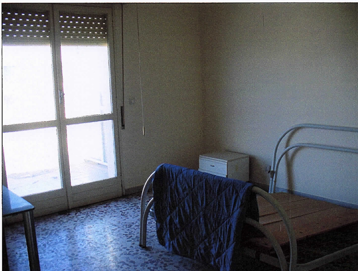
Foto 17_Lotto di vendita n.3_L'appartamento_Camera