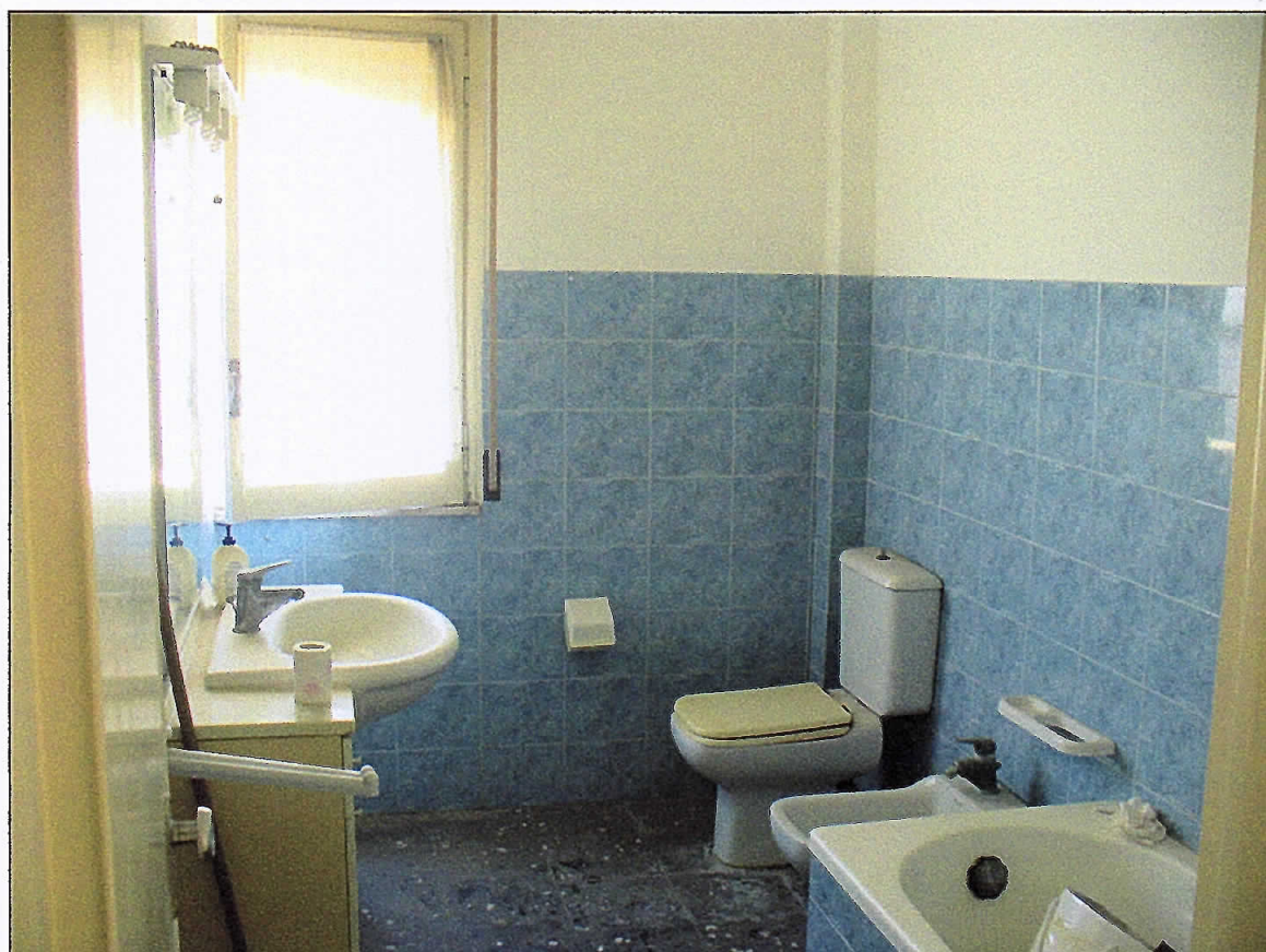
Foto 16_Lotto di vendita n.3_L'appartamento_Servizio igienico