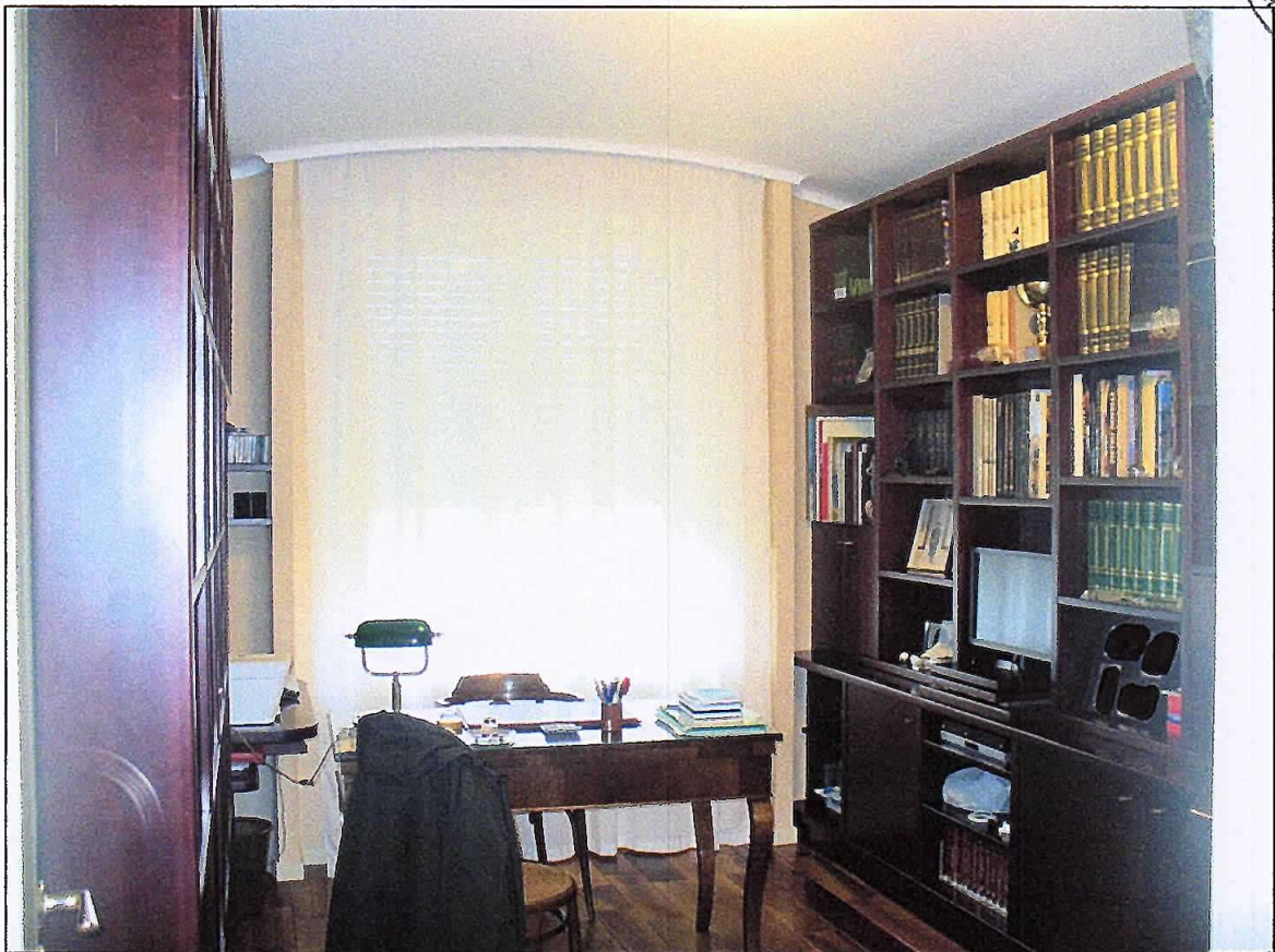
Foto 6_Lotto di vendita n.1_L'appartamento_Studio