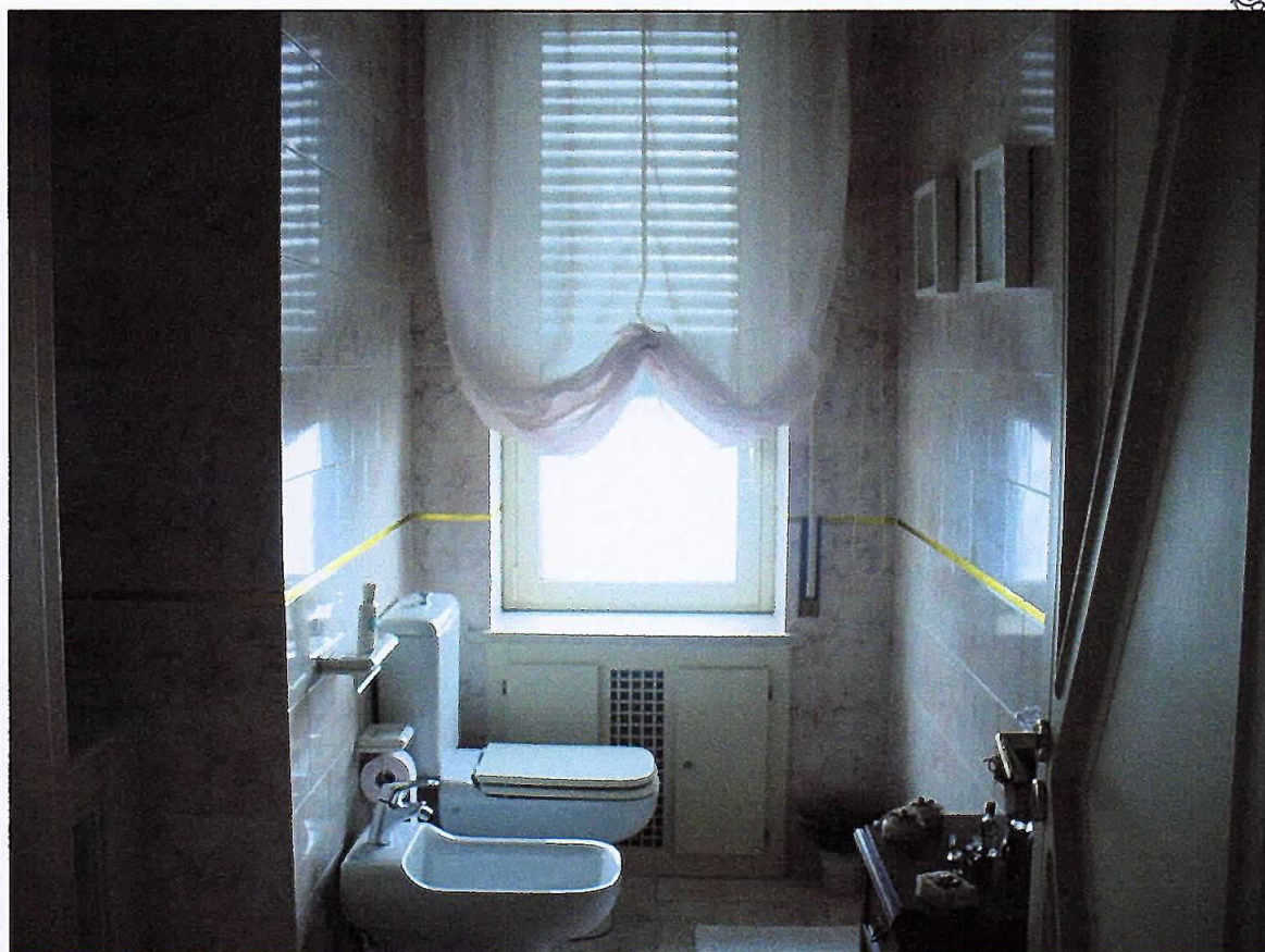
Foto 8_Lotto di vendita n.1_L'appartamento_Servizio igienico