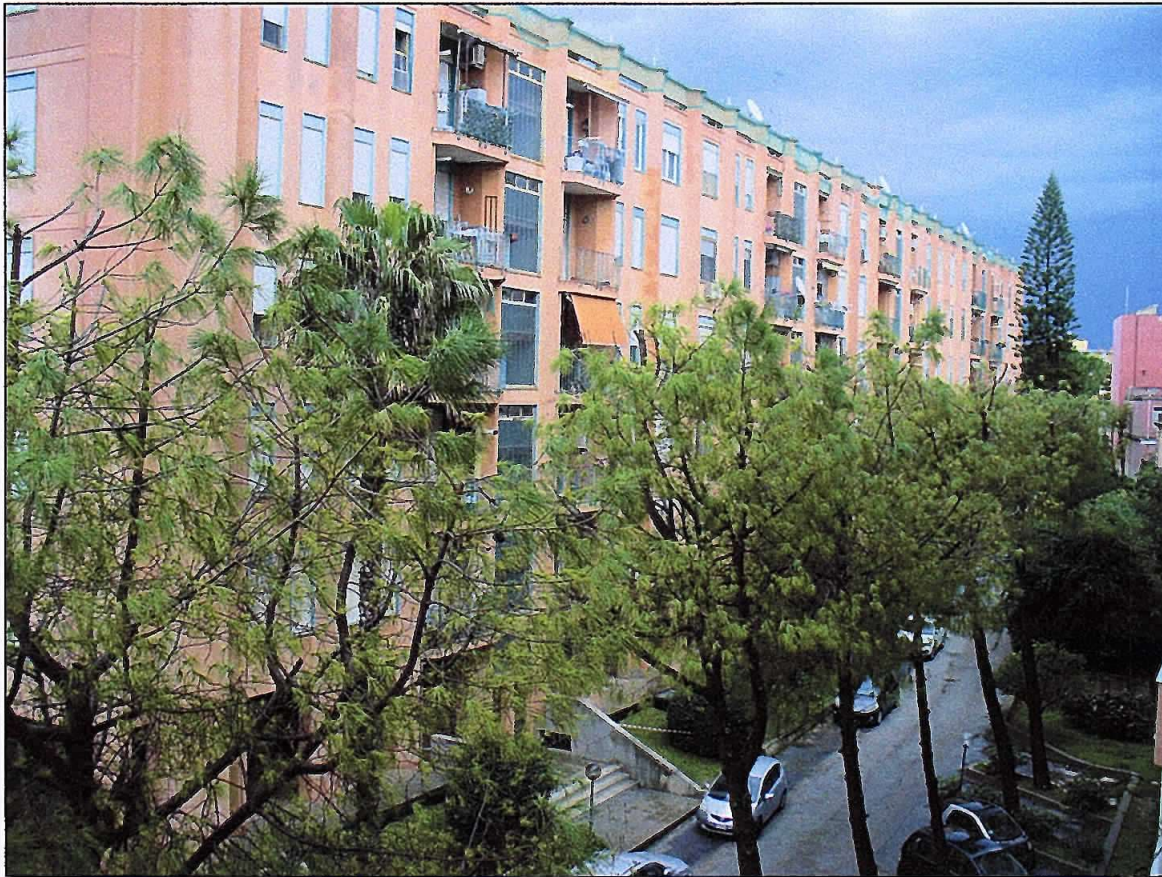
Foto 1_Lotto di vendita n.1_Il condominio_Vista esterna