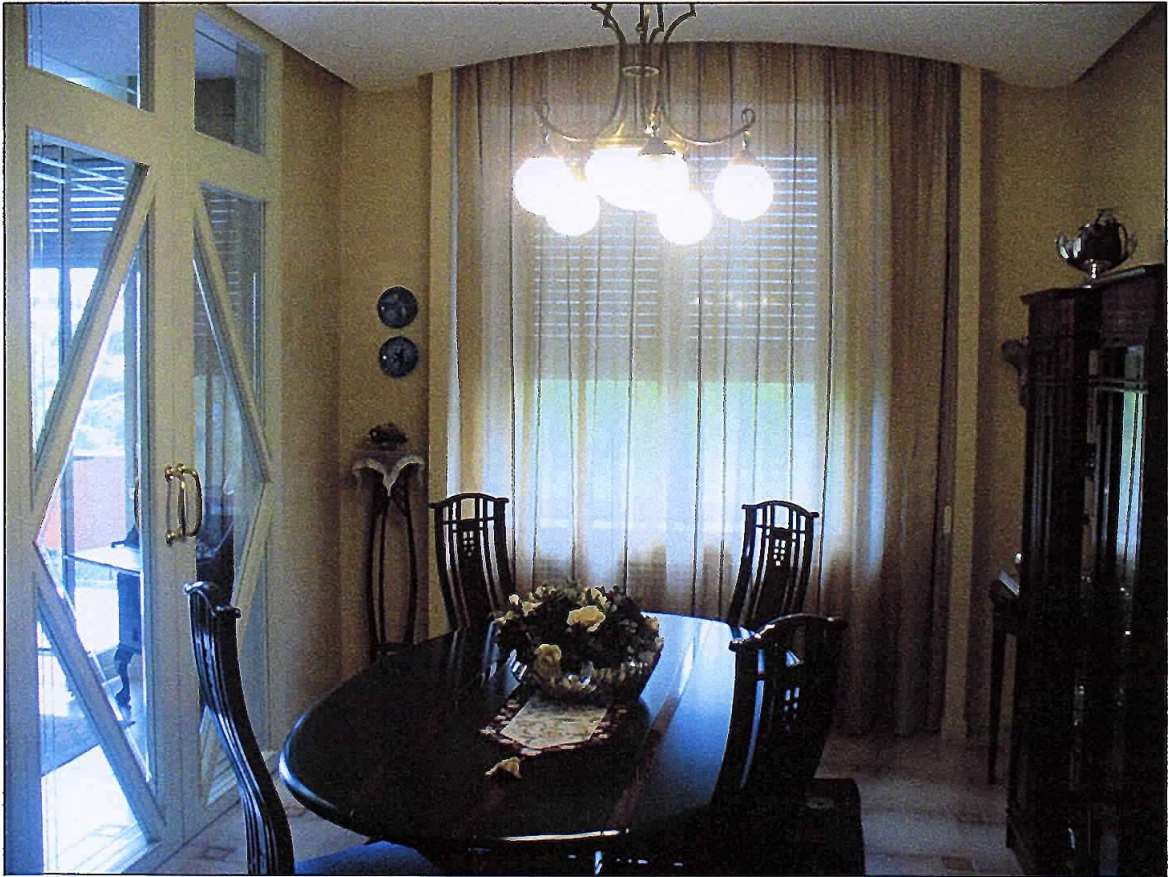
Foto 5_Lotto di vendita n.1_L'appartamento_Sala da pranzo