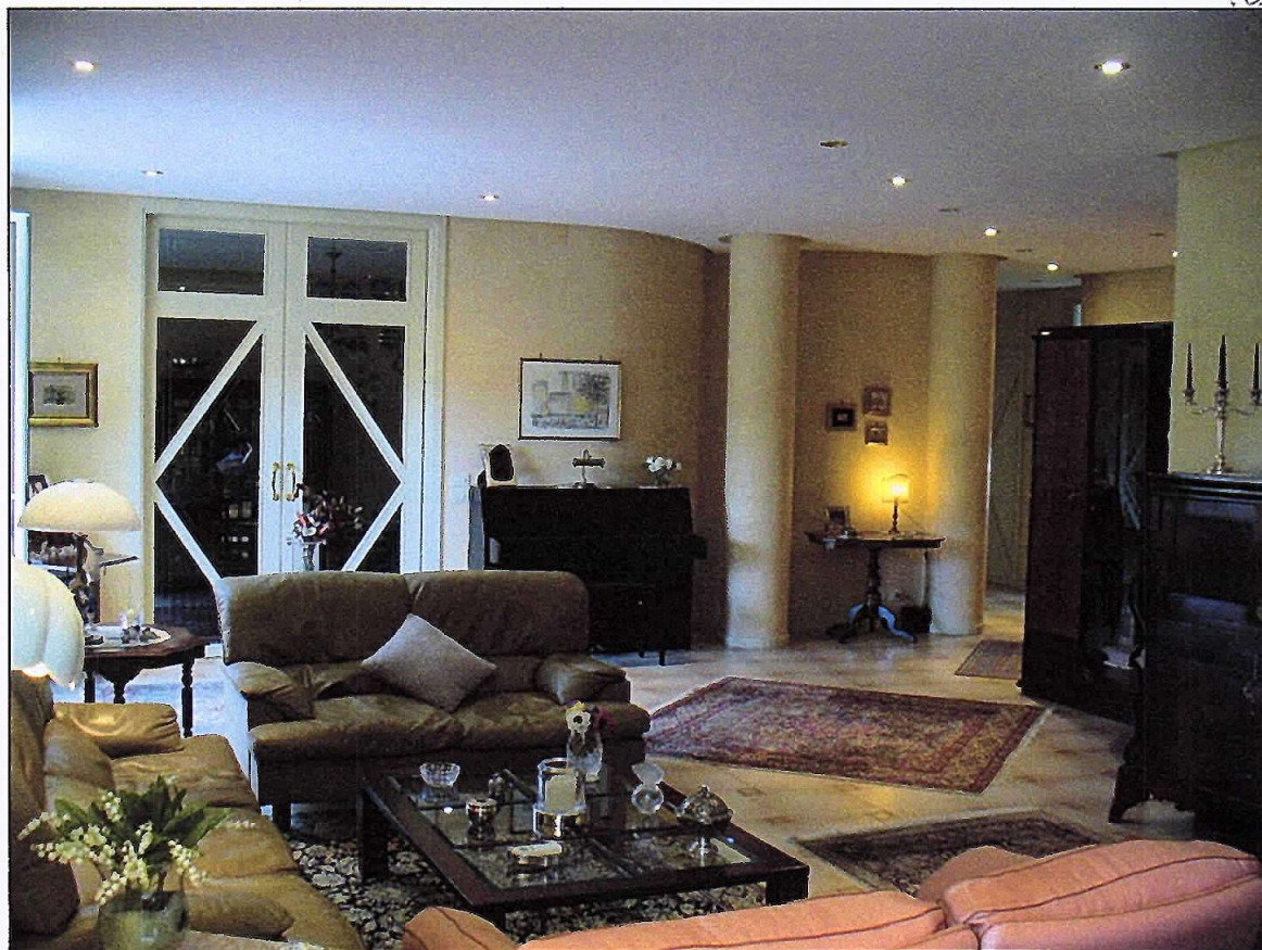
Foto 4_Lotto di vendita n.1_L'appartamento_Soggiorno