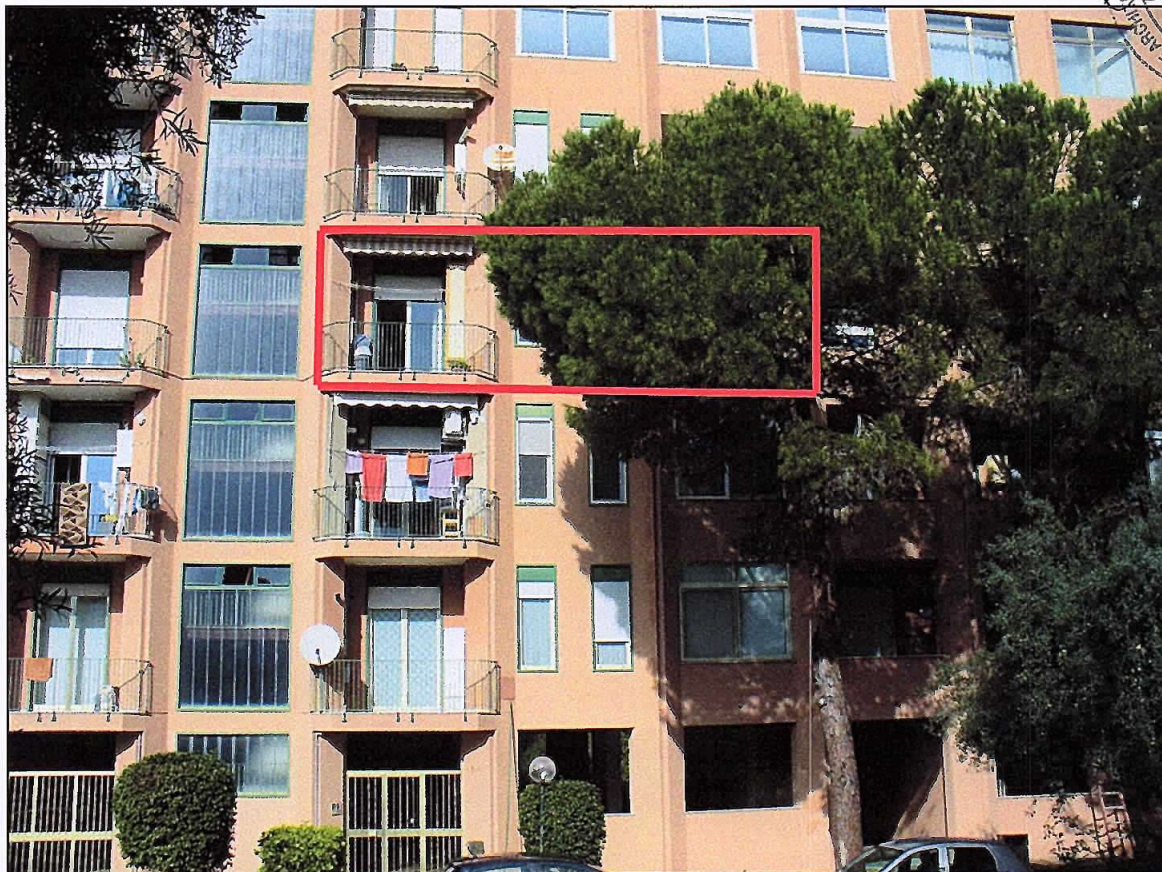
Foto 2_Lotto di vendita n.1_Il condominio_Vista esterna con individuazione dell'appartamento