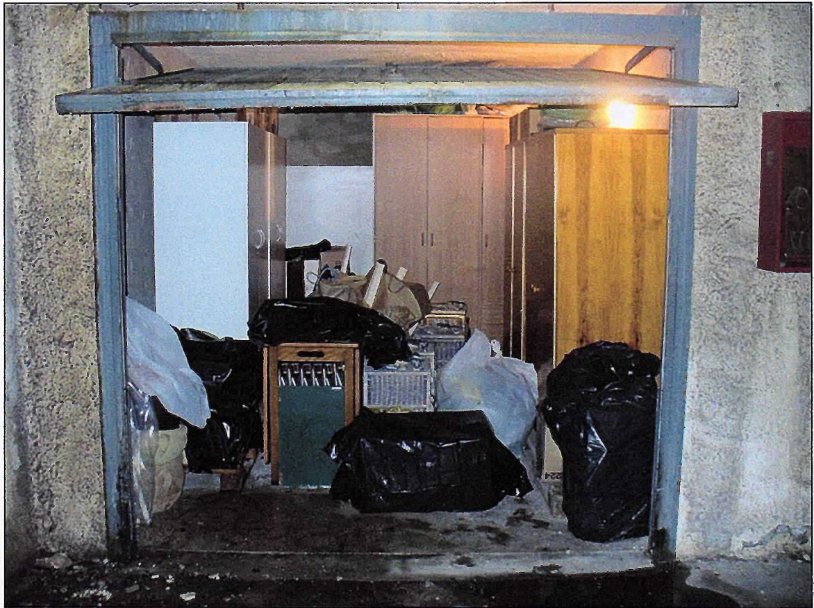
Foto 9_Lotto di vendita n.1_Il garage