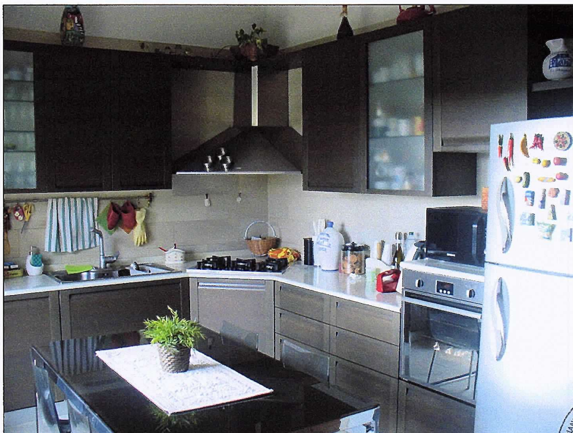
Foto 7_Lotto di vendita n.1_L'appartamento_Cucina