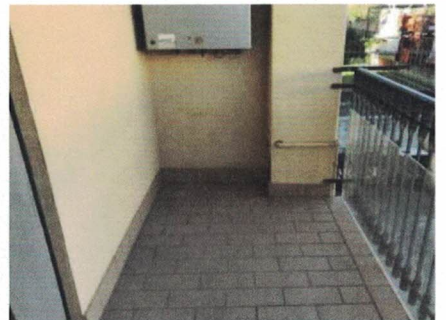
Foto 14-15 Camera con poggiolo