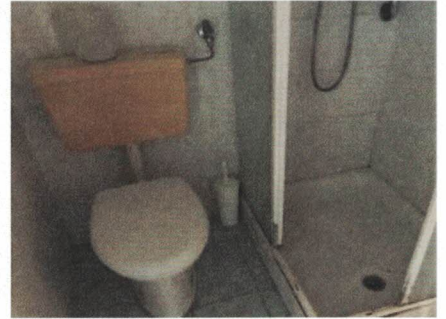
Foto 10-11 Poggiolo fronte via Roma - WC/lavanderia