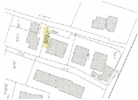
Immagini 1-2 - GoogleMaps ed estratto di mappa catastale con evidenziato sommariamente il fabbricato condominiale nel quale insiste il compendio