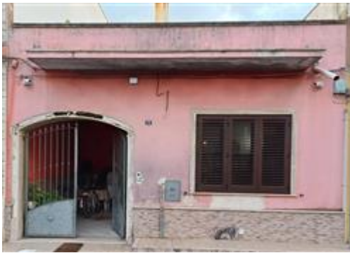
prospetto su strada pubblica

L'intero edificio sviluppa 1 piano, 1 piano fuori terra, 0 piano interrato. Immobile costruito nel 1966 ristrutturato nel 2009.