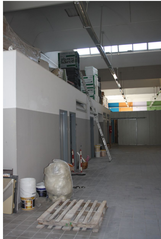
Area servizi e spogliatoi sub 7