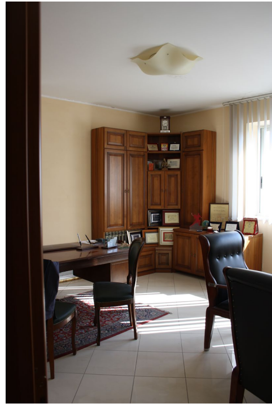
Uffici direzionali (sub 7) piano secondo