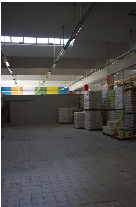
Struttura industriale (capannone) sub 7