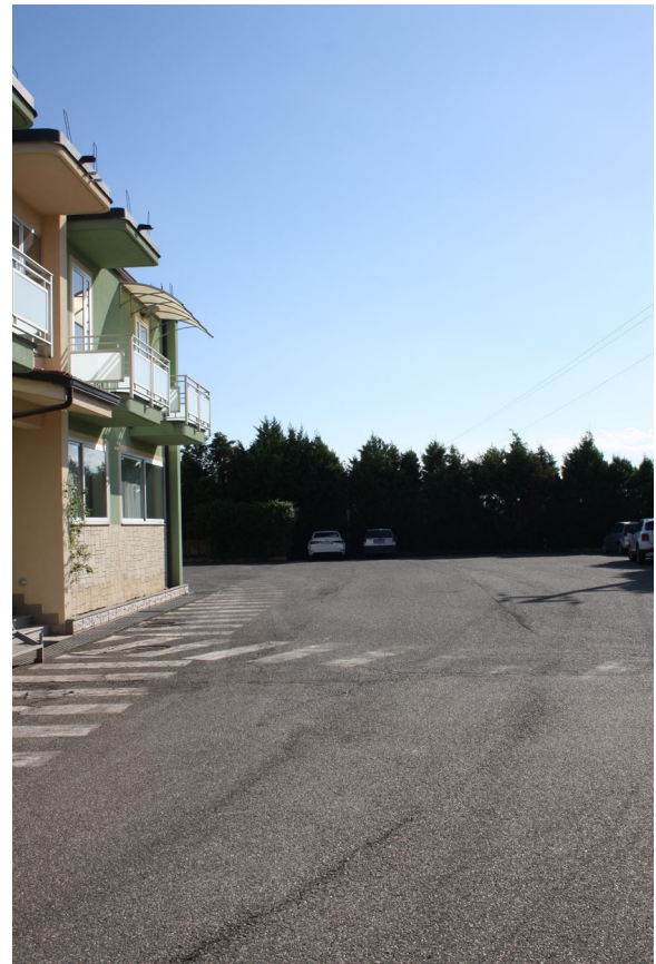
Area subalterno 9 (Bene comune non censibile)