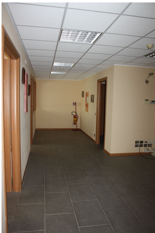
Piano rialzato (sub 7) Uffici