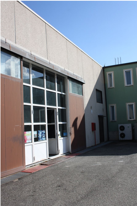
Struttura Industriale (capannone Nord) Sub.8