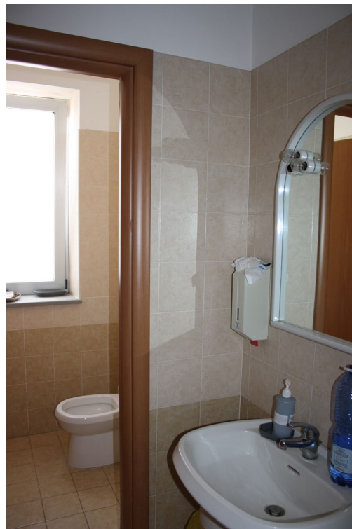
Servizi igienici con antibagno