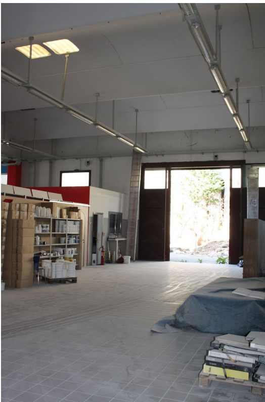
Struttura industriale (capannone) sub. 8