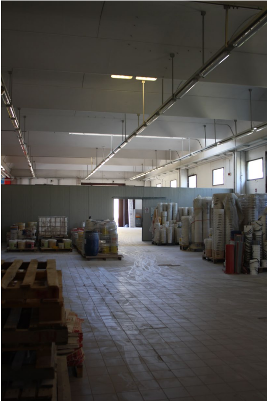
Struttura industriale sub 7