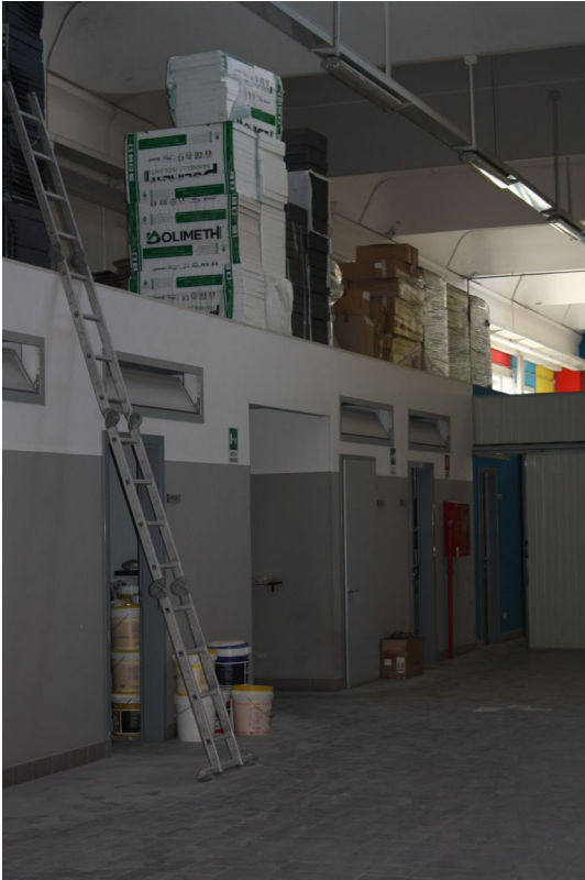
Struttura industriale sub. 7 (capannone)