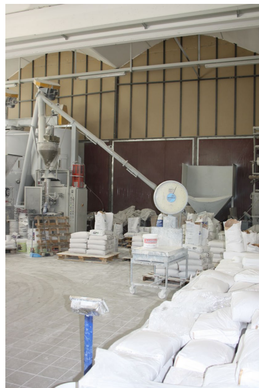
Area produzione sub. 7