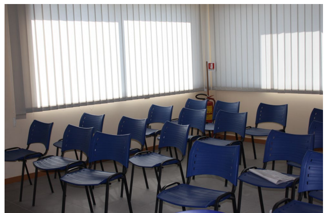
Piano rialzato (sub.7) Esposizione – sala demo