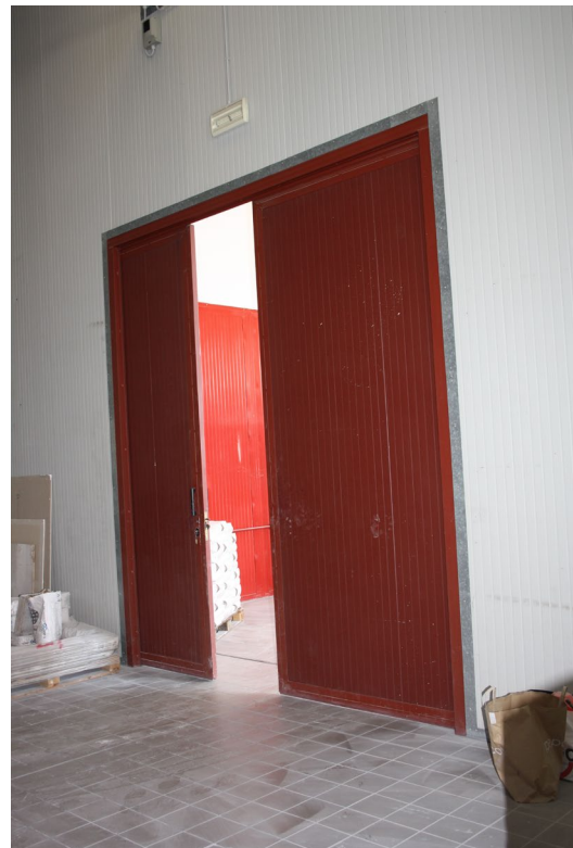
Porte scorrevoli – ambienti di lavoro