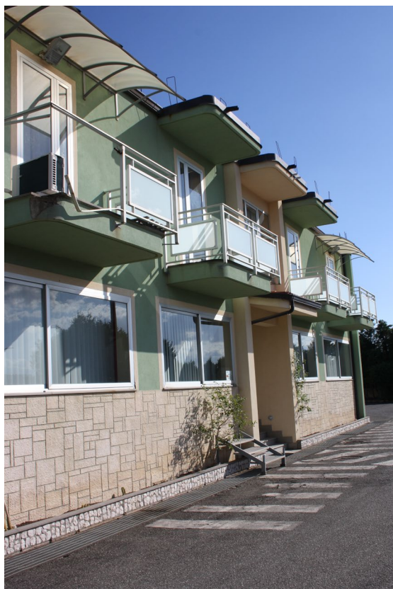
Struttura Uffici Subalterno 7