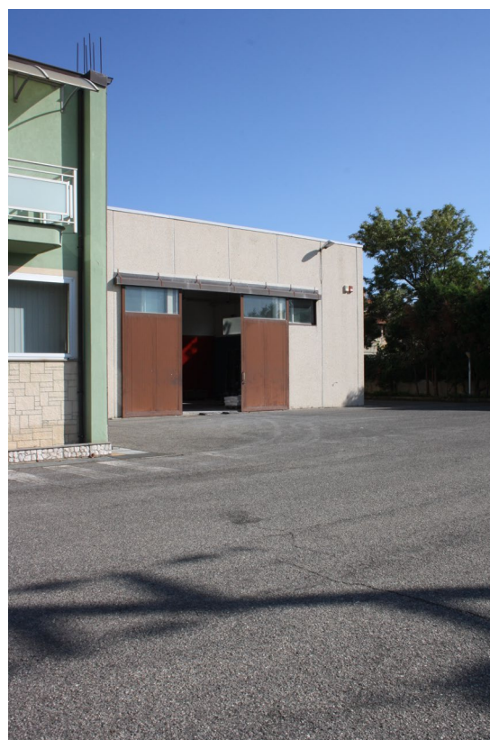
Struttura Industriale (capannone Ovest) Sub.7