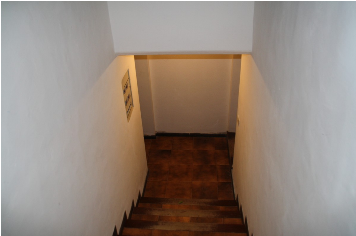
Foto 36 Accesso a locale interrato e al subalterno 5 , presso ingresso abitazione