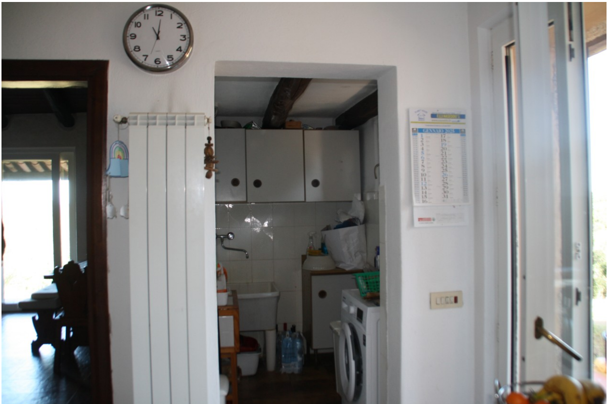
Foto 24 Ripostiglio ad uso lavanderia