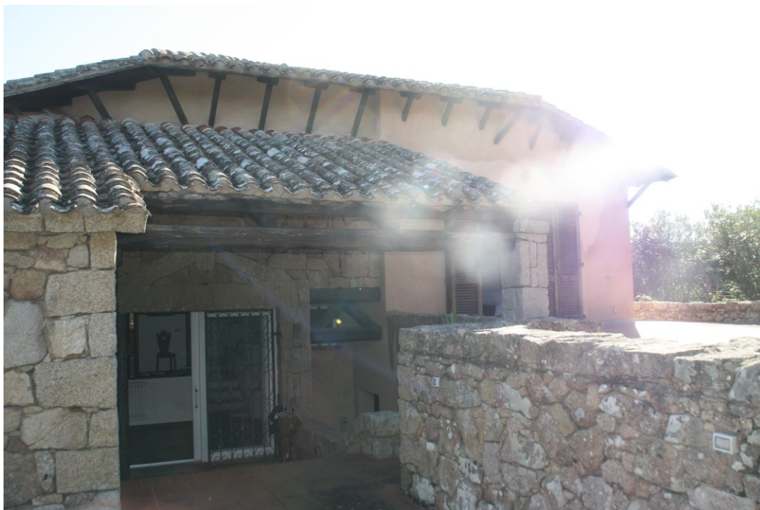
Foto 03 Ingresso alla Villa