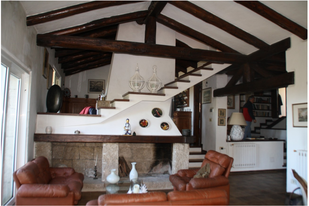
Foto 19 Soggiorno