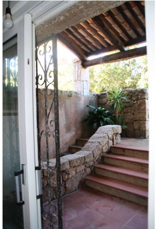
Foto 17 Ingresso