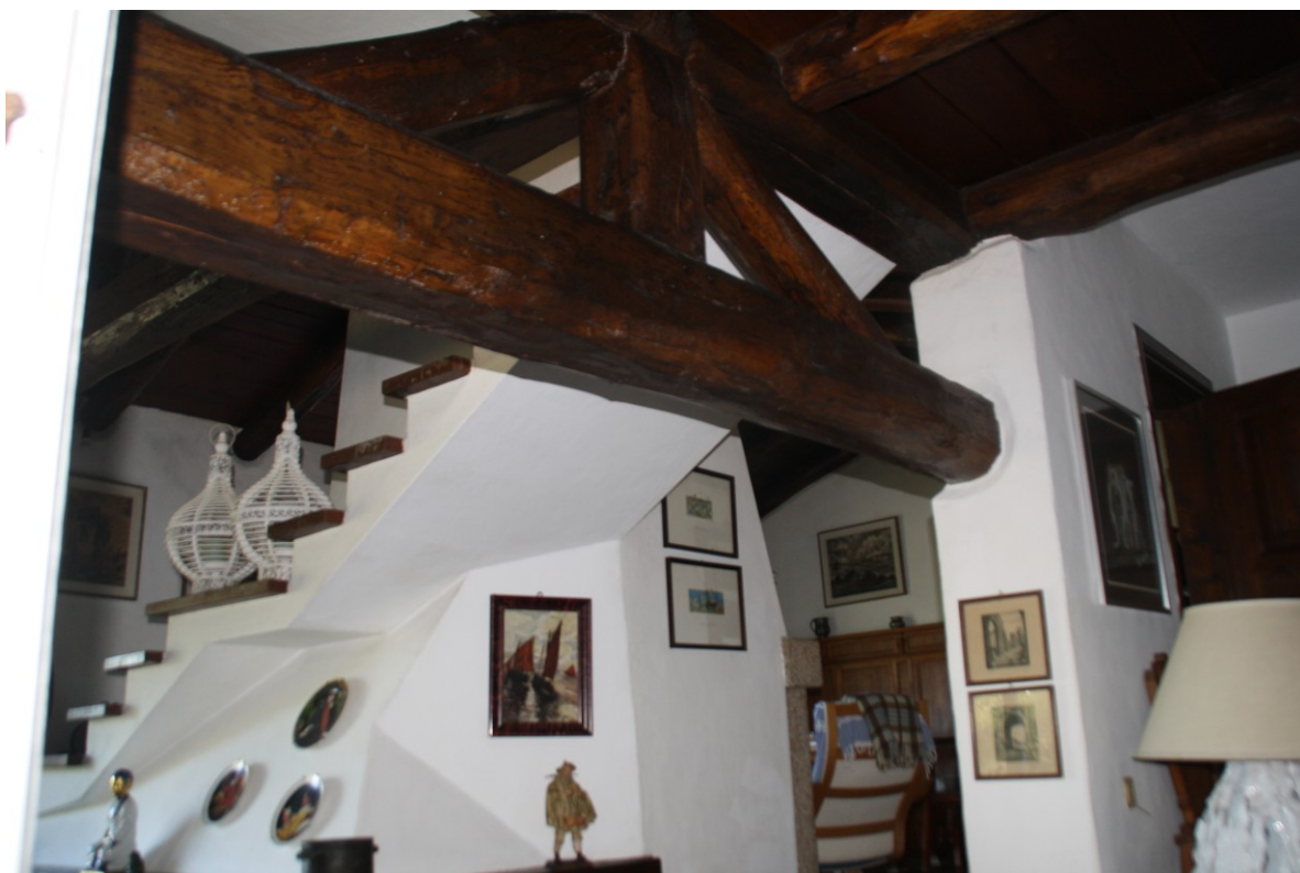
Foto 25 Particolare capriata tetto