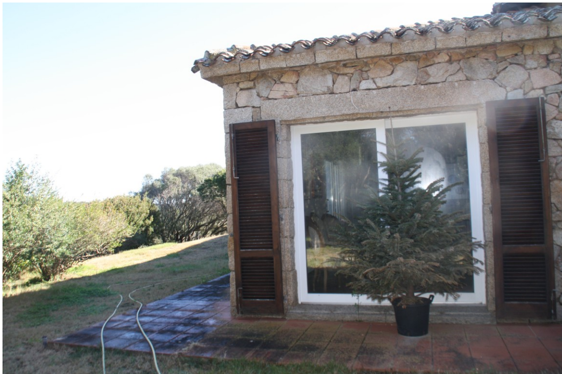
Foto 05 Ripresa lato ovest - Vetrata soggiorno