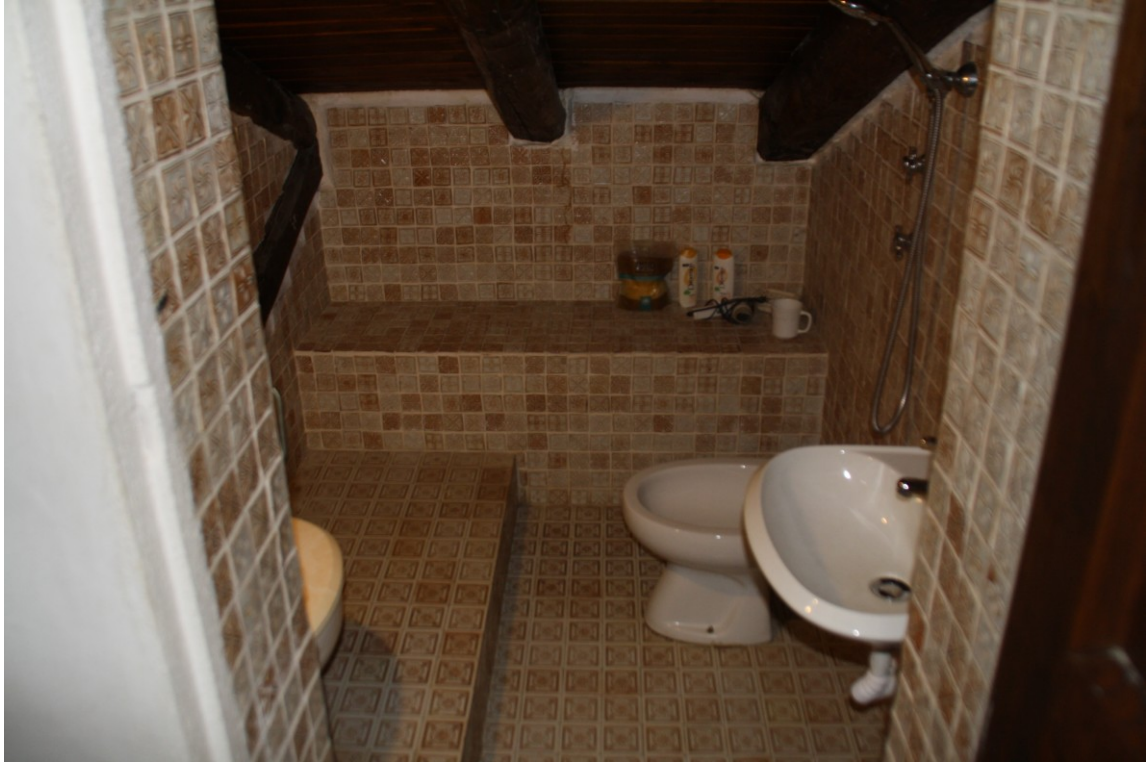
Foto 29 Bagno mansarda