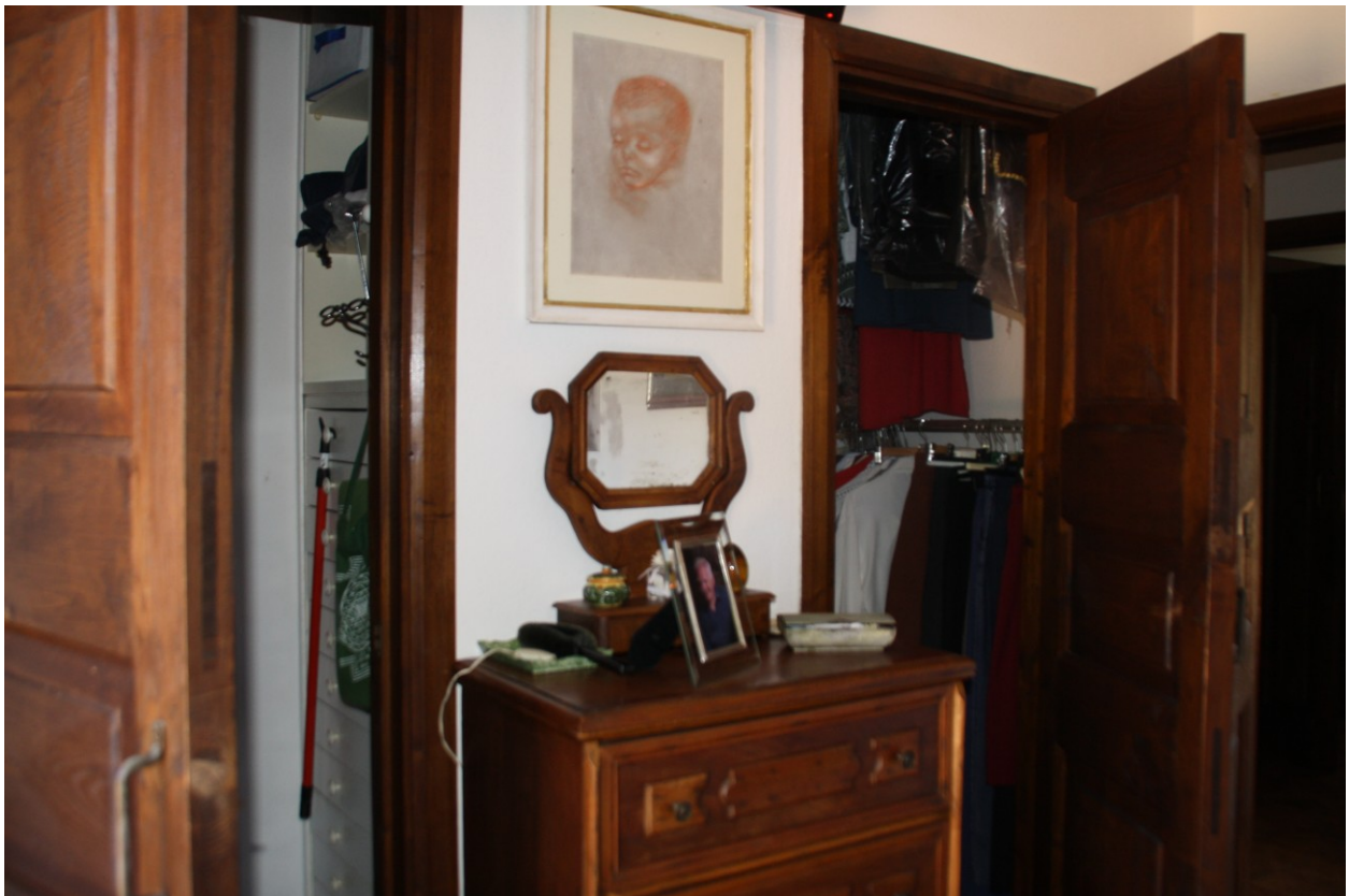
Foto 33 Camera con cabina armadio