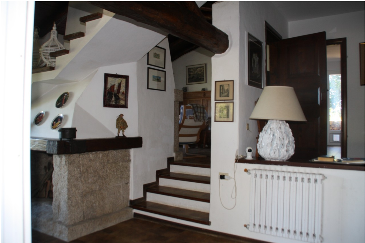
Foto 21 Soggiorno e accesso alla sala pranzo