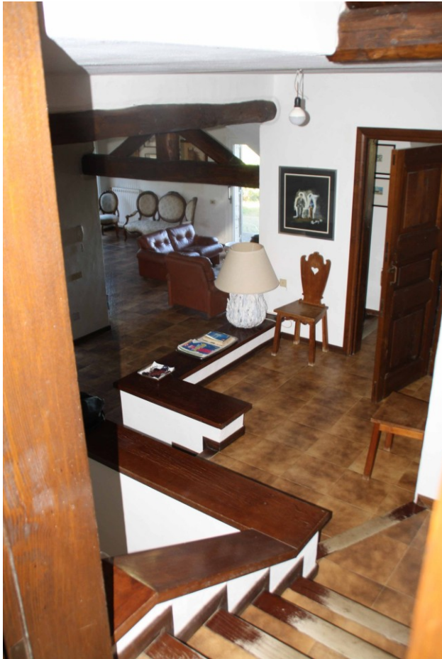
Foto 30 Accesso zona notte