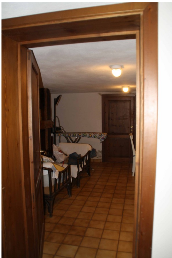
Foto 37 Ambiente uso taverna