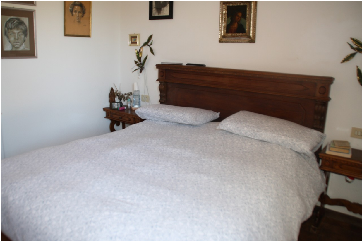
Foto 32 Camera