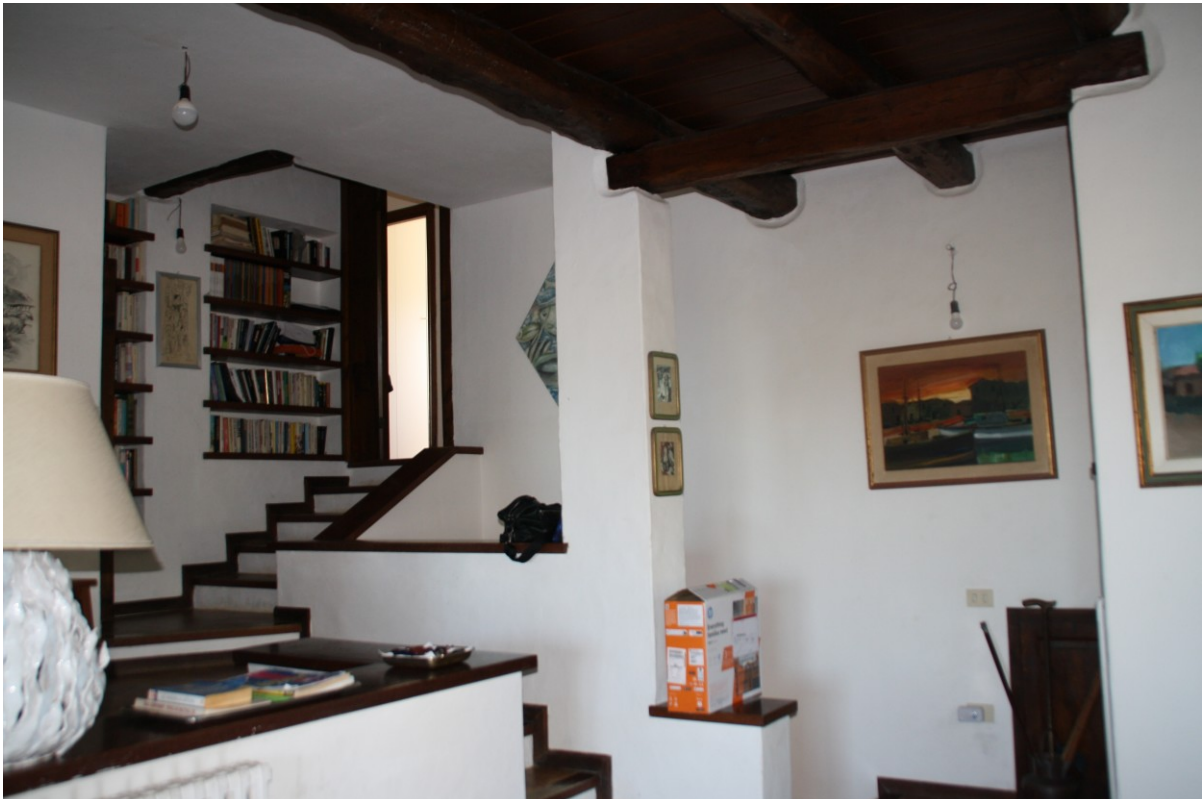
Foto 18 Ingresso e disimpegno