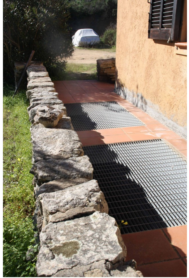
Foto 10 - 11 Ripresa lato sud- Bocche di lupo