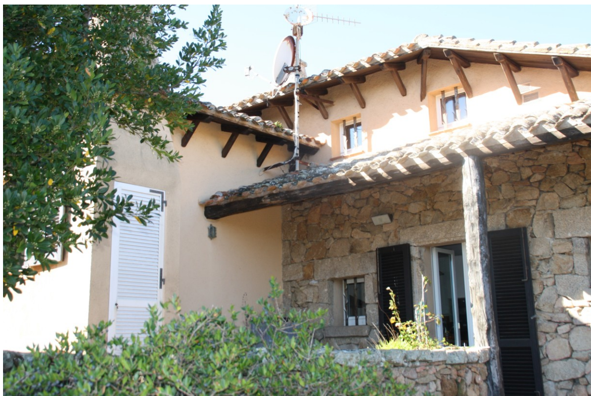
Foto 07 Ripresa lato est- Bucature su cucina e porticato