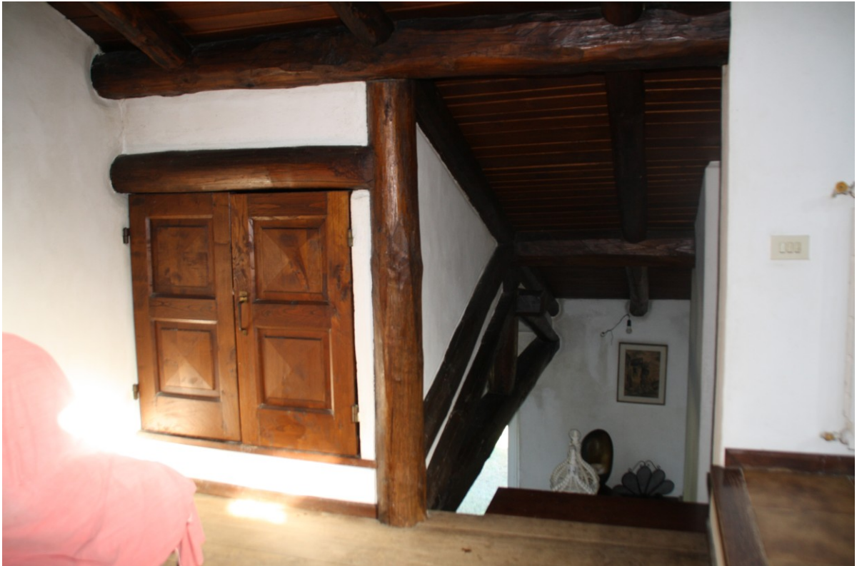
Foto 28 Accesso alla mansarda e armadio nel sottotetto