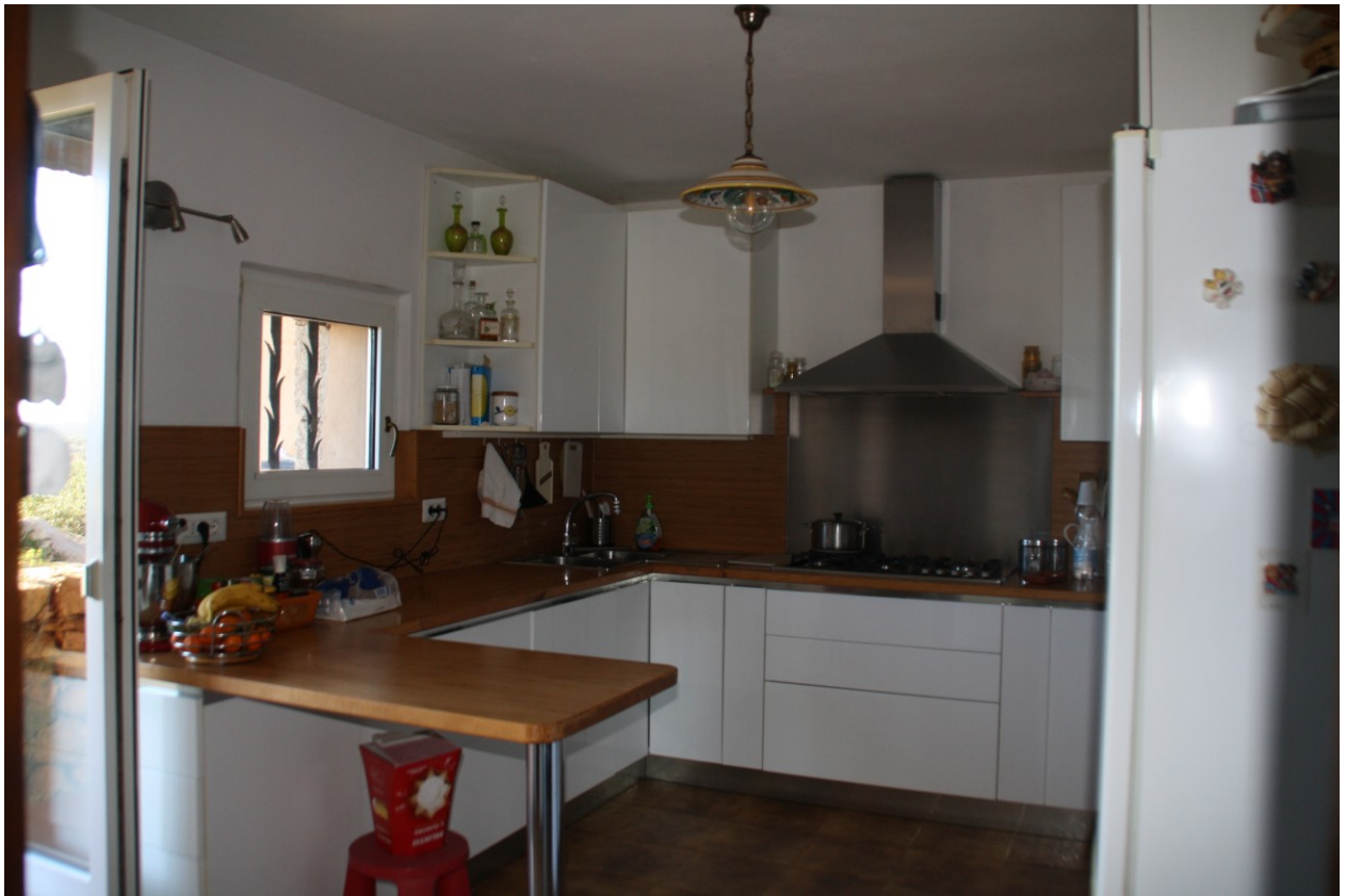
Foto 23 Cucina