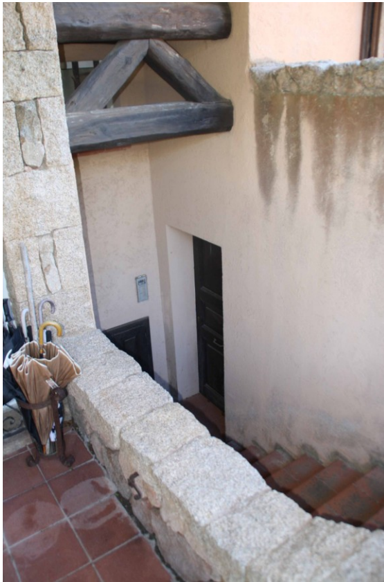
Foto 14 Accesso indipendente subalterno 5 lato ovest