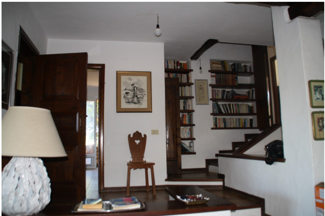
Foto 22 Disimpegno di collegamento tra zona giorno e notte