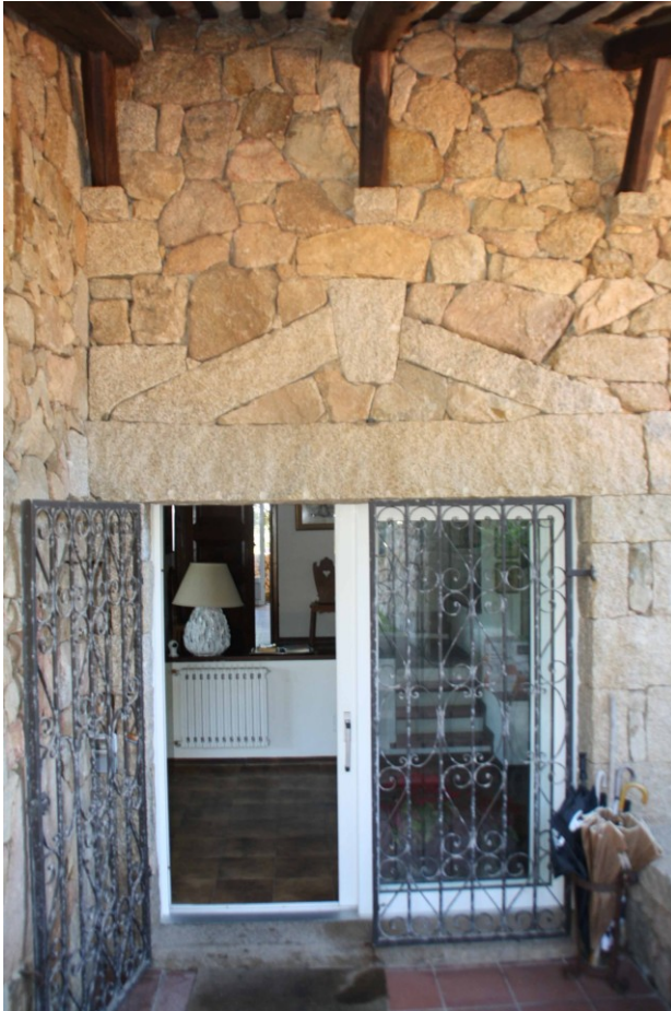
Foto 16 Accesso indipendente subalterno 4 - llato ovest