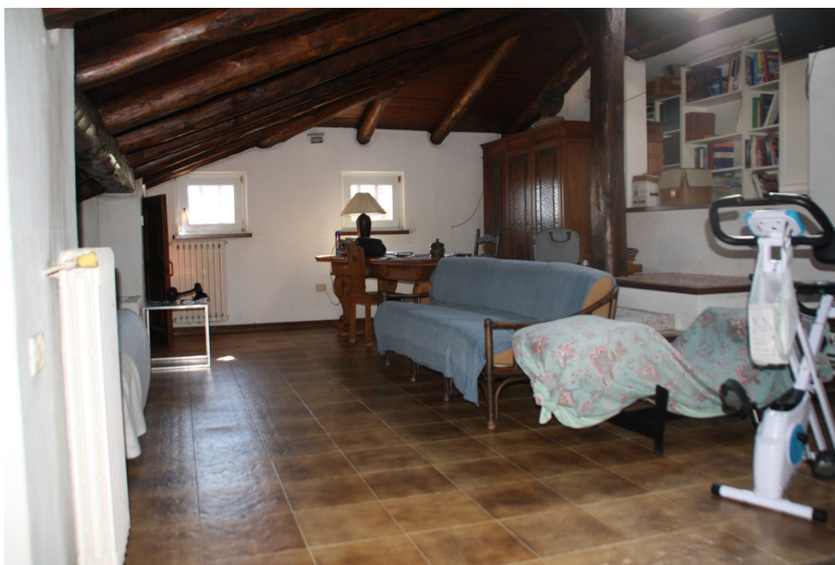
Foto 26 Mansarda