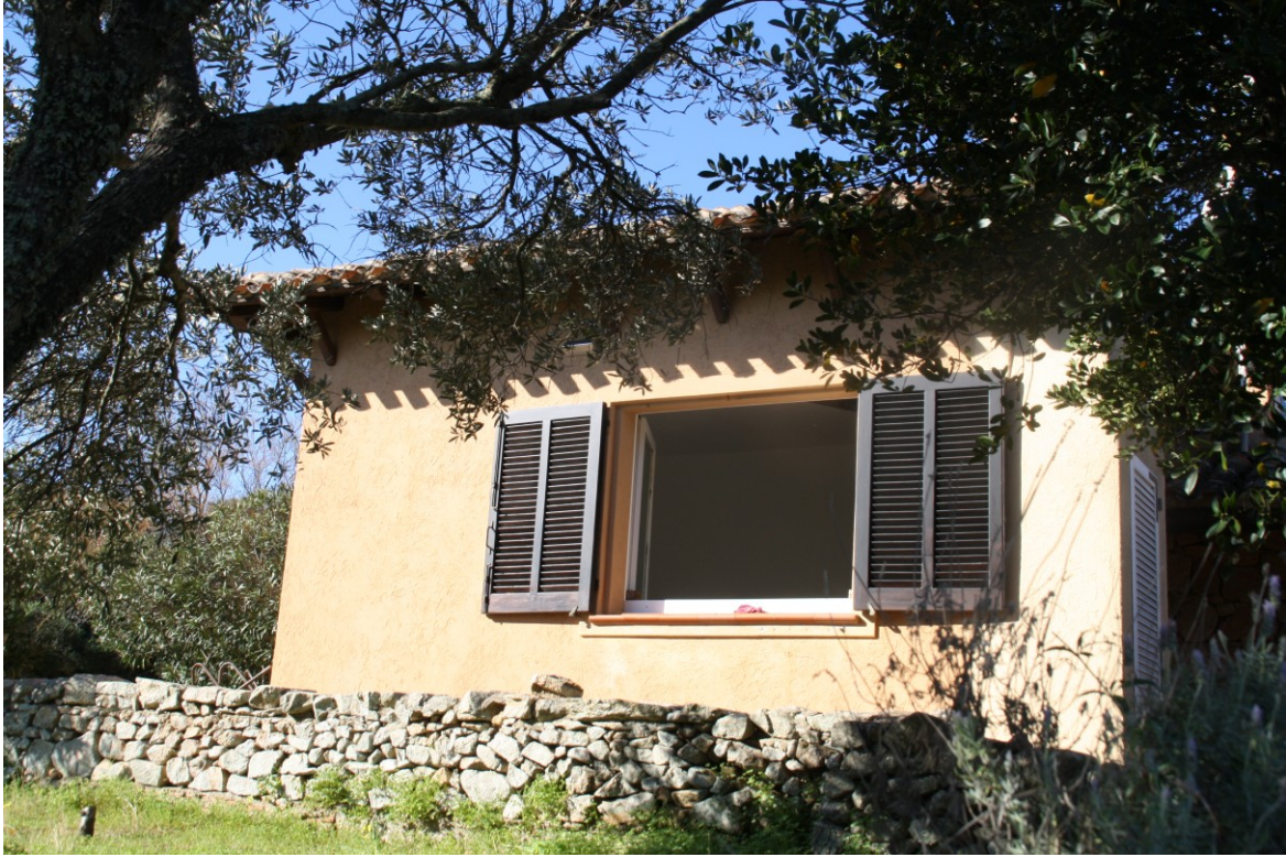
Foto 08 Ripresa lato est- Bucature su camera da letto