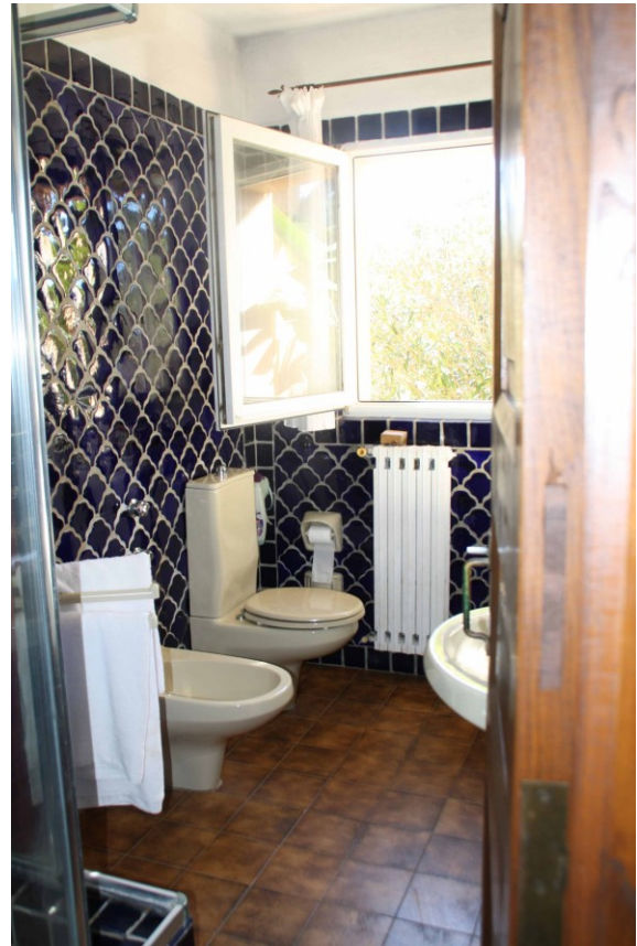
Foto 34 -35 Bagni zona notte