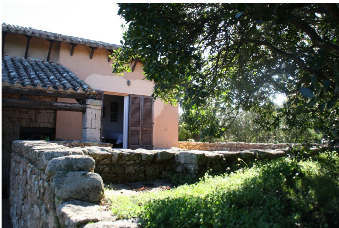
Foto 04 Ingresso alla Villa