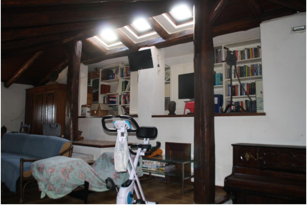
Foto 27 Mansarda