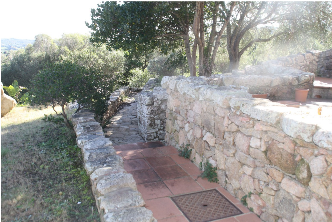
Foto 09 Ripresa lato nord- Camminamenti