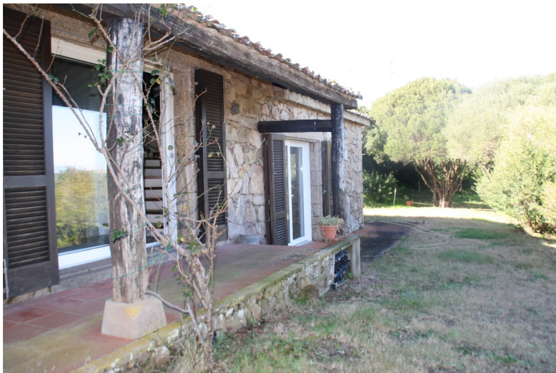
Foto 06 Ripresa lato nord- Bucature su soggiorno e cucina