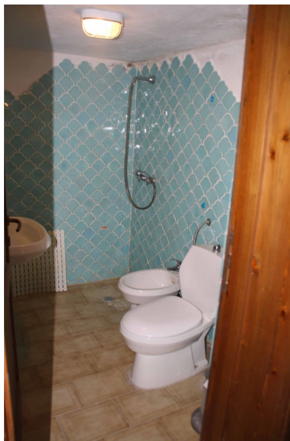
Foto 38 Bagno