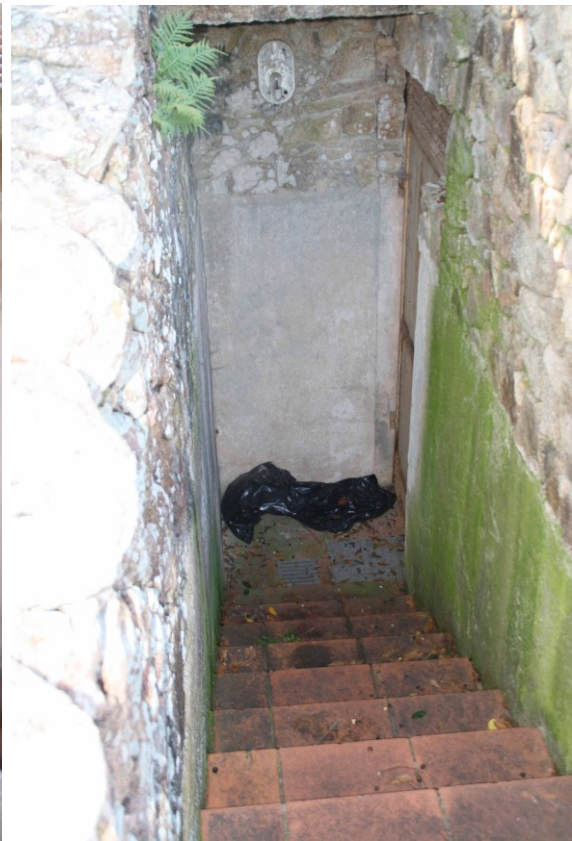
Foto 15 Accesso vano tecnico lato est