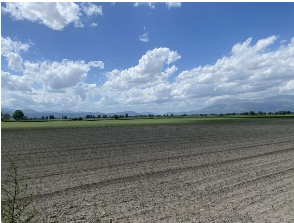
Foto 27: Vista d'insieme dell'appezzamento ricompreso in ambiti maggiori ma univocamente identificato con la p.lla 287 come nella foto sottostante.