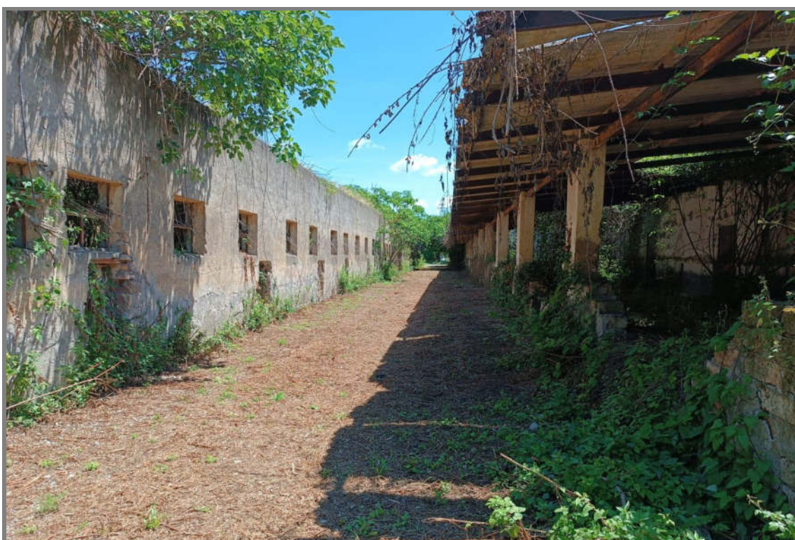
Foto 13 - N.C.E.U. Comune di Cisterna di Latina, foglio 10, p.lla 21, sub. 20 e 14.