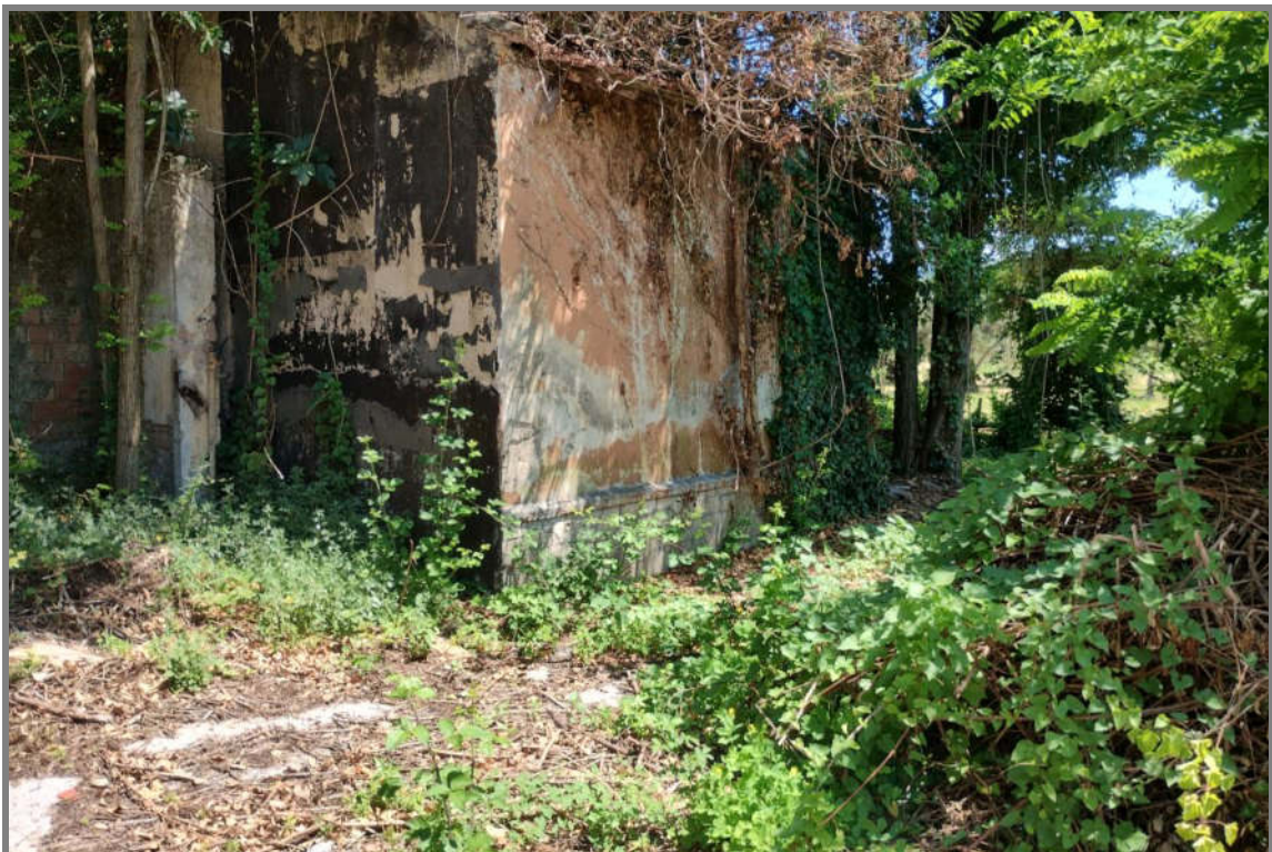
Foto 9 - N.C.E.U. Comune di Cisterna di Latina, foglio 10, p.lla 196, sub. 1.