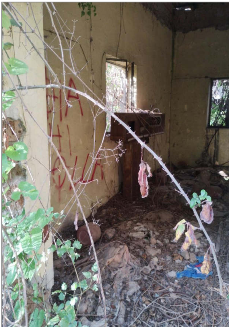
Foto 3 - N.C.E.U. Comune di Cisterna di Latina, foglio 10, p.lla 21, sub. 13.