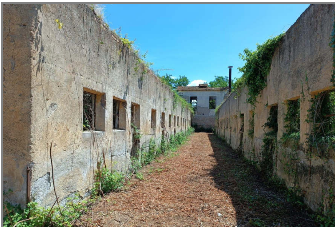
Foto 12 - N.C.E.U. Comune di Cisterna di Latina, foglio 10, p.lla 21, sub. 23, 13 e 22.