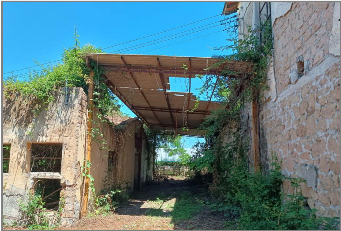
Foto 10 - N.C.E.U. Comune di Cisterna di Latina, foglio 10, p.la 21, sub. 13 e 23.