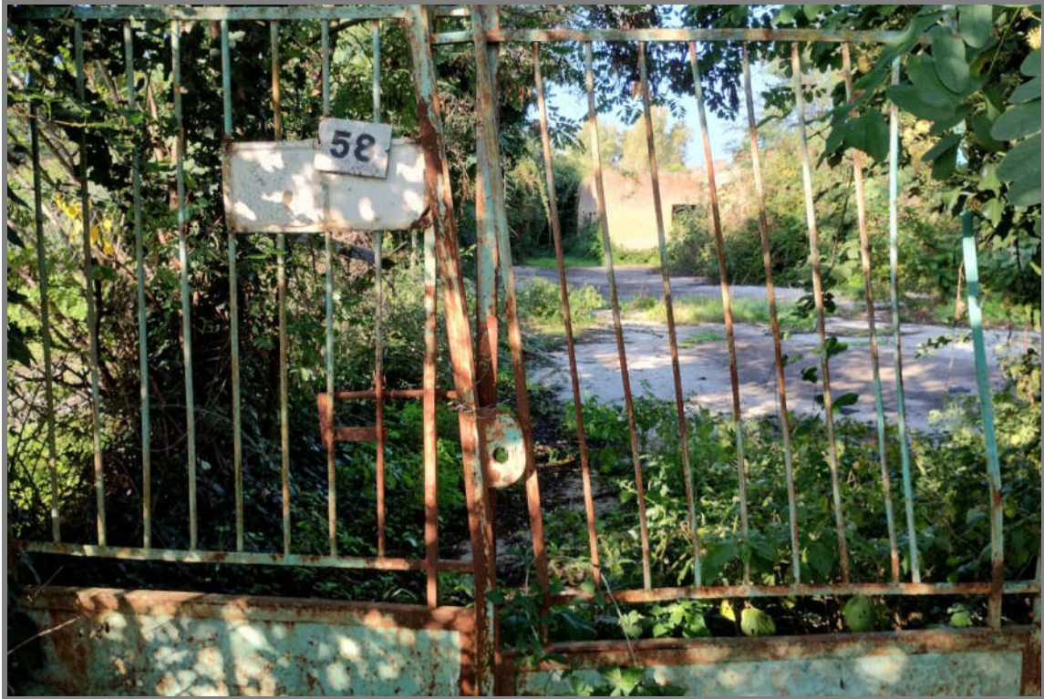
Foto 1 - Cancellone d'ingresso al termine della traversa di Via G. Marconi.