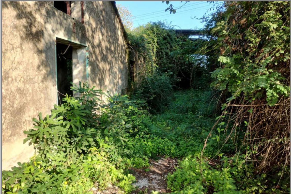
Foto 6 - N.C.E.U. Comune di Cisterna di Latina, foglio 10, p.lla 21, sub. 22.