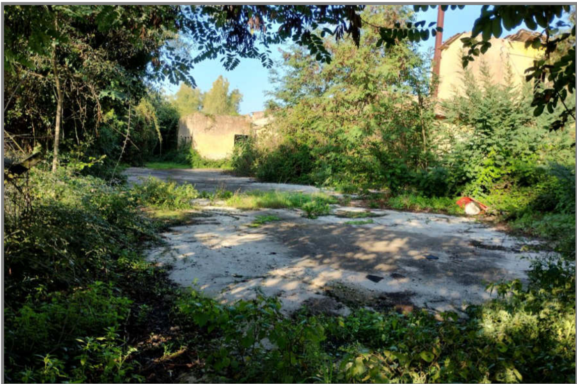
Foto 2 - Piazzale d'ingresso.