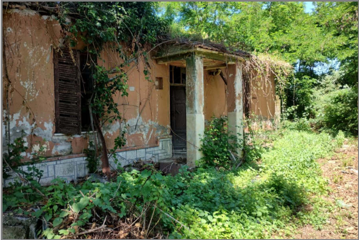
Foto 8 - N.C.E.U. Comune di Cisterna di Latina, foglio 10, p.lla 196, sub. 1.