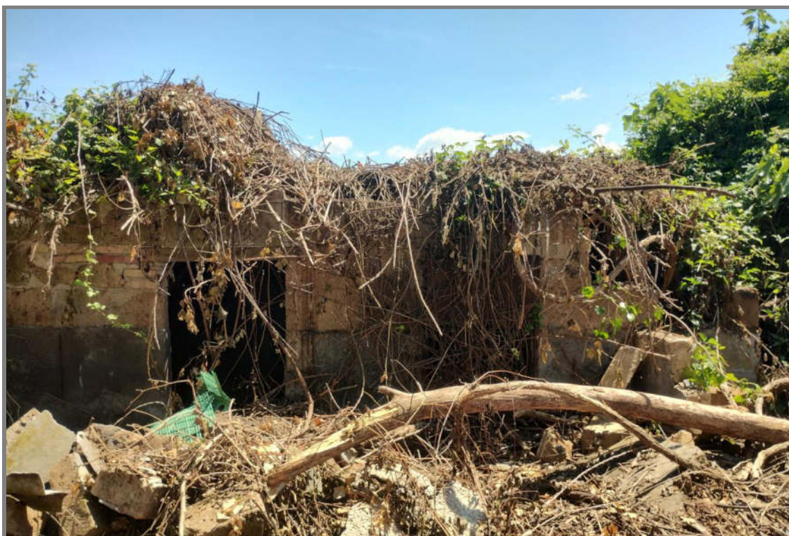
Foto 16 - N.C.E.U. Comune di Cisterna di Latina, foglio 10, p.lla 21, sub. 19.