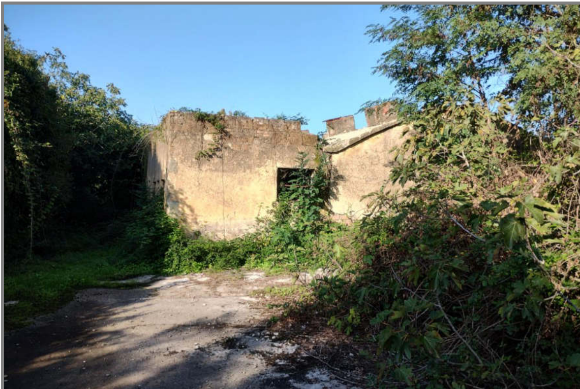
Foto 5 - N.C.E.U. Comune di Cisterna di Latina, foglio 10, p.lla 21, sub. 22.