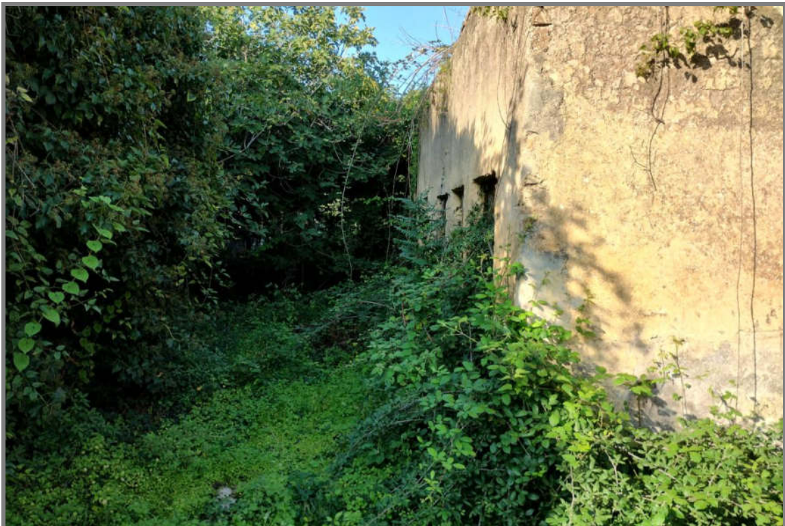
Foto 7 - N.C.E.U. Comune di Cisterna di Latina, foglio 10, p.lla 21, sub. 22.