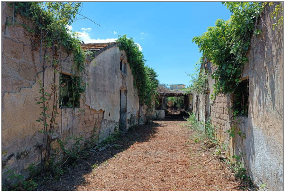
Foto 11 - N.C.E.U. Comune di Cisterna di Latina, foglio 10, p.la 21, sub. 22 e 20.