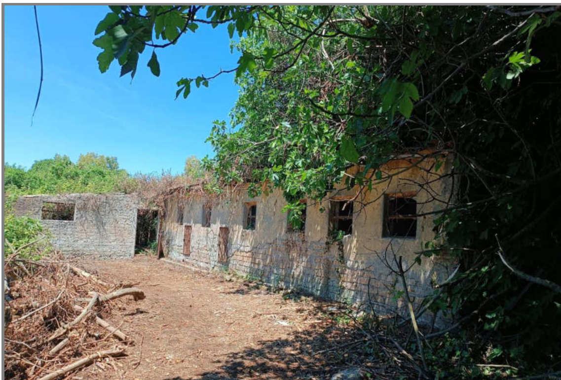
Foto 14 - N.C.E.U. Comune di Cisterna di Latina, foglio 10, p.lla 21, sub. 16 e 15.