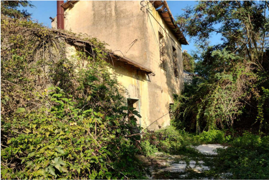
Foto 4 - N.C.E.U. Comune di Cisterna di Latina, foglio 10, p.lla 21, sub. 13.