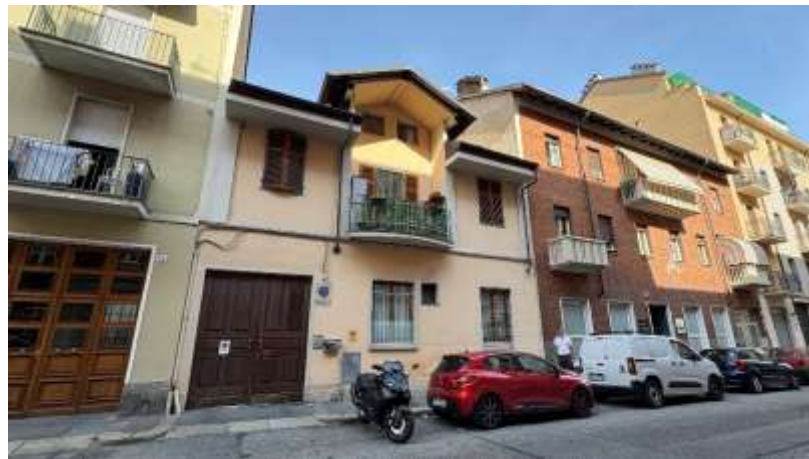
Condominio di via Ceva n.48

Il posto auto esterno è delimitato da segnaletica orizzontale in un cortile pavimentato con autobloccanti.