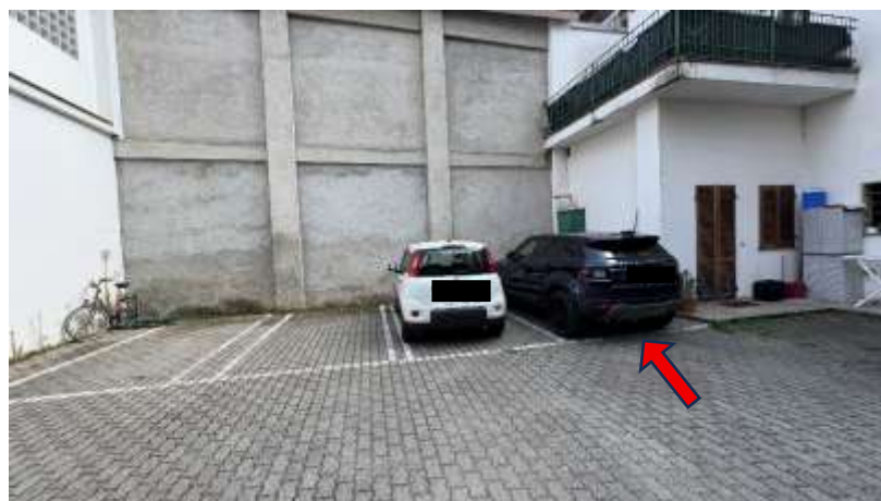
Corte esclusiva interno cortile