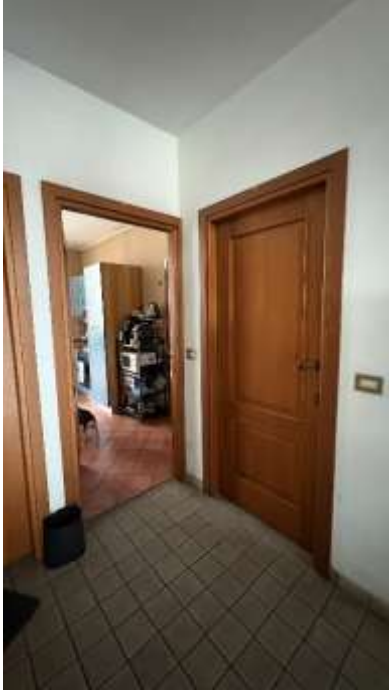
Ingresso da pianerottolo condominiale