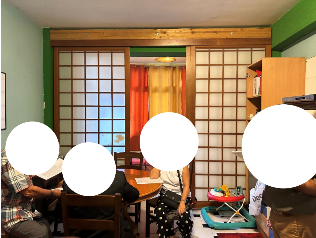
Figura 7 - Soggiorno-angolo cottura