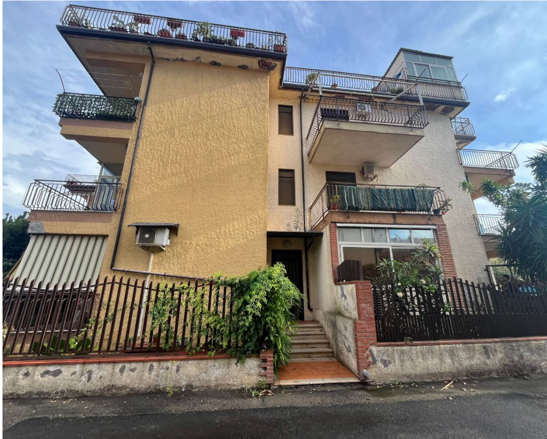
Figura 1 - Prospetto Est e portone di accesso alla scala condominiale