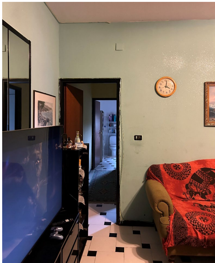
Figura 8 - Corridoio e bagno