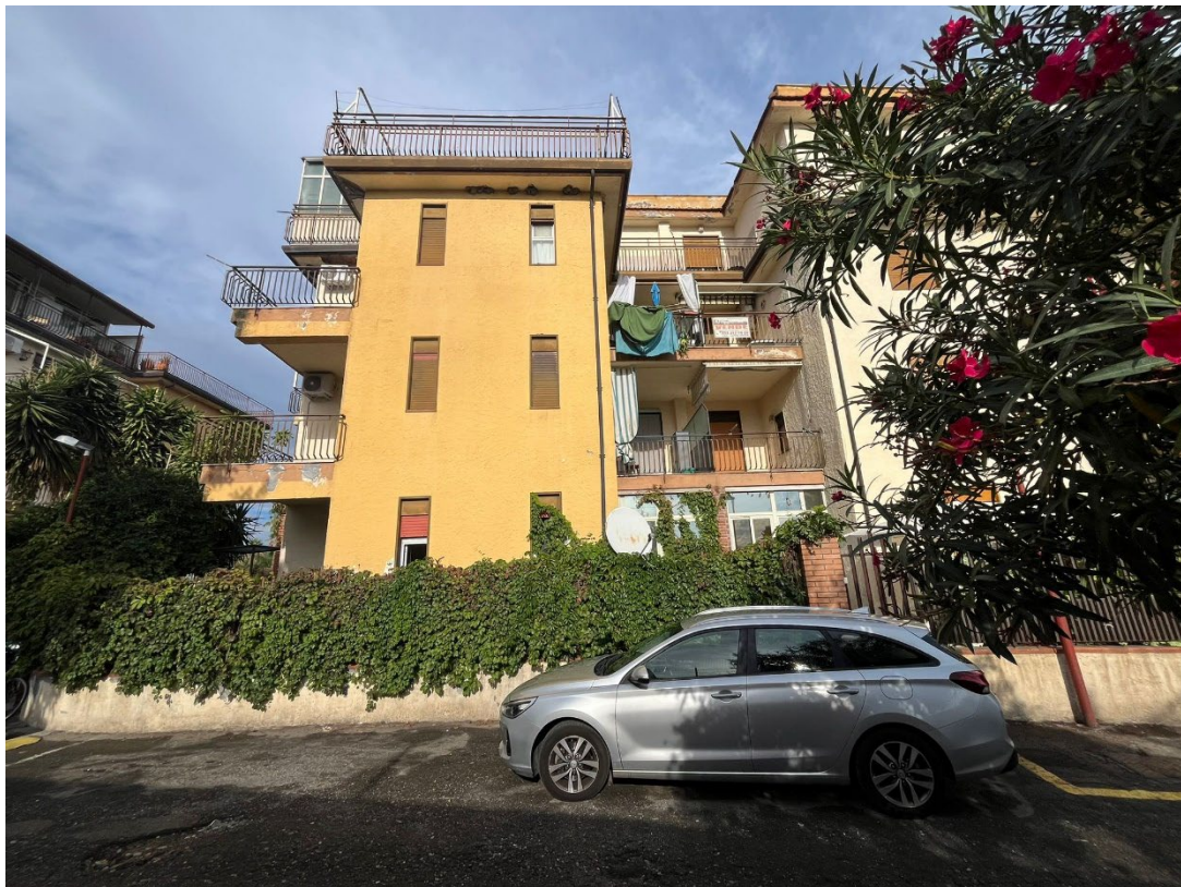
Figura 2 - Prospetto Nord