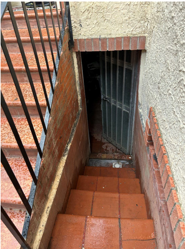
Figura 5 - Scale di accesso sottobalcone