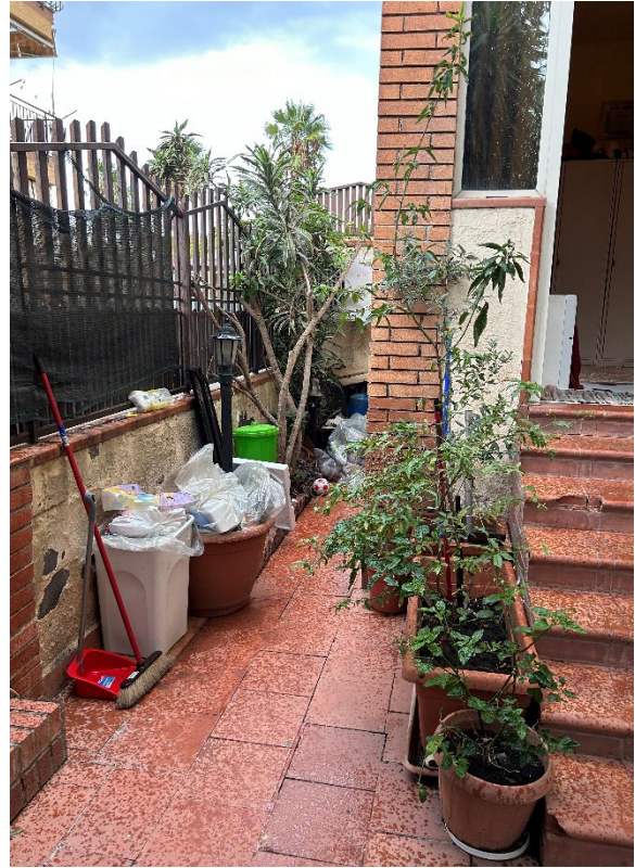
Figura 4 – Corte esterna