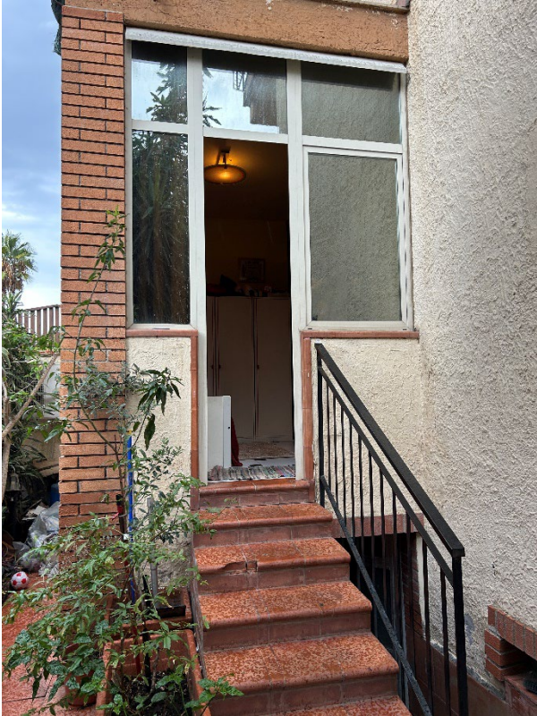
Figura 3- Balcone soggiorno chiuso