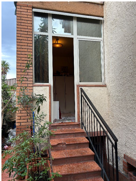
Figura 1 - Balcone chiuso con scale di accesso diretto all'appartamento

Uno dei due balconi allo stato attuale risulta chiuso e nel sottobalcone è stato ricavato un piccolo locale deposito a cui si accede con una scala.