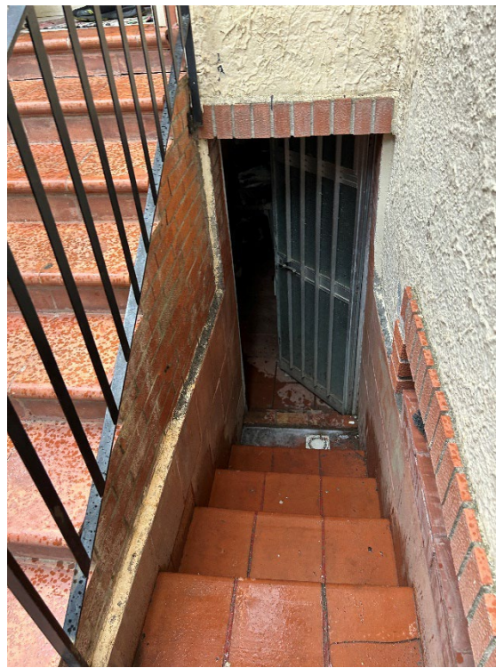
Figura 2 - Sottobalcone in cui è stato ricavato un locale deposito