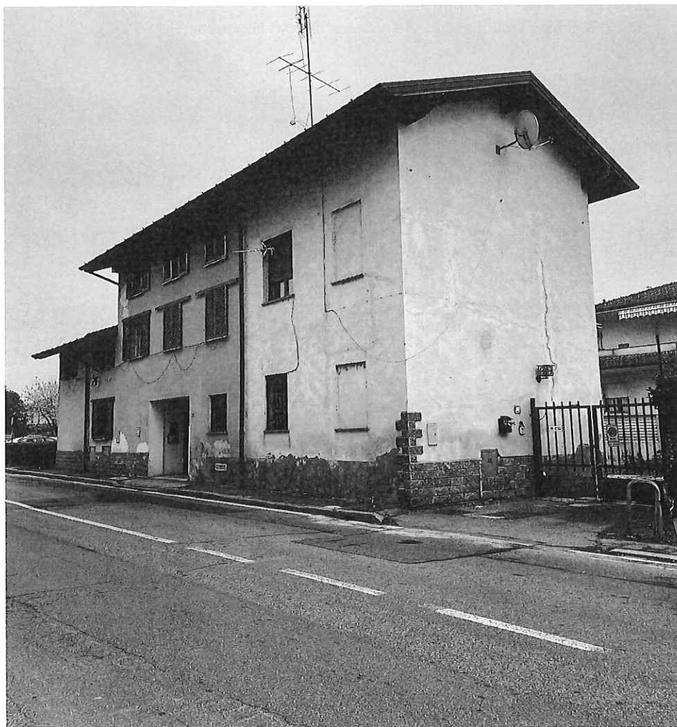
LOTTO UNICO abitazione al piano Terreno e 1°

RELAZIONE DI STIMA IMMOBILIARE LOTTO UNICO CORNAREDO via Rho n. 16/18 CORPO A abitazione