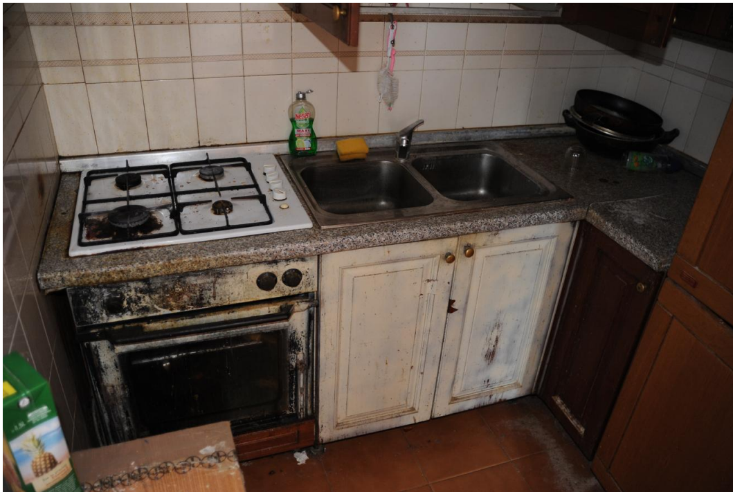
Figura 10 – Cucinotto