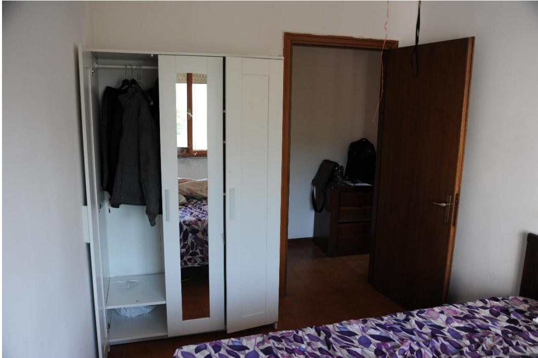
Figura 7 – Camera singola