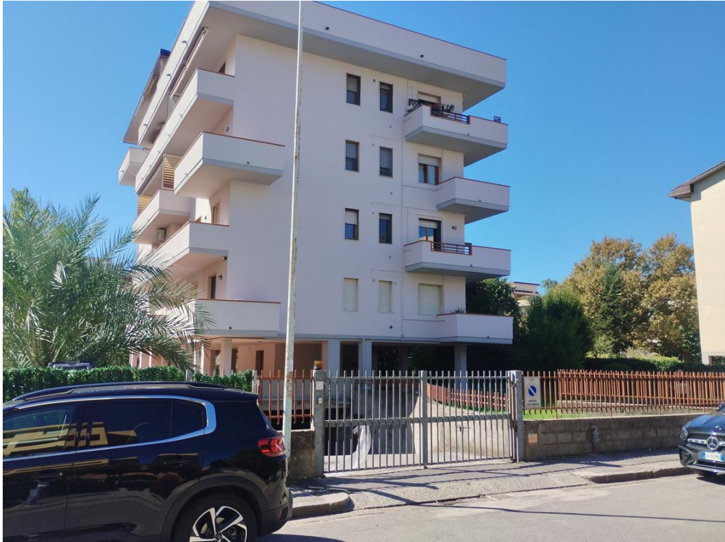
Figura 17 - Ingresso ai garage