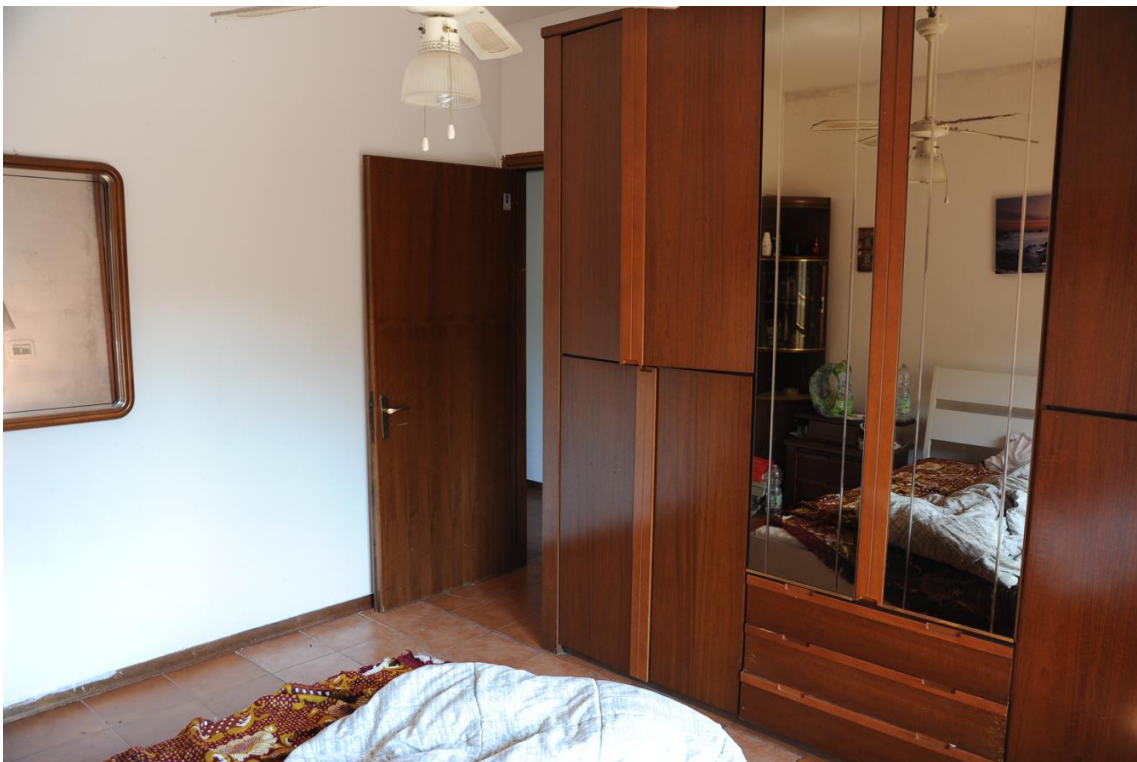
Figura 2 - Camera matrimoniale