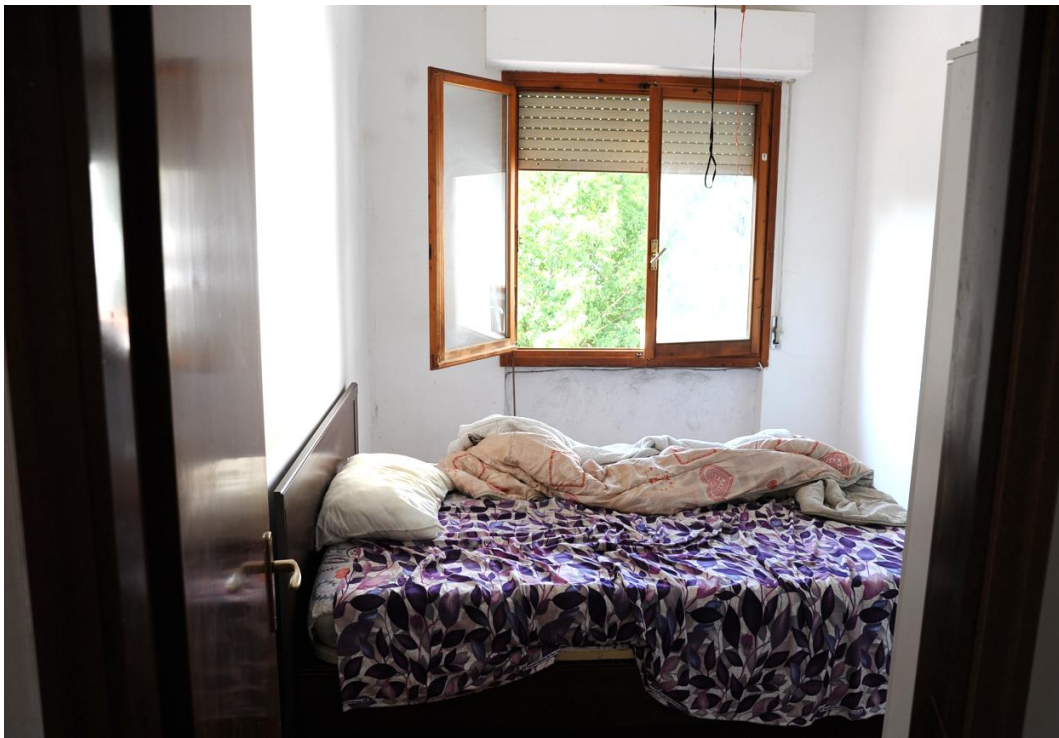
Figura 6 – Camera singola