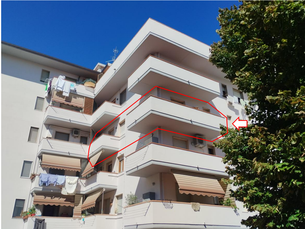
Figura 23 - Fronte dell'edificio