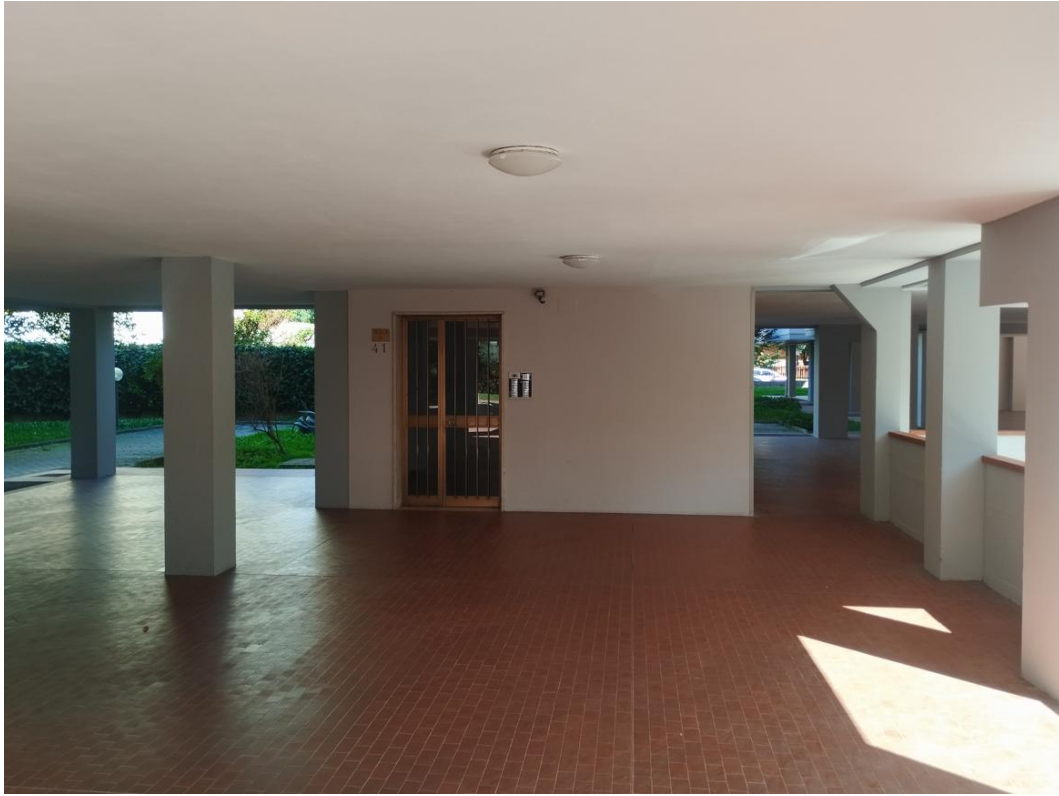
Figura 19 - Ingresso al corpo scala