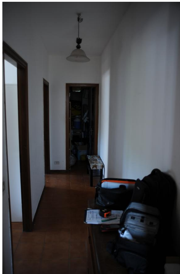
Figura 8 - Corridoio