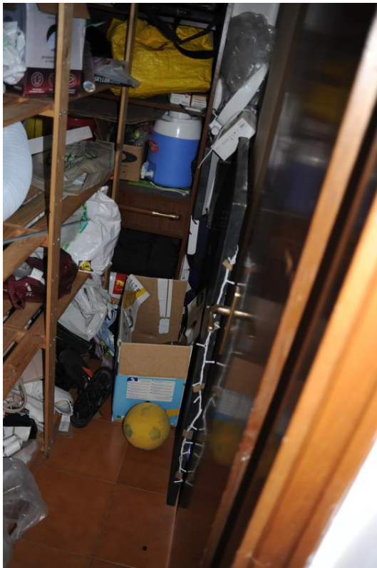
Figura 12 - Ripostiglio