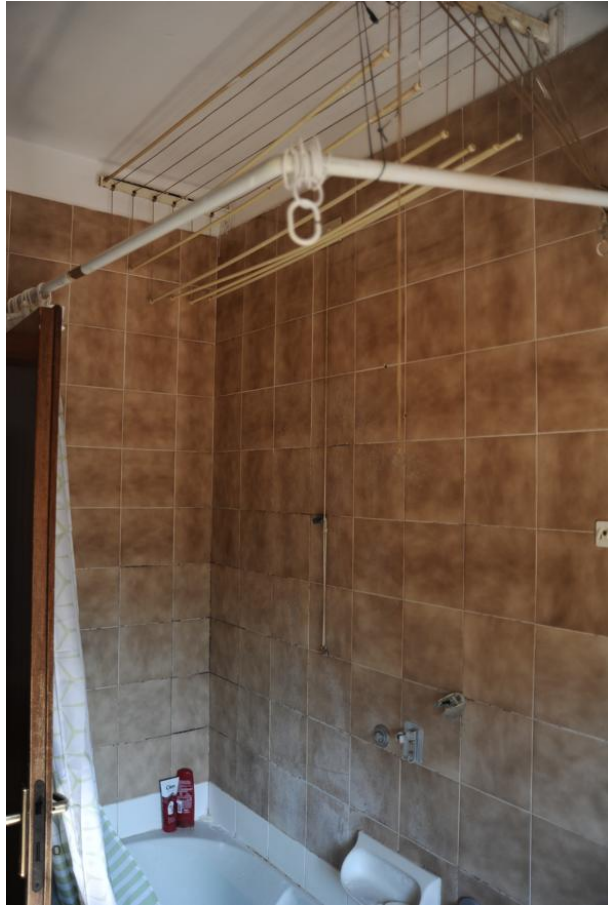
Figura 5 – Bagno