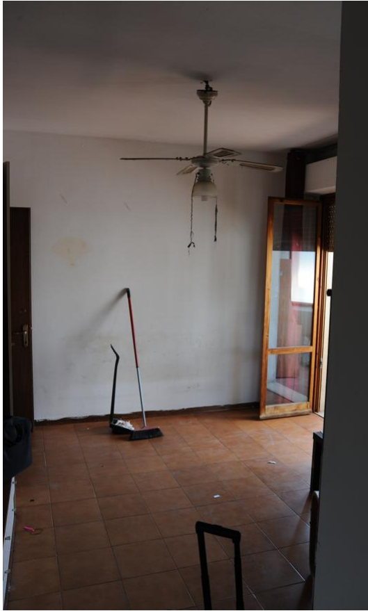
Figura 11- Soggiorno