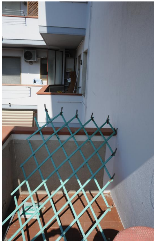
Figura 14 - Terrazza