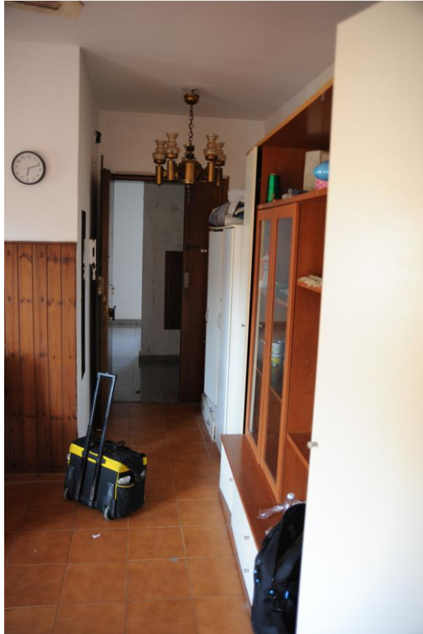
Figura 9 – Ingresso e Soggiorno