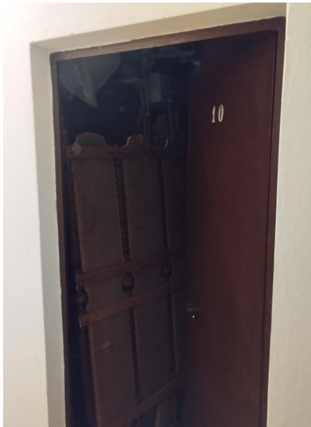
Figura 16 - Cantinetta