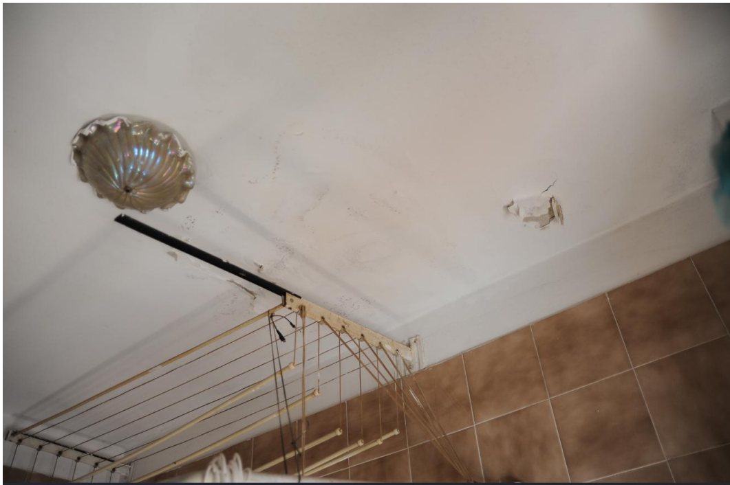
Figura 4 - Bagno