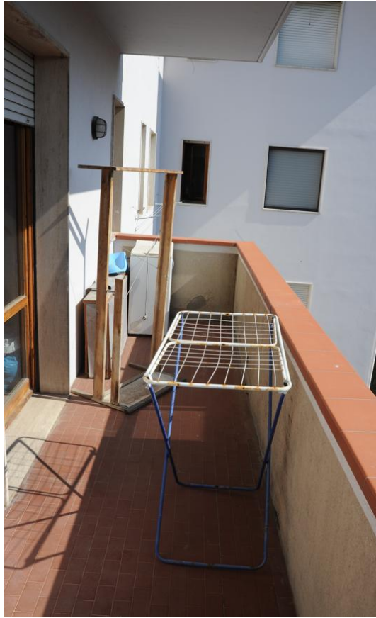
Figura 13 - Terrazza