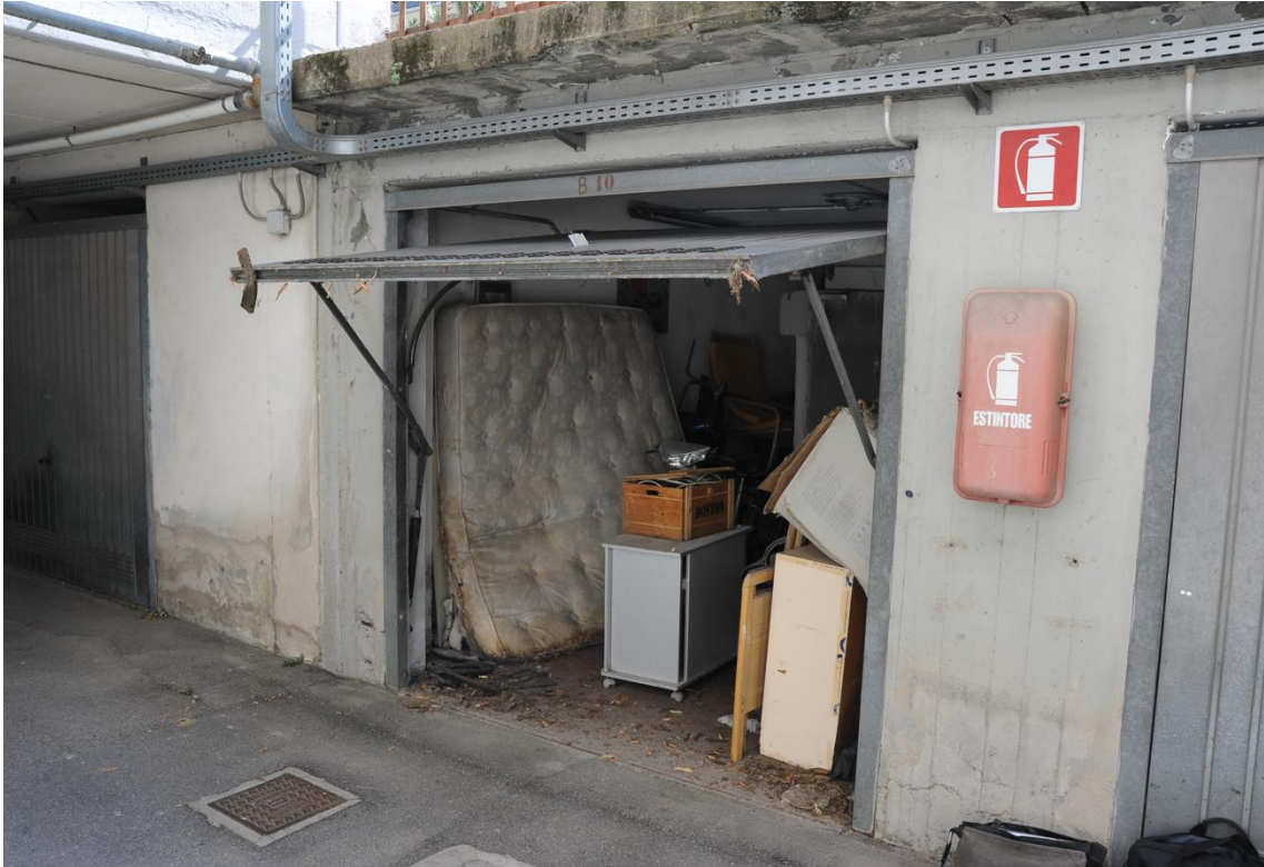
Figura 15 - Garage