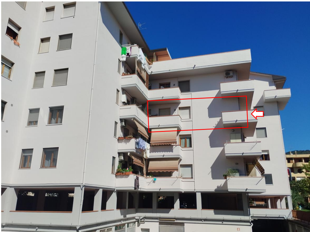
Figura 22 – Fronte dell'edificio