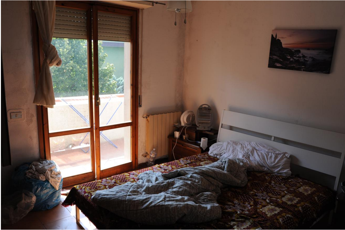
Figura 1 – Camera matrimoniale