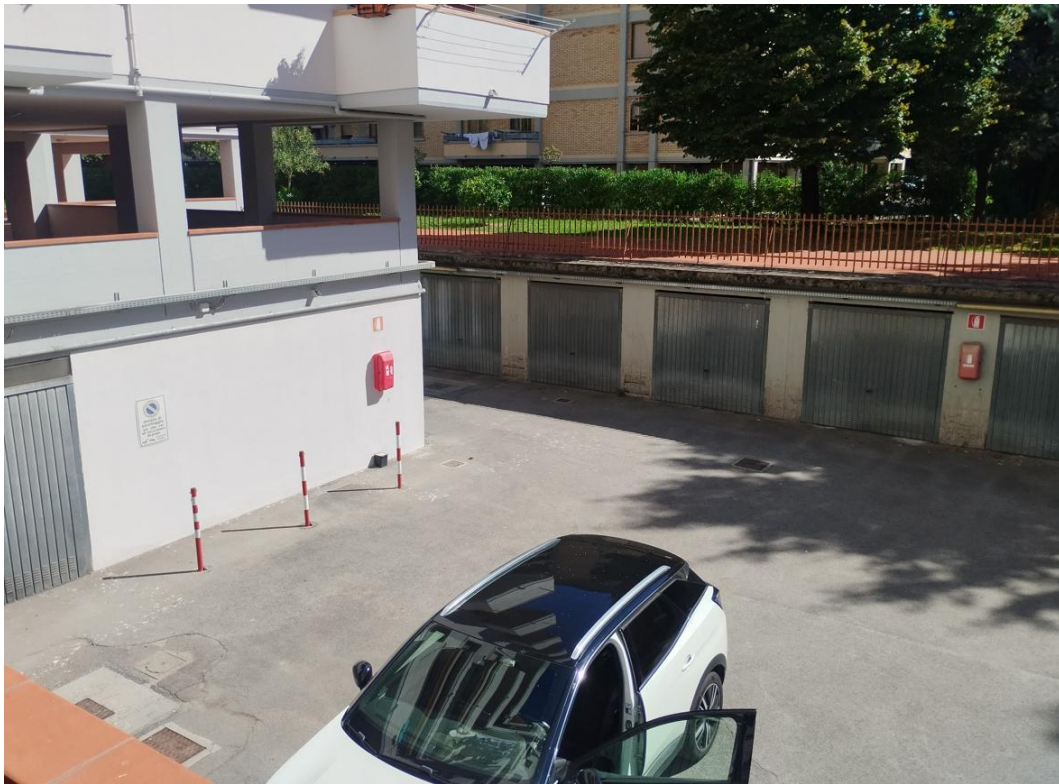
Figura 20 - Zona garage