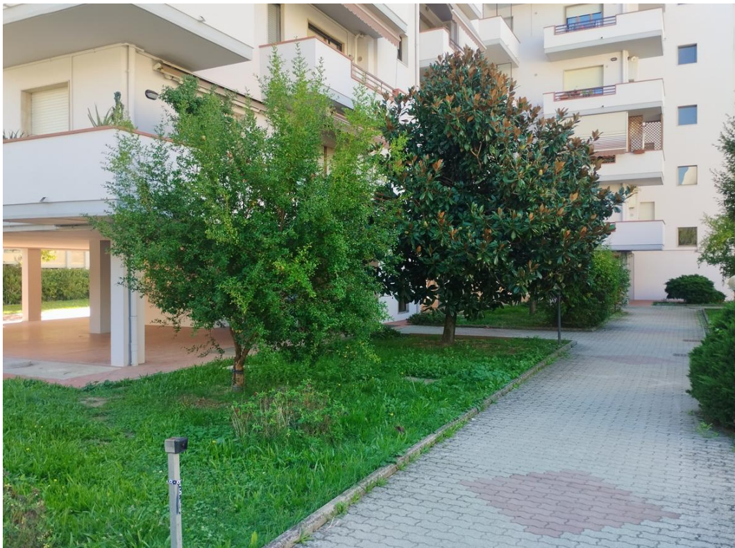
Figura 18 - Vialetto condominiale