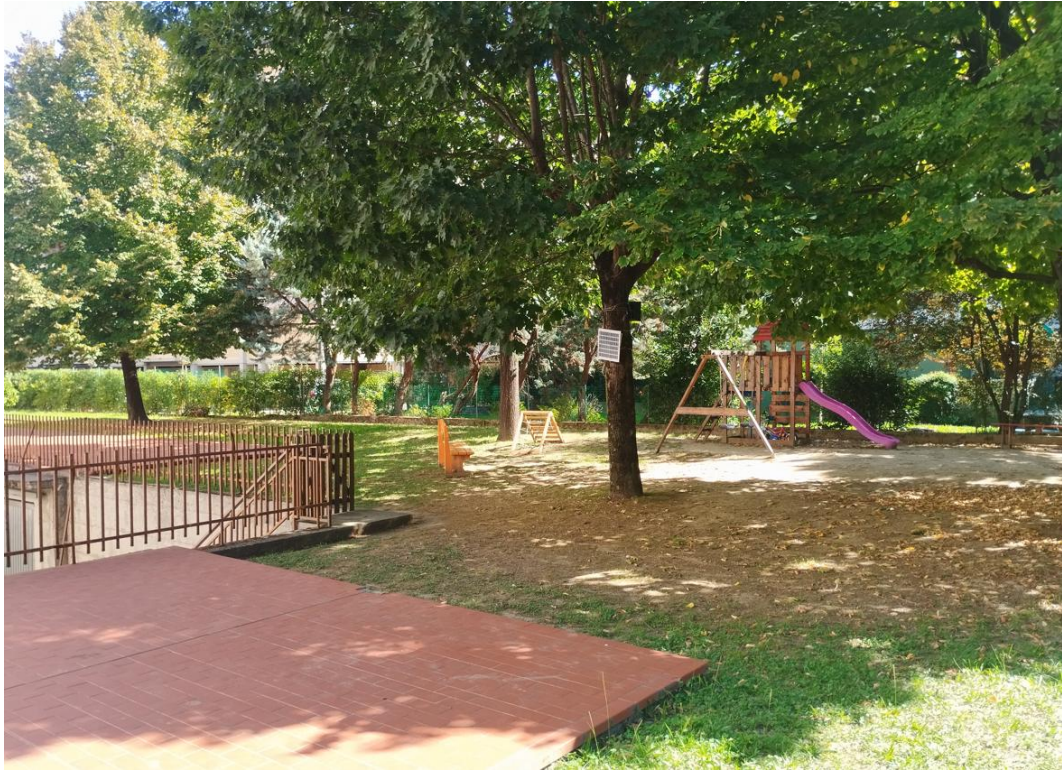
Figura 21 - Giardino condominiale