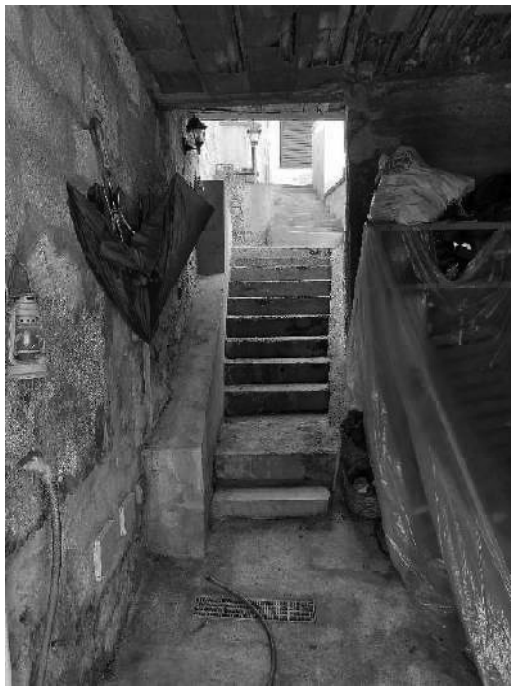
Foto 7, 8 9, 10 e 11) Ingresso al portico garage con vista scalinata sulla corte;