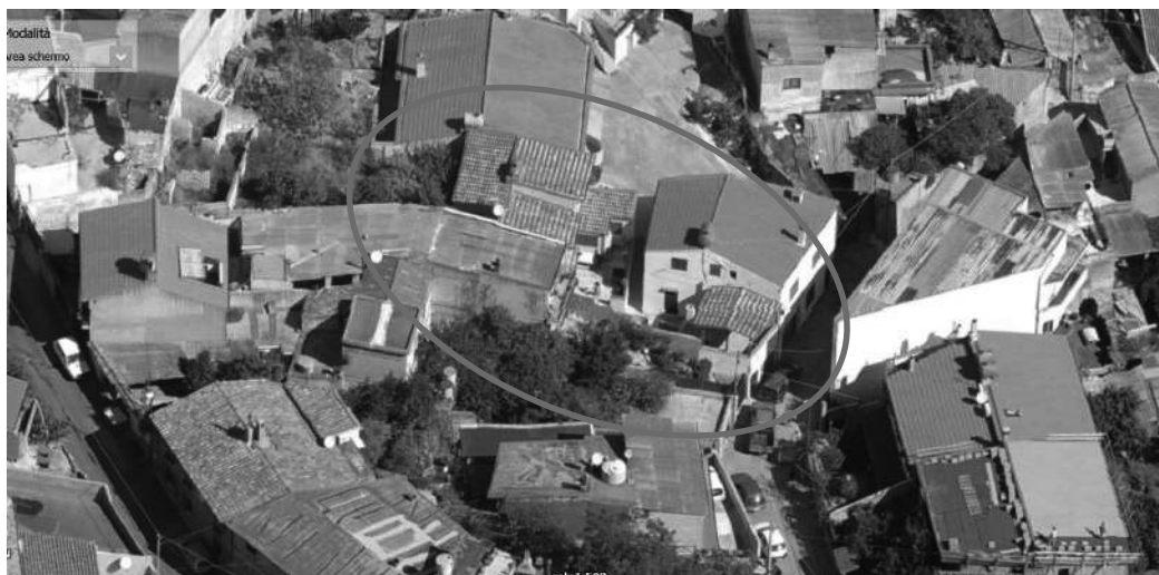
Foto 1, 2, 3 e 4) Foto Oblique Salvate dal Portale delle Foto Aeree della Regione Sardegna