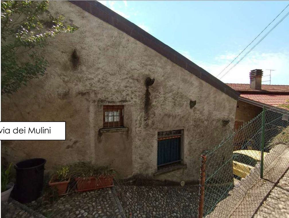
vista nord da via dei Mulini