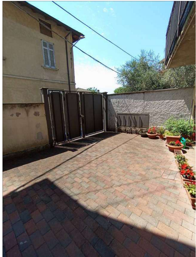
scale e cortile comuni