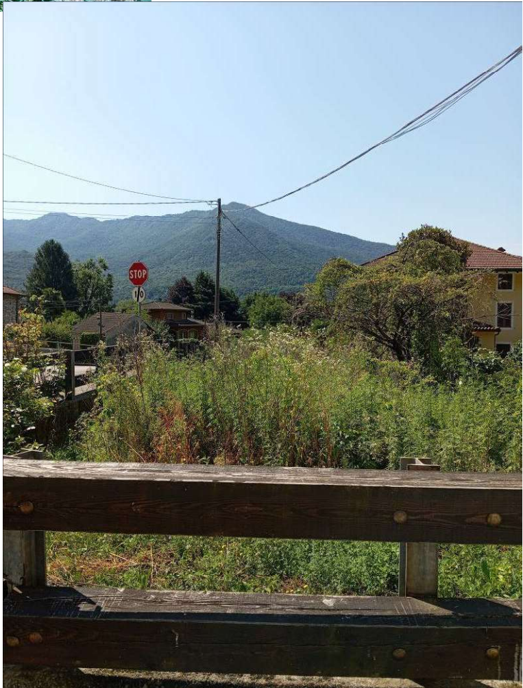
vista terreno da via Roma