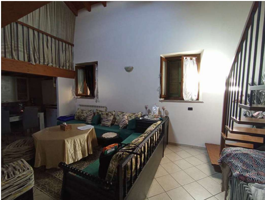
zona cottura e soggiorno/letto