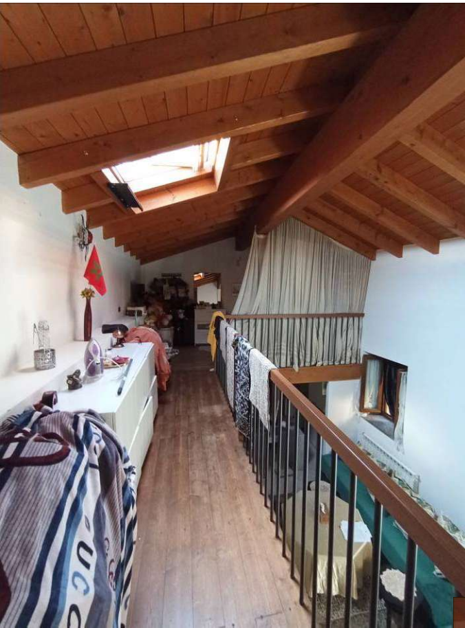
vista del soppalco piano secondo-sottotetto