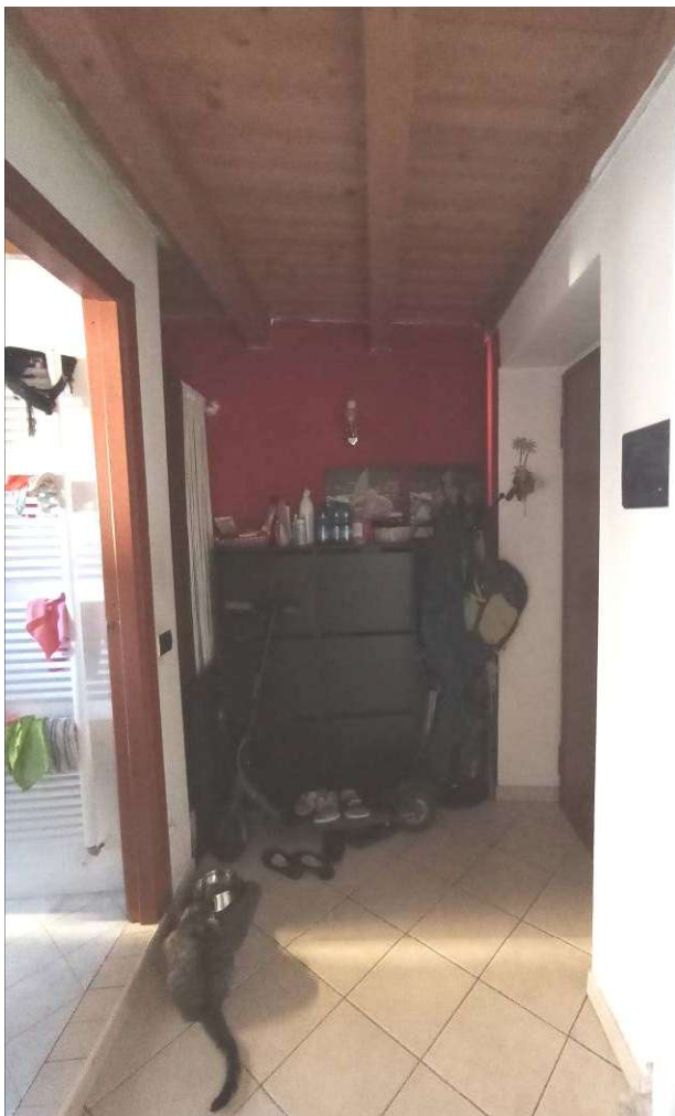
ingresso subalterno 505 piano primo