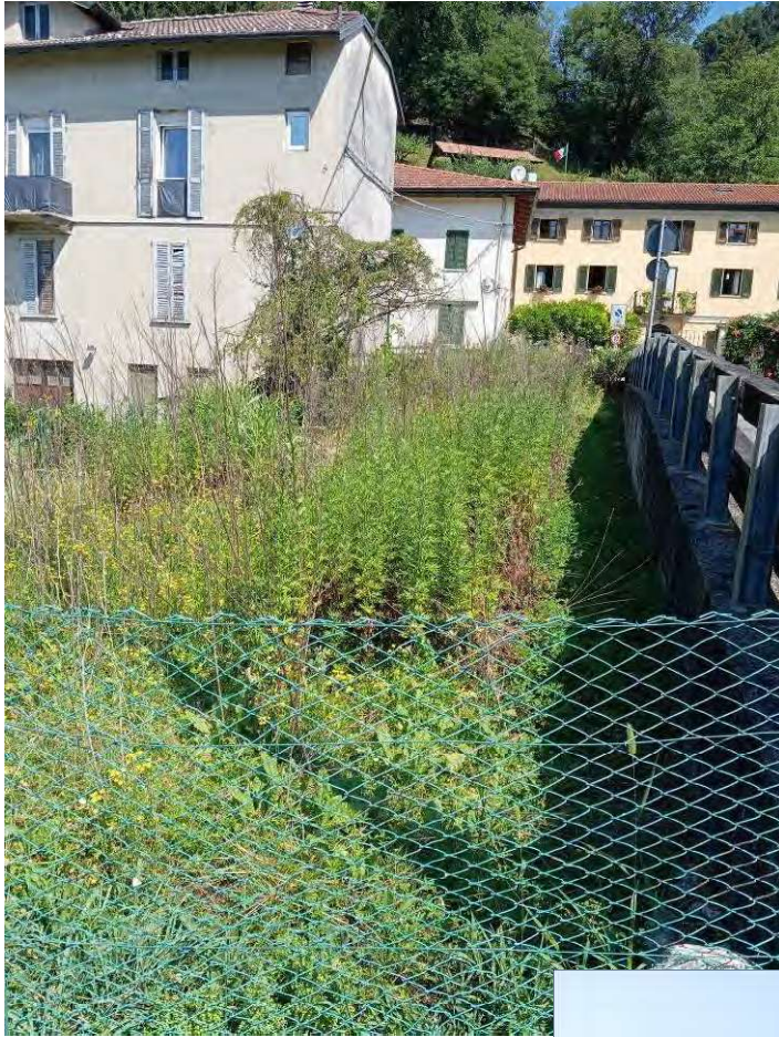
vista terreno da via Arcumeggia