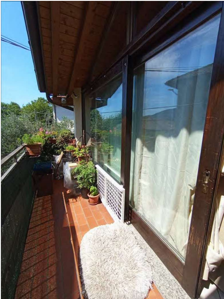
bagno, ripostiglio e balcone