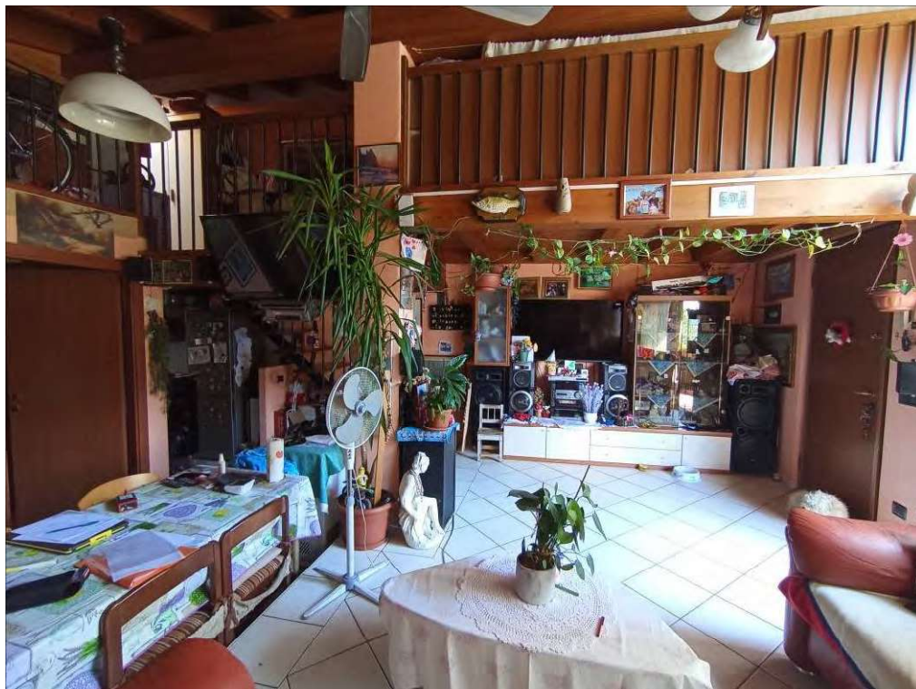
vista piano primo subalterno 504