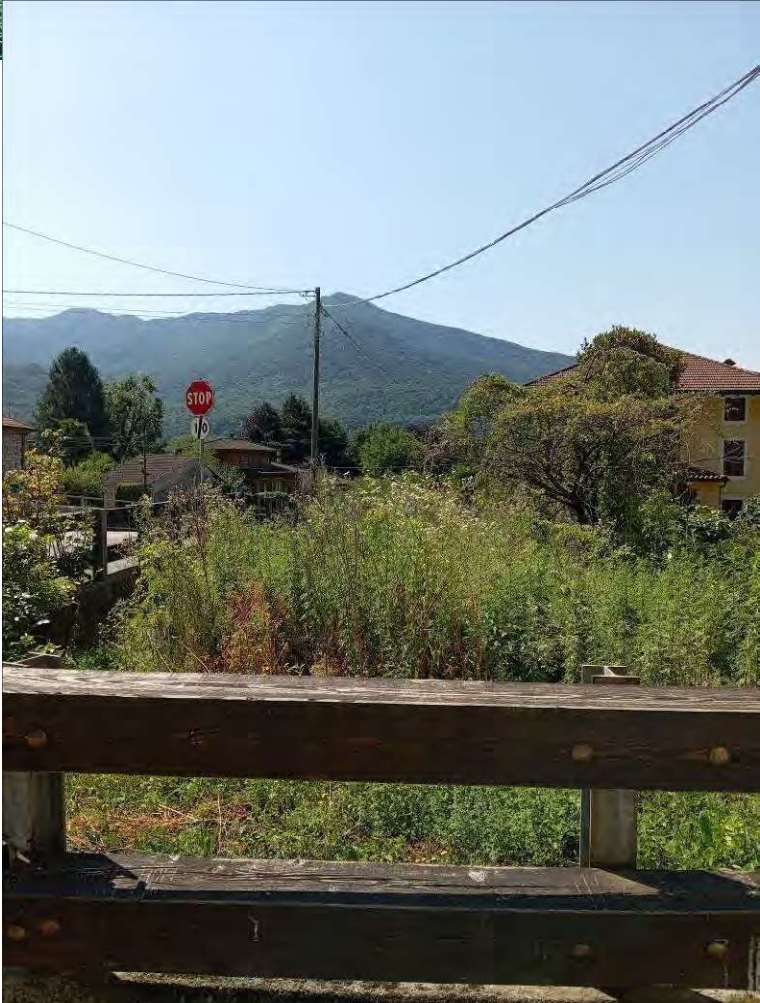
vista terreno da via Roma