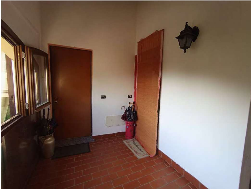
disimpegno comune piano primo