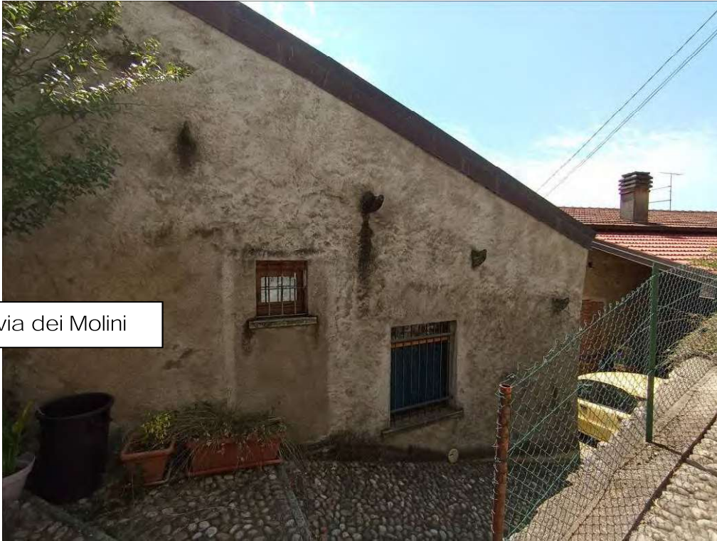
vista nord da via dei Molini