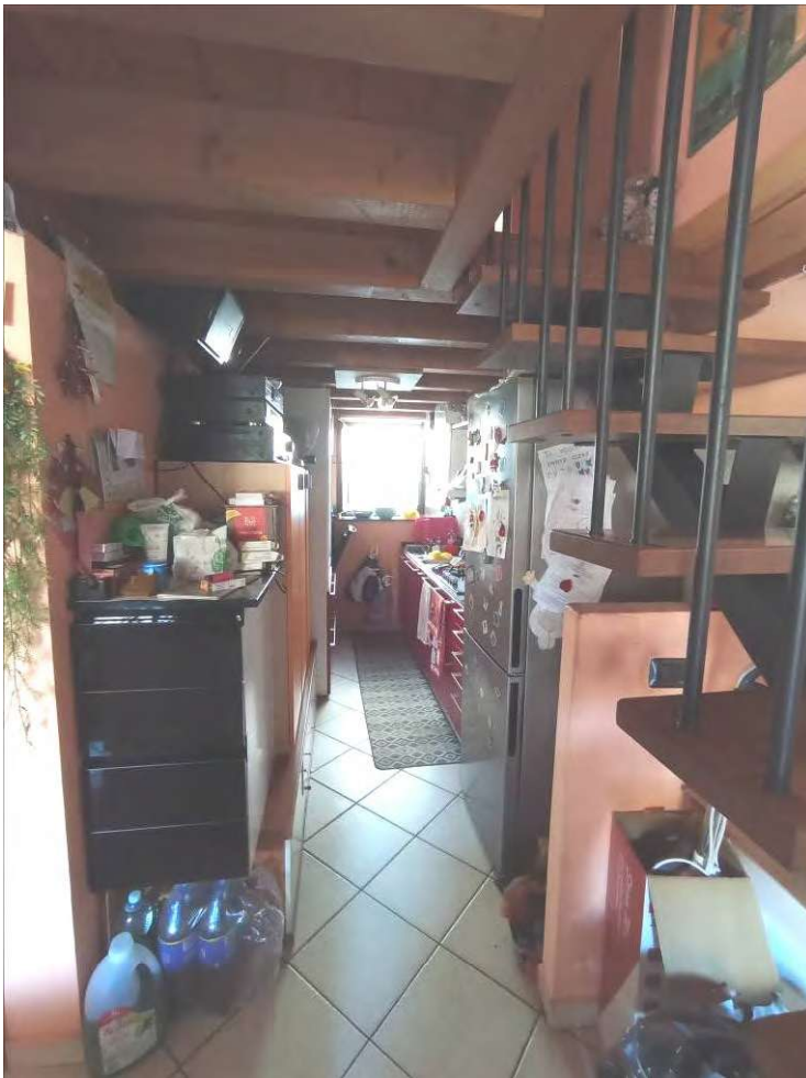
soggiorno/letto e zona cottura