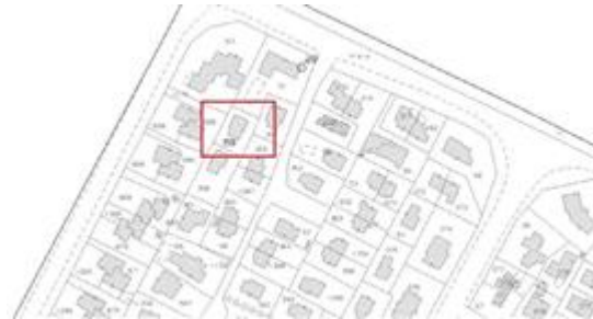
estratto di mappa