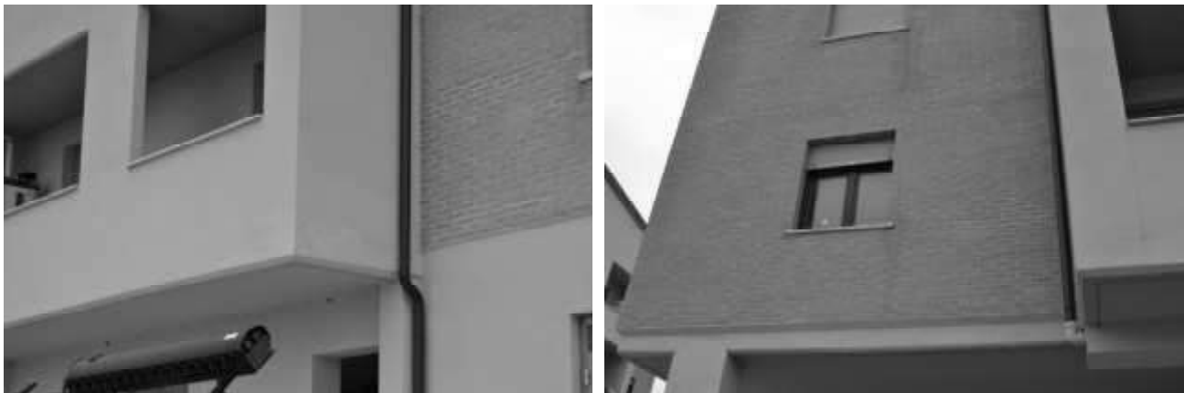
Immagini delle lesioni presenti sull'involucro esterno

Sull'involucro esterno del fabbricato sono presenti danneggiamenti sia delle superfici intonacate che di quelle in mattoni "faccia a vista", come si evince dalle immagini riportate e dalla documentazione fotografica completa in allegato.