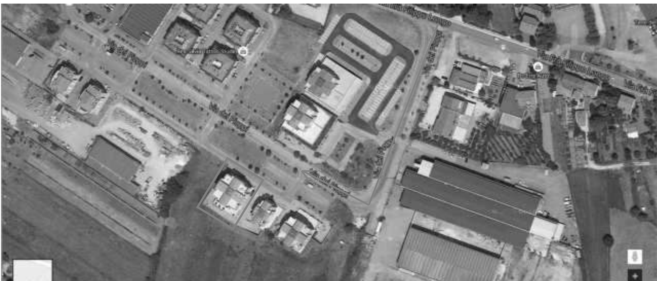
IMMOBILE “C” - Edificio denominato “Intervento n. 5” sito in Via dei Pioppi– Magione (PG)

Il terreno di proprietà di [REDACTED] ricade in un’ampia zona facente parte del Comparto “C11” oggetto del Piano Particolareggiato Esecutivo in Variante al P.R.G. autorizzato con Permesso di Costruire n. PC/06/012 del 17/01/2006 a seguito della costituzione di regolare Convenzione stipulata tra il Comune di Magione e tutti i proprietari dell’area che interessa il Comparto (convenzione stipulata in data 22/06/2005 e registrata a Perugia al n. 4218 in data 08/07/2005). Il terreno di proprietà [REDACTED] è distinto al N.C.T. del Comune di Magione al foglio n. 30 particelle 1735-1733-1734-1732-1765-1768-1767-1764-1779-1769-2572-2564-2570-2578-1774-1773-1775-1777-2560 e al foglio n. 31 particelle 1730-1185-1187-2582 ricadente parte in zona “C11” e parte in zona di rispetto a pertinenza della stessa.