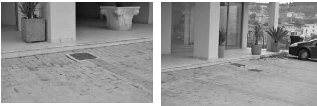
Immagini delle lesioni presenti sull'involucro esterno

Inoltre, sono stati rinvenuti anche avvallamenti della pavimentazione dei parcheggi esterni e distacchi in corrispondenza del marciapiede perimetrale.