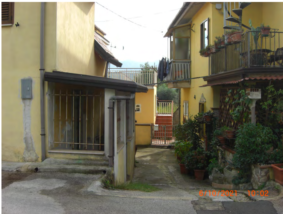
Accesso al comparto