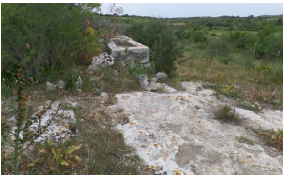
Foto n° 5.9. C.da Piana. Fg. 30, P.lla 107: Cisterna – Fabbricato diruto