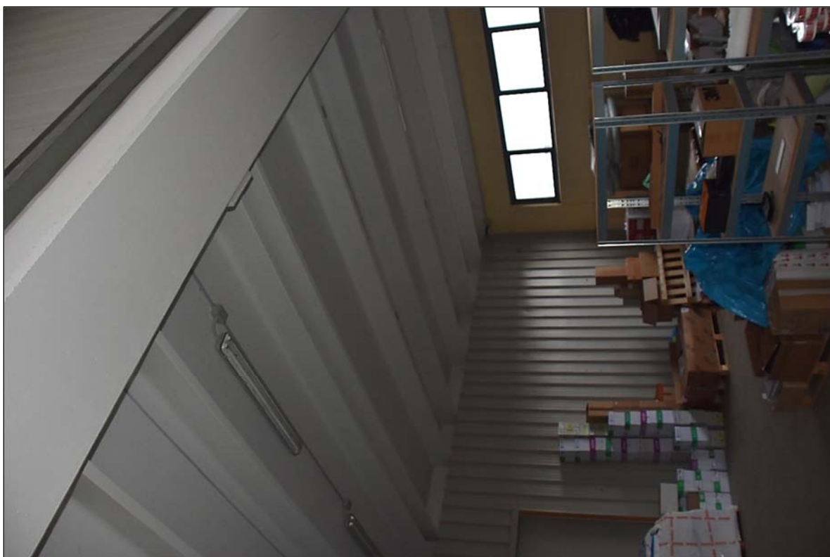
FOTO N. 6: Particolare interno capannone, zona ad altezza m. 4,50