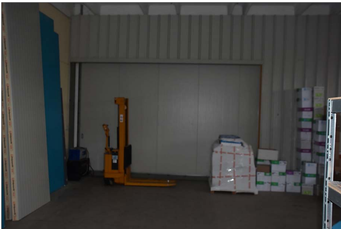
FOTO N. 8: Particolare portone di collegamento con l'unità confinante (sub. 18)