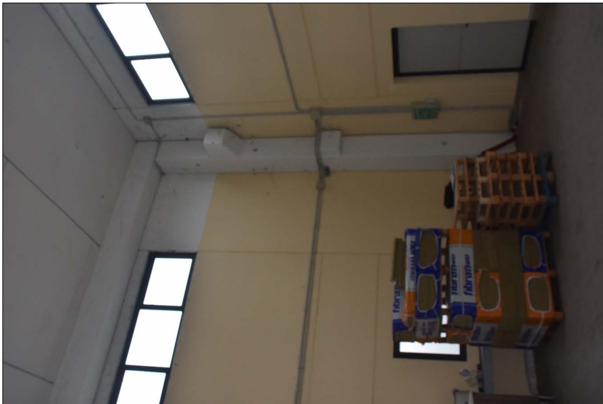
FOTO N. 7: Particolare struttura prefabbricata, zona a doppia altezza