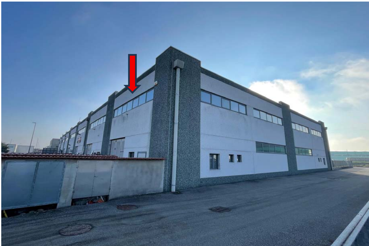
FOTO N. 1: Prospetto fabbricato su Via Reggio Calabria e su area comune sub. 1